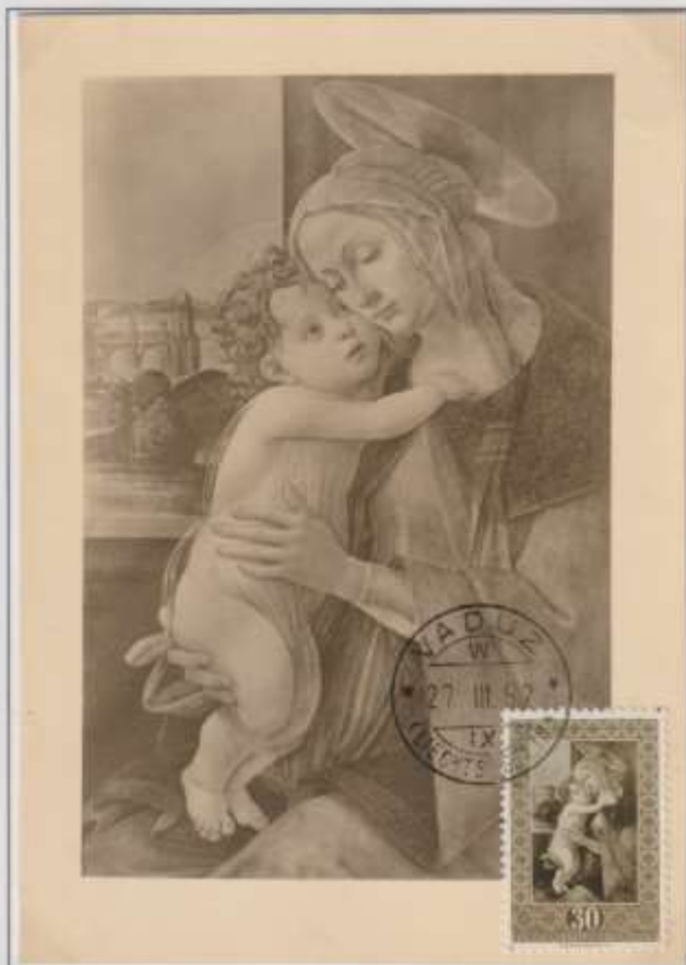
MADONNA CON IL BAMBINO —Opera di Sandro Botticelli (alias Alessandro Filipppepi) Firenze 1445 - 1510) Liechtenstein Gemaldegalerie.