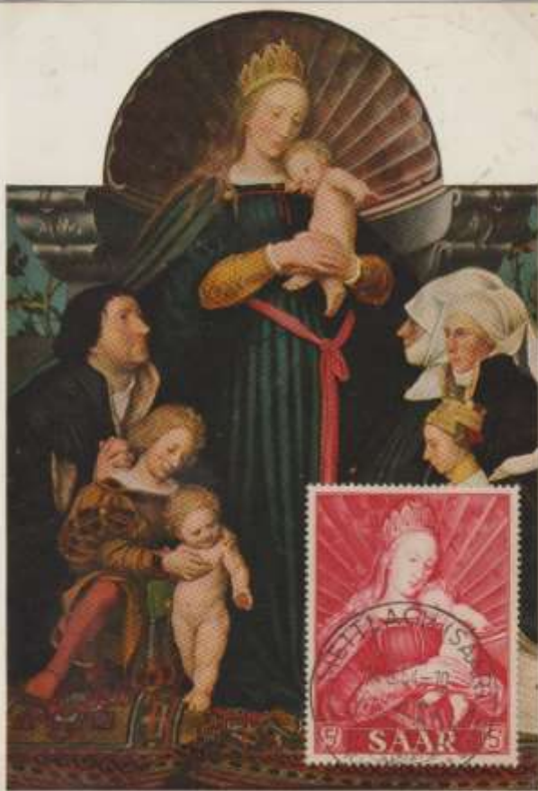
LA MADONNA E LA FAMIGLIA DEL BORGOMASTRO MEYER - Opera di Hans Holbein - 1497 - 1543 - Museo storico di Basilea.