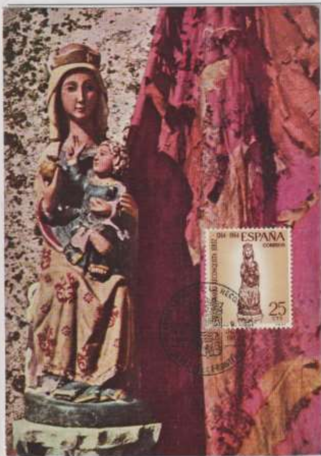
LA VERGINE DI ALCAZAR - Statua. Sec. XII. Patrona della città di Jerez de la Frontera. Spagna.

EMISSIONE - 09/10/1964 Spagna OBLIT - Jerez de la Frontera - Primo giorno Ediz- Industrie grafiche Spagnole.