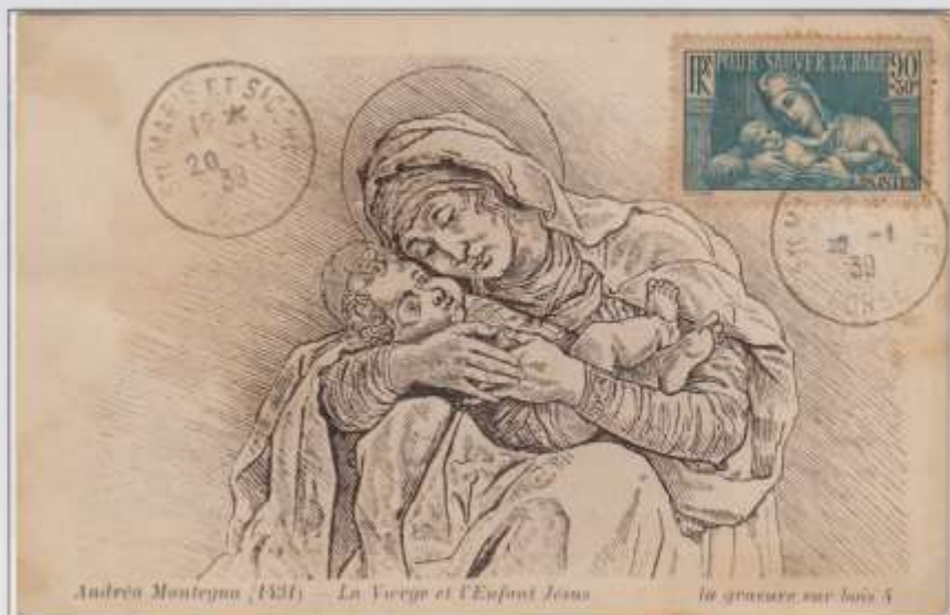
Andrea Mantegna (1431) — La Vierge et l'Enfant Jésus la gravure sur bois 5

EMIS - 20 Gennaio 1939 Francia OBLIT - St. Marie et Sioche 20/01/1939 P.J. Primo giorno Edizione-Anonima