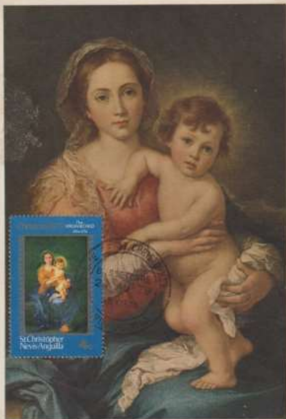
LA VERGINE CON IL FIGLIO - Dipinto di B.E. Murillo 16616 - 1682 - ( Particolare ) Galleria Pitti, Firenze.

EMISSIONE - 1973 San Christopher Nevis. OBLITERAZIONE - Benenierre 26/08/1979 Ediz- ?