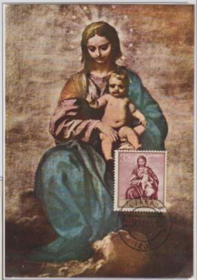
LA VERGINE E IL BAMBINO- Dipinto di Gerard David - 1450 - 1523 - Kunstmuseum, Berlino.

EMISSIONE- 24/03/1969 Spagna OBLITERAZIONE- Granada - Primo giorno Ediz- Industrie Grafiche Spagnole.