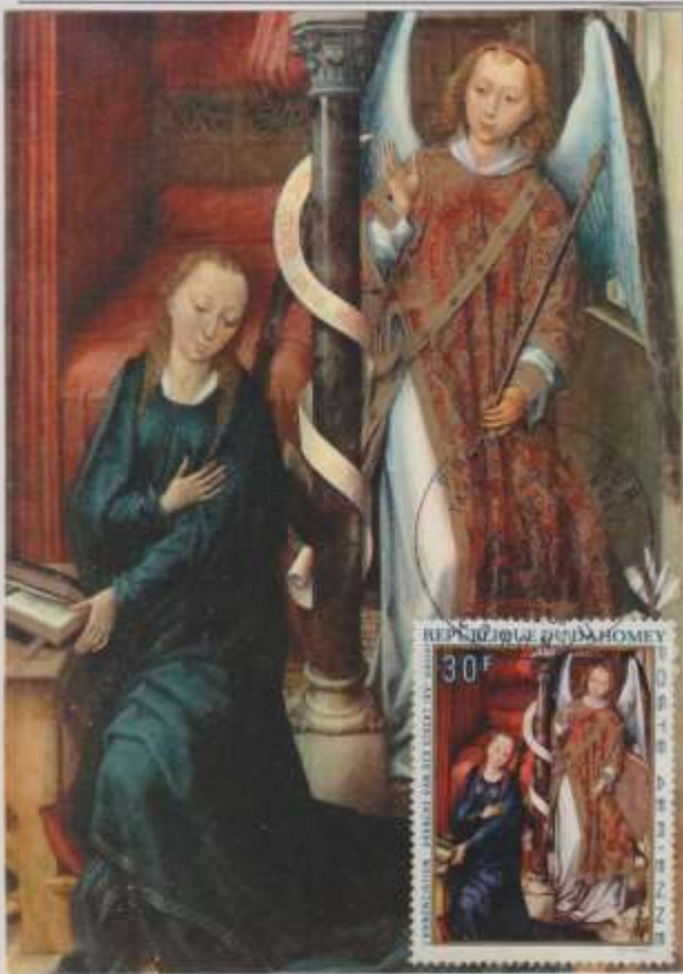
L'ANNUNCIAZIONE- Dipinto, opera di Vander Stock- Museo di Digione. Francia.

EMISSIONE- 20/12/1969 Republique du Dahomey. OBLITERAZIONE- Cotonou – Primo giorno Ediz- Abbaye d'Encalcat. Tarn.