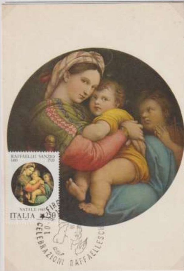
LA MADONNA DELLA SEGGIOLA - Dipinto, opera di Raffaello Sanzio - 1483 - 1520 - Galleria degli Uffizi, Firenze.