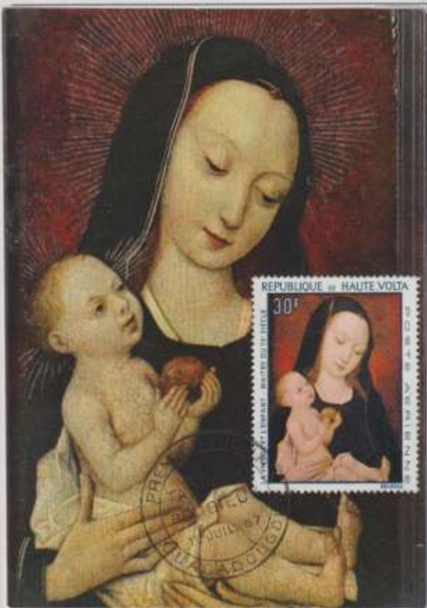
LA VERGINE E IL BAMBINO- Dipinto, opera dei maestri detti " DELLA LEGGENDA DI MARIA MADALENA " XV° Sec.-Museo de Louvre-Parigi.

EMISSIONE- 01/07/1967 Alto Volta. OBLITERAZIONE- Ouagadougou Primo giorno Ediz- Abbaye d'Encalcat. (F)