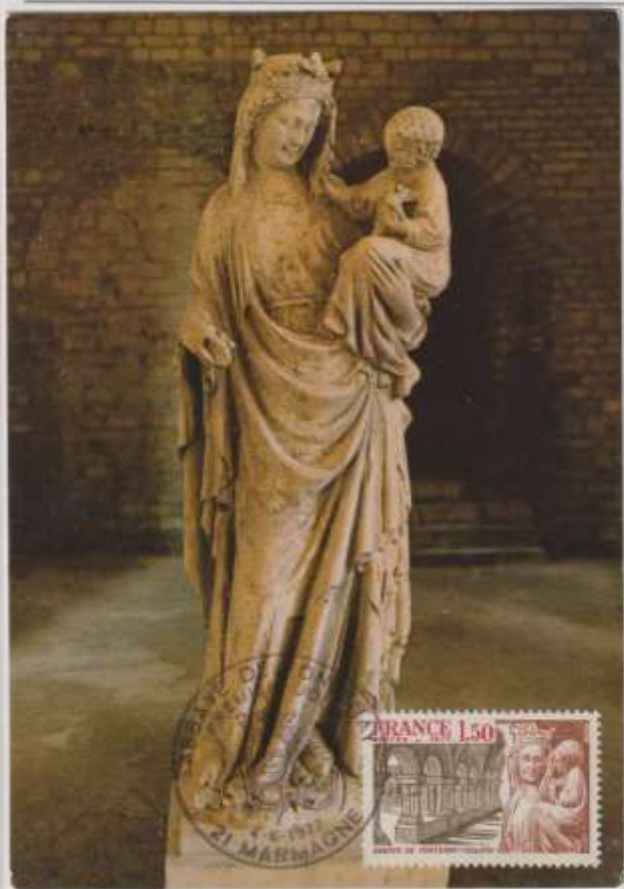
LA MADONNA DI FONTENAY- Statua posta all'interno dell'Abbazia di Fontenay. Sec. XIII. Francia.

EMISSIONE- 04/06/1977 Francia OBLITERAZIONE- Marmagne – Primo giorno Ediz- PL. Lefevre.