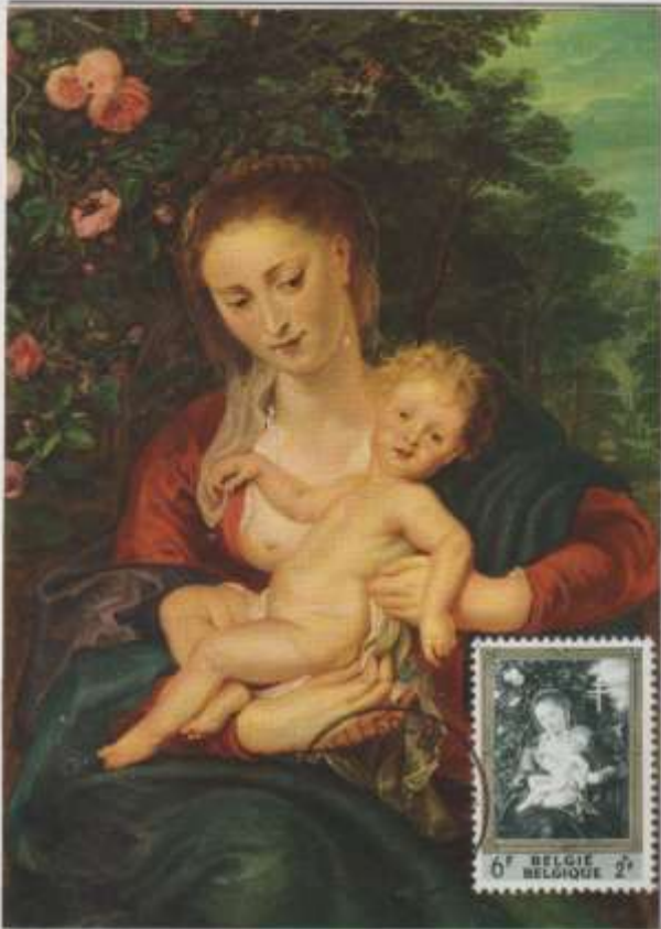
LA MADONNA TRA I NON TI SCORDAR DI ME- Dipinto, opera di P. Paul Rubens - 1577 - 1640 - Museo Reale delle belle Arti di Bruxelles.

EMISSIONE- 02/12/1961 Belgio OBLITERAZIONE- Bruxelles - Primo giorno Ediz- Corten. Belgio.