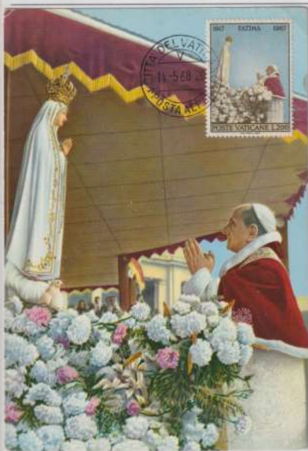
A fianco CM. raffigurante la statua della Madonna di Fatima (P), dentro la nicchia originale posta nella Basilica.

EMISSIONE - 13/05/1968 Portogallo OBLITERAZIONE - Fatima - Primo giorno Ediz - C.C. Porto.