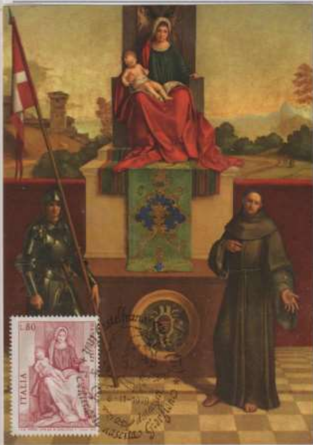
MADONNA E I SANTI LIBRALE E FRANCESCO - Dipinto, opera di Giorgio Barbarella ( detto il Giorgione ) 1478 - 1510 - Duomo di Castelfranco Veneto.

EMISSIONE - 08/11/1978 Italia OBLITERAZIONE - Castelfranco V. - Primo giorno Ediz- Grafiche Trevisan.Castelfranco.