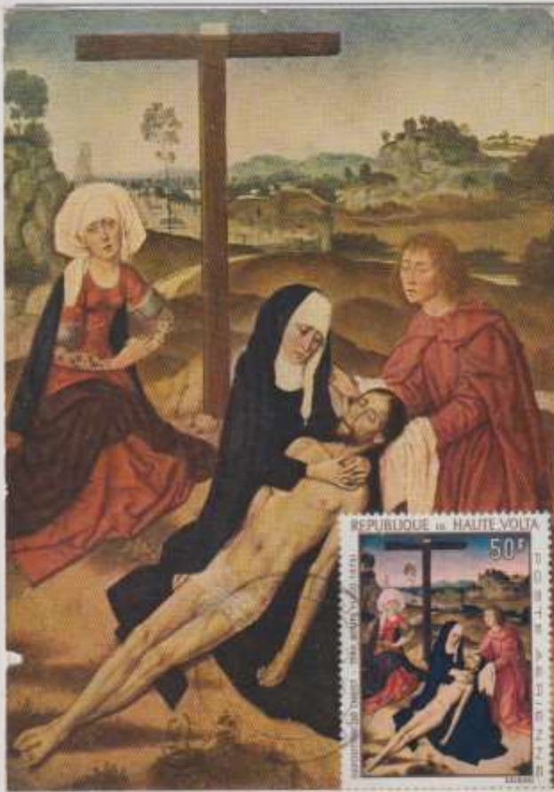
LA PIETA' - Dipinto di Dirk Bouts - 1420 - 1475 - Scuola fiamminga, Museo de Louvre, Parigi.

EMISSIONE- 10/07/1967 Haute Volta OBLITERAZIONE- Dungadougou - Primo giorno Ediz- Nomis, Parigi..