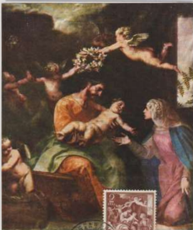
LA SACRA FAMIGLIA- Dipinto di Alonso Cano - 1601 - 1667 - Museo del Prado. Madrid.

EMISSIONE- 24/03/1969 Spagna OBLITERAZIONE- Granada - Primo giorno Ediz- Industria grafica spagnola.