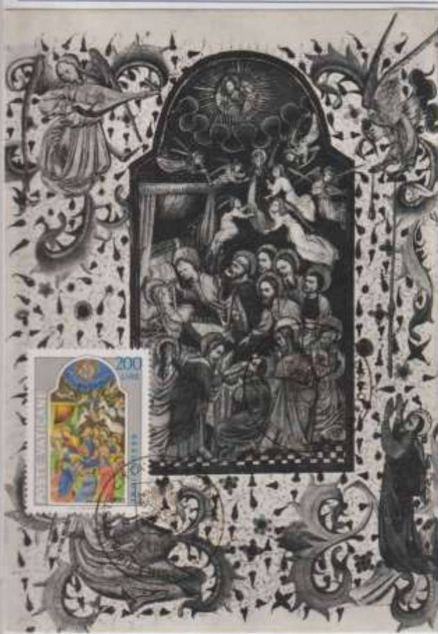
LA VERGINE ASSUNTA IN CIELO IN UN VOLO DI ANGELI- Miniatura del breviario di Mattia Corvino. Biblioteca Apostolica Vaticana.

EMISSIONE- 04/07/1977 Città del Vaticano OBLIT- Città del Vaticano – Primo giorno Ediz- Biblioteca Apostolica Vaticana.