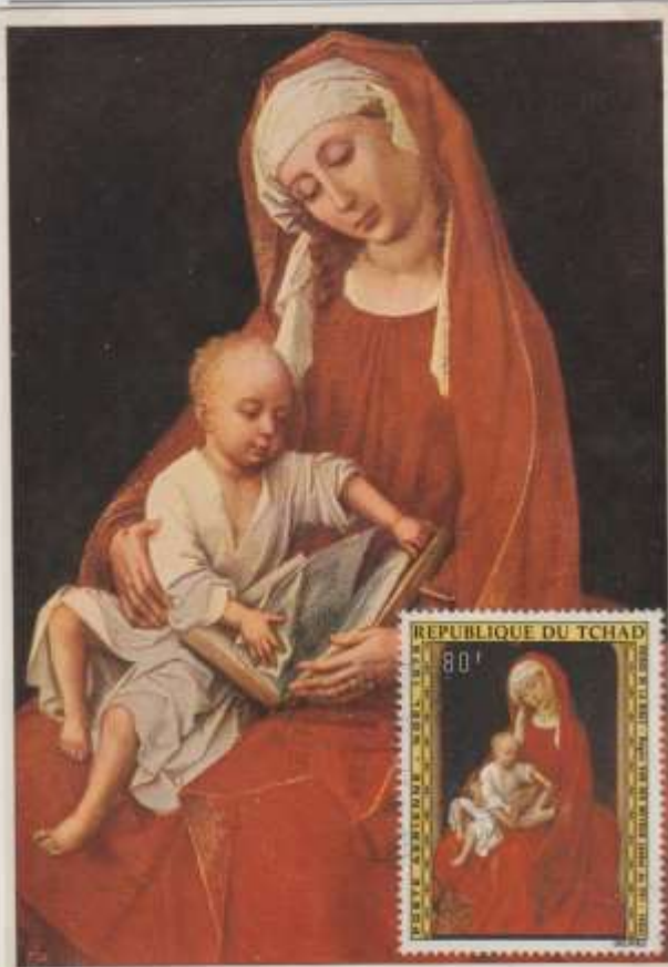
LA MADONNA DELLA BIBBIA - Dipinto di Roger Van der Wayden - 1400 - 1464 - Museo del Prado, Madrid.

EMISSIONE - 15/17/1976 Tchad OBLITERAZIONE - D'Isdamena 15/12/1976 Primo giorno Ediz- Buch.