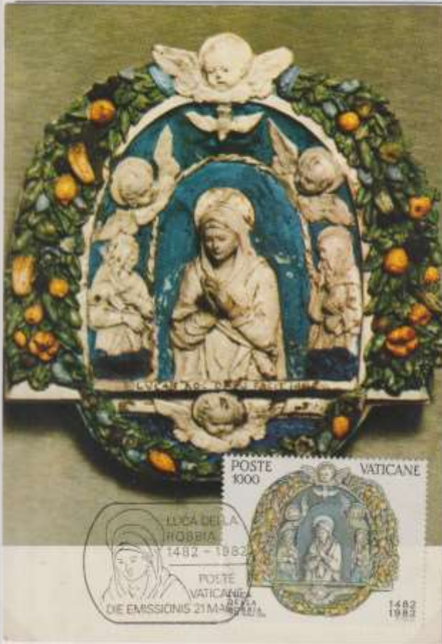
LA VERGINE MARIA IN PREGHIERA- Opera in terracotta di Luca della Robbia - 13399 - 1482 - Istituto d'Arte di Detroit.

EMISSIONE- 21/05/1982 Città del Vaticano OBLITERAZIONE- Città del Vaticano Primo giorno - 3 Concordanze Ediz- Uned.