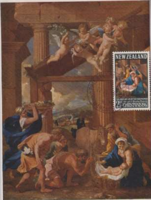
ADORAZIONE DEI MAGI - Dipinto, opera di Poussion Nicholas -1594 – 1665 – National Gallery.

EMISSIONE - 1967 Nuova Zelanda. OBLITERAZIONE - Wanganui 22/01/1975 Ediz- Stone & Sons (GB)