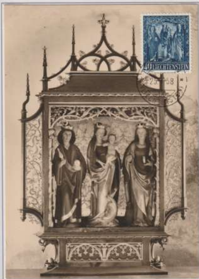
LA MADONNA DI ST. MEMERT -Scultura. Trittico posto sull'altare della Chiesa di St. Memert nel Liechtenstein.

EMISSIONE - 16/12/1957 Liechtenstein OBLITERAZIONE - Vaduz 25/01/1958 Ediz- Peter Ospelt.Liechtenstein.