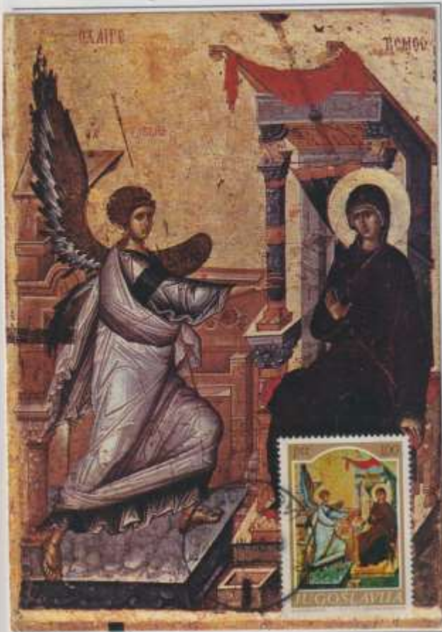
L'ANNUNCIAZIONE- Dipinto, opera di Martin Schönerer. Museo Unterlinden. Colmar.

EMISSIONE- 23/12/1974 Republique du Daomey. OBLITERAZIONE- Cotonou – Primo giorno. Ediz- Braun.