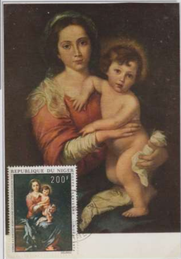
MADONNA CON IL BAMBINO- Dipinto di E. Murillo - 1616-1682- Galleria Pitti. Firenze.

EMISSIONE- 24/12/1974 Niger. OBLITERAZIONE- Niame Primo giorno Ediz-Abbaye d'Encalcat. (F)