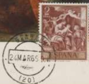
LA SACRA FAMIGLIA- Scultura, opera di Alonso Berruguete - 1489 - 1561 - Spagna. Museo del Prado. Madrid.

EMISSIONE- 24/03/1969 Spagna OBLITERAZIONE- Granada - Primo giorno Ediz- Industria grafica spagnola.