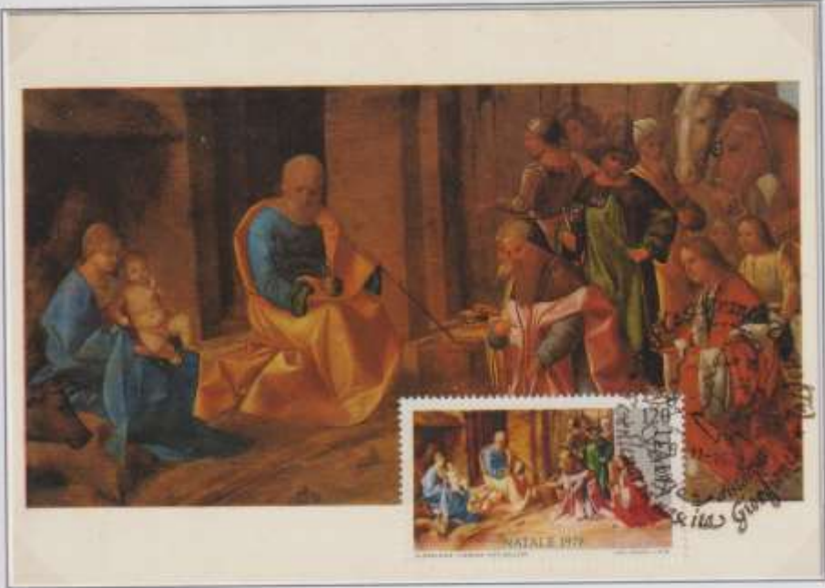
L'ADORAZIONE DEI MAGI- Dipinto, opera del Giorgione (Giorgio da Castelfranco ) 1478-1510- National Gallery.

EMIS- 08/11/1978 Italia. OBLIT- Castelfranco Primo giorno- Ediz- Trustees.GB.