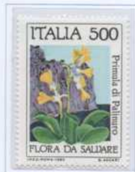
La Primula di Pallinuro (Salento - Campania)

Anche in Italia alcune specie di flora sono in via di estinzione