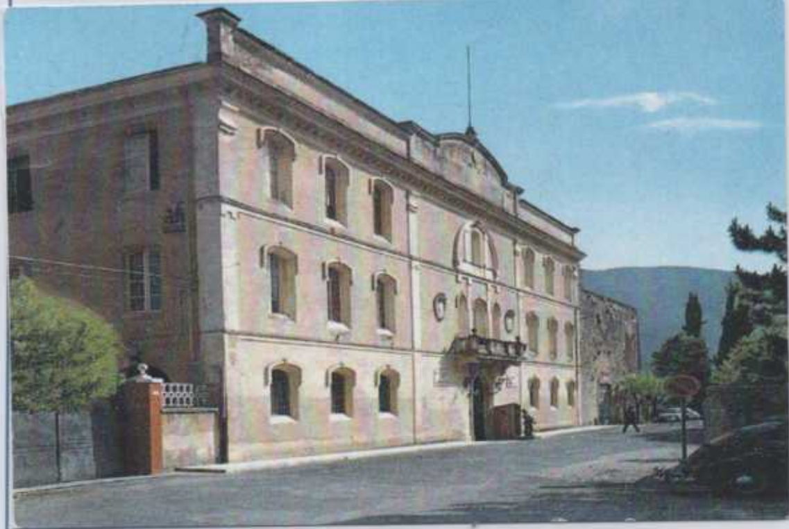
Cittaducale (Rieti). Scuola nazionale per la formazione del personale dell'ex Corpo Forestale dello Stato ora a disposizione dei Carabinieri Forestali. Cartolina anni 50. (Cartolina viaggiata in mio possesso)

Gli appartenenti ai ruoli di Ispettori e Carabinieri effettivi per far parte dei "ruoli forestali" devono frequentare un corso di specializzazione in "Tutela Forestale, Ambientale e Agroalimentare".