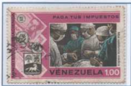
Una sala operatoria di chirurgia