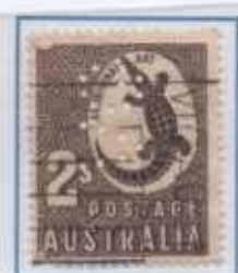
I Coccodrilli australiani

Questo Comando si interessa particolarmente, attraverso il CITES, al contrasto sulla speculazione e il commercio di specie animali esotici protetti, importati o esportate, che potrebbero alterare e essere dannose all'ambiente.