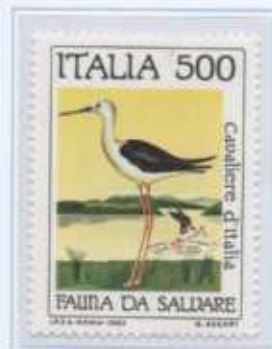
Il Cavaliere d'Italia distribuito nelle zone umide italiane