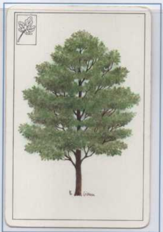
Acero Campestre. E' presente in gran parte della penisola italiana. Tollera sia il gelo che il caldo estivo.