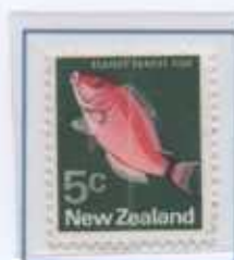
SCARLET PARROT Oceano Indiano

In analoga misura il Comando Forestali per la salvaguardia della Biodiversità si interessa attivamente al contrasto delle attività illecite affinché, a norma di legge, non vengano liberate nelle acque pubbliche italiane (laghi, fiumi) pesci non autoctoni , provenienti cioè da altre regioni naturalistiche del mondo.