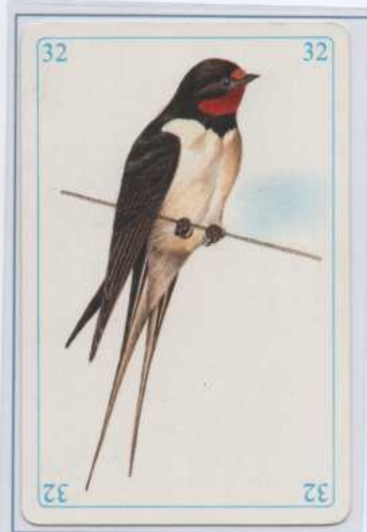
La rondine. Arriva nel mese di marzo dall'Africa per nidificare in case coloniche, in particolare nelle stalle, dove può trovare insetti in abbondanza.