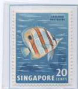
CHELTON ROSTRATUS Oceano Indiano

Questi sono fiori di stella alpina , sono di una pianta rara e protetta, quindi è assolutamente vietato raccogliarla .