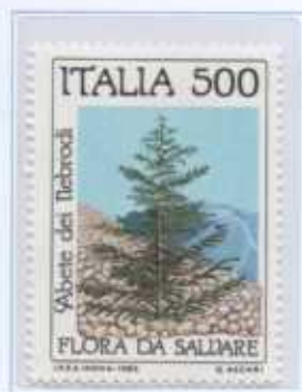
L'Abete dei Monti Nebrodi (Sicilia)