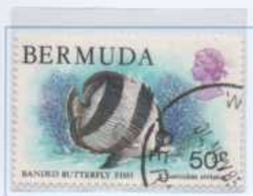
BANDED BUTTERFLY Mar dei Sangassi – Oceano Atlantico