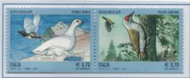
Anche questi due uccelli delle Alpi qui ripresi nel loro ambiente naturale, sono in pericolo di estinzione, si tratta della pernice bianca e del picchio cenerino.