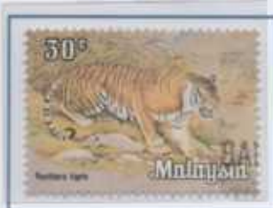
le Tigri della Malesia

Altri animali esotici il cui commercio è vietato a livello internazionale