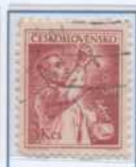
Studio di Radiologia e di Laboratorio di Analisi

Particolare attenzione dedicano alla lotta contro lo smaltimento dei rifiuti speciali provenienti dagli Ospedali, dalle Cliniche e dai laboratori privati, in particolare dalle sale operatorie, dalle radiologie, dalle odontoiatrie, dai laboratori di analisi e dalla medicina nucleare.