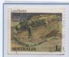
il Varano dell'Australia

Questo è il logo della 18° Conferenza degli Stati membri del CITES, svoltasi a Ginevra nel mese di agosto del 2019.