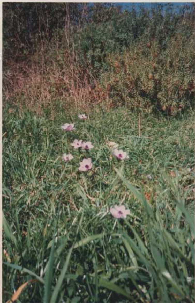
La foto ritrae un caratteristico prato del siracusano, specificatamente siamo nella zona del Bosco di Bauli verso i Ddieri (Palazzolo Acreide).