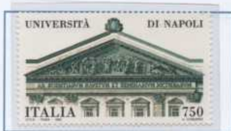
Università di Napoli