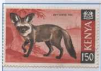
La volpe dalle orecchie di pipistrello

Questi sono alcuni animali protetti da questa Convenzione Internazionale