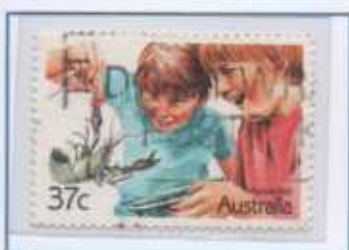
I Gamberi di fiume australiani