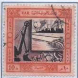
Centrale elettrica a carbone.