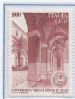
Università di Bari

Il Comando Centrale di Roma ha il compito di gestire, coordinare e promuovere tutte le iniziative e le attività di divulgazione e di educazione ambientale, specialmente nelle scuole , in tutto il territorio nazionale.