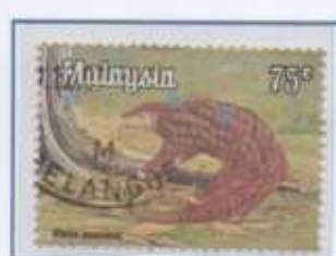
Il Pangolino della Malesia