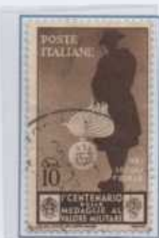
1934. 10 c. Carabiniere "nei secoli fedele"