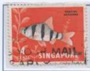
PUNTIUS HEXAZONO Oceano Indiano