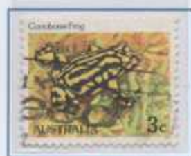
le Rane dell'Australia