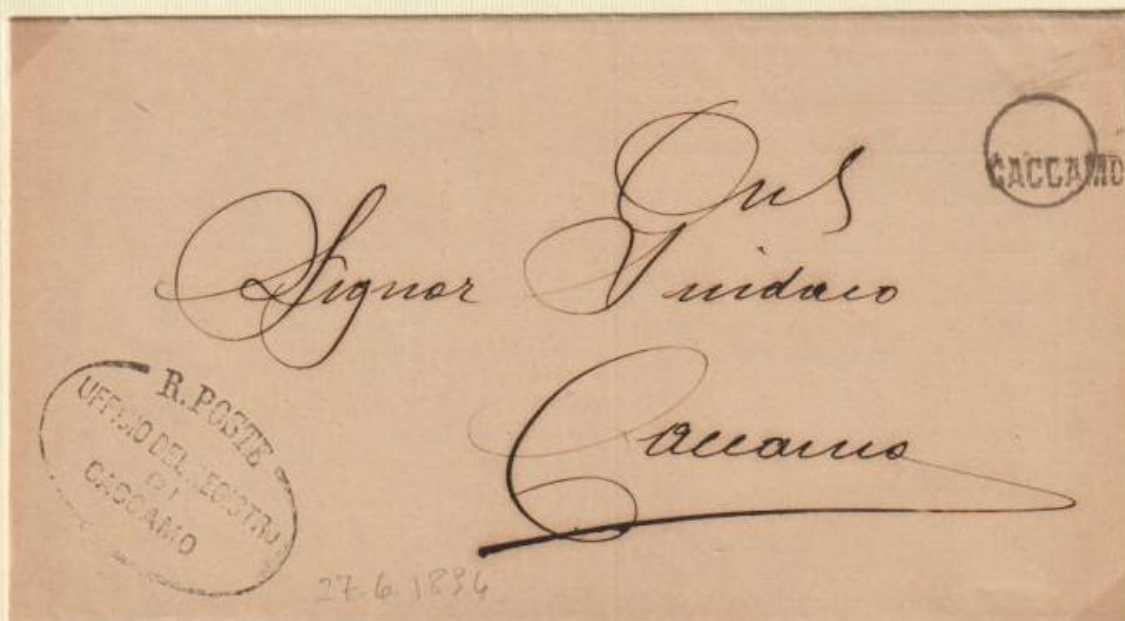
1894 - Piego in franchigia per città spedito il 27 giugno da CACCAMO utilizzando il bollo occasionale. Il piccolo bollo circolare è muto, non presentando alcuna data.