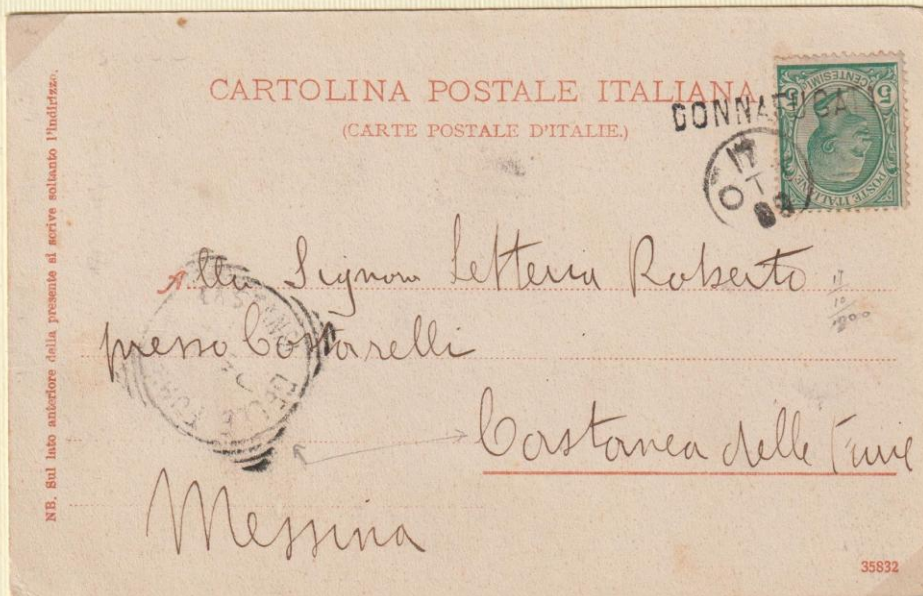
1900 - Cartolina illustrata spedita il 17 OTT 00 (mese indicato a lettere) da DONNAFUGATA utilizzando i bolli occasionali. In arrivo a Castanea delle Furie fu apposto il bollo del 20 ottobre 1900.