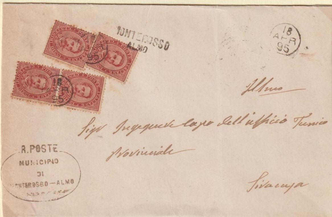
1895 - Piegio di 4 porti spedito da MONTEROSSO ALMO il 18 APR 95 apponendo i bolli occasionali. Diretto a Siracusa, vi giunse lo stesso giorno, come dal bollo a tergo.