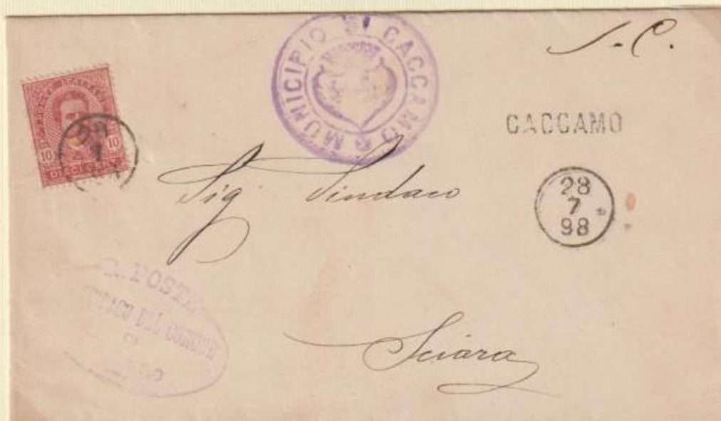
1898 - Piego affrancato, spedito il 28 7 98 (mese indicato a numero) da CACCAMO utilizzando in tal caso un bollo occasionale con maggiore spaziatura tra le lettere (cm. 2,5 mentre il primo è di cm. 2,1). A tergo bollo di arrivo dello stesso giorno.