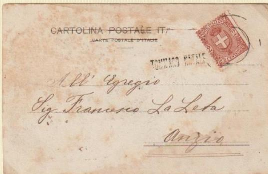
1901 ? - Cartolina illustrata del primissimo Novecento spedita ad Anzio, utilizzando un atipico bollo muto a doppio cerchio per annullare il francobollo. A fianco il bollo occasionale TOMMASO NATALE .