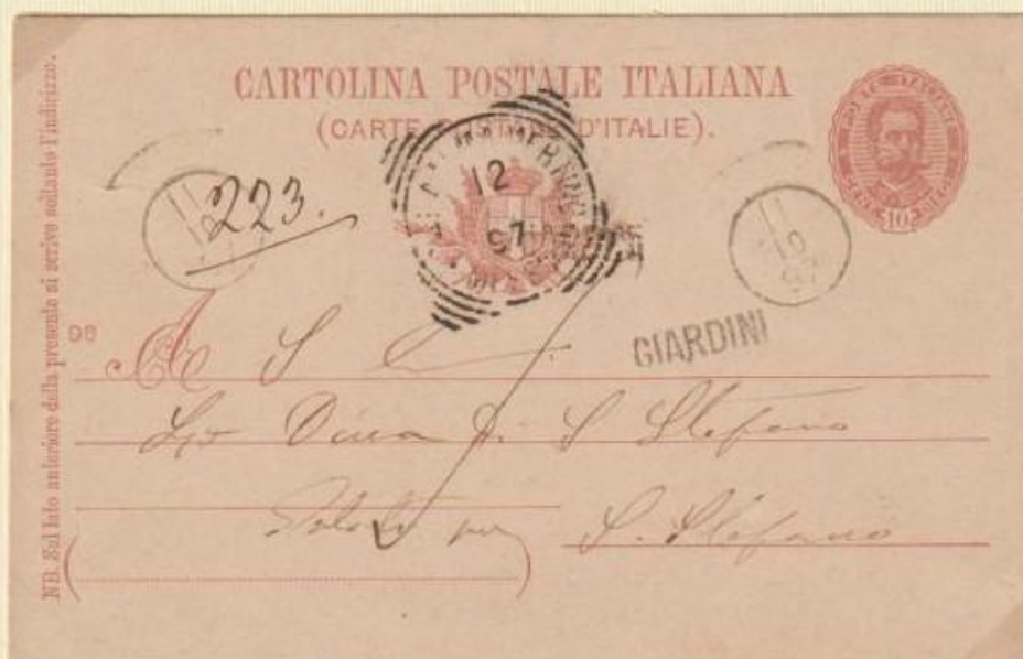
1897 - Intero postale spedito l' 11 10 97 (mese indicato a numero) da GIARDINI a S. Stefano utilizzando i bolli occasionali. In arrivo il bollo a data del 12 ottobre 1897.