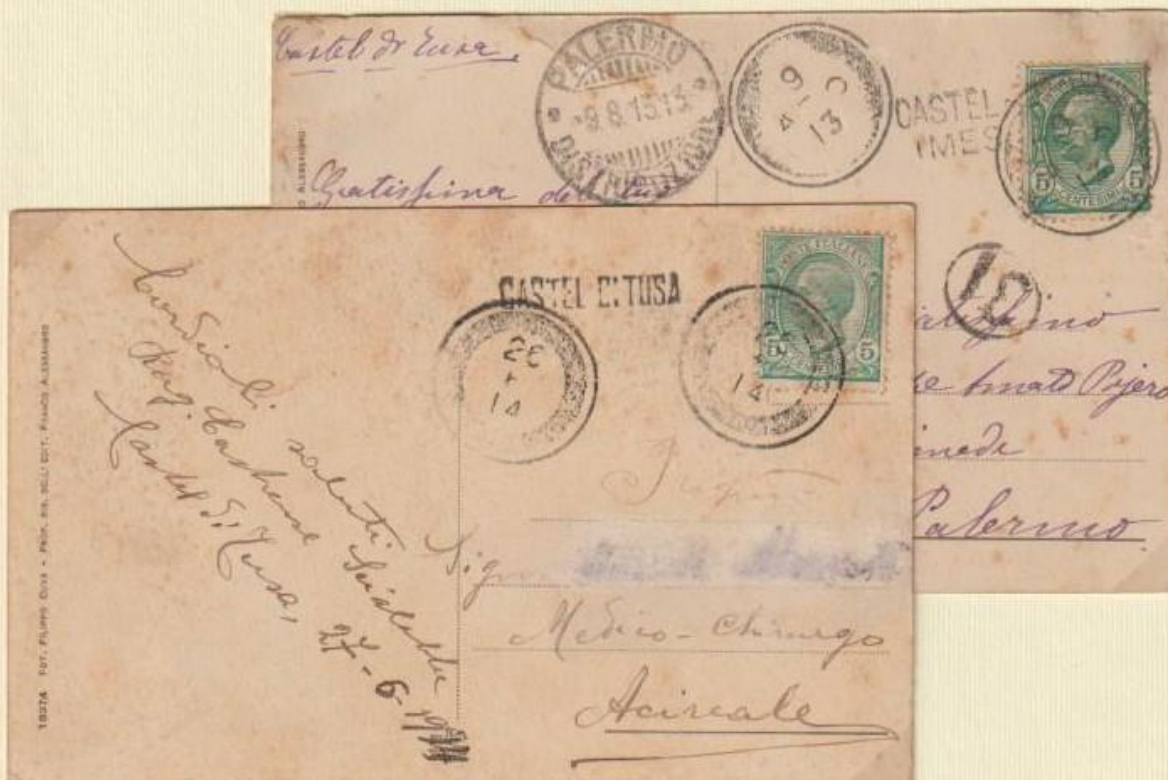
1913/1914 - Cartoline illustrate spedite il 9 AGO 13 (mese indicato a lettere) per Palermo con bollo occasionale CASTEL DI TUSA (MESSINA) ed il 26 6 14 (mese indicato a numero) per Acireale con altro bollo occasionale CASTEL DI TUSA di differente forma.