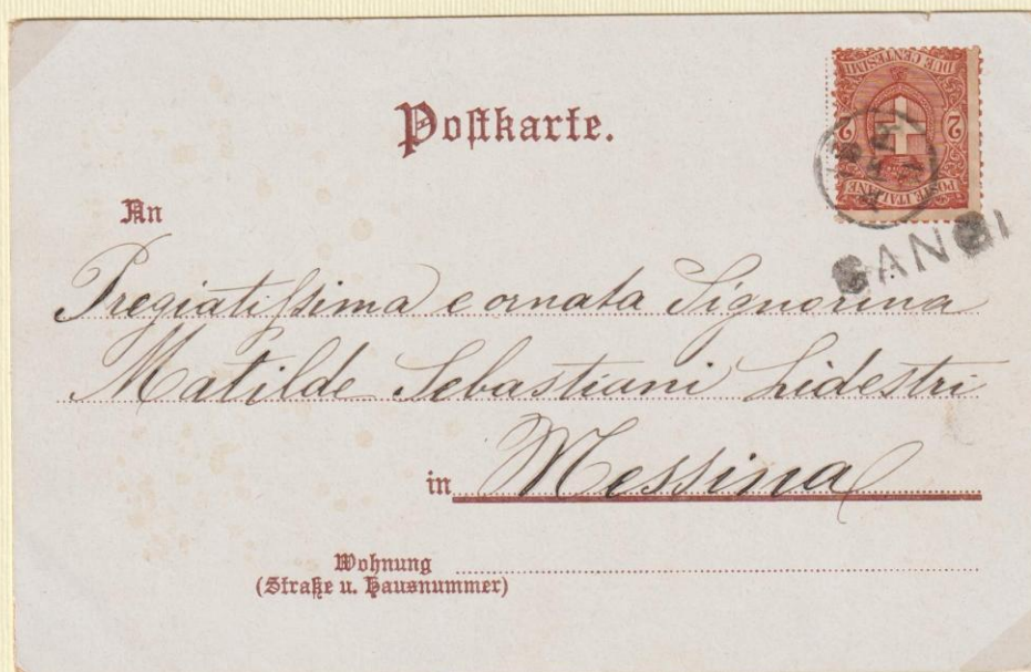
1901 – Cartolina illustrata spedita il 15 GEN 01 (mese indicato a lettere) da GANGI a Messina utilizzando i relativi bolli occasionali.