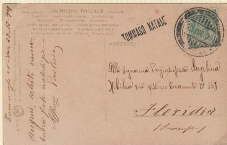
1908 - Cartolina illustrata spedita il 22 DIC 08 (bollo a doppio cerchio grande atipico nel periodo) spedita da TOMMASO NATALE a Florida.