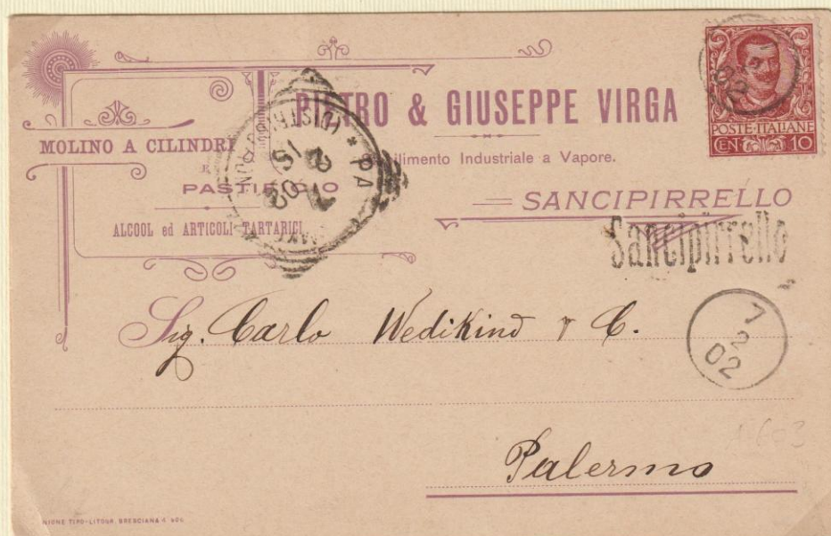
1902 – Cartolina commerciale spedita il 7 2 02 (mese indicato a numero) da Sancipirrello a Palermo utilizzando i bolli occasionali