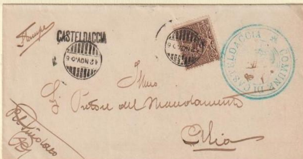
1906 - Piego affrancato in tariffa stampe, spedito il 12 NOV 06 da CASTELDACCIA ad Alia apponendo bolli occasionali differenti dal precedente piego. In arrivo a tergo il bollo a data del 13/11/1906 .