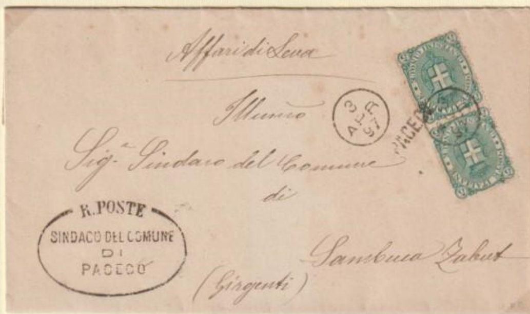
1897 – Piego spedito il 3 APR 97 da PACECO con l'apposizione dei bolli occasionali. Diretto a Sambuca Zabut, vi giunse il 5 aprile 1897, come da bollo a tergo.