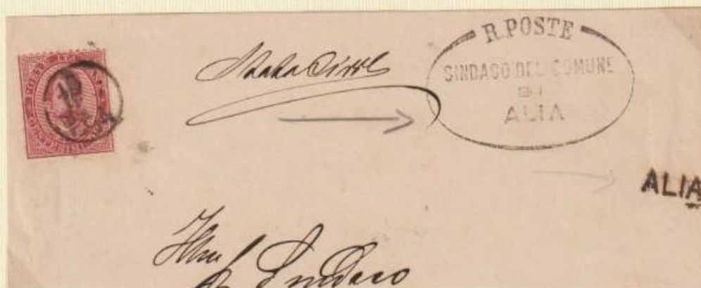
1894 - Parte di lettera spedita il 18 NOV 94 (mese indicato a lettere) da ALIA utilizzando i relativi bolli occasionali.