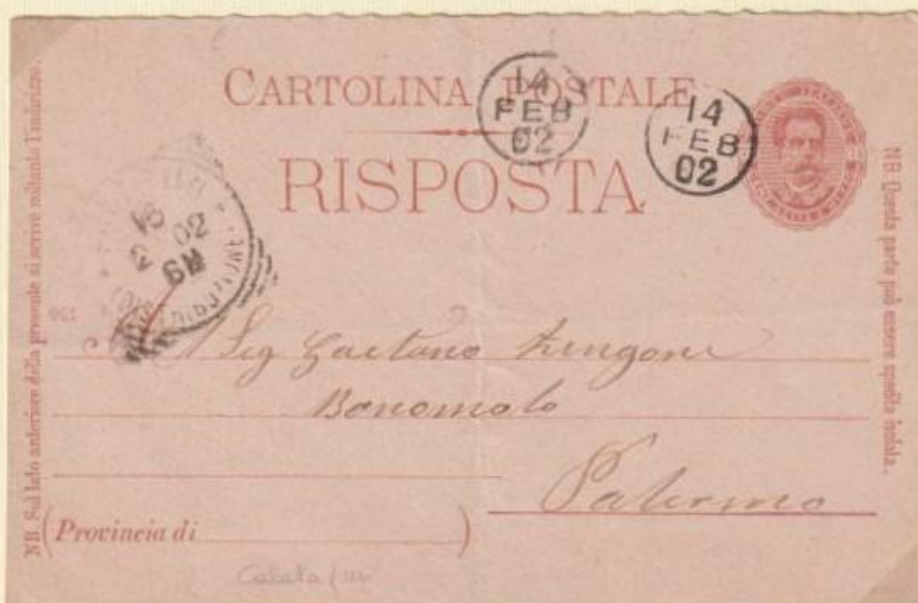
1902 – Intero postale di "RISPOSTA", spedito da CALATAFIMI a Palermo il 14 FEB 02 (mese indicato a lettere). Fu apposto soltanto il bollo occasionale a piccolo cerchio con data.