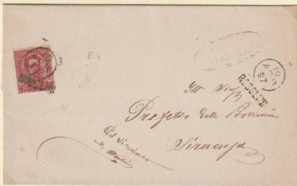
1897 – Piego spedito il 16 APR 97 (mese indicato a lettere) da ROSOLINI con l'utilizzo dei bolli occasionali, apposti sul francobollo e sul frontespizio. Giunse a Siracusa lo stesso giorno, come da bollo a tergo.