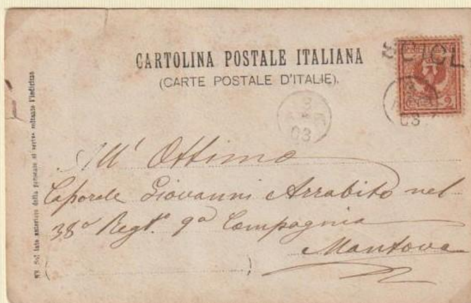
1903 – Cartolina illustrata per Mantova spedita il 3 APR 03 da SCICLI con l'utilizzo dei bolli occasionali.