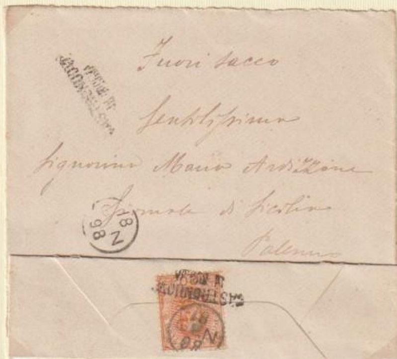
1898 - Lettera spedita il 18 GEN 98 (mese indicato a lettere) da CASTRONOVO DI SICILIA a Palermo con francobollo apposto a tergo utilizzando i relativi bolli occasionali.