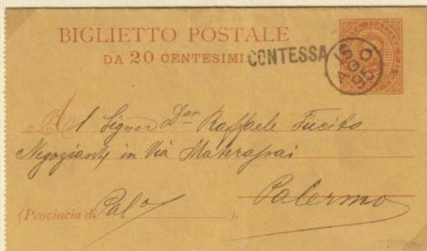
1895 - Biglietto postale spedito il 15 AGO 95 (mese indicato a lettere) da CONTESSA a Palermo apponendo i bolli occasionali.