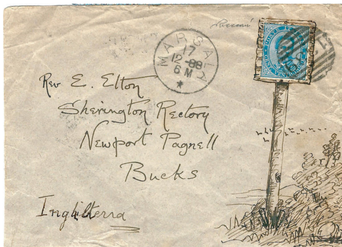
Lettera primo porto per l'estero affrancata in tariffa con 25 cent. inviata il 17 dic. 1888 da Marsala diretta a Bucks (Inghilterra) decorata a mano con un disegno intorno al francobollo secondo una consuetudine prettamente inglese.