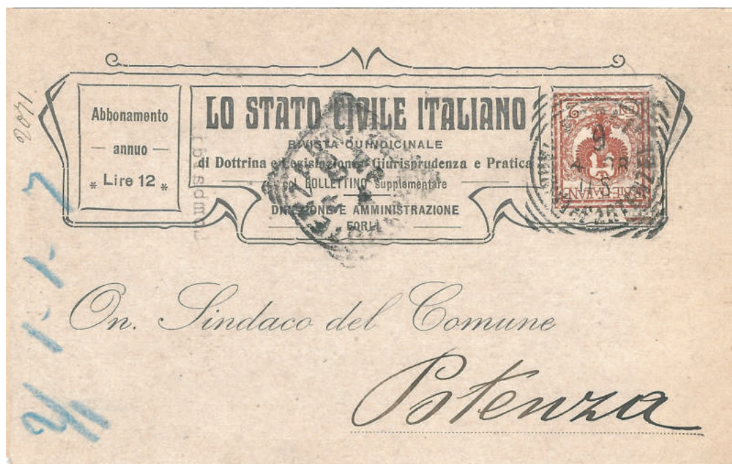
Cartolina commerciale tariffa stampe per l'interno del 9 apr. 1908 da Forlì a Potenza intestata con una elaborata decorazione predisposta a formare un collare decorato intorno al francobollo.