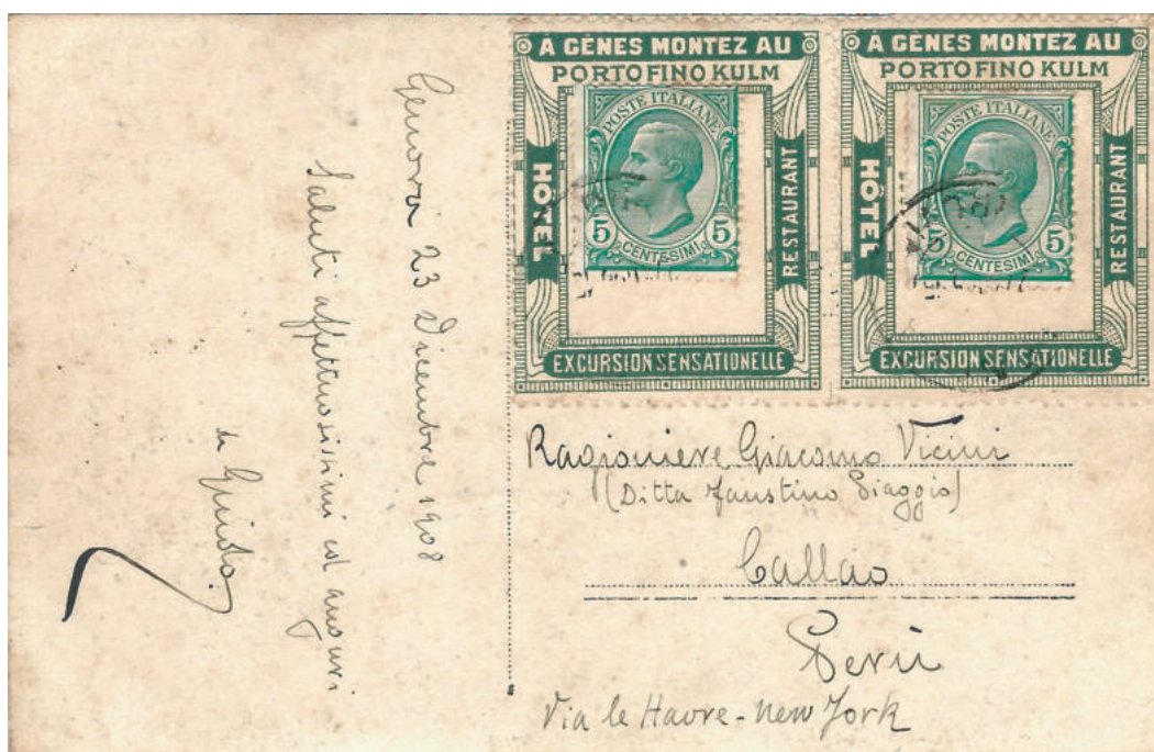
Cartolina illustrata per l'estero del 23 dic.1908 da Genova a Callao (Perù) con due francobolli applicati su altrettanti supporti pubblicitari in verde "HOTEL PORTOFINO KULM".