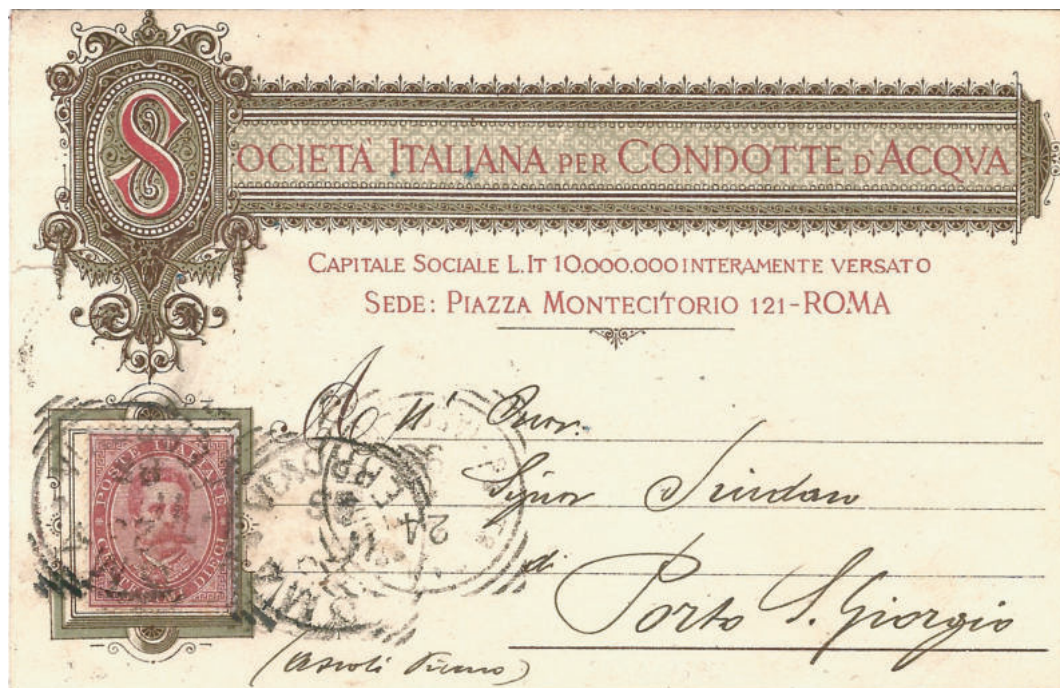
Cartolina commerciale per l'interno del 23 nov. 1895 da Roma a Porto San Giorgio. intestata con una elaborata decorazione predisposta a formare un collare decorato intorno al francobollo.

Sulla propria corrispondenza commerciale alcune aziende, oltre all'intestazione della ditta, predisponavano anche uno spazio incorniciato destinato ad accogliere il francobollo in modo rendere l'aspetto dell'oggetto più equilibrato attirando in questo modo l'attenzione del destinatario sia sul francobollo che, in generale, sul nome del mittente per fini pubblicitari.