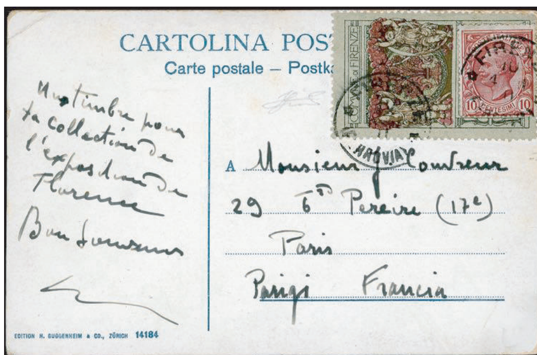
Cartolina illustrata da Firenze per la Francia del 1911 con francobollo applicato su supporto propagandistico "COMUNE DI FIRENZE".