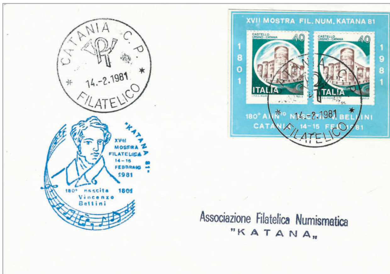
Busta filatelica del 14 feb. 1981 affrancata con due francobolli dell'ordinaria "Castelli" appena emessi, applicati su supporto di propaganda "XVII MOSTRA FIL. NUM. KATANA 81" e annullati "Catania C.P. Filatelico".