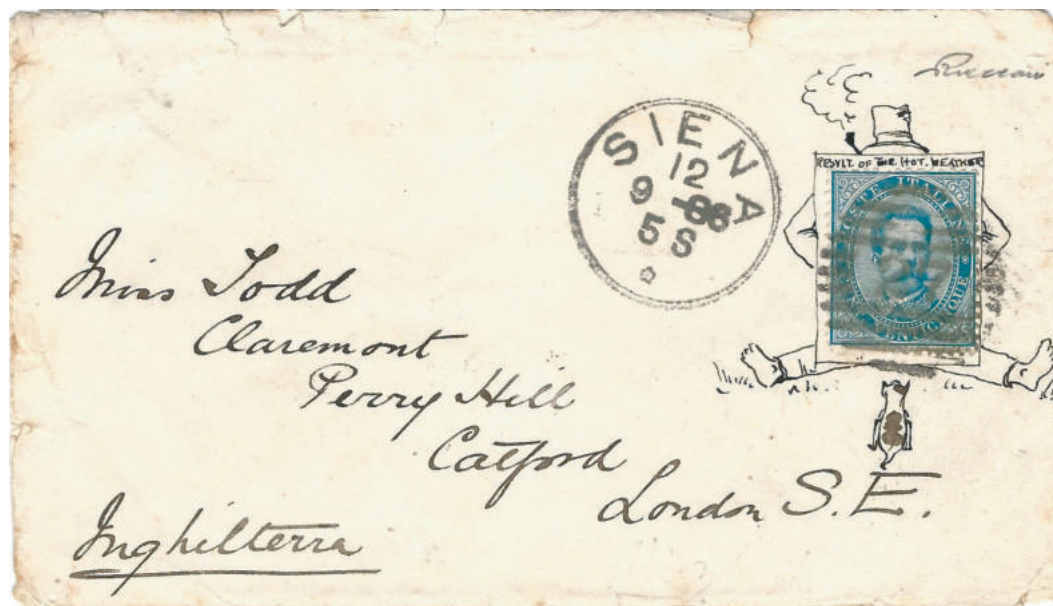
Lettera primo porto per l'estero affrancata in tariffa con 25 cent. inviata il 12 sett. 1886 da Siena diretta a Londra (Inghilterra) decorata a mano con un disegno intorno al francobollo secondo una consuetudine prettamente inglese.

Due buste decorate a mano con disegni che, in base alla premessa, possono essere definiti "precursori" dei collari pubblicitari.