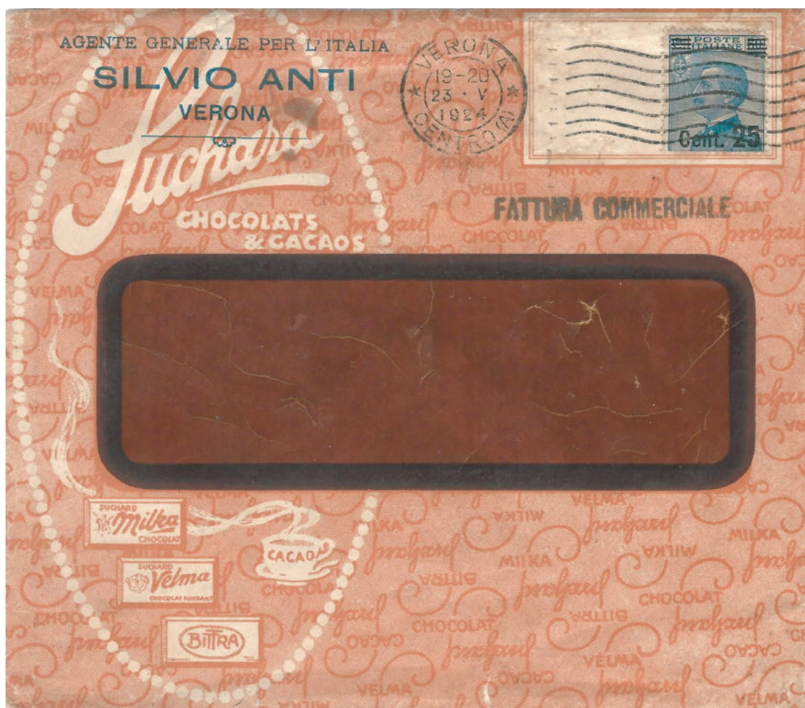
Busta pubblicitaria con finestra trasparente spedita per fattura commerciale il 23 mag. 1924 da Verona. L'intestazione della ditta Suchard è estesa, con effetto "textura", su tutte le due superfici della lettera lasciando libero dalla stampa un apposito spazio, come un collare, per l'affrancatura.