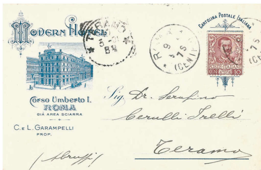
Cartolina commerciale per l'interno del 9 mar. 1906 da Roma a Teramo intestata con una elaborata decorazione predisposta a formare un collare decorato intorno al francobollo.