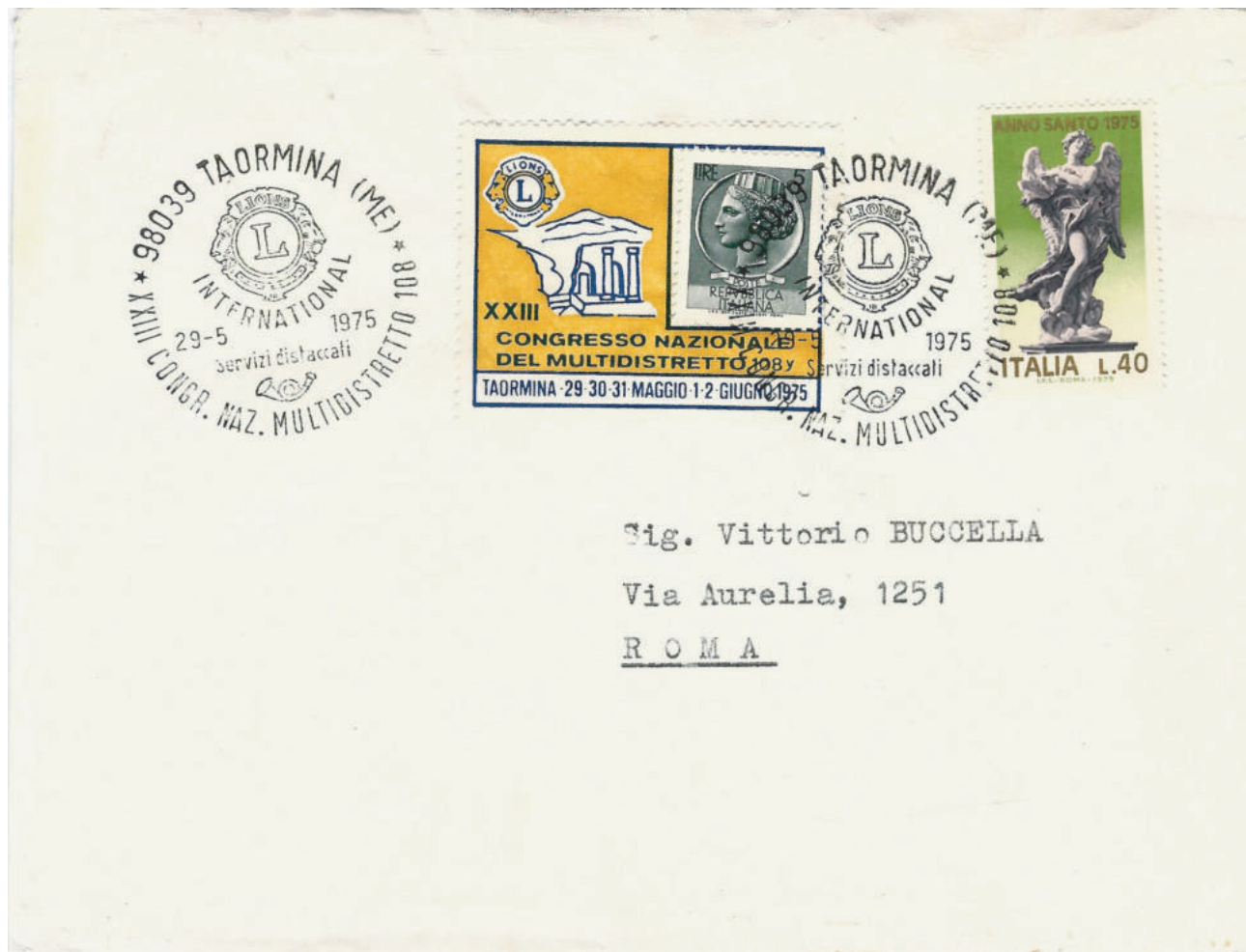
Lettera in tariffa stampe per l'interno del 29 mag. 1975 da Taormina (ME) a Roma con francobollo applicato su supporto di propaganda "XXIII CONGRESSO NAZ. MULTIDISTRETTO 108", annullato con bollo speciale "Lions Clubs International".

Terminata la seconda guerra mondiale le organizzazioni filateliche si organizzarono con varie iniziative per rilanciare la filatelia. Tra le altre idee proposte vennero riesumati i vecchi supporti pubblicitari utilizzandoli in occasione di eventi a carattere filatelico fino agli inizi degli anni '80, appena in tempo per accogliere l'appena emessa serie dei "Castelli", prima della loro definitiva scomparsa.