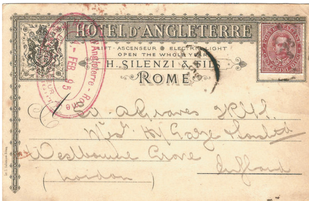
Cartolina commerciale per l'estero del 4 feb. 1895 da Roma a Londra (Inghilterra) intestata con una elaborata decorazione predisposta a formare un collare intorno al francobollo.