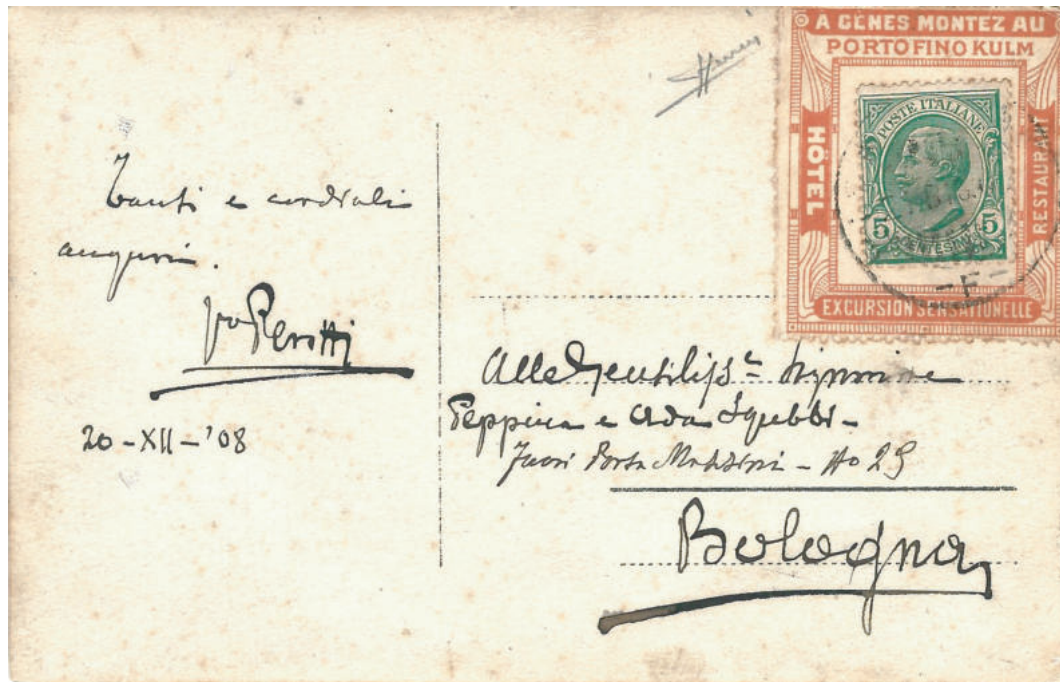
Cartolina illustrata per l'interno del 20 dic.1908 per Bologna con francobollo applicato su supporto pubblicitario in rosso "HOTEL PORTOFINO KULM".