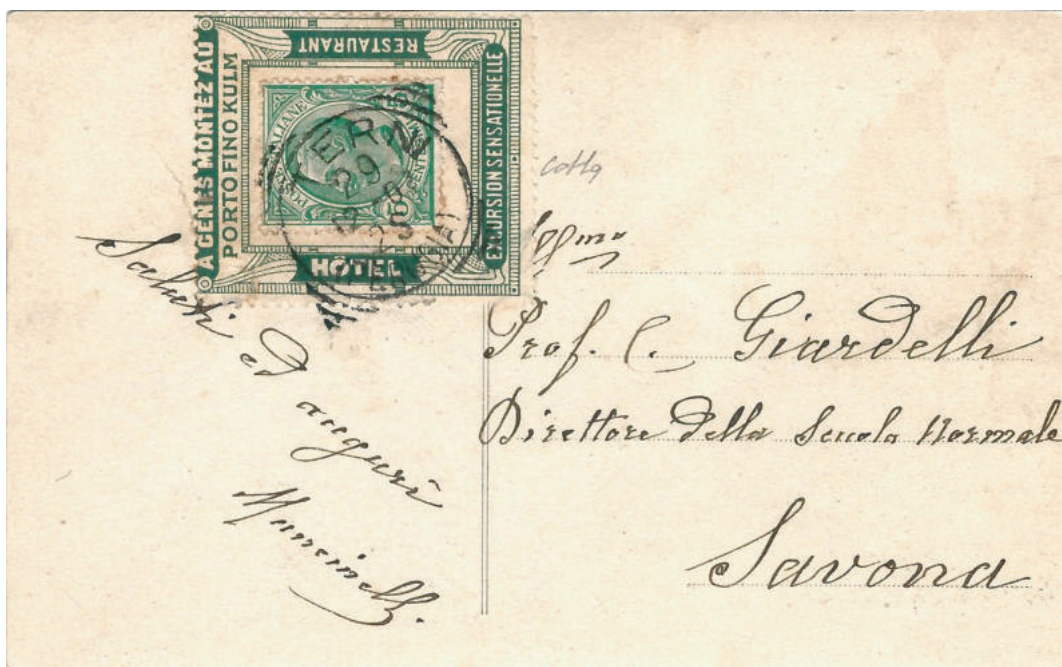
Cartolina illustrata per l'interno del 29 Dic. 1907 da Terni a Savona con francobollo applicato su supporto pubblicitario verde "HOTEL PORTOFINO KULM".