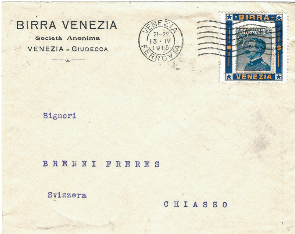
Lettera intestata "Birra Venezia" per l'estero del 13 apr. 1915 da Venezia a Chiasso (Svizzera) con francobollo apposto su supporto pubblicitario "BIRRA VENEZIA". Il francobollo applicato sul supporto è strappato. Probabile frode postale.