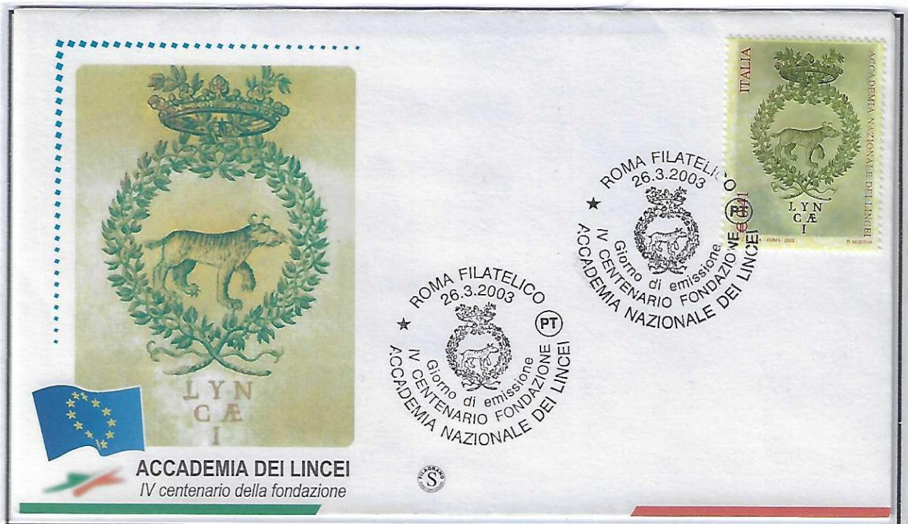
Busta Primo giorno Filigrano