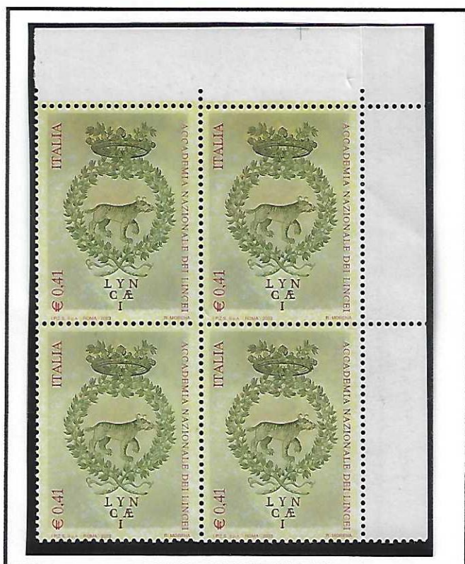
Quartina angolo di foglio alto-dx. Infiltrazione di rosso al di sopra della schiena della lince Presenta inoltre lieve spostamento della dentellatura