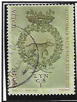
Esemplari con diciture rosse in diversi toni