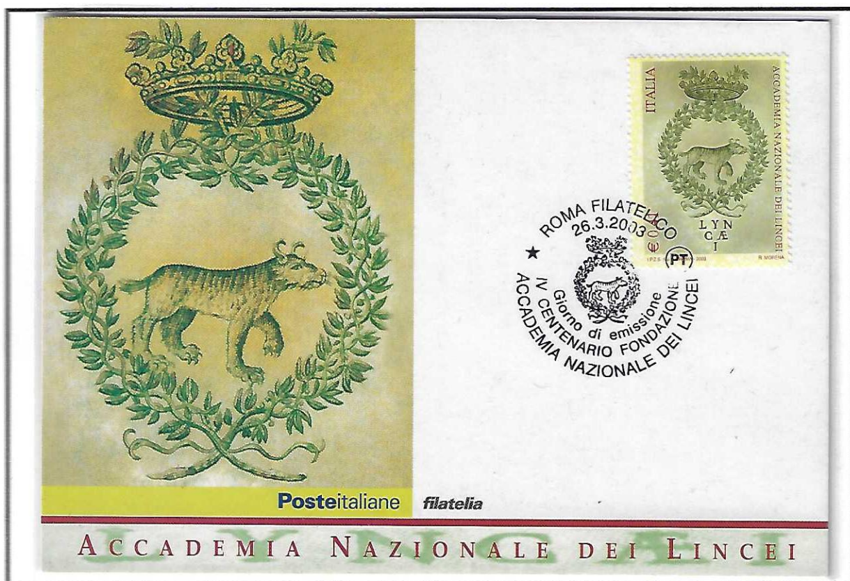
Cartolina primo giorno emissione 26 Marzo 2003 con annullo Roma Filatelico. Esemplare tipo.

2003 - 0,41 eurocent. Accademia dei Lincei, stampa in rotocalco, dentellatura a peffine 13¼x14. Tiratura 3.500.000