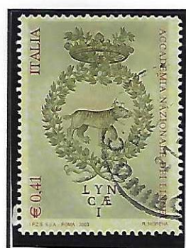
Esemplari con fondo prevalentemente grigio/verde in diversi toni