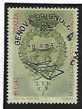
Esemplari con fondo prevalentemente verde in diversi toni