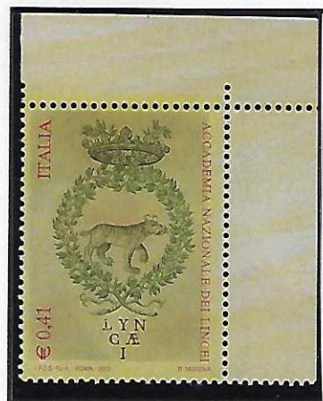
Esemplari con fondo prevalentemente giallo in diversi toni