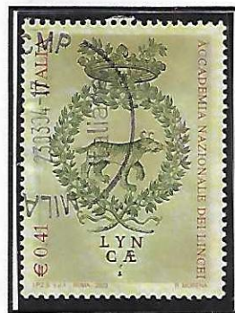
"Y" di LYNCA/EI rotta in due punti diversi