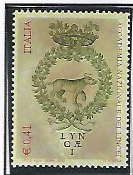
Esemplari con fondo prevalentemente rosato verde in diversi toni