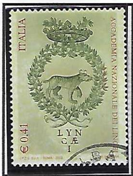
"C" di LYNCA/EI rotta