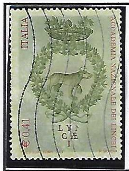
"N" di LYNCA/EI appena accennata