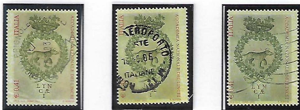
Tre diversi spostamenti di colore e dentellatura