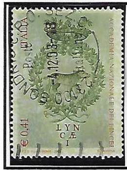
"Colature" di colore in alto su due esemplari di diverso colore