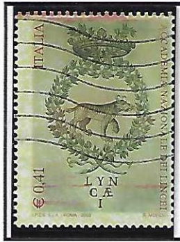
Macchie di magenta orizzontali. Quella in alto ricorda il taglio chirurgico