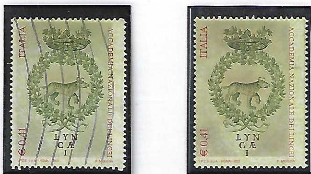
Esemplari con caratteristica "salto del pettine"