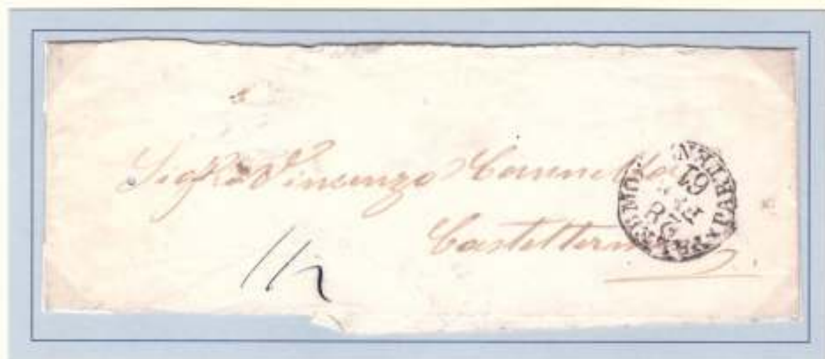
28 Febbraio 1861- Da Palermo (datario circolare nero 28 FEB 61) a Casteltermini. Fascetta per giornali, tassa pagata mezzo grano (un foglio).