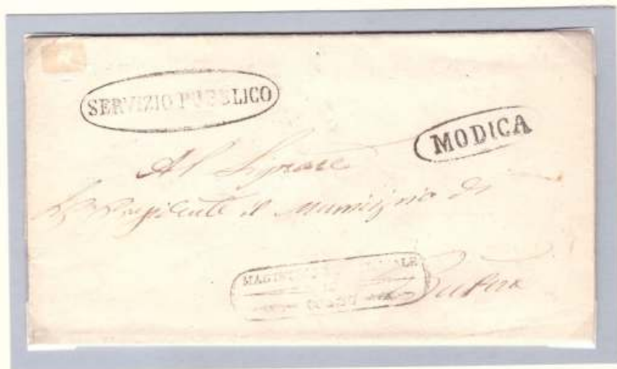
16 novembre 1860-Da Comiso a Butera (ovale nero dell'officina postale di Modica e ovale nero SERVIZIO PUBBLICO)