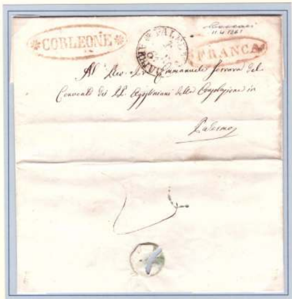
Da Corleone (ovale rosso con rosette e bollo FRANCA ovale con fregi della stessa officina) a Palermo (datario di arrivo circolare nero PALERMO ARRIVO 11 APR.61). Al verso cifra 2 tassa pagata dal mittente 2 grana per lettera di un foglio.