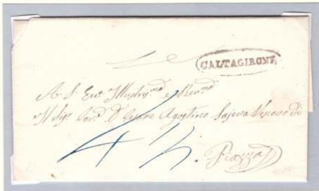
Da Caltagirone a Piazza 4 gennaio 1861 ovale nero dell'officina postale di Caltagirone