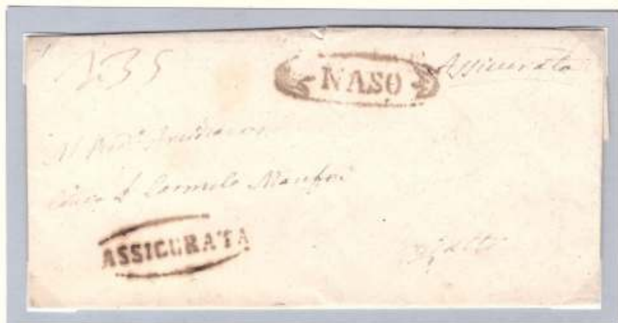
10 marzo 1861- Da Naso (ovale nero con fregi e ovale nero ASSICURATA) a Patti. Al verso cifra 6 (6 grana) e nome del mittente