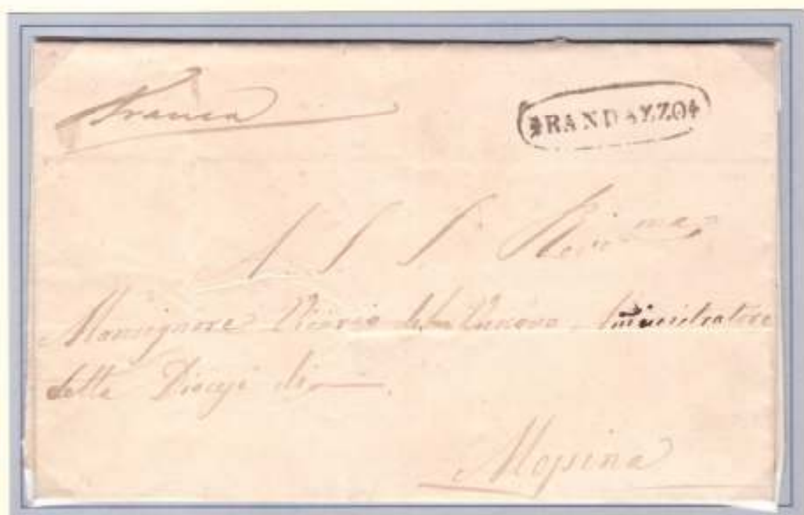
25 Marzo 1861- Da Randazzo (ovale nero con fregi) a Messina (al verso: datario circolare nero a palme 29-3-61). Manoscritto "franca" dal mittente e, al verso, cifra 2.