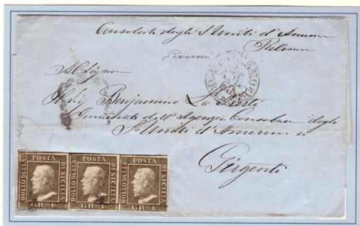
Lettera da Palermo a Girgenti del 24 aprile 1860 Dal Consolato Generale degli Stati Uniti d'America in Palermo all'Agenzia Consolare in Girgenti Affrancata per 3 grana (un foglio e mezzo)