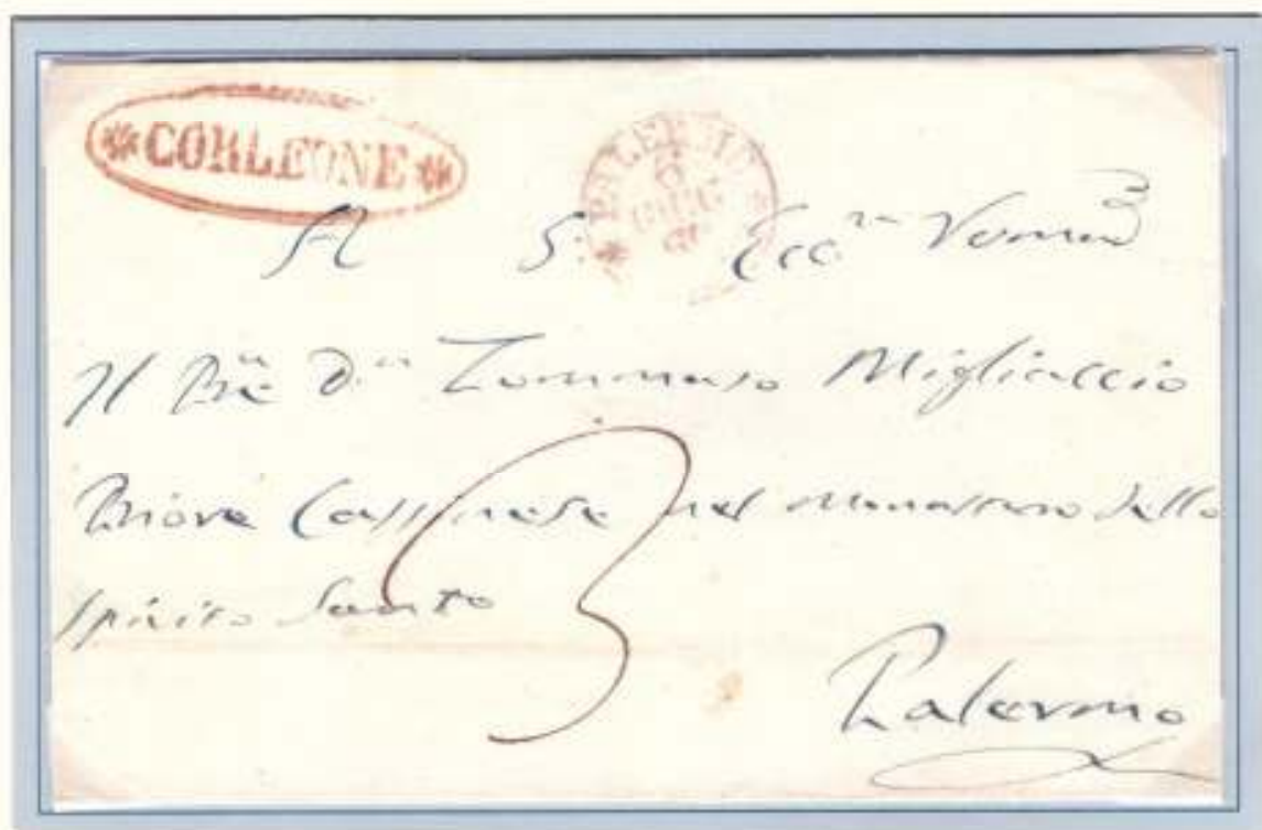
Lettera schiava del 4 giugno 1860 da Corleone (ovale rosso con fregi) a Palermo (circolare rosso PALERMO ARRIVO 6 GIUG 60) Tassa 3 grana per lettera di un foglio

Dopo la conquista della Capitale e la firma dell'armistizio il servizio postale cominciò a tornare alla normalità dopo alcuni giorni di blocco dovuto ai fatti bellici che paralizzarono Palermo, snodo centrale da cui partivano tutte le corse dell' Isola, ed all'assalto di alcune corriere postali da parte degli insorti. Per volere dei comitati rivoluzionari e del governo dittatoriale restava abolito nelle zone liberate l'uso dei francobolli con l'immagine di Ferdinando. Da quel momento si ritornò al sistema prefilatelico, caso unico nella filatelia mondiale verificatosi solamente in Sicilia.