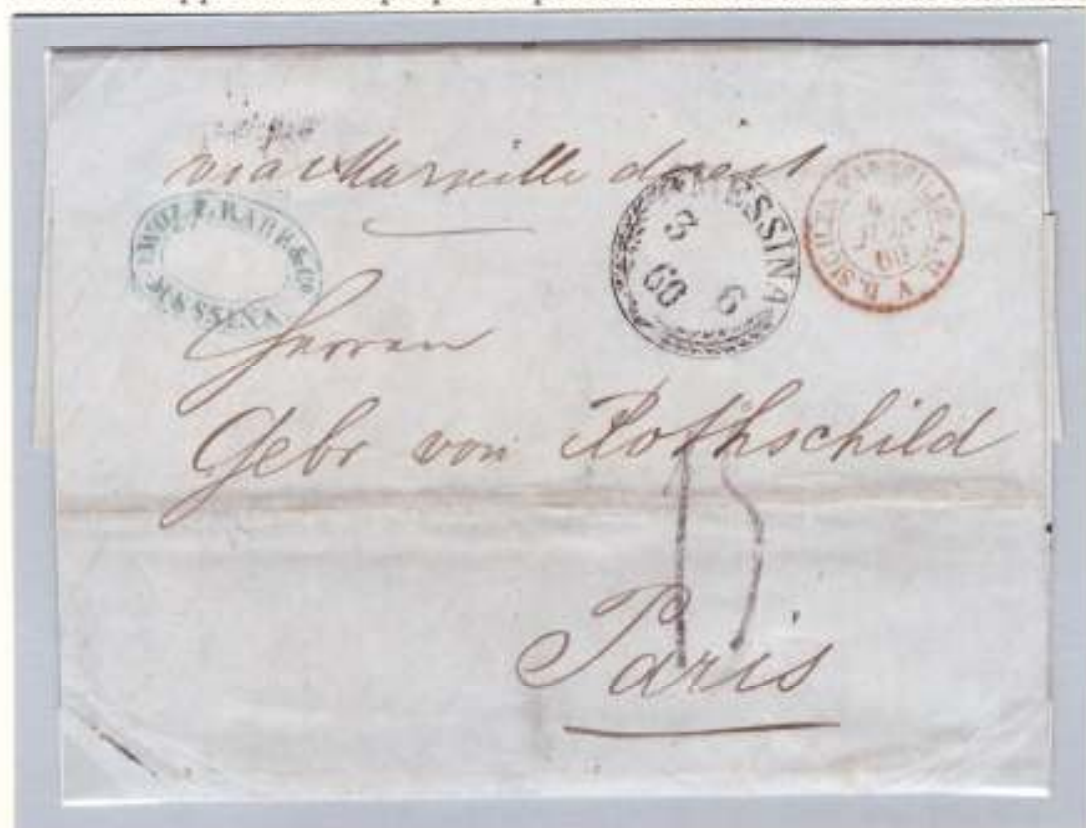
Lettera del 3 giugno 1860 da Messina a Parigi, timbro doganale di Marsiglia 6 giugno 1860. La lettera, non affrancata, fu imbarcata sul postale Neva della linea del Levante. Tassa 15 a tampone (1,5 franchi)

Messina rappresentava proprio il porto di coincidenza tra le due linee