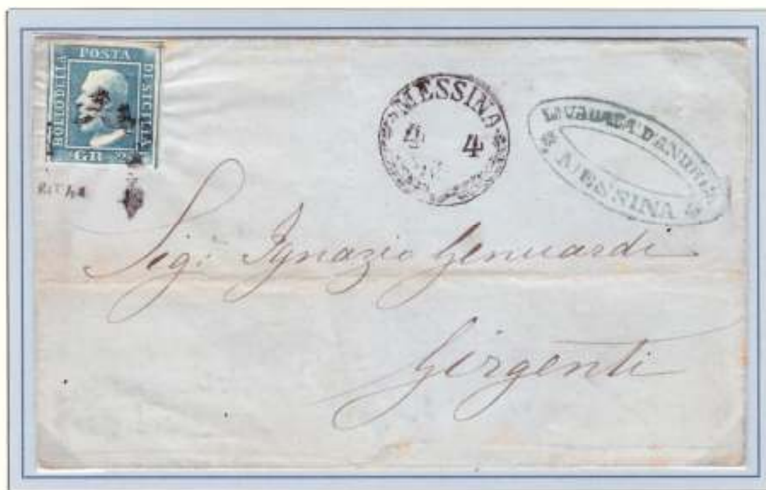
Lettera da Messina a Girgenti del 4 aprile 1860, giorno in cui a Palermo scoppia l'insurrezione

Il 4 aprile 1860 avvenne a Palermo un fatto eclatante dalle sanguinose e inaspettate conseguenze: un gruppo di rivoluzionari composto da nobili e popolani diede vita a una rivolta destinata a spianare la strada a Garibaldi. La rivolta della Gancia, dal nome della chiesa dalle cui campane fu dato il segnale per l'inizio della rivoluzione, fu sventata al suo principio dalla polizia borbonica che già sapeva e tredici dei responsabili furono arrestati e giustiziati il 14 aprile. A Palermo venne decretato lo stato d'assedio. Si fermò il commercio e il servizio postale con un conseguente drastico calo delle corrispondenze, le città si spopolarono nel timore di bombardamenti. Il cruento episodio acui i sentimenti antiborbonici sia in Sicilia che nel resto d'Italia e provocò disordini in vari centri siciliani, i patrioti passarono concretamente all'azione scontrandosi con le guarnigioni napoletane per preparare il terreno in attesa del tanto auspicato intervento esterno