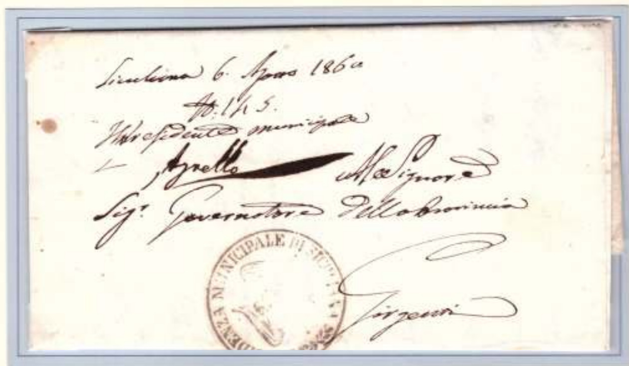
6 Agosto 1860- Da Siculiana a Girgenti. Trinacria della Presidenza municipale di Siculiana