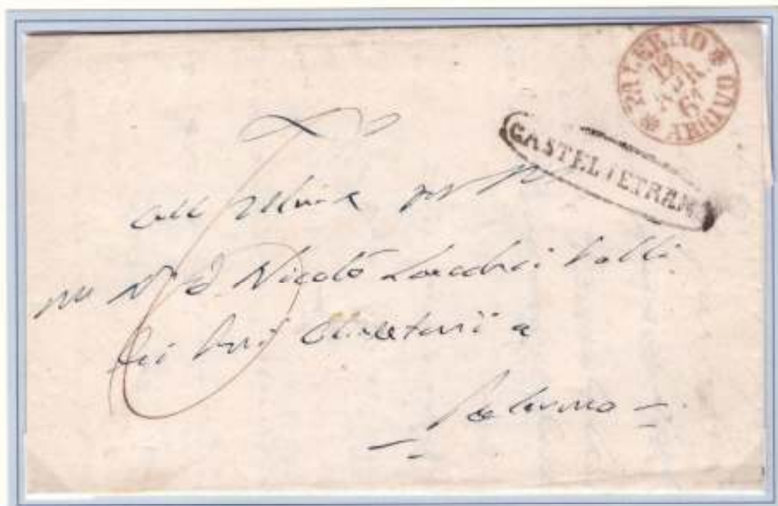
12 Aprile 1861- Da Castelvetro (ovale nero) a Palermo (datario di arrivo circolare rosso 12 APR. 61)