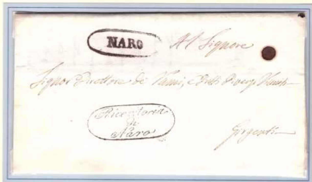
28 Giugno 1860- Da Naro (ovale nero) a Girgenti. Contrassegno di franchigia ovale nero della Ricevitoria di Naro.