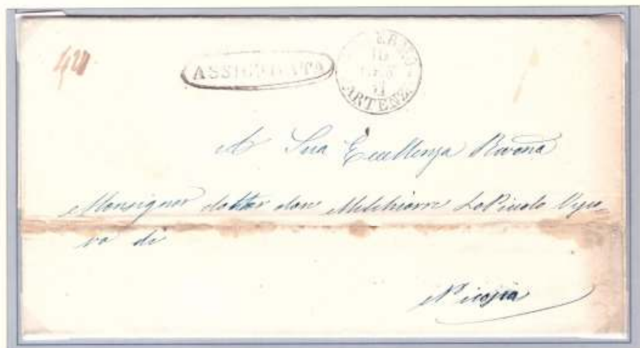
10 Gennaio 1861- Da Palermo (datario circolare nero di partenza) a Nicosia. Ovale nero ASSICURATA di Palermo. Al verso cifra 6, tassa per assicurata di un foglio e mezzo