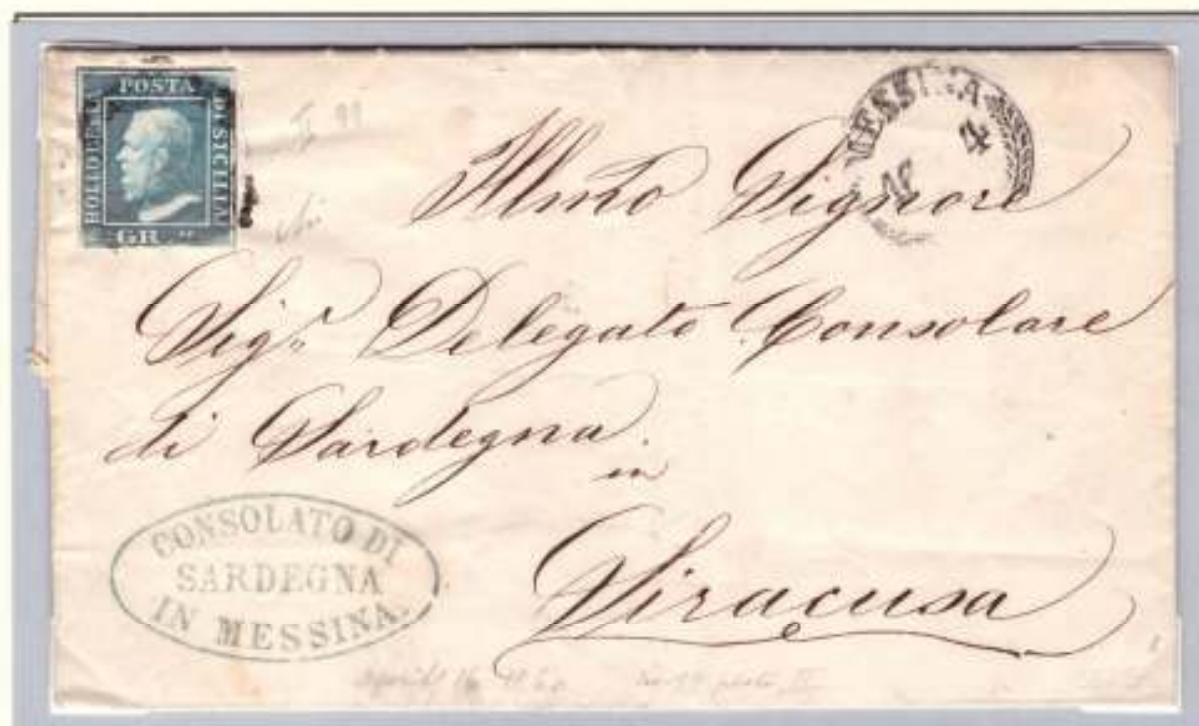
Lettera del 16 aprile 1860 dal Consolato di Sardegna in Messina al Delegato consolare di Sardegna in Siracusa. Affrancata per 2 grana (un foglio).

Le delegazioni diplomatiche presenti in Sicilia si misero in allarme sia per tutelare i propri interessi sia per "incoraggiare", seppur segretamente, la rivolta