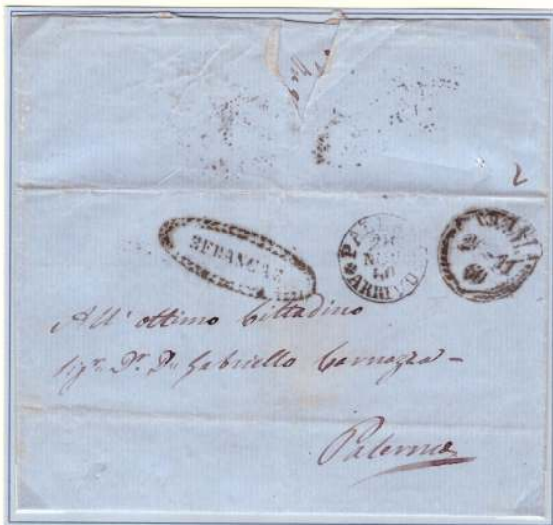
26 Novembre 1860- Da Catania (datario circolare a palme nero) a Palermo (datario di arrivo circolare nero 28 NOV. 60). Bollo ovale nero con cornice ornata FRANCA di Catania. Tassa pagata dal mittente 2 grana (al verso: piccola cifra a tampone) per lettera di un foglio. Primi giorni d'uso a Catania di tale inedita impronta

La possibilità di pagare in anticipo il porto della corrispondenza era già prevista in epoca prefilatelica, infatti, con la riforma postale del 1819, tutte le Officine Postali, insieme agli altri bolli, furono dotate del bollo "FRANCA" da apporre sulle lettere il cui porto veniva pagato in anticipo dal mittente. Con l'avvento dei francobolli, i bolli "FRANCA" non ebbero più ragione di esistere se non in rari casi tanto che la maggior parte delle officine postali li restituirono alla Direzione di Palermo. Nel periodo garibaldino questi timbri tornarono in auge, utilizzati presso la Direzione di Palermo e nelle pochissime officine postali che ancora li detenevano per testimoniare il pagamento anticipato della tariffa postale che veniva segnata a penna sul retro della lettera. Negli uffici ormai sprovvisti del timbro, veniva apposta la scritta "Franca" e la firma dell'ufficiale postale.