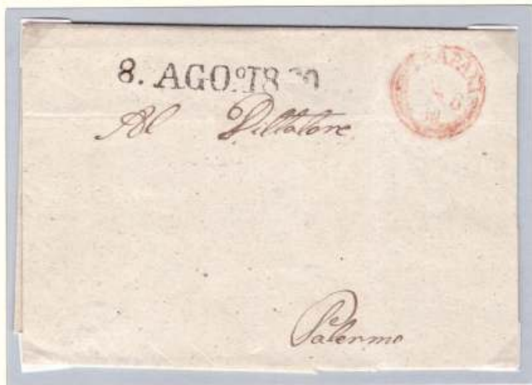
7 agosto 1860- Da Trapani (datario circolare rosso a palme) a Palermo (datario lineare nero 8.AGO°J860) La lettera, indirizzata "Al Dittatore", viaggiò in esenzione di tassa (Ex coll. Aquila)

Le lettere dirette al dittatore godevano del diritto di franchigia