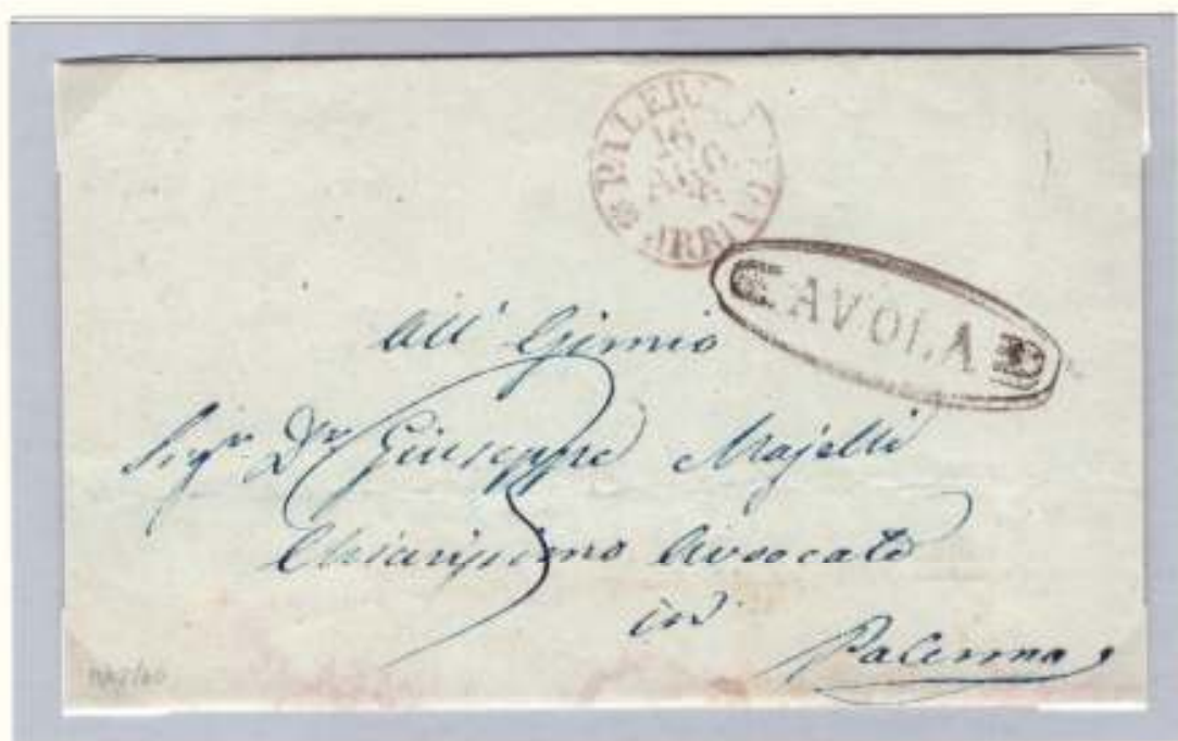
Da Avola a Palermo 13 agosto 1860 Ovale nero con fregi dell'officina postale di Avola e circolare PALERMO ARRIVO rosso 16 AGO 60