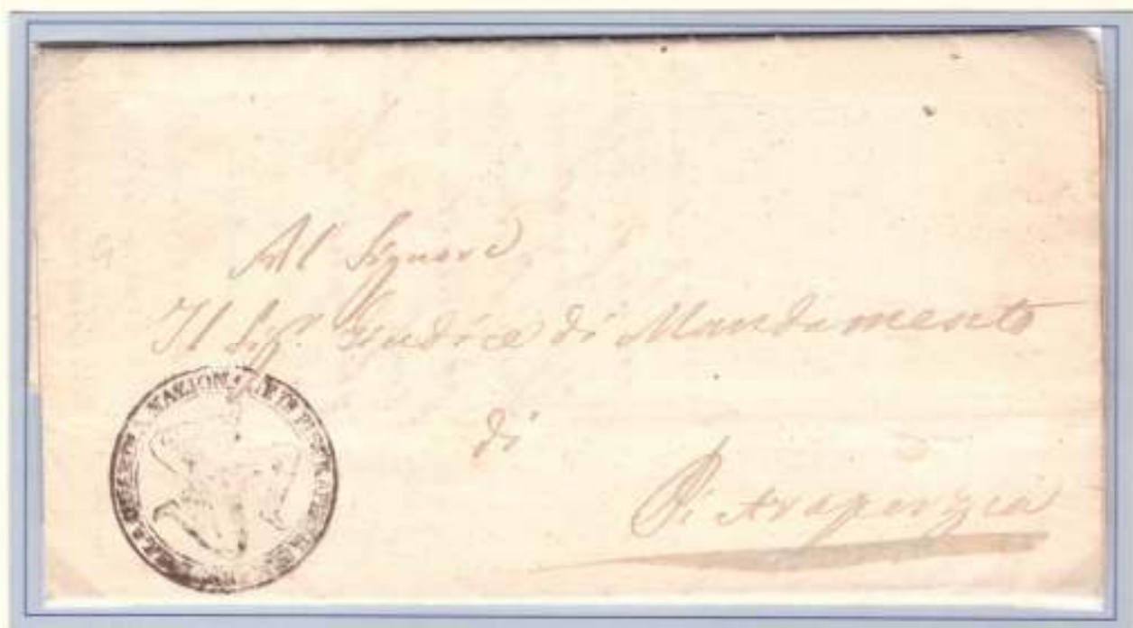
11 Aprile 1861-Da Pietraperzia per città Trinacria del Comando della Guardia Nazionale di Pietraperzia