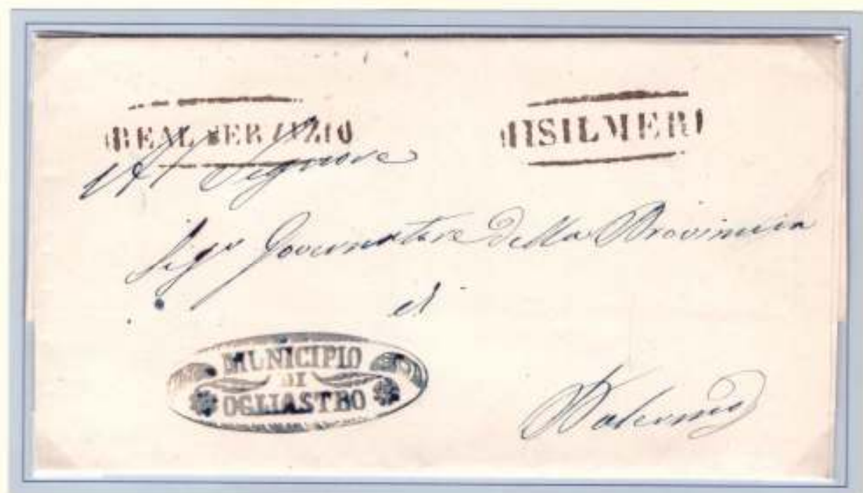
9 Aprile 1861- Da Ogliastro (l' odierna Bolognetta) a Palermo. Ovale nero dell' Officina Postale di Misilmeri e Real Servizio borbonico ormai tornato definitivamente alla ribalta. Ovale di franchigia nero-bluastro con fregi del Municipio di Ogliastro.