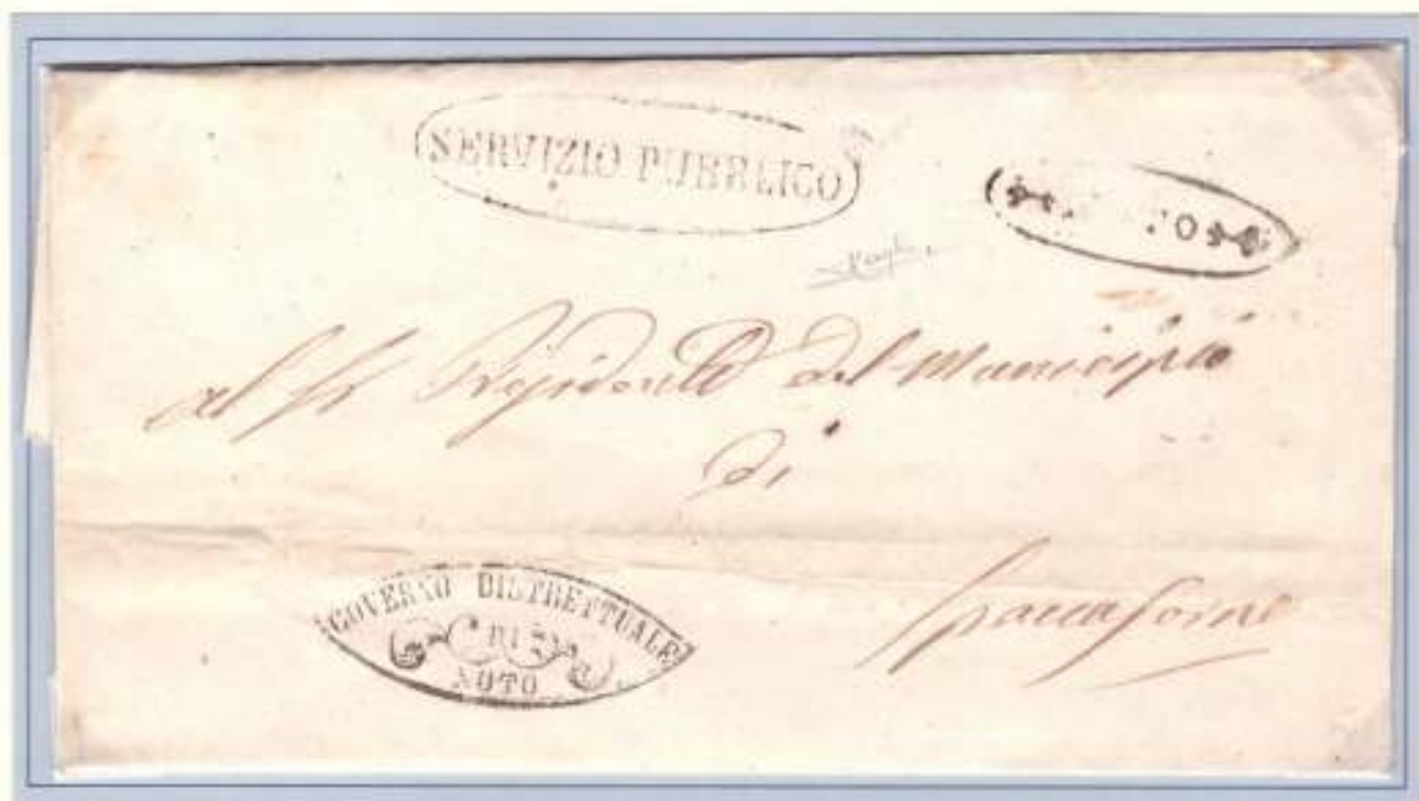
15 Settembre 1860- Da Noto (ovale nero con fregi) a Spaccaforno. Bollo di franchigia a mandorla nero con ornati del GOVERNO DISTRETTUALE DI NOTO. Ovale SERVIZIO PUBBLICO già usato durante i moti del 1848.