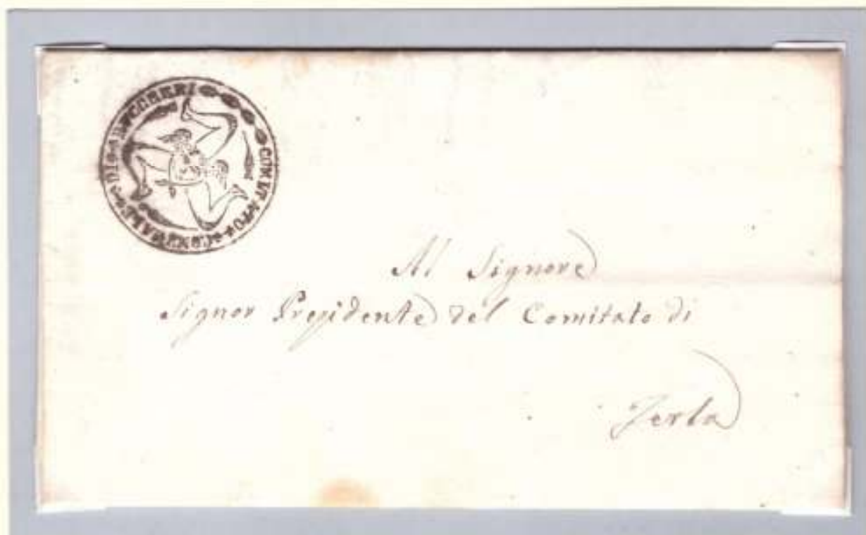
17 giugno 1860-Dal Comitato di Buccheri al Presidente del Comitato di Ferra, trinacria del comitato comunale di Buccheri