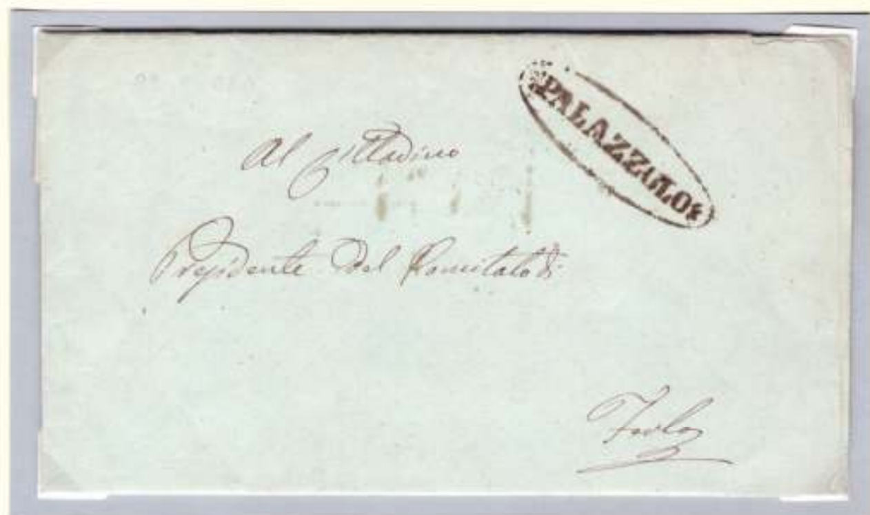
Lettera del 29 maggio 1860 dal comitato di Palazzolo al Presidente del comitato di Ferla. Viaggiata per posta (ovale nero con fregi dell' officina postale di Palazzolo)

La comparsa delle impronte postali sulle corrispondenze testimonia il ripristino e l'uso del servizio da parte dei Comitati Rivoluzionari