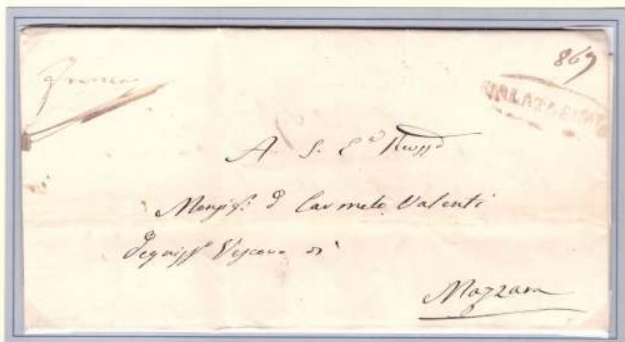
23 Gennaio 1861- Da Calatafimi (ovale bruno) a Mazzara. "Franca" manoscritto dall' ufficiale postale. Al verso taxa di 4 grana per lettera di due fogli.