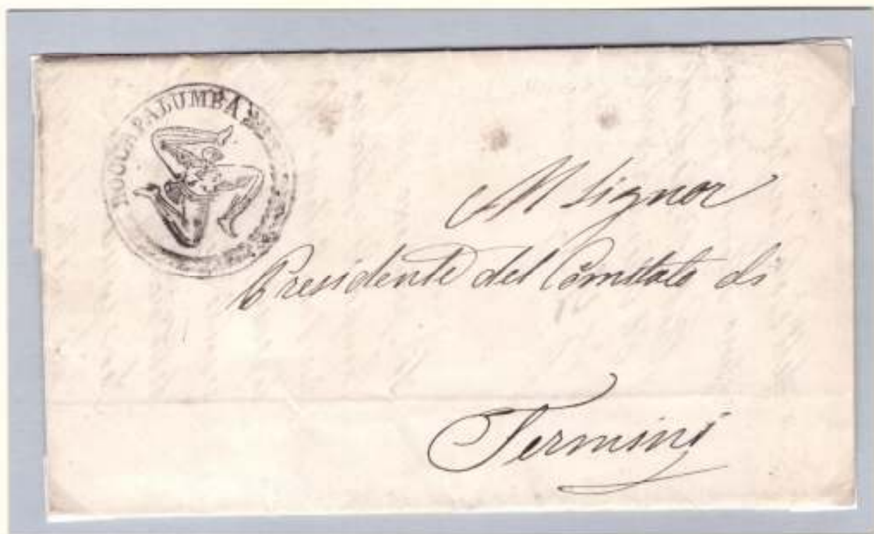
Lettera del 25 maggio 1860 dal Comitato di Roccapalumba al Presidente del Comitato di Termini (al recto Trinacria di Roccapalumba)

L'attivissimo Comitato di Termini fu il motore centrale del sostegno siciliano all'impresa garibaldina. Da Termini partivano i corrieri a centinaia per tutti i centri siciliani portando i proclami del dittatore e le notizie della campagna militare.