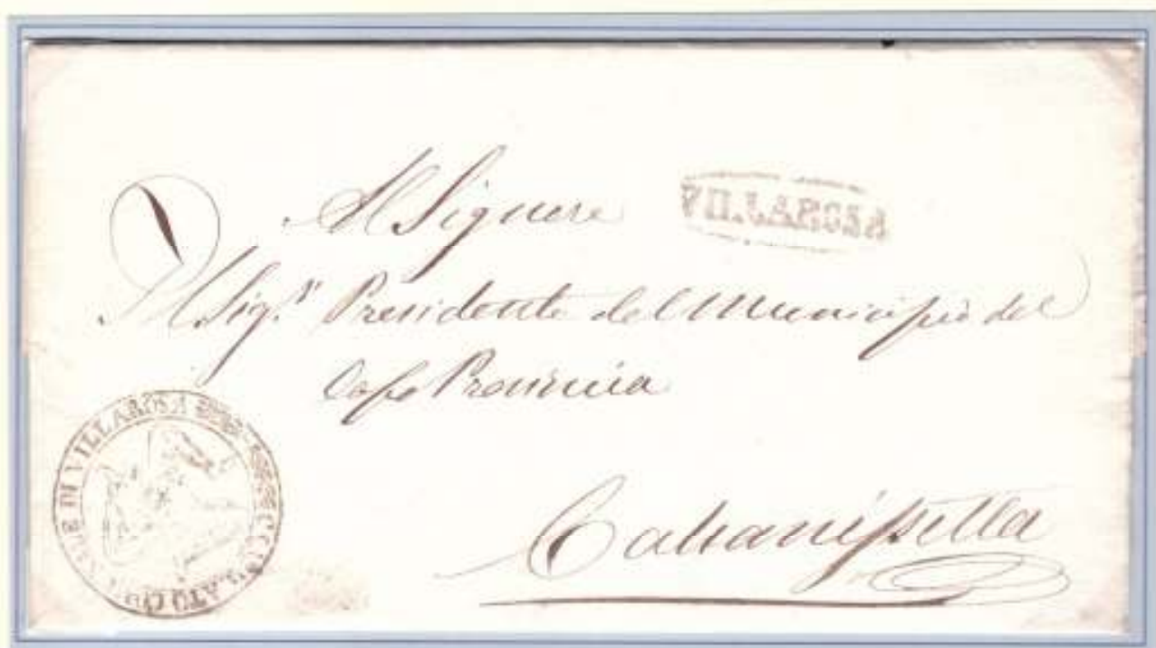
7 Novembre 1860- Da Villarosa (ovale nero) a Caltanissetta, Trinacria del Comitato Comunale di Villarosa.