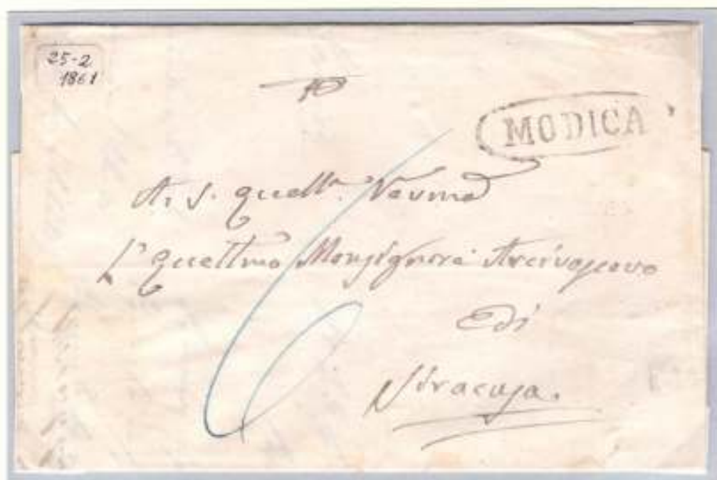
25 febbraio 1861- Da Modica (ovale nero) a Siracusa