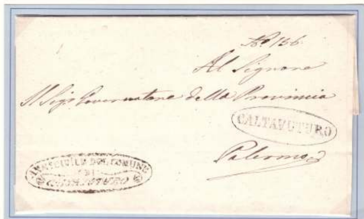
14 settembre 1860- Da Caltavuturo (ovale nero) a Palermo. Bollo di franchigia dell'Amministrazione Civile di Caltavuturo (ovale nero con ornati)

Le lettere dirette al dittatore godevano del diritto di franchigia