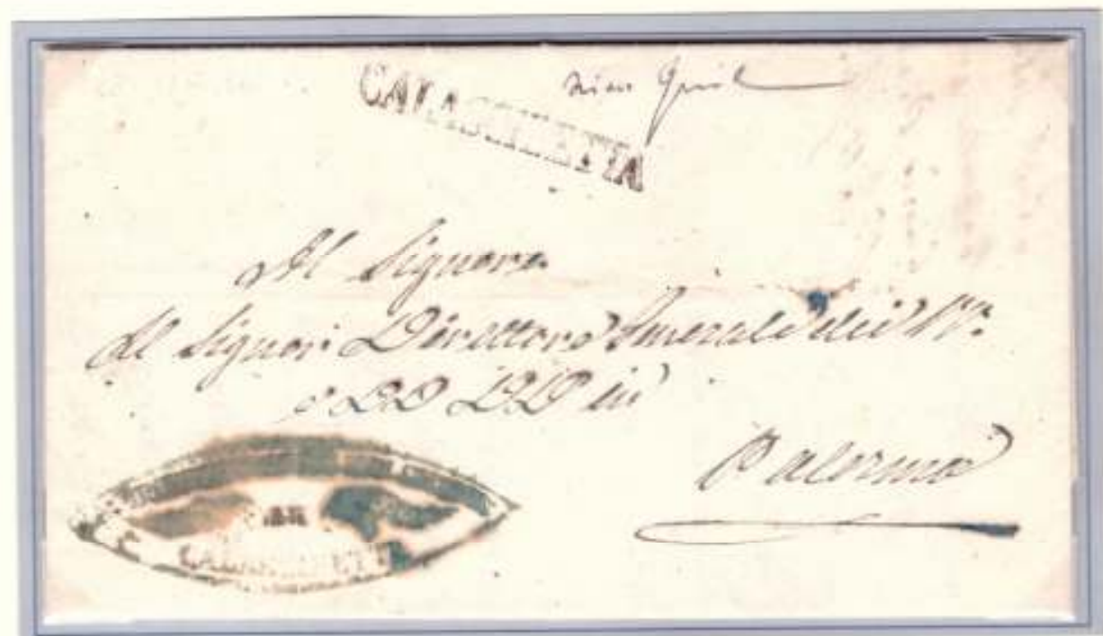
29 novembre 1860-Da Calascibetta (lineare stampatello nero) a Palermo E' una delle due sole lettere note spedite da Calascibetta in periodo dittatoriale (Ex coll. Aquila)