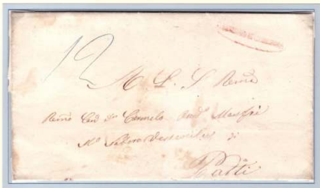
9 Gennaio 1861- Da Caronia (ovale rosso poco leggibile dell' officina postale di S.Stefano di Camastra) Tassata 12 grana per il peso di un' oncia (circa 26 grammi).