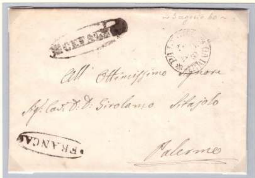
3 Agosto 1860- Da Cefalù a Palermo (datario circolare di arrivo nero 4 AGO 60). Bollo ovale nero con fregi dell' officina postale di Cefalù e bollo FRANCA con fregi della stessa officina. Al verso cifra 2, tassa di 2 grana pagata dal mittente.