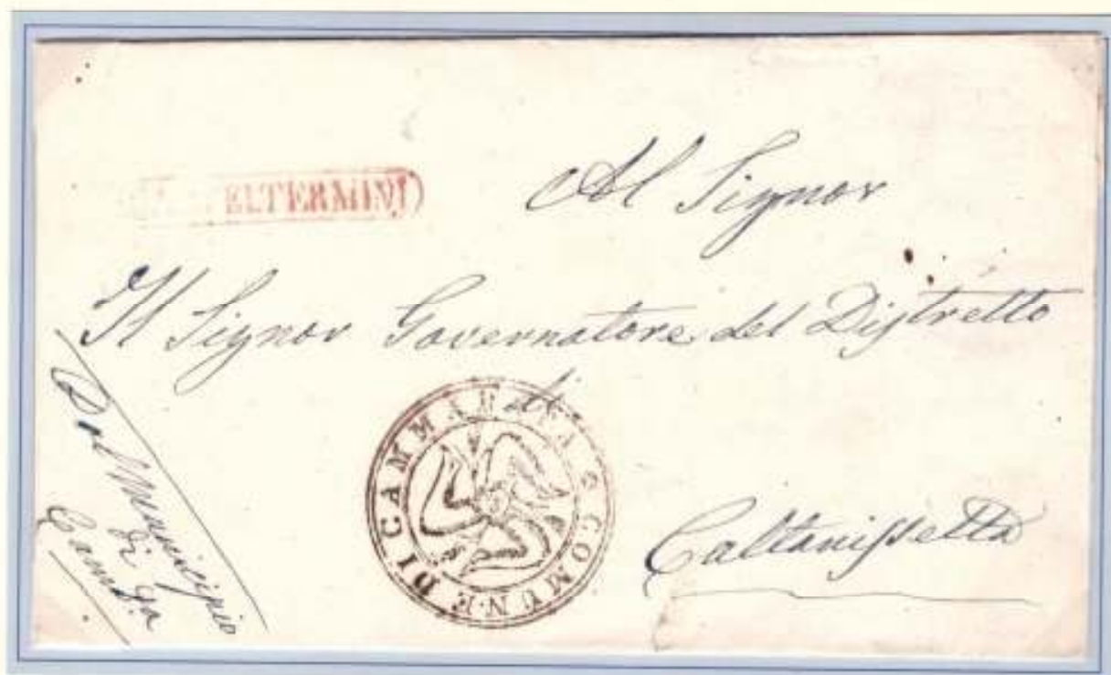
Da Casteltermini (lineare in cartella rosso) a Caltanissetta. Trinacria del comune di Cammarata.