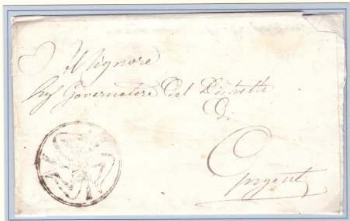
17 Luglio 1860- Da Raffadali a Girgenti. Trinacria muta del Municipio di Raffadali