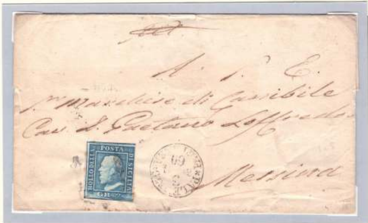
Lettera del 3 maggio 1860 da Palermo a Messina dove arriva il 6 maggio (timbro al verso) affrancata per 2 grana (un foglio)

come inusuale è l'apposizione dell'annullo capovolto sul francobollo