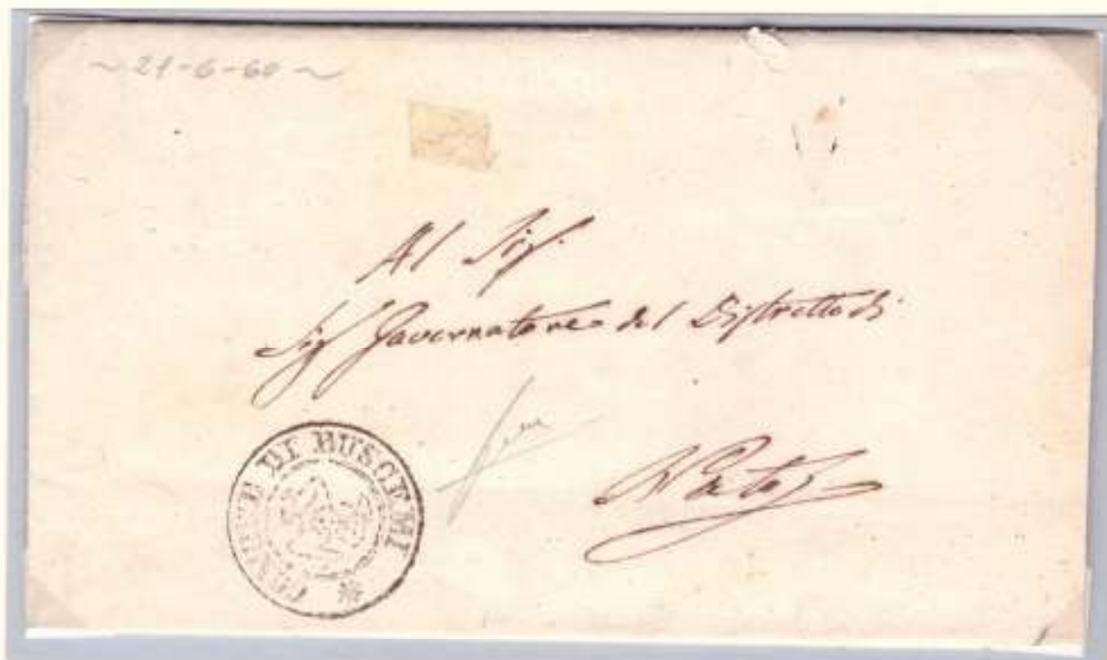
21 Giugno 1860- dal Presidente del Comitato di Buscemi al Governatore del Distretto di Noto Trinacria del Comune di Buscemi.