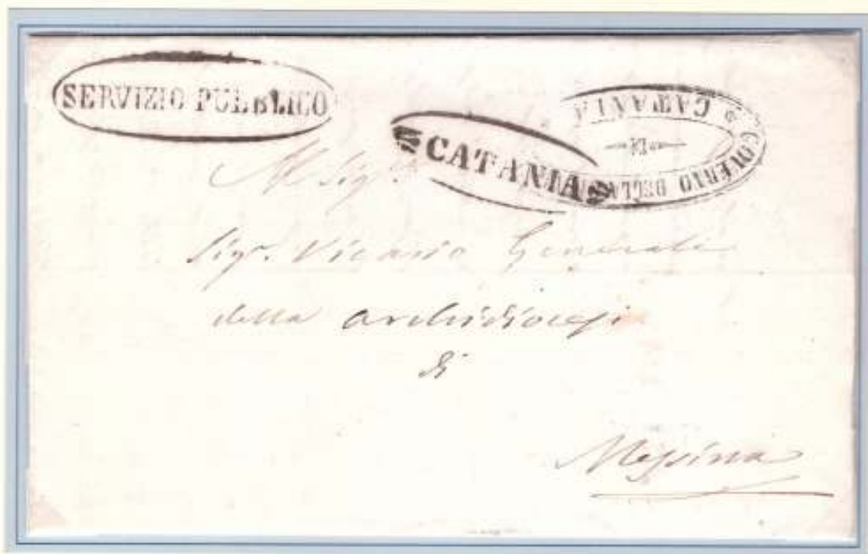
17 Aprile 1861- Da Catania (ovale nero con fregi) a Messina. "SERVIZIO PUBBLICO" ovale nero di Catania già utilizzato nel 1848.