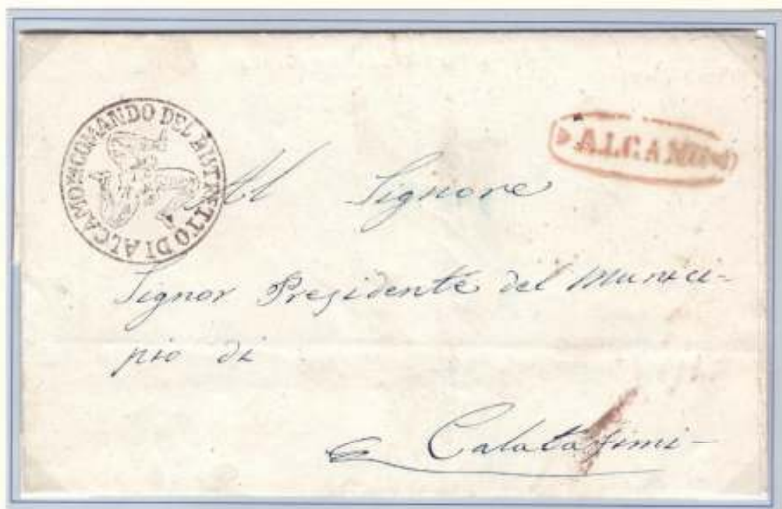
16 Giugno 1860- Da Alcamo (ovale rosso con fregi) a Calatafimi, Trinacria del Comando Distretto di Alcamo.