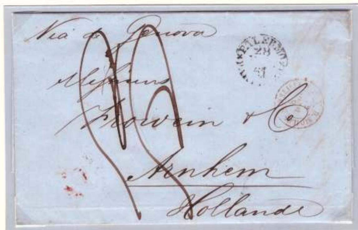
Lettera del 28 febbraio 1861 da Palermo ad Arnhem (Olanda), al verso: datario circolare rosso di arrivo 11-3-61. "Via di Genova" manoscritto dal mittente, viaggiò sul MEDEAH partito da Palermo il primo marzo 1861 e raggiunse Marsiglia l'8 marzo 1861 (bollo doganale doppio cerchio rosso). Al verso timbro ambulante Lione-Parigi. Tassata 55 cent. (convenzione franco-tedesca)