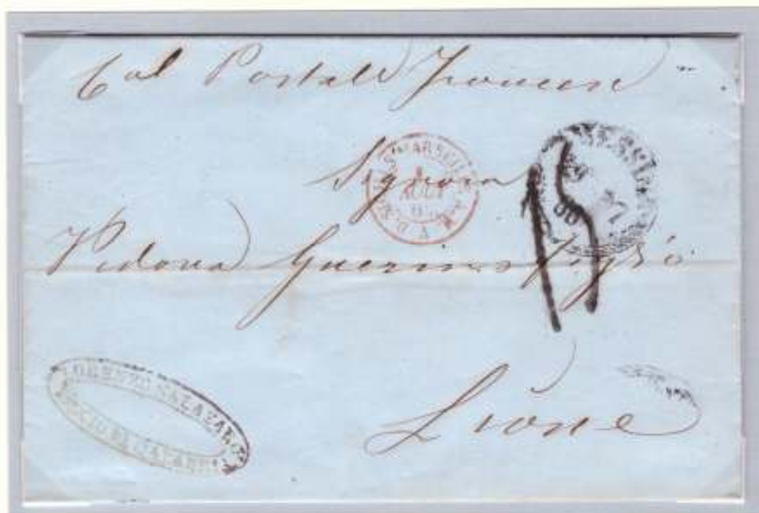
Lettera non affrancata del 29 luglio 1860 da Messina per Lione dove arrivò il 1 agosto 1860 Imbarcata sul piroscafo postale francese Neva della Linea del Levante al suo arrivo a Marsiglia fu tassata 1,5 franchi (cifra 15 a tampone) per l'inoltro sul territorio francese. E' la prima data nota di riapertura delle poste messinesi dopo la capitolazione

Alla fine di luglio l'ufficio postale fu riaperto dall'amministrazione dittatoriale subentrata a quella borbonica. La Sicilia era stata così tutta liberata