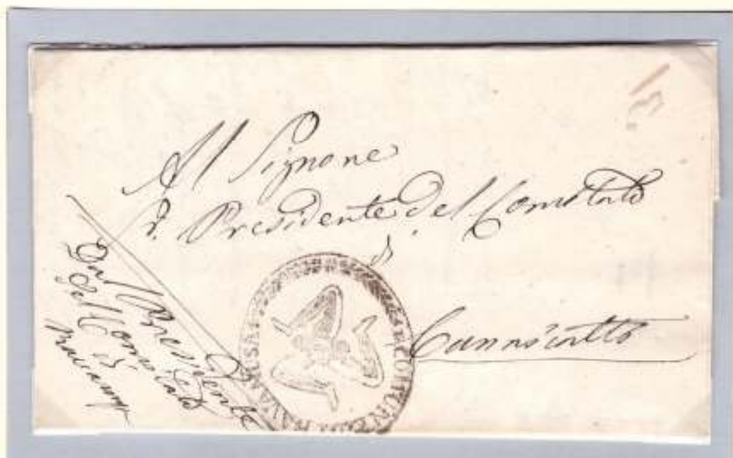
Lettera del 4 giugno 1860 dal comitato di Ravanusa al Presidente del comitato di Canicatti (Trinacria del comitato di Ravanusa)