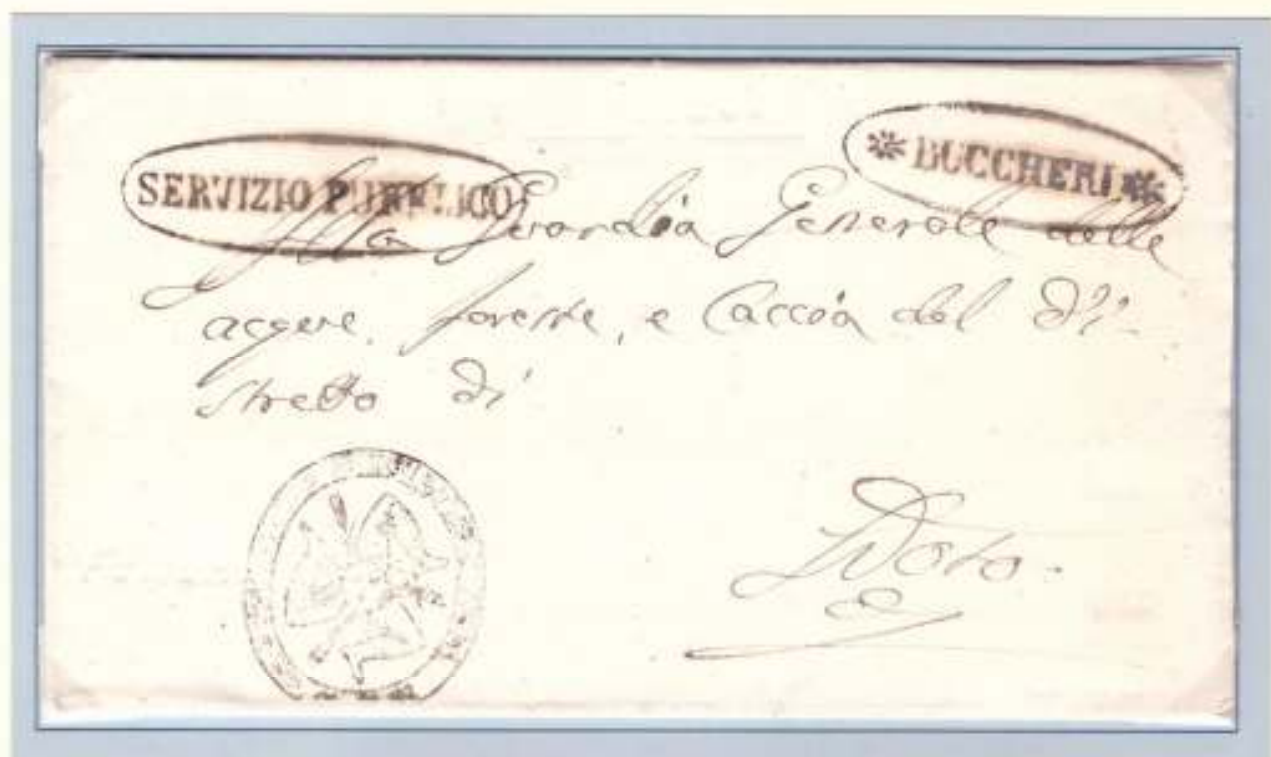
6 Luglio 1860- Da Buccheri (ovale nero con rosette) a Noto. Trinacria del Municipio di Ferla e ovale nero "SERVIZIO PUBBLICO" già utilizzato nella rivoluzione del 1848.