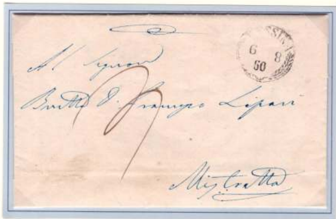
Lettera schiava da Messina (circolare a palme nero 6-8-60) a Mistretta Segno di tassa 3 (3 grana per lettere schiave di un foglio)

Riproduzione in formato ridotto di parte del testo interno