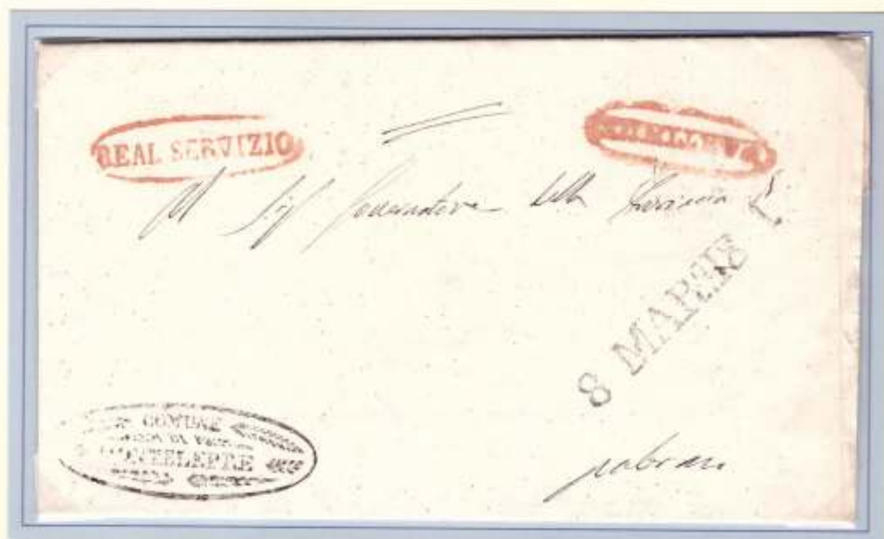
7 Marzo 1861- Da Partinico (ovale rosso nominativo e Real Servizio) a Palermo (al recto: datario di arrivo lineare nero 8 MAR o 1861). Ovale nero di franchigia del Comune di Montelepre.