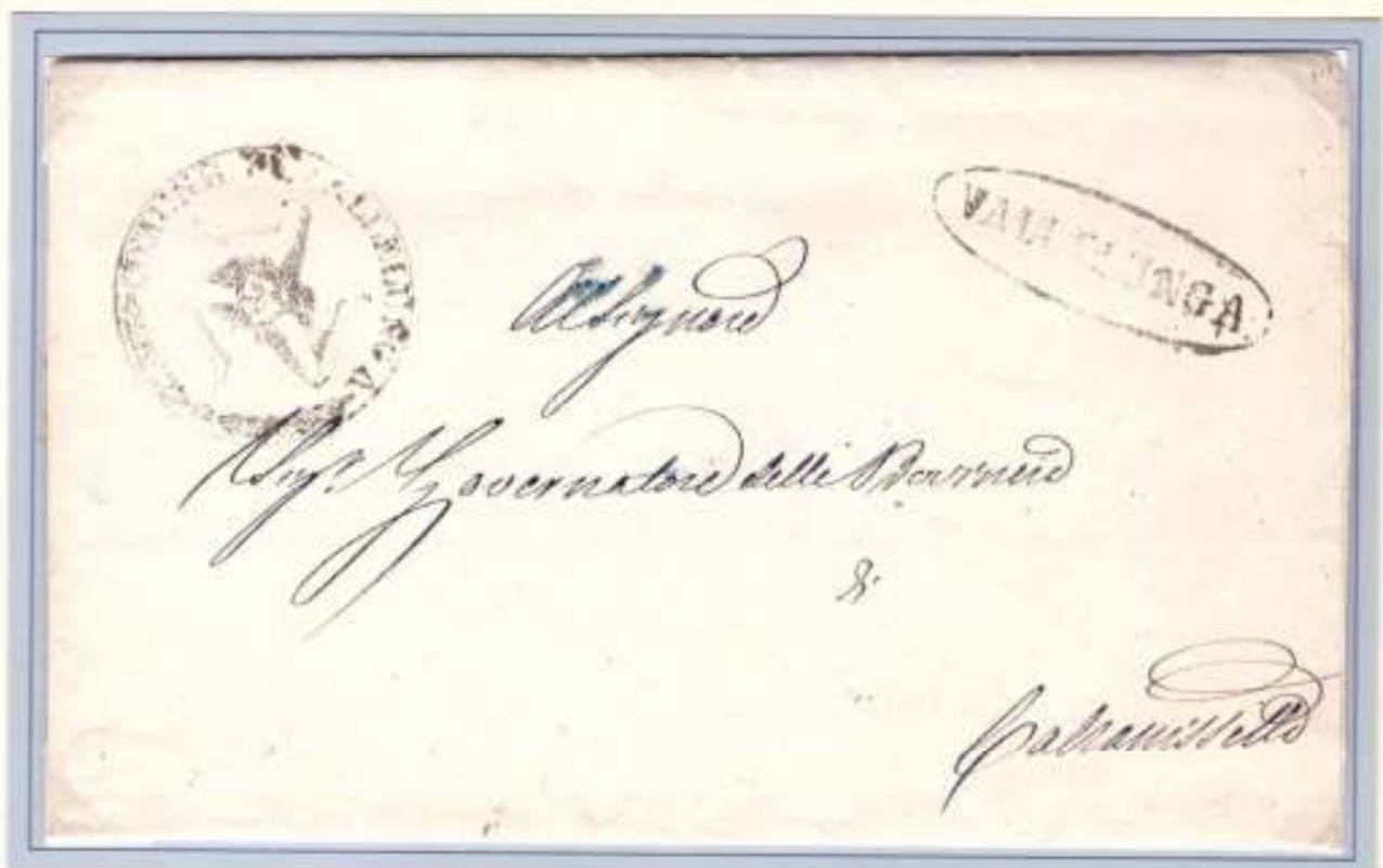
23 Novembre 1860- Da Valledlunga (ovale verde-grigiastro) a Caltanissetta. Trinacria di franchigia del COMUNE DI VALLELUNGA.