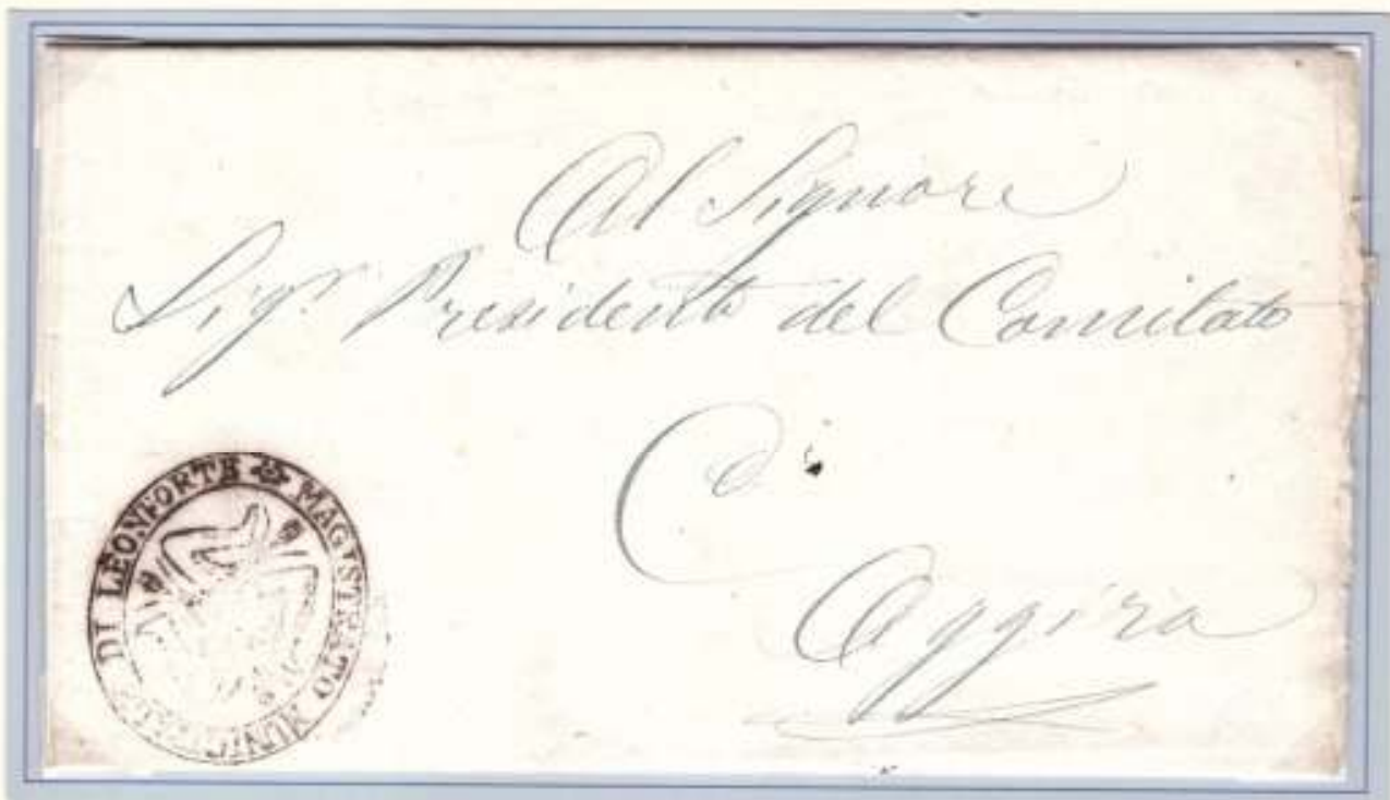
11 Giugno 1860- Da Leonforte ad Agira. Trinacria del Magistrato Municipale di Leonforte