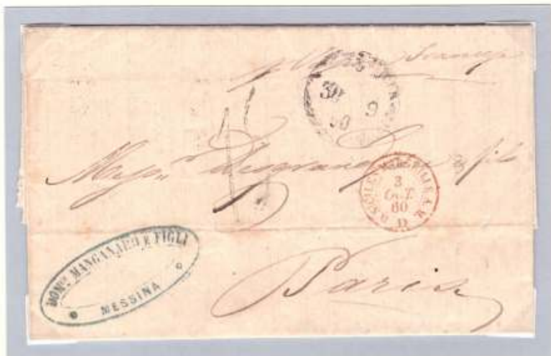
Lettera non affrancata del 30 settembre 1860 da Messina a Parigi dove arrivò il 4 ottobre 1860, il 3 ottobre sbarcò a Marsiglia dal postale francese Neva (Linea del Levante) Tassata 1,5 franchi per l'inoltro sul territorio francese