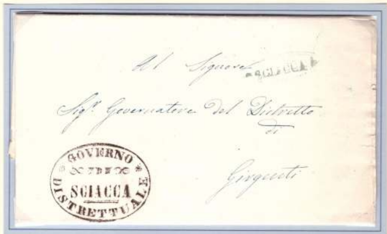
17 Luglio 1860- Da Sciacca (ovale verde con fregi) a Girgenti. Timbro di franchigia del Governo Distrettuale di Sciacca.