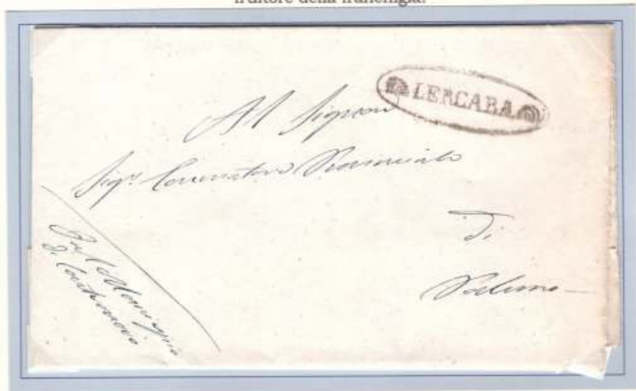
19 settembre 1860-Da Lercara (ovale nero con fregi) a Palermo (al verso: datario lineare nero di arrivo 2j SET 1860)

Gli uffici pubblici siciliani ( con qualche eccezione iniziale per gli ecclesiastici) continuarono ad usufruire delle franchigie postali loro spettanti apponendo nell' angolo inferiore sinistro sul recto delle missive il contrassegno di franchigia rappresentato da un timbro di varia forma o da una legenda manoscritta dall' ufficiale fruitore della franchigia.