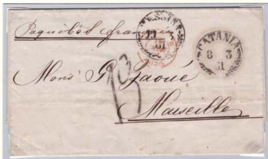
Lettera da Catania a Marsiglia dove giunse il 16 marzo (timbro doganale doppio cerchio rosso I SICILE I / MARSEILLE). Il 10 marzo fu imbarcata a Messina sul Capitol della linea indiretta d'Italia. Tassata 1,3 franchi, tariffa per Marsiglia e suo circondario.