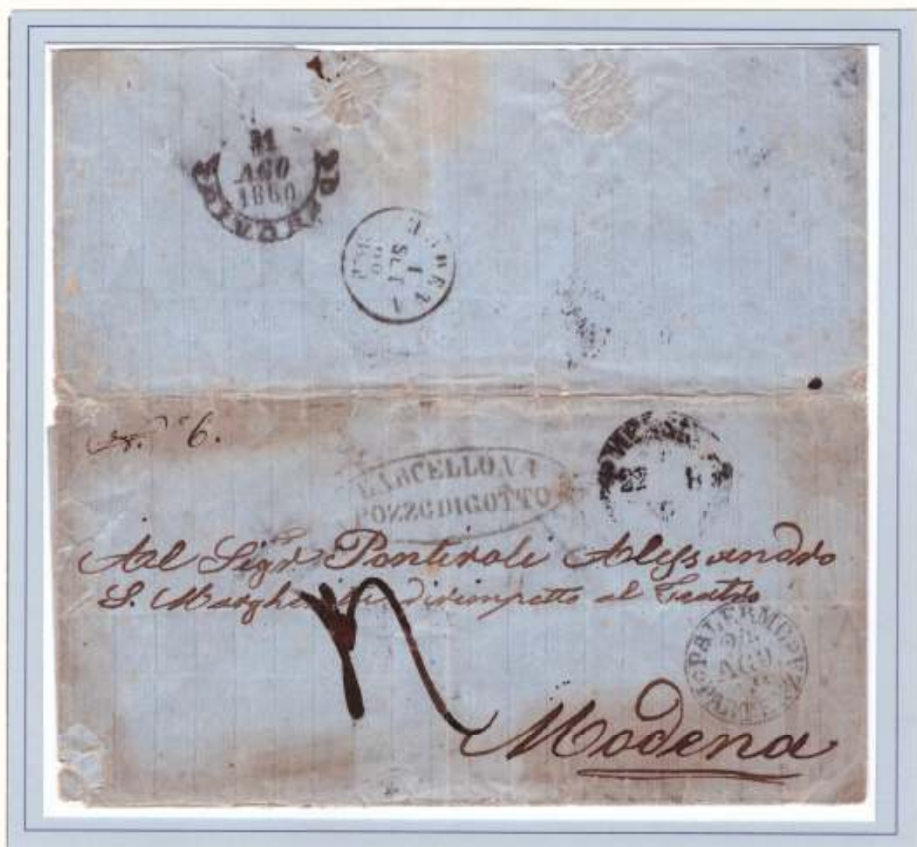
Lettera (probabilmente di un volontario) da Barcellona Pozzo di Gotto a Modena. La missiva transita da Messina il 22-8-60 (datario circolare nero a palme), prosegue per Palermo da dove parte il 24 seguente (circolare nero PALERMO PARTENZA 24-8-60) con il PROVENCE diretto a Genova per giungere a Modena il successivo 1 Settembre (timbro circolare nero di Modena). Segno di tassa 4 (4 decimi ovvero 40 centesimi di Lira). Il 22 agosto si imbarcò per la Calabria la brigata Sacchi