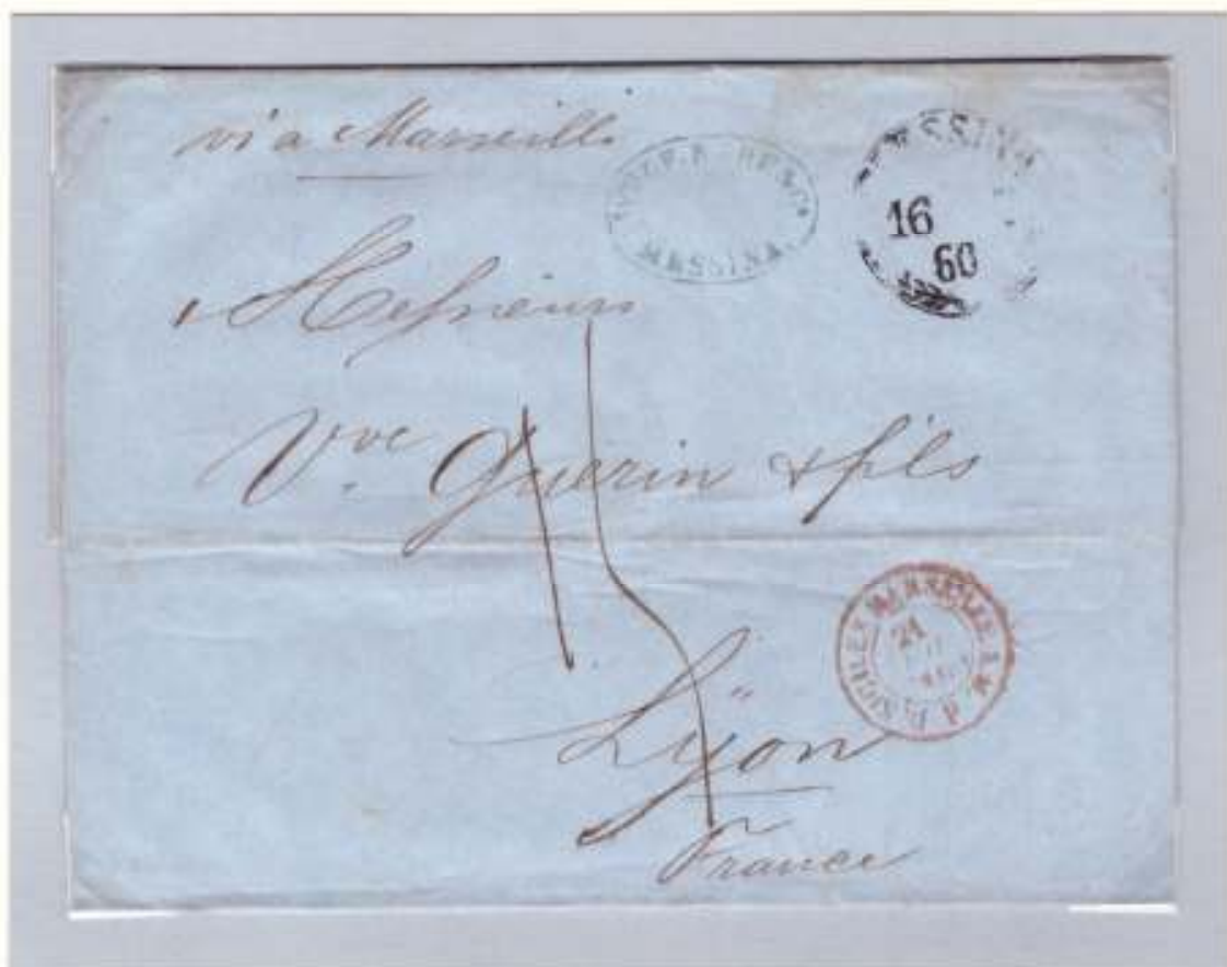
Lettera non affrancata del 16 luglio 1860 da Messina a Lione dove giunse il 22 luglio Imbarcata sul piroscafo postale francese Vatican (Linea indiretta d'Italia). Tassata in arrivo per 1,5 franchi

Alla fine di luglio l'ufficio postale fu riaperto dall'amministrazione dittatoriale subentrata a quella borbonica. La Sicilia era stata così tutta liberata