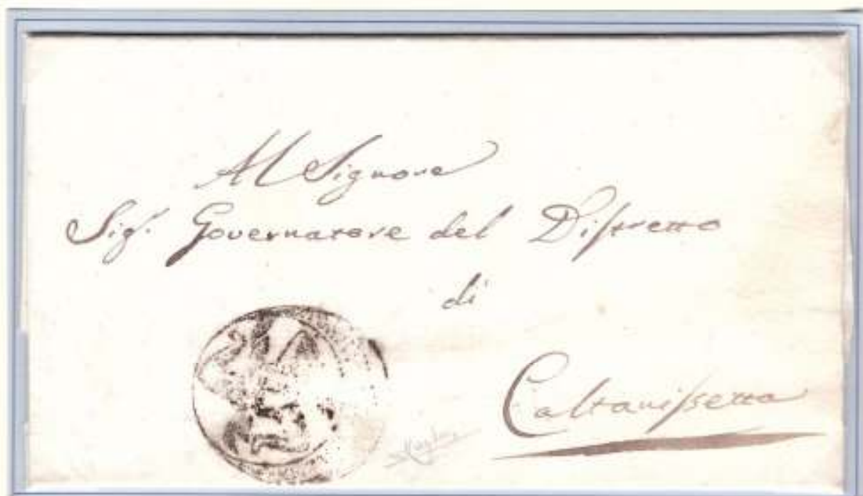
30 giugno 1860- Da Delia a Caltanissetta Trinacria dell'Amministrazione comunale di Delia