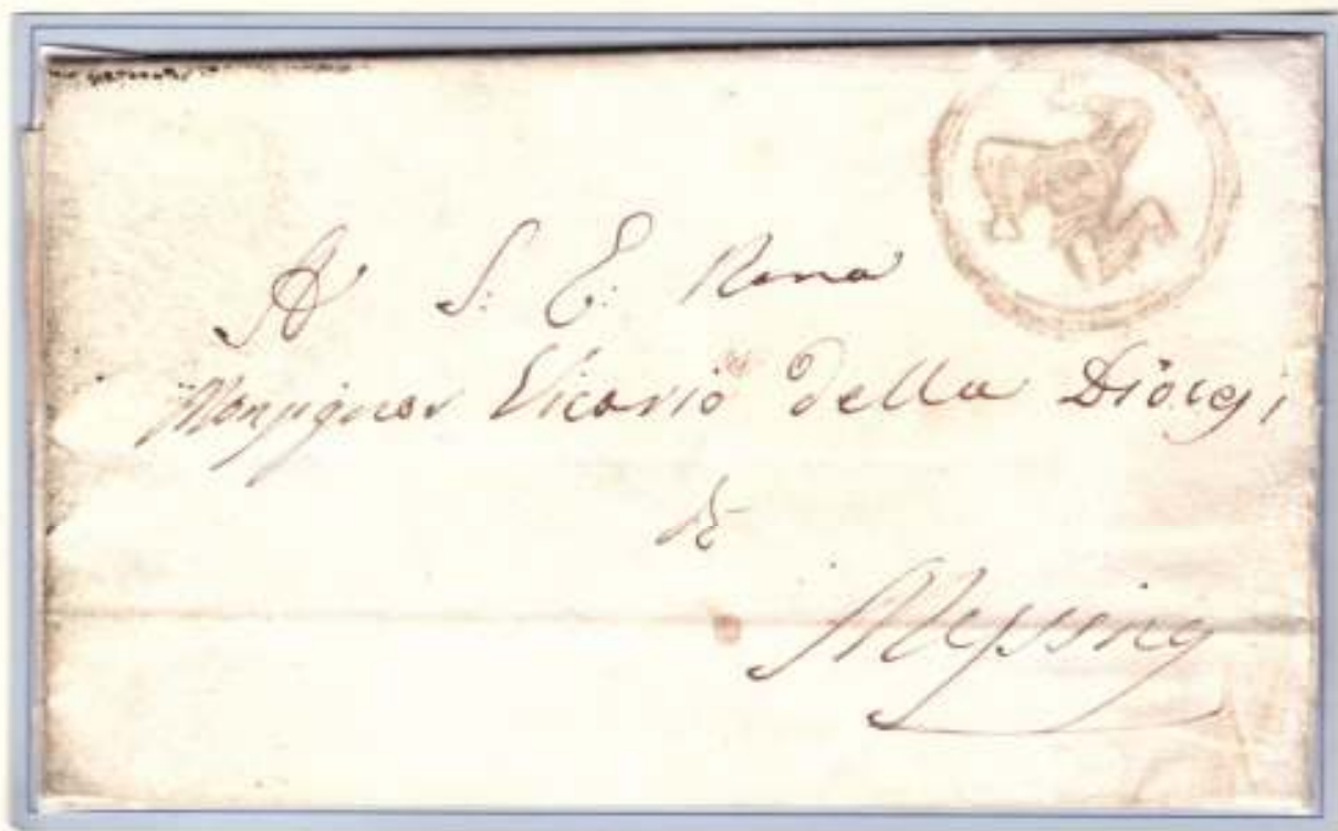
29 gennaio 1861- Da Mazzarrà a Messina Trinacria muta della Presidenza municipale di Mazzarrà