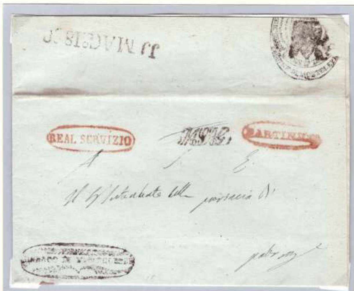
Lettera di Real Servizio del 10 maggio 1860 da Partinico (ovale rosso) a Palermo ove giunse proprio l'11 maggio 1860 (datario lineare nero di arrivo a Palermo per lettere in franchigia). Una delle ultime lettere di Real Servizio della morente amministrazione borbonica

Il postale francese cui fa riferimento il Console è proprio il Quirinal sul quale era imbarcata la lettera diretta a Cefalù ma non Garibaldi, il quale raggiunse la Sicilia con i suoi Mille a bordo dei piroscafi Lombardo e Piemonte e, quasi indisturbato, l'11 maggio 1860 sbarcò a Marsala, il 14 maggio a Salemi assunse la dittatura di Sicilia, ad Alcamo (17 maggio) nominò Francesco Crispi segretario di Stato e responsabile dei Lavori Pubblici da cui dipendeva l'Amministrazione Postale. L'avanzata lampo delle truppe garibaldine porterà il Generale ad entrare a Palermo già il 27 dello stesso mese. La Sicilia non era del tutto in mano ai garibaldini, lo sarà il 27 luglio con la capitolazione di Messina, ultima città sotto controllo borbonico.