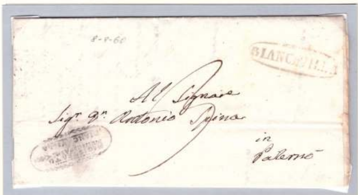
Da Biancavilla a Paternò 8 agosto 1860 Ovale nero dell'officina postale di Biancavilla