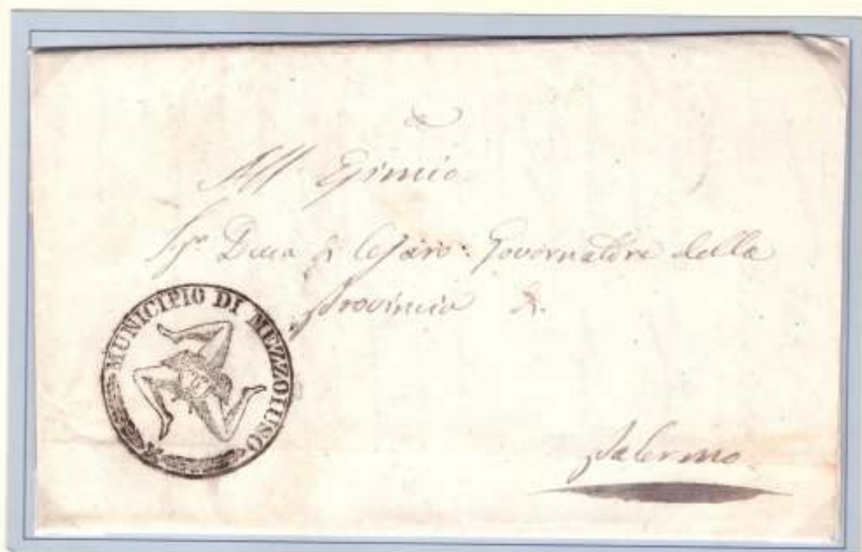
29 Settembre 1860-Da Mezzoluso a Palermo Trinacria del municipio di Mezzoluso