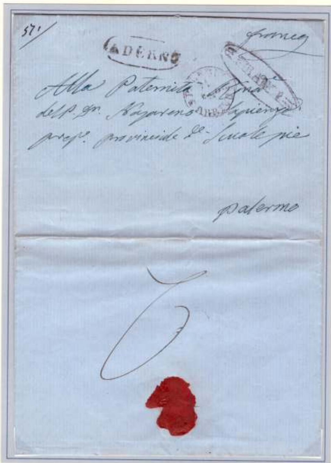
8 Febbraio 1861- Da Adernò (ovale nero) a Palermo (datario di arrivo nero 11 FEB. 61). Al recto manoscritto "franca" dal mittente e bollo FRANCA (ovale con ornati) di Vallelunga usato a Palermo nel periodo garibaldino, testimonianza dell' accentramento di questi timbri a Palermo. Al verso cifra 2 (tassa pagata dal mittente 2 grana, un foglio).