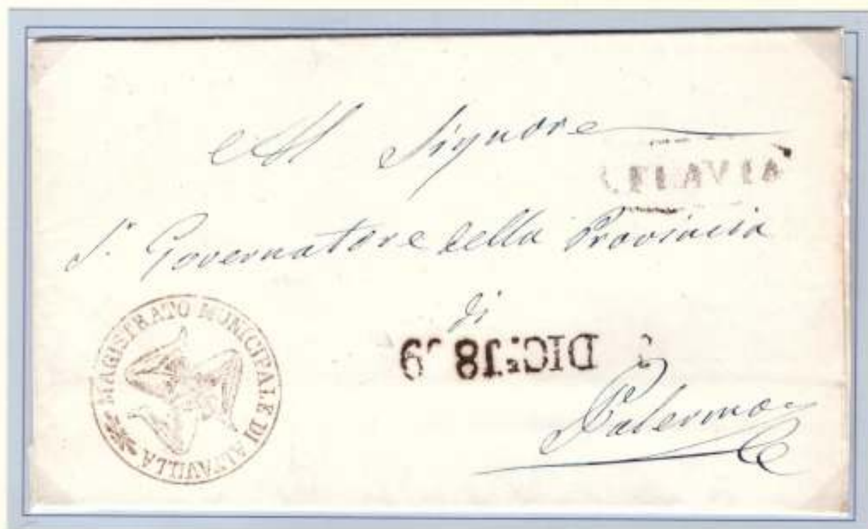
23 Novembre 1860- Da Santa Flavia (ovale nero) a Palermo (lineare di arrivo nero con le cifre dell' anno invertite., Trinacria del Magistrato Municipale di Altavilla.