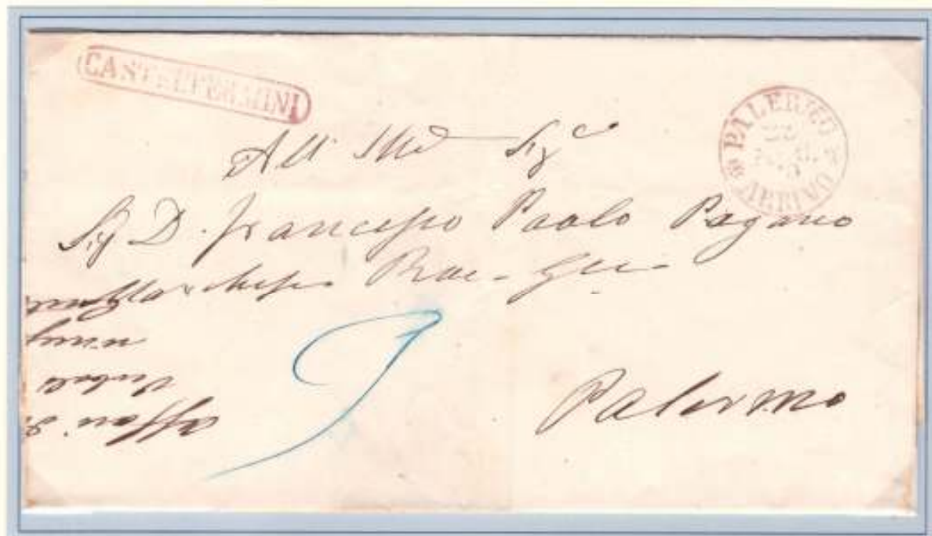
Da Casteltermini (stampatello in cartella rosso) a Palermo (datario circolare rosso PALERMO ARRIVO 29 AGO. 60) Tassa 9 grana per \frac{1}{4} di oncia.

Lettere di oltre due fogli, tassa 12 grana per oncia