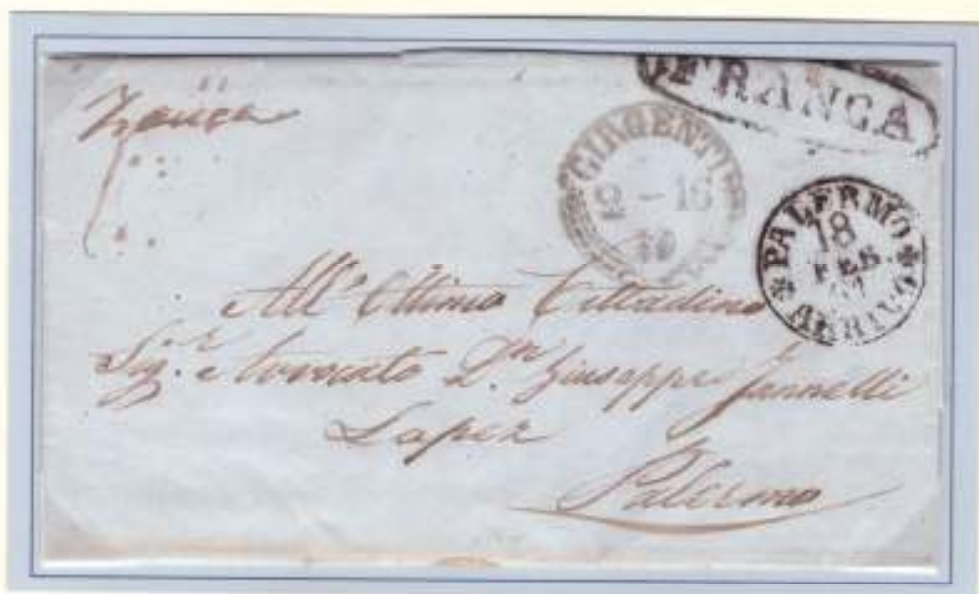
16 Febbraio 1861- Da Girgenti (datario circolare nero a palme con cifre del giorno e del mese invertite) a Palermo (datario di arrivo circolare nero 18 FEB 61). Franca manoscritto dal mittente e bollo FRANCA di Palermo apposto in arrivo. Al verso cifra 2 tariffa per lettera di un foglio.