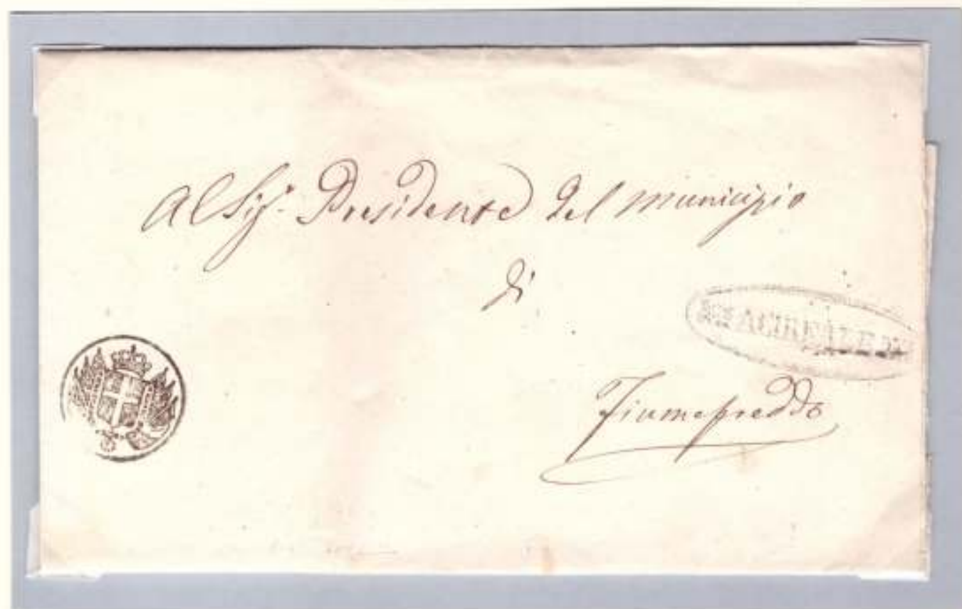
21 giugno 1860-Dal Governo del Distretto di Acireale a Fiumefreddo Bollo di franchigia con stemma sabaudo su un trofeo di bandiere