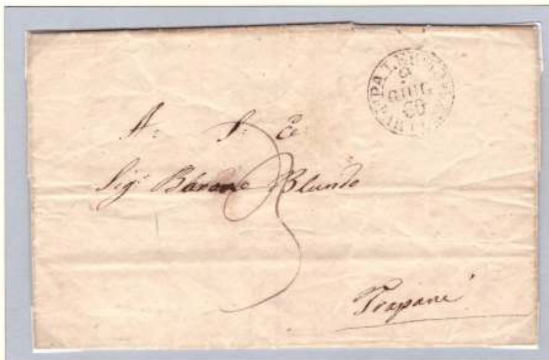
Lettera schiava del 9 giugno 1860 da Palermo (circolare nero di partenza) a Trapani Tassa 3 gr. per lettere schiave di un foglio

La conquista di Palermo avvenne il 27 maggio dopo un aspro combattimento urbano mentre la città veniva bombardata dalle artiglierie del Castello a Mare e dai vascelli borbonici. La battaglia di Palermo terminò con un armistizio, preludio della disfatta borbonica, firmato il 31 maggio rinnovato fino al 3 giugno e culminato il 6 giugno con la firma di una convenzione tra i generali borbonici e Garibaldi con la quale venne sancita la capitolazione di Palermo e la tregua per permettere l'evacuazione dei militari. Tra il 7 e il 19 giugno il distaccamento borbonico si imbarcò per Napoli abbandonando la Capitale