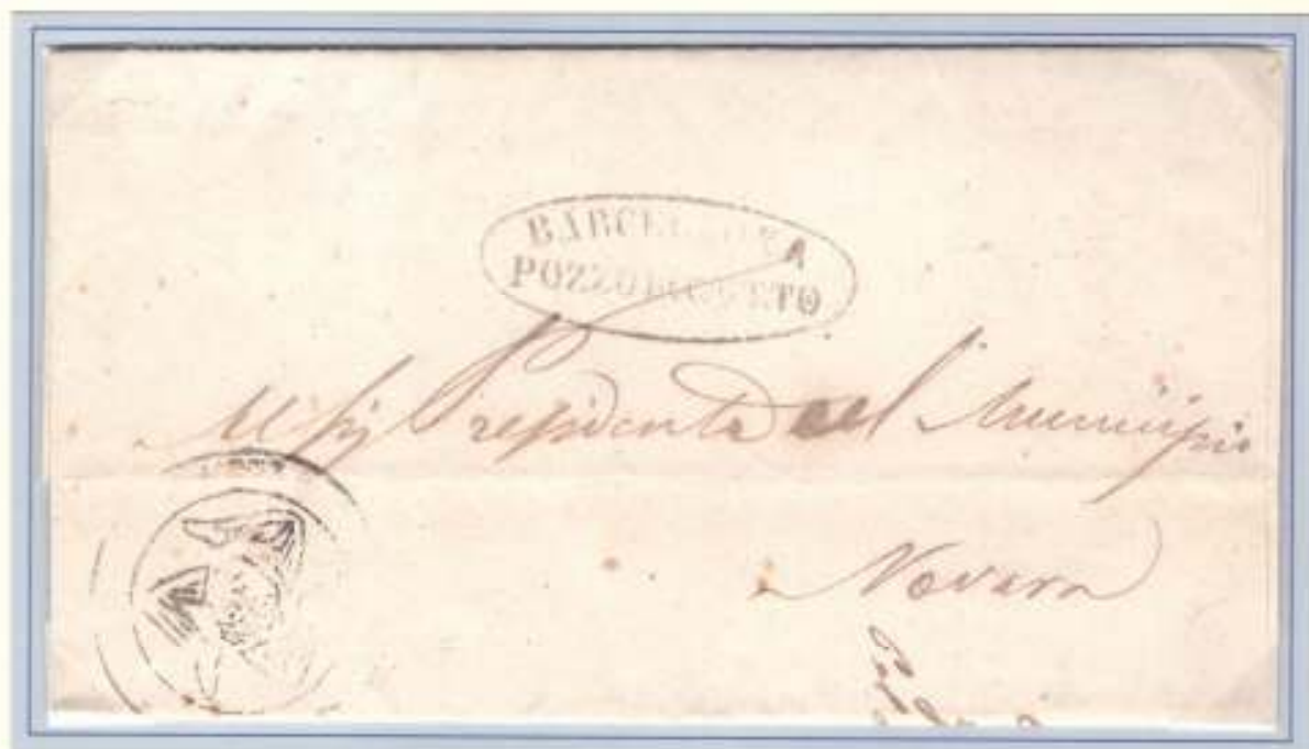
6 Luglio 1860- da Barcellona pozzo di Gotto (ovale nero) a Novara di Sicilia, Trinacria del Governo del Distretto di Castoreale.