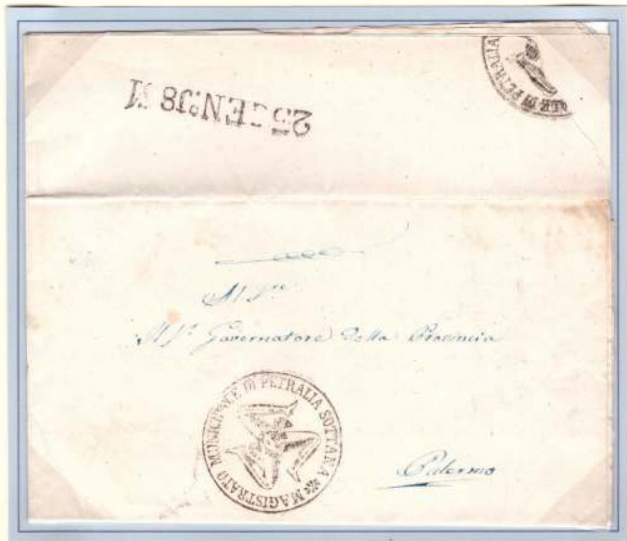
Gennaio 1861- Da Petralia Sottana a Palermo. Trinacria di franchigia del MAGISTRATO MUNICIPALE DI PETRALIA SOTTANA. Al verso, datario lineare di arrivo nero della posta di Palermo 25 GEN.°J861