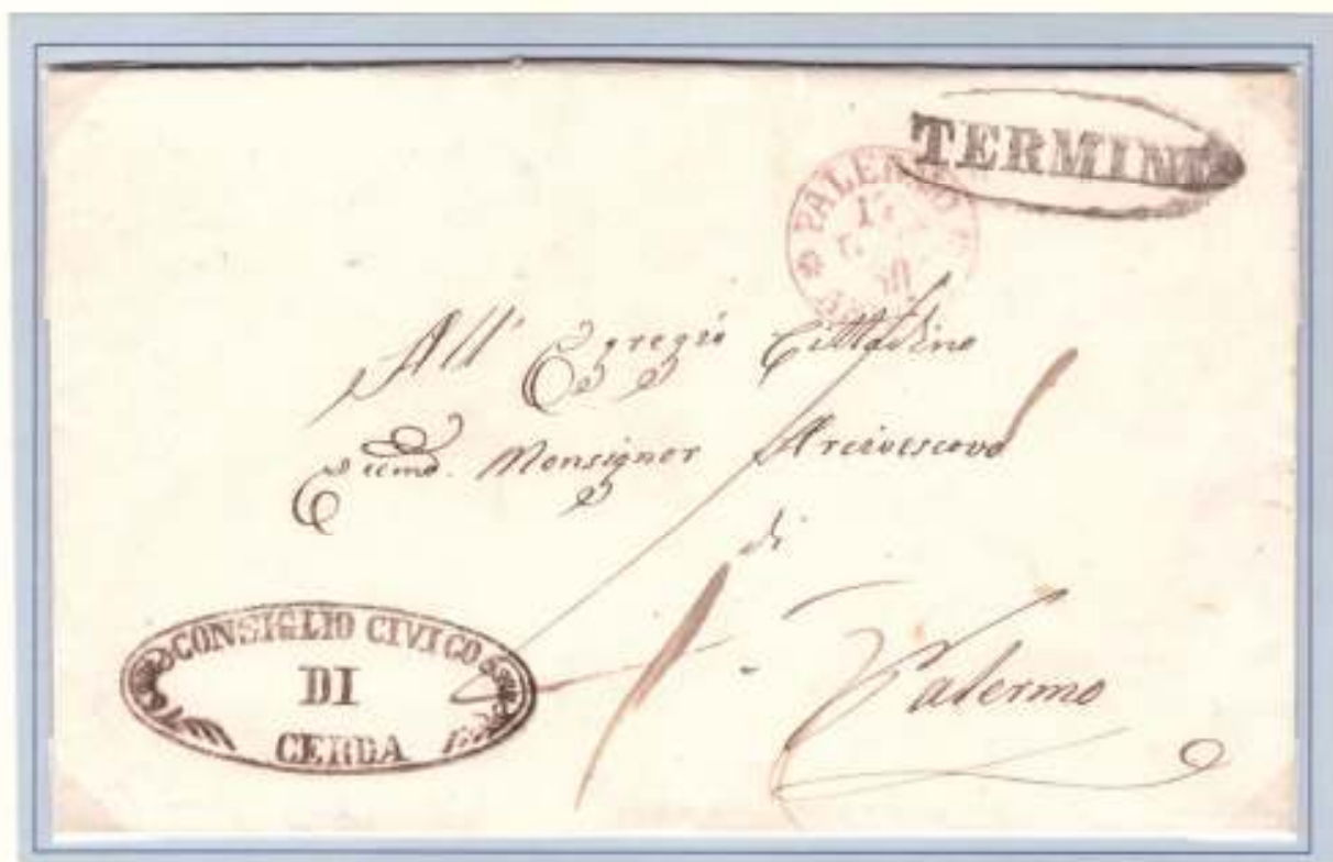
16 Ottobre 1860- Da Cerda (ovale nero di Termini, officina postale a cui Cerda era aggregata) a Palermo (datario circolare di arrivo rosso 17 OTT: 60).