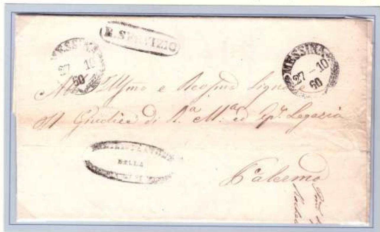
27 ottobre 1860- Da Messina (datario circolare nero a palme) a Palermo (al verso datario lineare nero 30 OTT. 1860). Bollo R.SERVIZIO ovale nero apposto a Messina

All'inizio dell'impresa garibaldina gli ufficiali postali evitarono di utilizzare, per le lettere in franchigia, il borbonico "REAL SERVIZIO" in quanto esplicito riferimento alla quasi decaduta monarchia. Quando poi apparve chiaro che si sarebbe passati ad un'altra monarchia, in special modo dopo il plebiscito di annessione celebratosi il 21 ottobre 1860, si cominciarono a rivedere sulle lettere d'ufficio i bolli REAL SERVIZIO ancora presenti presso le officine postali