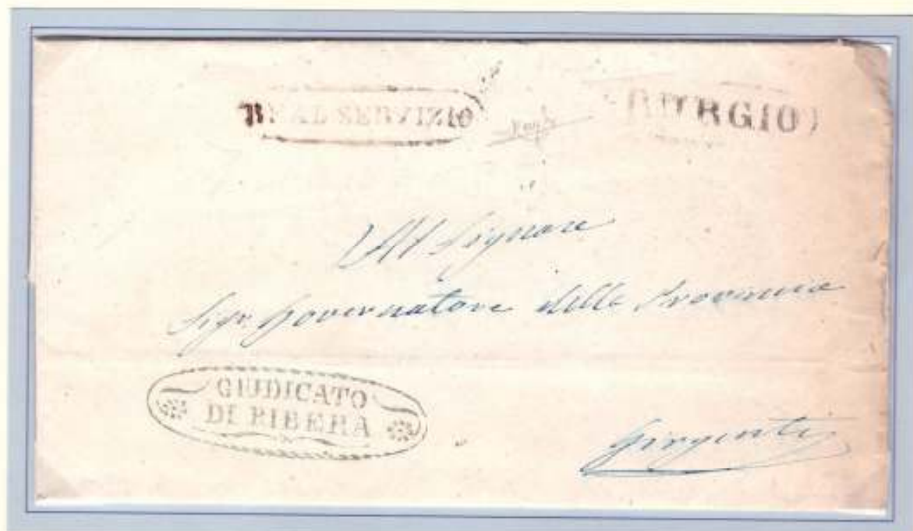
17 Marzo 1861(giorno della proclamazione del Regno d' Italia)- Da Ribera a Girgenti. Ovale nero dell' Officina Postale di Burgio e Real Servizio borbonico riutilizzato sotto il nuovo Regno.