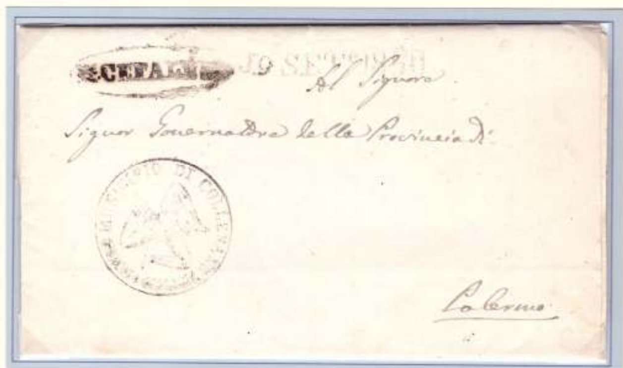
17 Settembre 1860- Da Cefalù (ovale nero con fregi) a Palermo (datario lineare nero di arrivo 19 SETT. E J860), Trinacria del Municipio di Collesano.