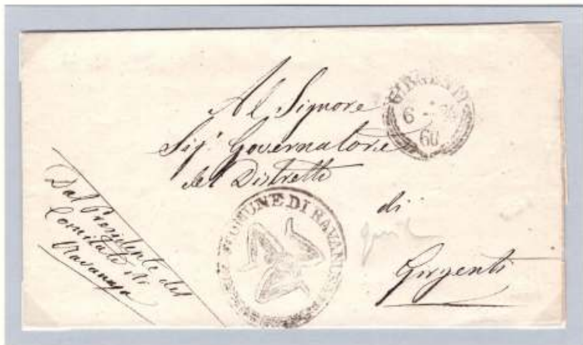
23 giugno 1860- Dal Presidente del Comitato di Ravanusa al Governatore di Girgenti. Trinacria del Comune di Ravanusa (già utilizzata nel 1848) e datario circolare nero di arrivo GIRGENTI 6-24-60 (Ex coll. Aquila)

Fin dall'antichità la Sicilia fu raffigurata con la trinacria. Essa rappresentò il primo simbolo dell'identità di un popolo e di un territorio. Nella rivoluzione del 1848 la trinacria fu adottata dai siciliani per dimostrare l'indipendenza da Napoli. Le aspettative del popolo siciliano dopo lo sbarco di Garibaldi fecero sì che l'impresa dei Mille fosse vissuta come l'alba di una nuova rivoluzione e di una nuova indipendenza e così quasi subito il vecchio simbolo nascosto da dodici anni venne immediatamente riutilizzato dai Comitati Rivoluzionari che in ogni parte dell'Isola si formavano per sostenere l'impresa garibaldina. La trinacria rappresentò uno speciale simbolo di franchigia che si ritrova su alcune lettere d'ufficio viaggiate in quel periodo. Il suo uso però fu limitato a pochi mesi in quanto il governo piemontese e lo stesso Garibaldi ne scoraggiarono l'utilizzo in quanto considerato simbolo indipendentista e troppo...rivoluzionario.