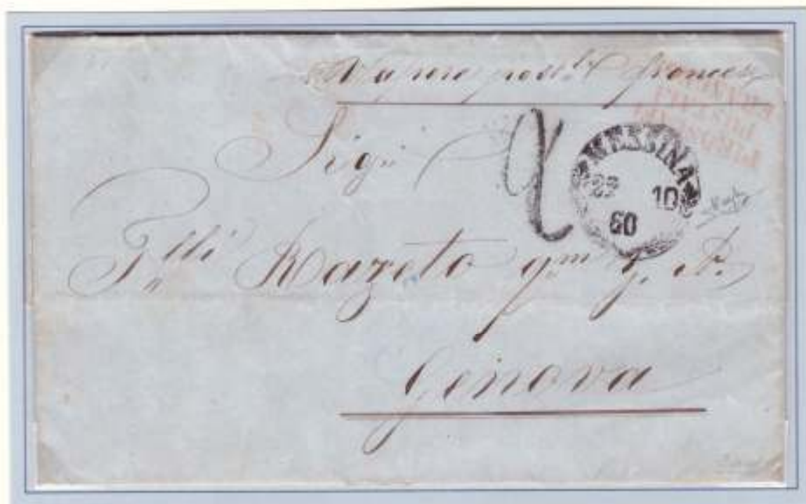
22 Ottobre 1860- Da Messina (datario circolare nero) a Genova (al verso: datario di arrivo rosso 26 OTT 60). "Vapore postale francese" manoscritto dal mittente, timbro su tre righe rosso PIROSCAFI POSTALI FRANCESI. Segno di tassa 2 (decimi ovvero 20 centesimi di lira) a tampone nero apposto in arrivo a Genova. Lettera trasportata dal Quirinal sulla Linea indiretta d'Italia, partito da Malta il 20 ottobre.