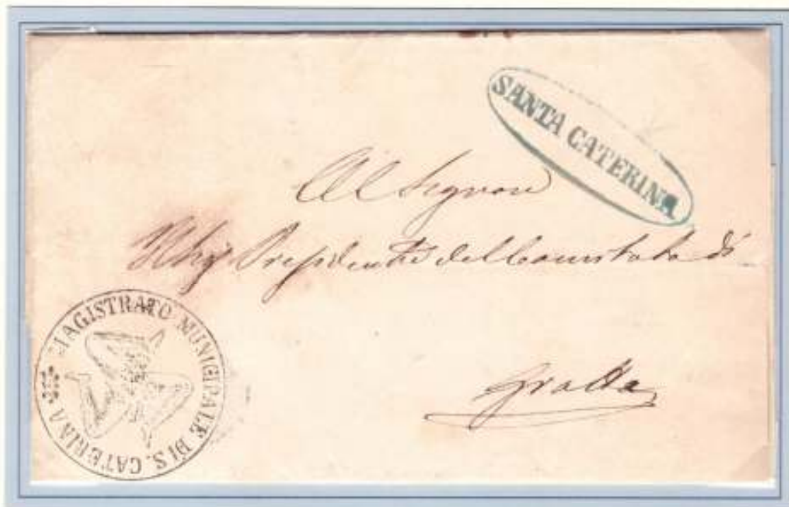
27 Maggio 1860-Lettera da Santa Caterina (ovale azzurro verdastro e trinacria del Magistrato Municipale) al Presidente del Comitato Rivoluzionario di Grotte.