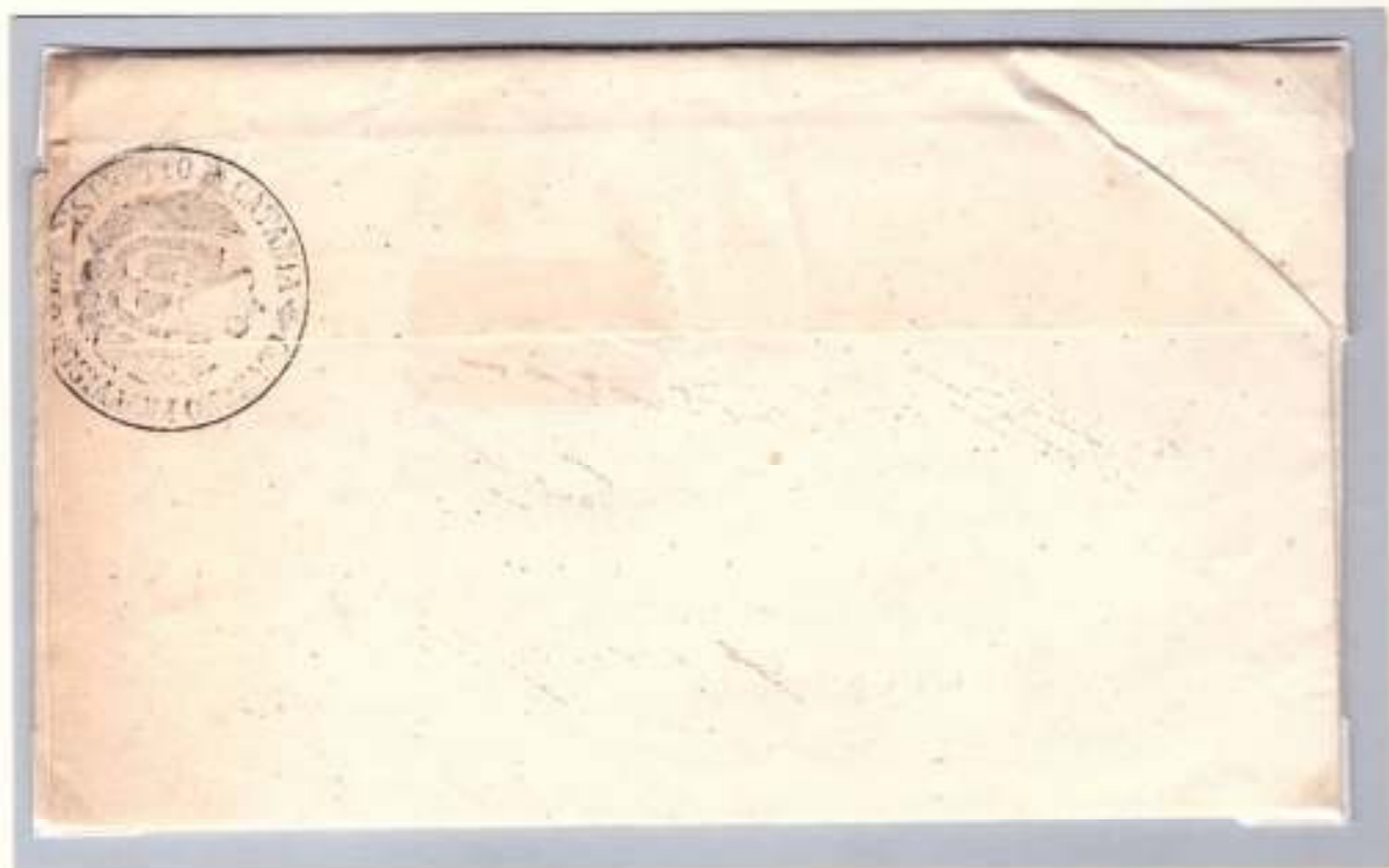
13 giugno 1860-Retro di lettera dal Governo provvisorio del Distretto di Catania al Presidente del Comitato di Fiumefreddo (al recto: ovale nero con fregi dell'officina postale di Catania) Sigillo di franchigia con stemma sabaudo

Quasi subito (già ai primi di giugno) fece la sua comparsa sulle lettere d'ufficio il simbolo dei Savoia invece della Trinacria mentre la Sicilia non era stata ancora del tutto liberata né, tanto meno, annessa al Piemonte