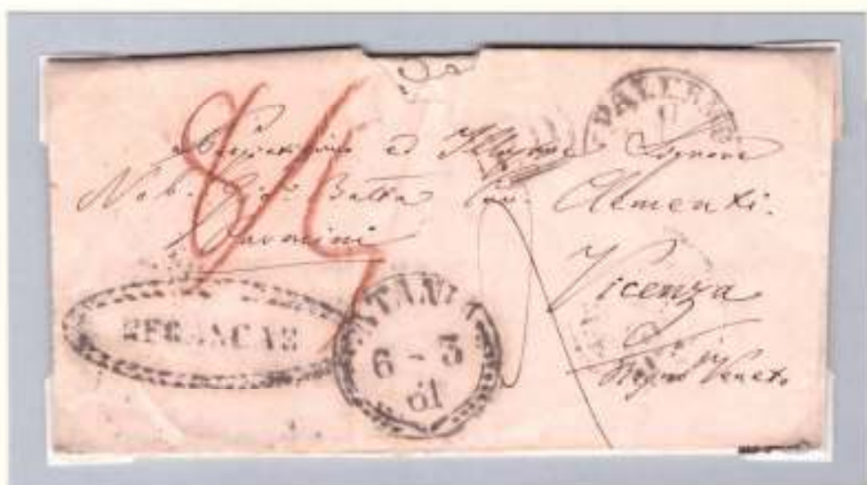
Lettera del 6 marzo 1861 da Catania a Vicenza dove arriva il 17 marzo. La lettera parte franca (ovale nero FRANCA e cifra 5 al verso) e viene imbarcata a Palermo sul vapore CALABRIA. Raggiunge Genova il 13 marzo, prosegue alla volta di Milano (bolli di transito al verso) per poi attraversare la frontiera dove viene posta la tassa austriaca (8+5 soldi)