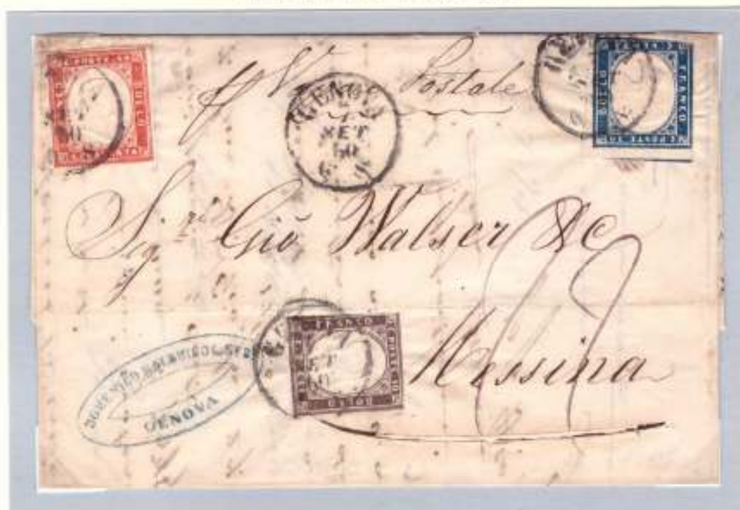
Lettera del 7 settembre 1860 da Genova a Messina dove sbarcò il giorno 11 settembre (datario di Messina circolare al verso). Affrancatura di 70 c.mi, tariffa di primo porto dagli Stati Sardi per il Regno delle Due Sicilie. Viaggiò sul Vatican (Linea indiretta d'Italia), fu il primo postale francese a toccare Napoli dal 7 settembre sotto il governo dittatoriale di Garibaldi. Tassata all'arrivo per 22 grana.