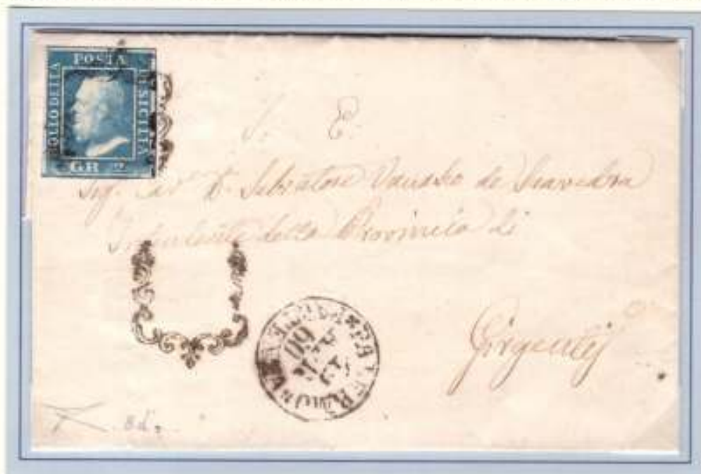
Lettera da Palermo a Girgenti del 19 aprile 1860 affrancata per 2 grana (un foglio)

Intanto qualche impiegato postale dimostra un malcelato sentimento antiborbonico con i mezzi che ha a disposizione: l'annullo a ferro di cavallo impresso a vuoto e rivolto verso l'immagine di Ferdinando II presente sui francobolli è assolutamente inusuale