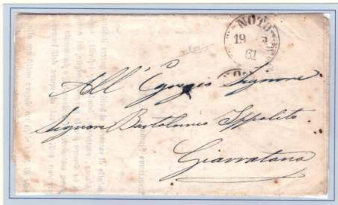
19 Febbraio 1861- Da Noto (datario circolare nero a palme) a Giarratana. Segno di tassa \frac{1}{2} : (mezzo grano per stampe di un foglio) purtroppo quasi illeggibile.

Il regolamento postale del 1859 prevedeva per i giornali e le stampe la francatura forzata con la tariffa di mezzo grano per ogni foglio. Sia la tariffa che la francatura forzata furono confermate anche nel periodo di assenza di francobolli.