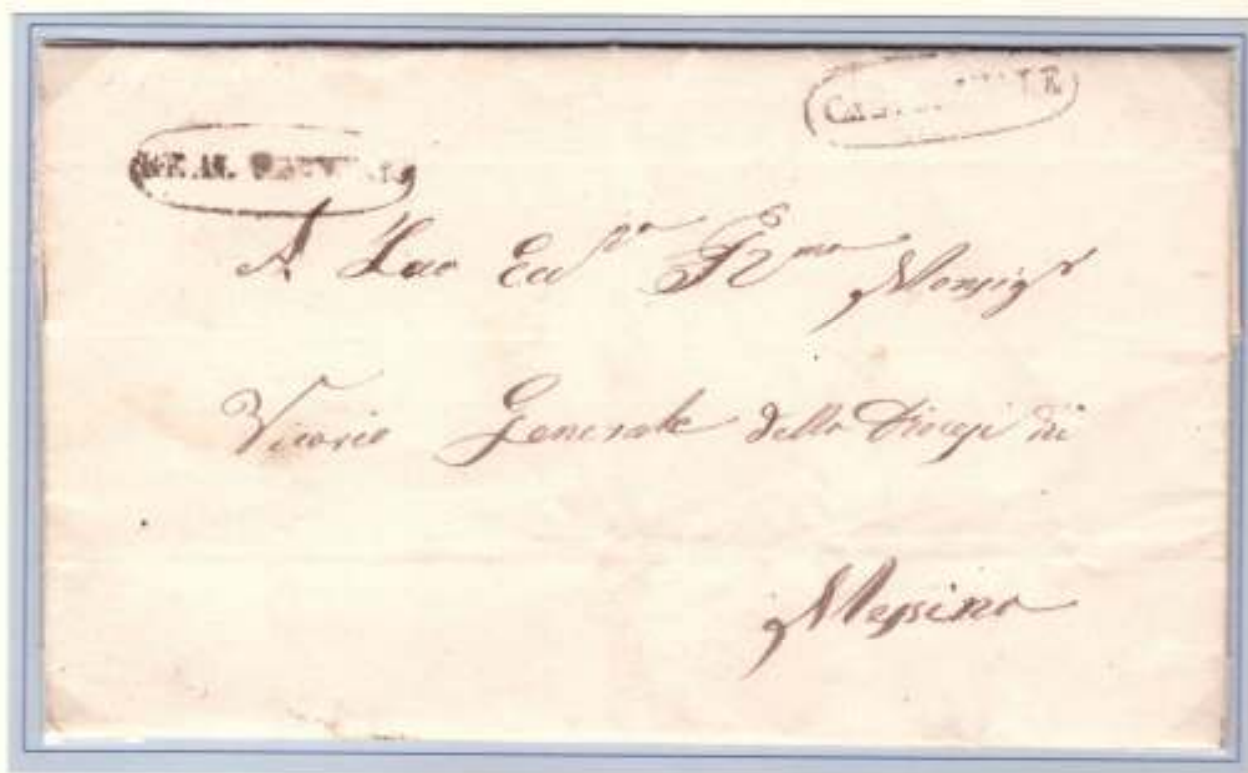
18 Dicembre 1860- Da Castrolibate (ovale nero nominativo e ovale nero di Real Servizio della stessa officina) a Messina