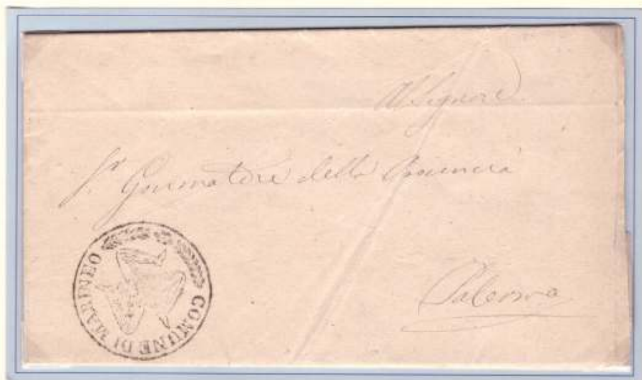
20 Ottobre 1860 (vigilia del plebiscito di annessione) Da Marineo a Palermo. Trinacria del Comune di Marineo

I Comitati Rivoluzionari prima e in seguito anche gli uffici pubblici usufruirono di collegamenti operati da corrieri espressi appositamente pagati per la consegna di lettere particolarmente urgenti da non potere attendere gli orari del corso normale delle Poste. E' il caso della lettera da Marineo a Palermo del 20 Ottobre 1860