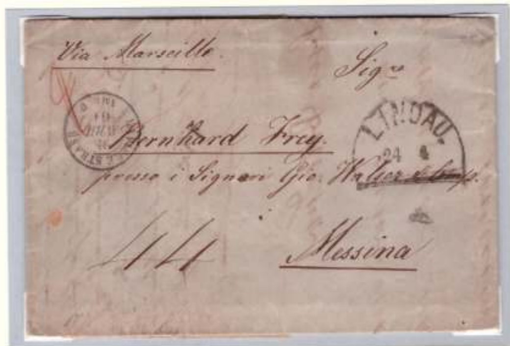
Lettera del 24 aprile 1861 da Lindau (Baviera) a Messina. Arriva via terra a Parigi (26 aprile) e poi a Marsiglia (27 aprile) dove viene imbarcata sul postale francese AMERIQUE della linea del levante. Raggiunge Messina il 29 aprile dove fu apposta la tassa di sbarco di 44 grana per lettere di doppio porto