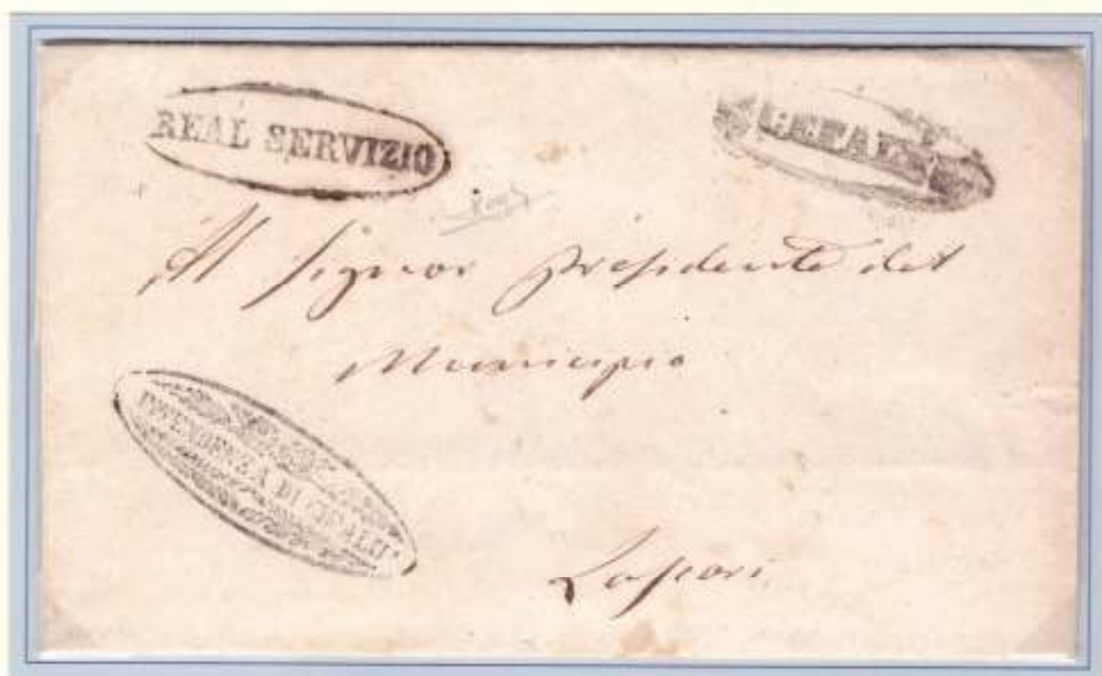
28 Aprile 1861- Da Cefalù (ovale nero con fregi e ovale nero di Real Servizio) a Lascari. Contrassegno di franchigia ovale con ornati dell' intendenza di Cefalù.