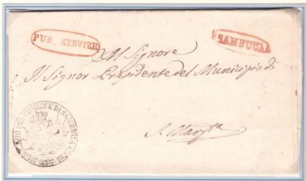
6 Febbraio 1861- Da Sambuca (ovale rosso con fregi) a S. Margherita. "PUB. SERVIZIO" ovale rosso utilizzato insieme al nominativo dell' officina postale.