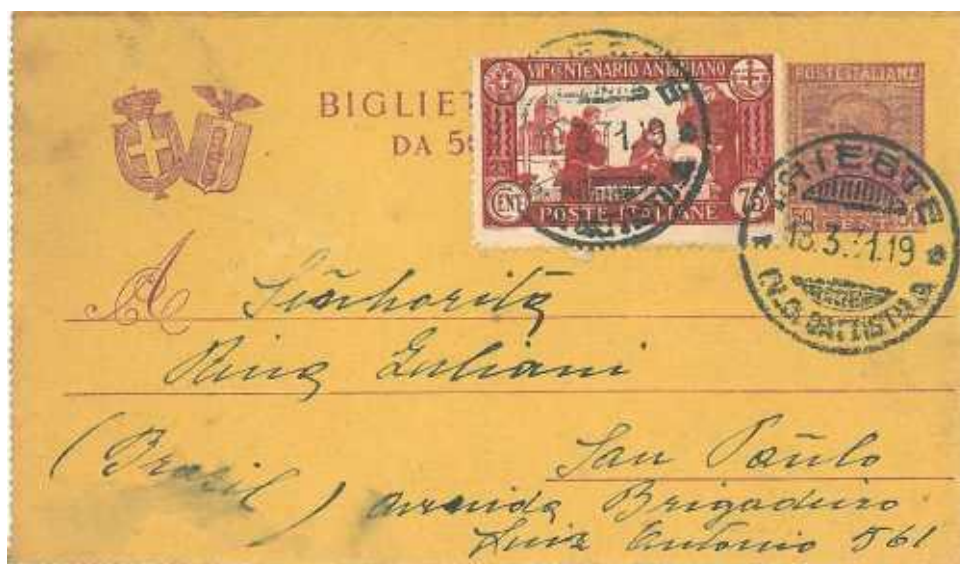
18 marzo 1931 da Trieste per San paulo in Brasile Insolita destinazione