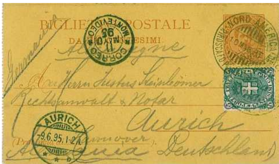
10 maggio 1895 annullo "Piroscalo postale italiano nord America" per Aurich in Svizzera Bollo di transito di Montevideo dell'11 maggio 1895. In perfetta tariffa da 25 centesimi. REGIO DECRETO 28 giugno 1892 n. 300 che concerne l'applicazione dei regolamenti per l'esecuzione di atti internazionali relativi al servizio postale: h) corrispondenze impostate a bordo dei piroscafi. Le corrispondenze impostate in alto mare a bordo dei piroscafi, postali e no, ed immesse nelle cassette speciali, o consegnate ai capitani, possono essere francate con francobolli del paese cui appartengono tali piroscafi, applicando la tariffa dei paesi stessi, cioè, l'interna per le corrispondenze ivi dirette e che il piroscafo vi trasporti da per sé, oppure l'internazionale per quelle dirette in altri paesi.