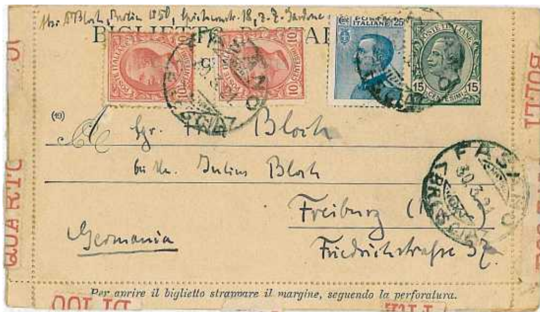
30 marzo 1921 da Fasano (Brescia) per Fribourg in Germania Bordi integri. Tariffa: 60 centesimi.