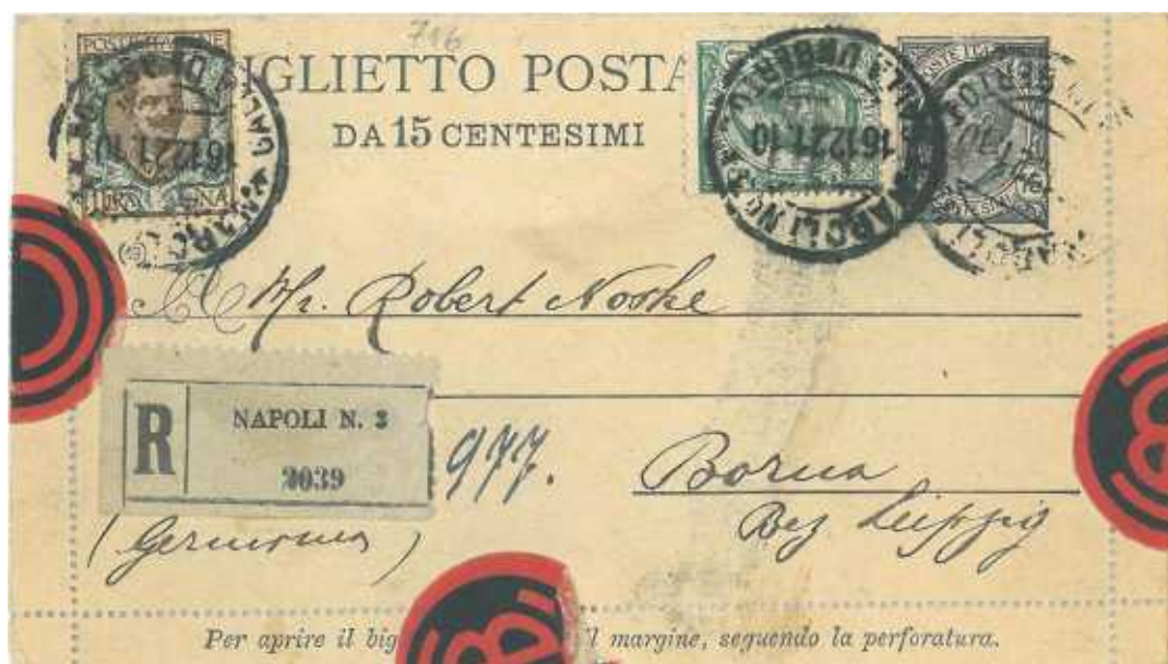
16 dicembre 1921 da Napoli per Borna in Germania Uso raccomandato. Bordi integri.