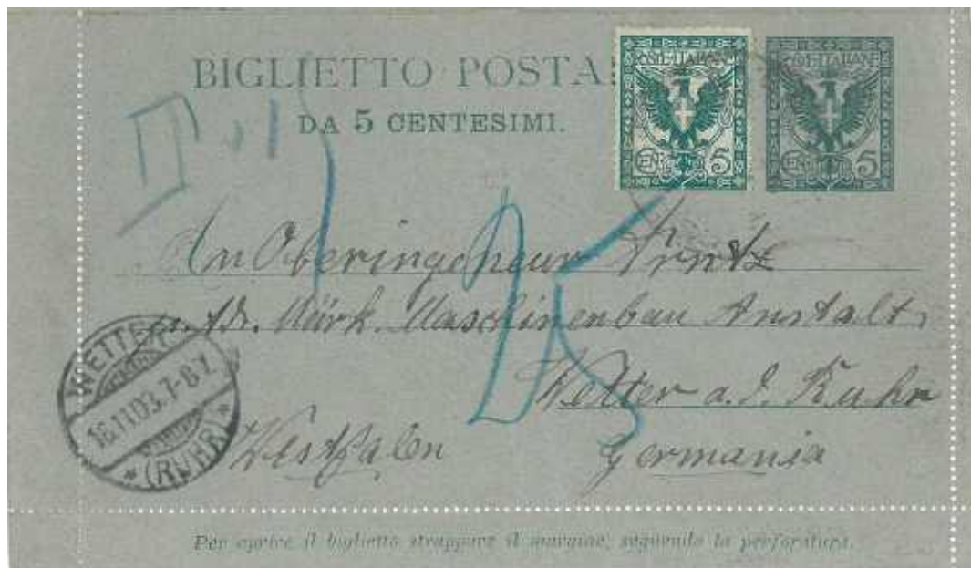
14 novembre 1903 da Portofferaio per Wetter in Germania Tassato per insufficiente francatura. Bordi integri.

5c senza mill. Re Vittorio Emanuele III: Floreale, fr.llo "Aquila", cartoncino grigio, stampa tipografica. Emissione 26 gennaio 1903; mill.04. Emissione 14 agosto 1905; mill.05. Emissione 22 agosto 1905.