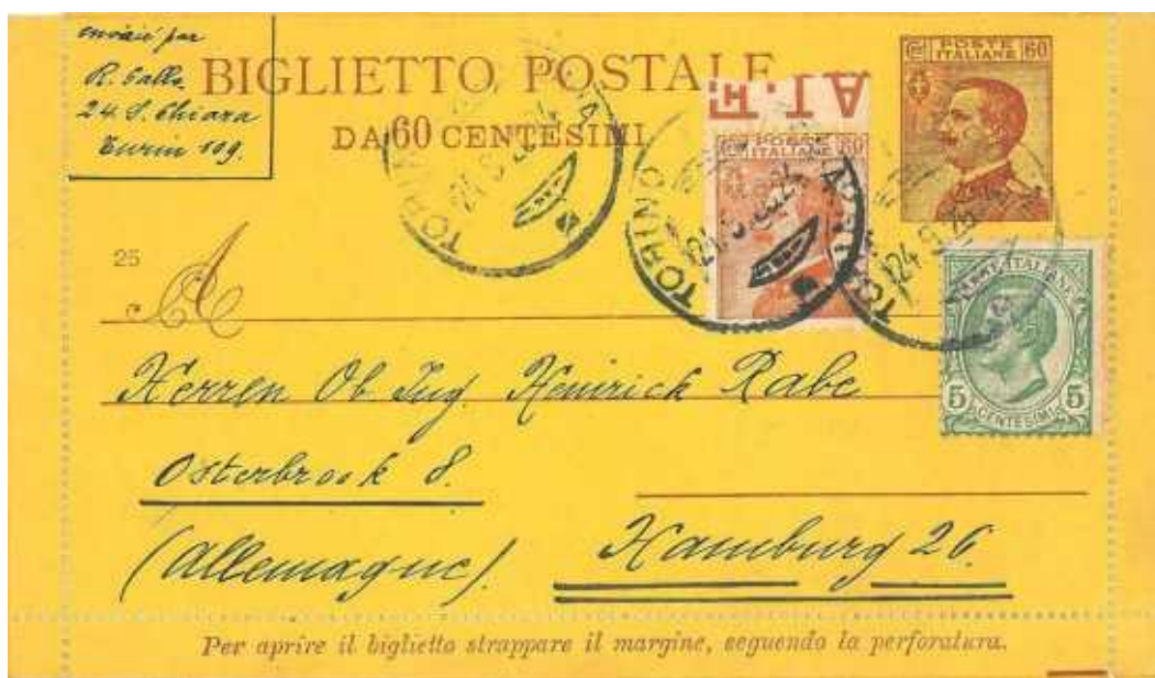
24 settembre 1926 da Torino per Hamburgo in Germania Bordi integri. Tariffa da lire 1,25.

25c. mill. 27 Re Vittorio Emanuele III: Michetti, nuovo fr.llo "Re volto a sinistra", verde su grigio verdino. Emissione 14 ottobre 1927 validità 31 dicembre 1933.