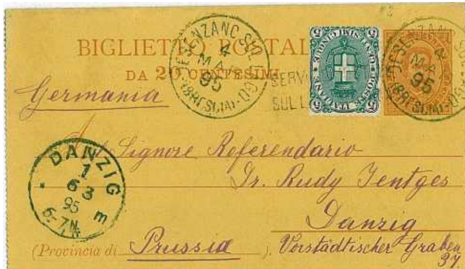
4 marzo 1895 da Desenzano sul Lago (Brescia) per Danzica nella Prussia, ora Polonia Annullo messaggere lacuale lineare "SERVIZIO POSTALE SUL LAGO DI GARDA".