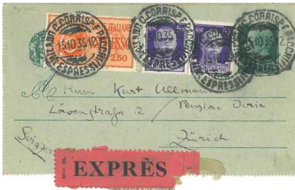
15 ottobre 1935 da milano per Zurico in Svizzera Uso espresso. In perfetta tariffa da 3,75 lire (1,25+2,50). Etichetta per espressi mod. 24