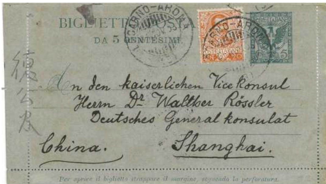
5 novembre 1903 da Pallanza per Shanghai in Cina Annullo di messaggere Locarno - Arona. Bordi integri