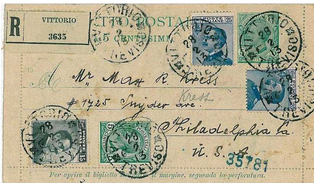
28 febbraio 1913 da Vittorio (Treviso) per Philadelphia (Pennsylvania) negli Stati Uniti di America

Uso raccomandato. Bollo di transito di Torino (ferrovia). Targhetta postale con R in nero e nominativo della località. Integrazione tariffaria di 70 centesimi inviato in uso raccomandato.