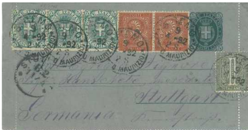
9 aprile 1892 da S.Remo (Porto Maurizio) per Stuttgart in Germania Perfetta tariffa da 25 centesimi. Due Re.