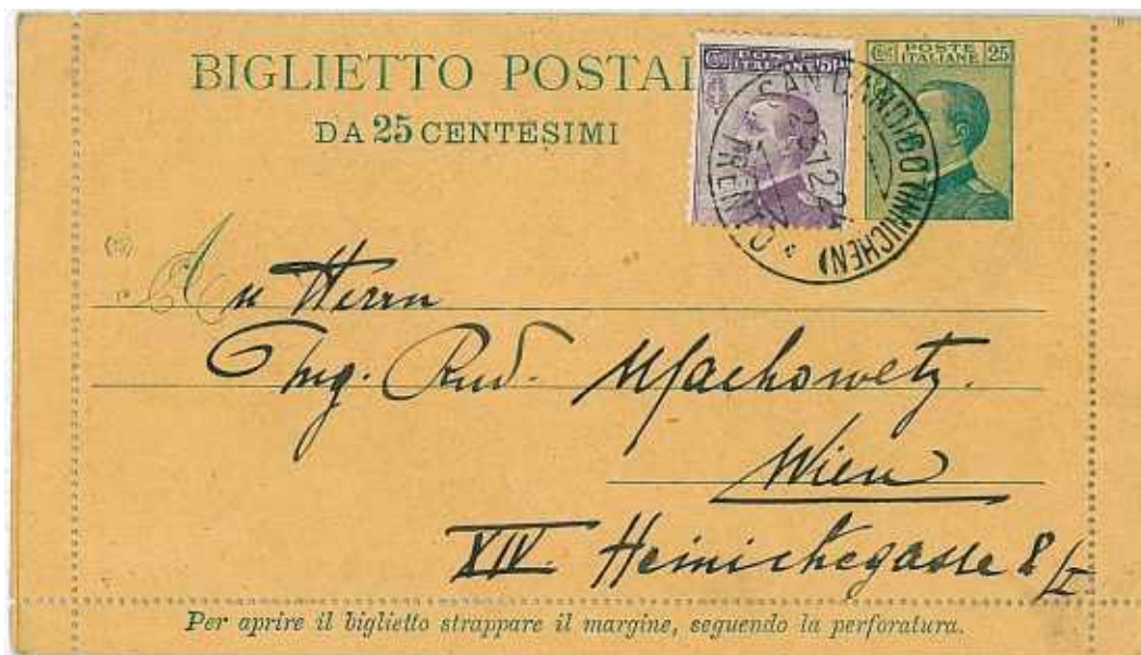
23 dicembre 1924 da San Candido (Innichen) Trento per Vienna in Austria Bordi integri. In perfetta tariffa da 75 centesimi come previsto dall'accordo di Portorose.