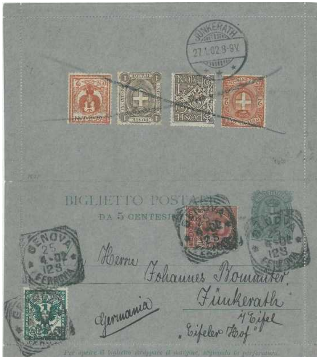
25 aprile 1902 da Genova per Junkerath in Germania Francobolli applicati al verso e tollerati. Valori gemelli. Due Re.