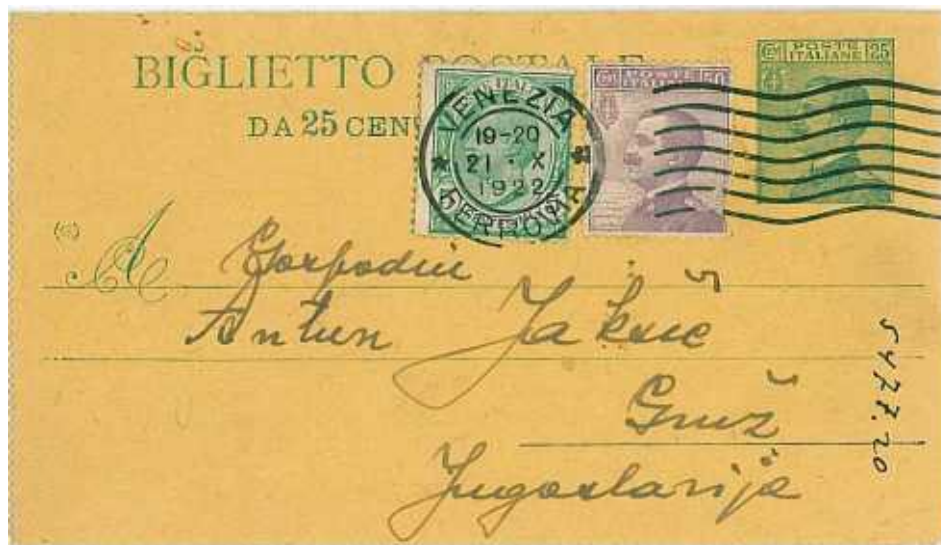
21 ottobre 1922 da Venezia per Gruz in Jugoslavia, ora Croazia Tariffa: 80 centesimi.