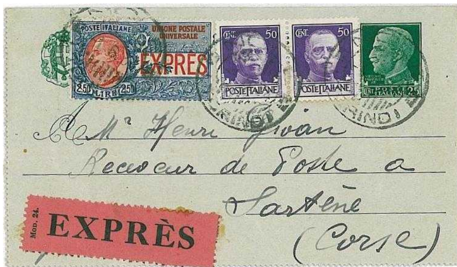
1° giugno 1934 da Molecanavese per Sartène (Corsica) in Francia Uso espresso. In perfetta tariffa da 3,75 lire (1,25+2,50). Etichetta per espressi mod. 24.