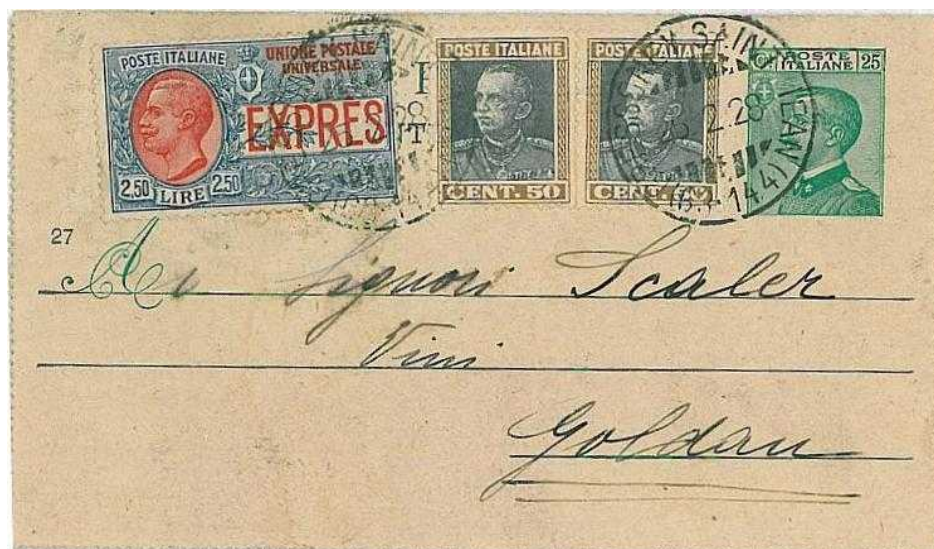
25 febbraio 1928 da Gressoney Saint Jean per Goldau in Svizzera Uso espresso. Bolli dell'amb. Aosta-Torino, dell'amb.Torino-Milano e dell'amb.Milano-Domodossola, tutti in data 25.

25c. mill. 27 Re Vittorio Emanuele III: Michetti, nuovo fr.llo "Re volto a sinistra", verde su grigio verdino. Emissione 14 ottobre 1927 validità 31 dicembre 1933.