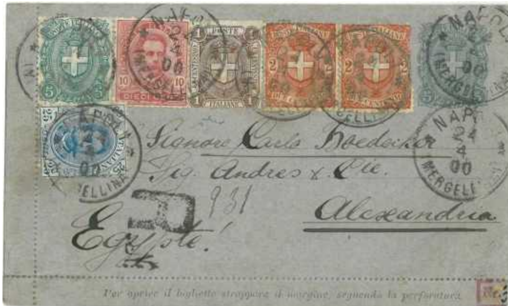
24 aprile 1900 da Napoli - Mergellina per Raccomandata inviato ad Alessandria d'Egitto. Rara francatura addizionale esacolare.