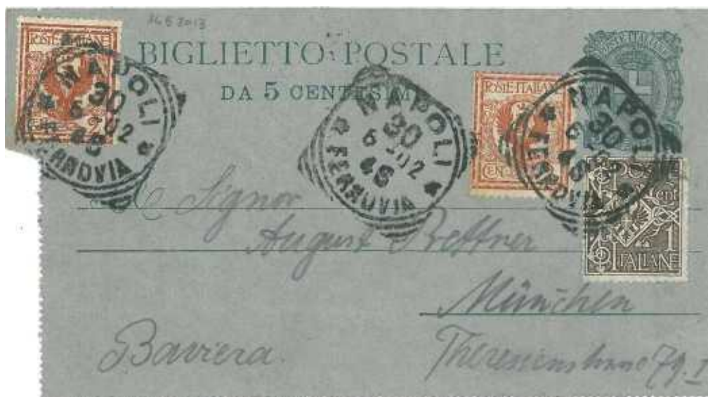
30 giugno 1902 da Napoli per Monaco in Germania Biglietto postale inviato aperto e applicata la tariffa per cartolina postale da 10 centesimi.