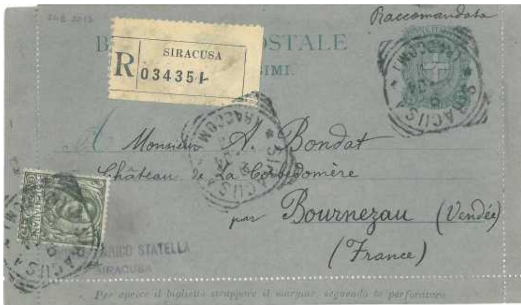
9 novembre 1904 da Siracusa per Bournezeau in Francia Fuori corso. Uso raccomandato. Bordi integri.