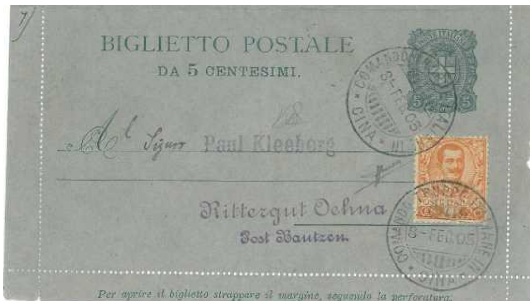
8 febbraio 1905 dal Comando Truppe Italiane in Cina a Bautzen in Germania A testimonianza della permanenza delle nostre truppe in Cina fino al rientro in Italia del Contingente che ebbe inizio nell'agosto 1901 terminando nell'agosto 1905. Bordi integri.