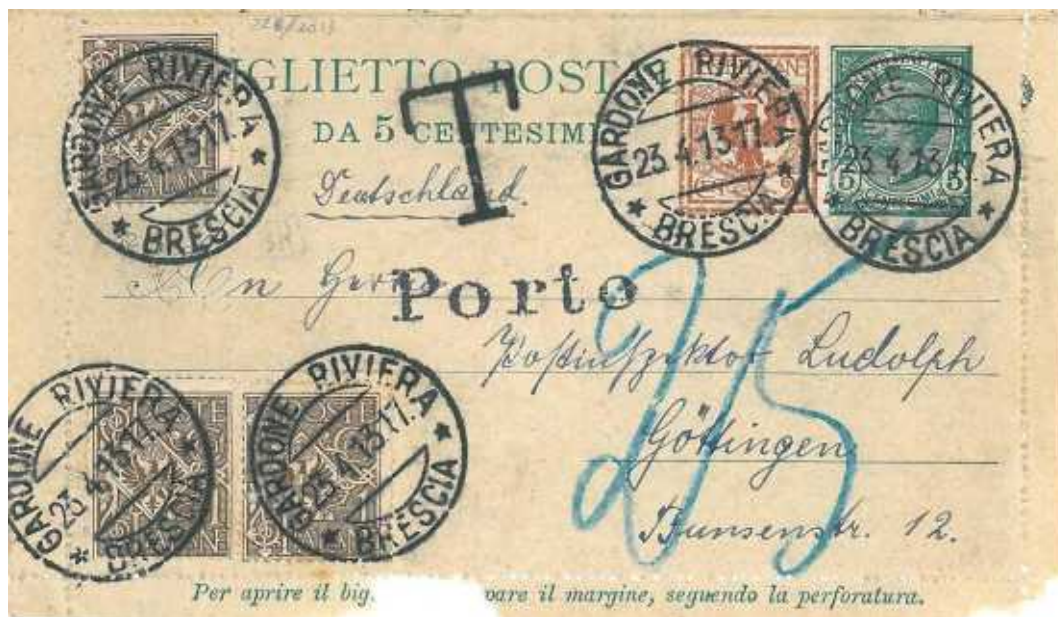
23 aprile 1913 da Gardone Riviera a Göttingen in Germania Segni di tassazione del doppio dell'importo della insufficienza.