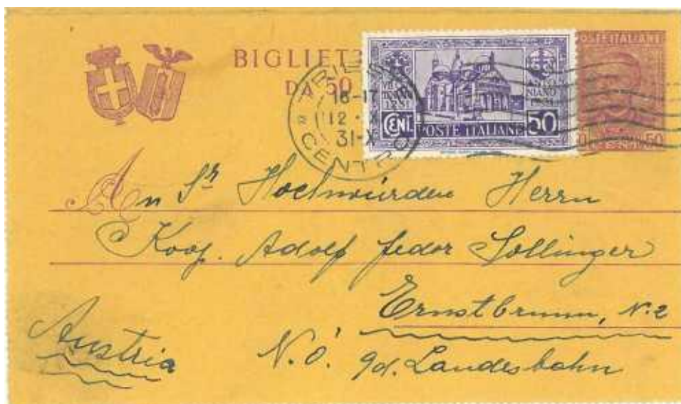
12 ottobre 1931 da Trieste per Ernstbrunn in Austria Tariffa da 1 lira nel rispetto dell'accordo di Portorose.