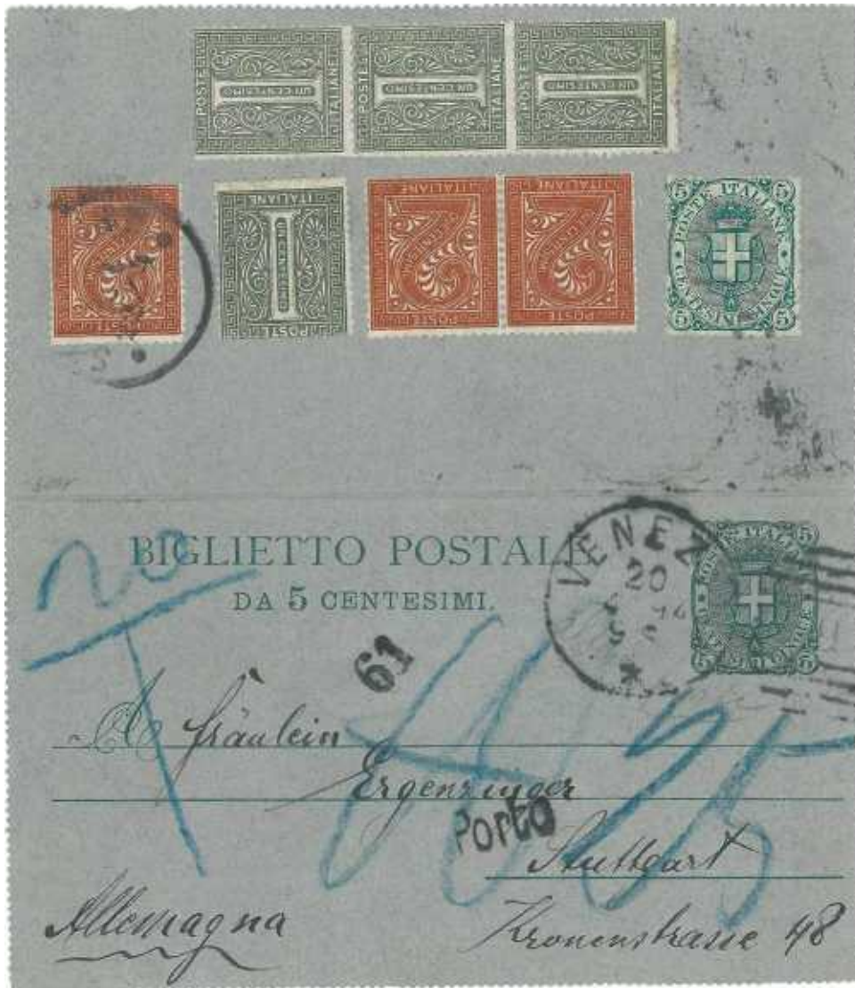
20 aprile 1894 da Venezia per Stoccarda in Germania Tassato per insufficiente francatura.