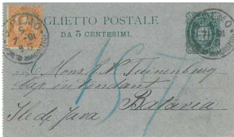
5 luglio 1891 da S.Remo (Porto Maurizio) per Batavia nell'Isola di Java Bollo di arrivo al verso del 7 agosto. Affrancatura insufficiente in quanto la tariffa era di 40 centesimi per gli invii nella fascia "B" e quindi tassata.