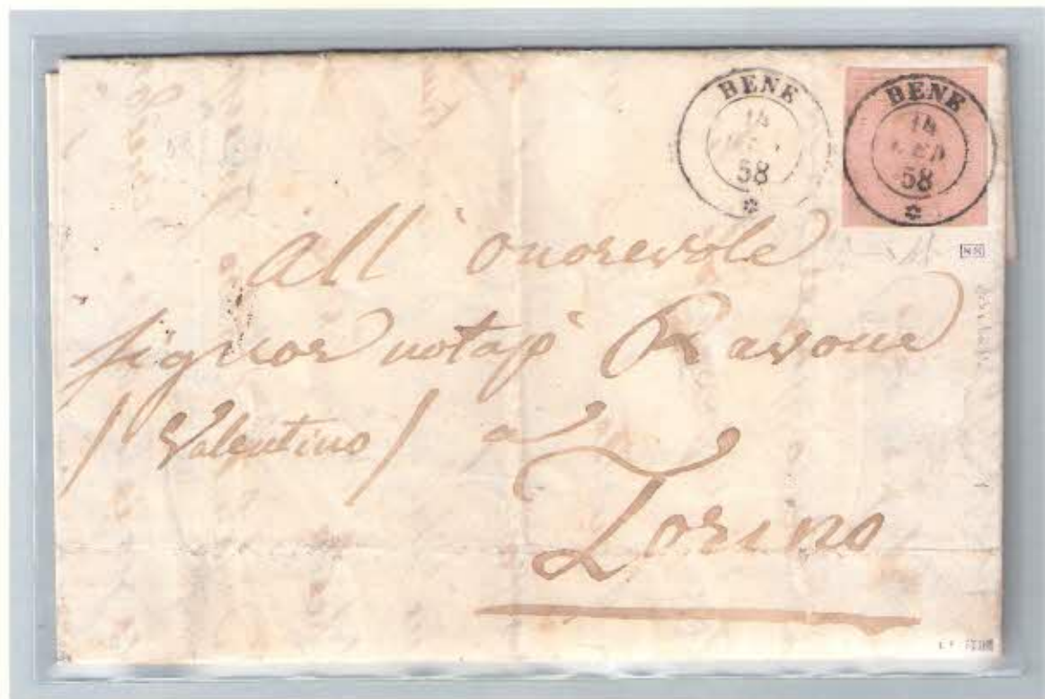
Annullo del 14 gennaio 1858 su c. 40 con destinazione Torino, tariffa per doppio porto.