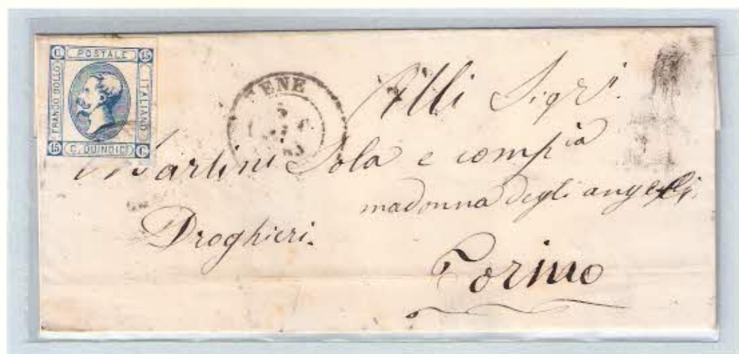
Lettera del 5 ottobre 1863 con annullo su francobollo da c. 15 litografico del II tipo. Al verso bollo doppio cerchio "Ambulante Cuneo - Torino" e bollo cerchio semplice di arrivo a Torino in pari data.