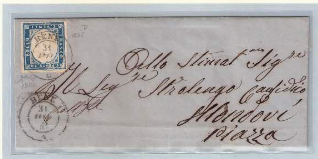
Annullo del 31 dicembre 1861 su francobollo da c. 20, lettera per Mondovì Piazza.