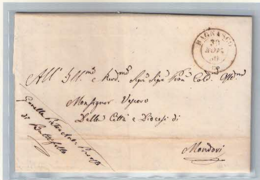
Bollo prefilatelic del 30 novembre 1850 su lettera in franchigia vescovile per Mondovì.

Ufficio di II classe – bollo doppio cerchio rosetta – popolazione 1.857