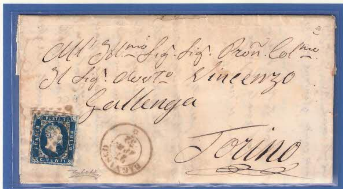
Bollo del 27 aprile 1852 su lettera per Torino affrancata con c. 20 della I serie di Sardegna annullato con bollo a rombi. Unica lettera nota con annullo a rombi e impronta a doppio cerchio per Bagnasco sulla prima serie di Sardegna. (E)