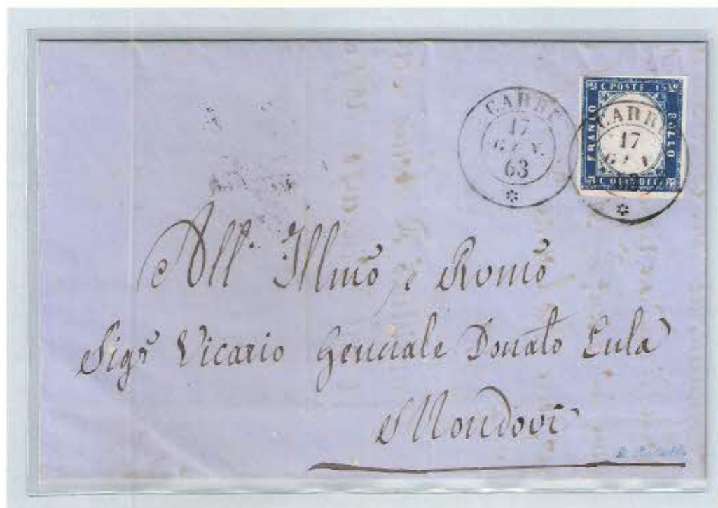
Annullo doppio cerchio nero del 17 gennaio 1863 su c. 15 su lettera per Mondovì. Al verso doppio cerchio di arrivo di Mondovì.