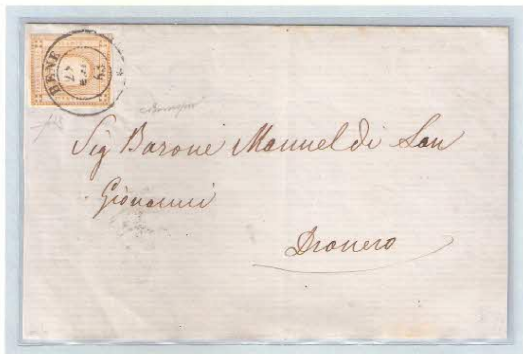
Stampato per Dronero affrancato con francobollo da c. 2 per le stampe colore bistro annullato con doppio cerchio del 28 maggio 1863.