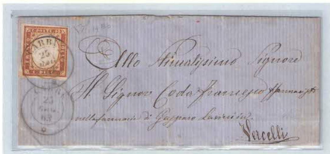
Annullo doppio cerchio nero del 25 maggio 1863 su c. 10 su lettera per Vercelli probabilmente sfuggita al controllo perché non tassata per la differenza di tariffa postale evasa di c. 5. Al verso bollo doppio cerchio grande "Uff. Amb. V.E. Sez. Ticino (1)" utilizzato sulla linea Susa - Torino con la diramazione verso Novara.