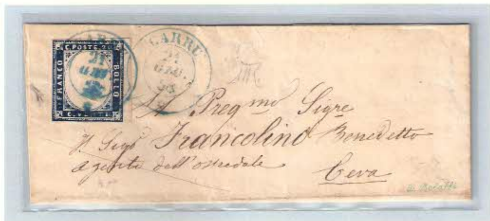
Annullo doppio cerchio azzurro del 21 giugno 1858 su c. 20 ripetuto a lato su lettera per Ceva. Al verso doppio cerchio di transito di Trinità.