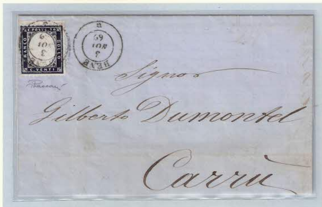
Annullo del 3 novembre 1862 su c. 20 della prima serie del Regno d' Italia su lettera per Carrù.