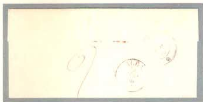
Lettera per Alba del 11 agosto 1856 con bollo doppio cerchio e bollo P.P, porto pagato di c. 20 manoscritto al retro.