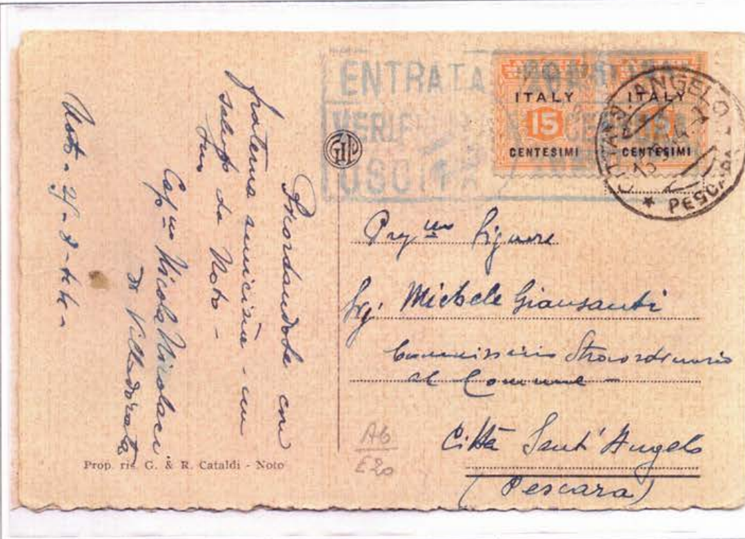
Cartolina illustrata da Noto (SR) per Città Sant'Angelo (PE) del 28 agosto 1944, affrancata per c. 30, con coppia del c. 15.