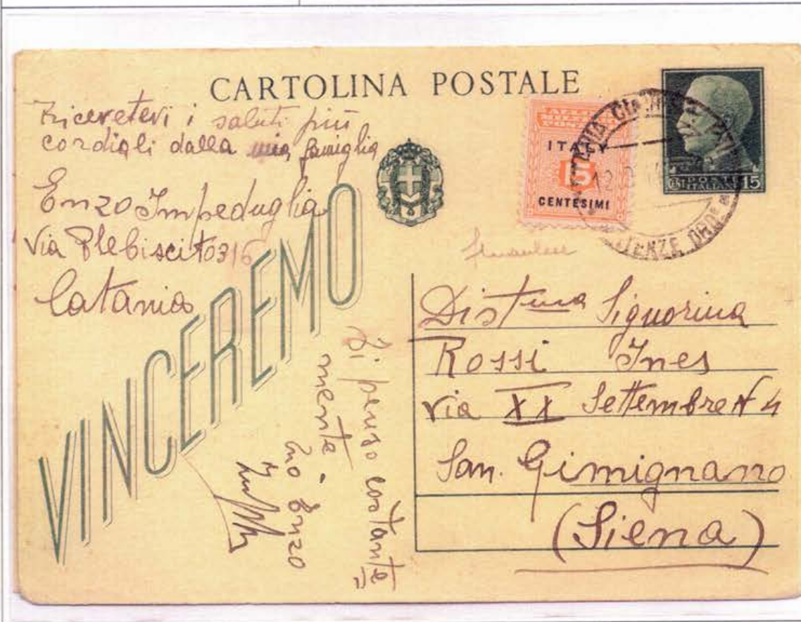
Cartolina postale c. 15 Vinceremo da Catania per San Gimignano (SI) del 12 settembre 1944, affrancata per c. 30, con c. 15 del Governo Militare Alleato.

Annullo "Catania. Corrisp. e Pacchi. Partenze Ord."