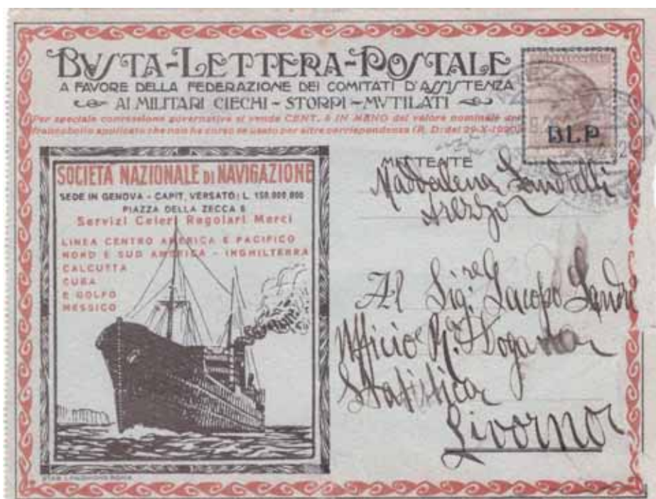
06.09.1921 Busta-Lettera Postale con esemplare da cent. 40 con soprastampa azzurro nera in uso isolato da Arezzo a Livorno. Tariffa primo porto cent. 40.