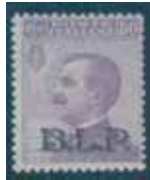
Esemplare nuovo da cent. 50 con soprastampa nera. (E)