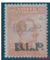
Esemplare nuovo da cent. 20 con doppia soprastampa nera di cui una in albino. (E)