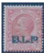
Esemplare nuovo da cent. 10 con soprastampa azzurra.