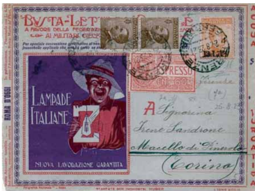
24.08.1923 Busta-Lettera Postale espresso con cent. 20 con soprastampa nera e valori complementari ordinari ed espresso. Viaggiata da Firenze a Macello di Pinerolo (Torino). Tariffa primo porto centesimi 50 più espresso centesimi 60. (E)