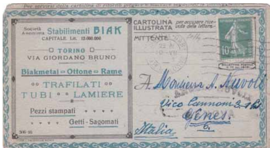
30.10.1922 Cartolina di ritorno di Busta-Lettera Postale inviata da Tolosa (Francia) a Genova con esemplare da cent. 10 ordinario in uso isolato. Una delle tre note provenienti dall'estero. (E)