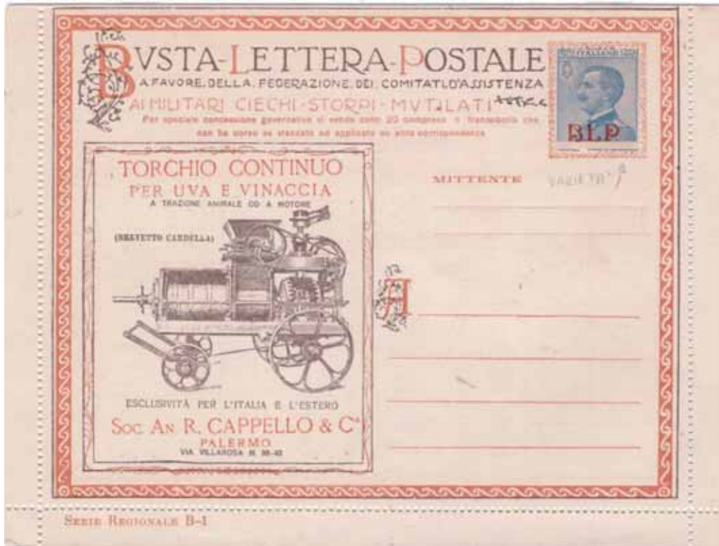
Busta-Lettera Postale nuova con esemplare da cent. 25 con soprastampa rossa, con dentellatura fortemente spostata in senso verticale.