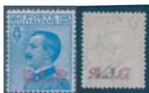
Esemplare nuovo cent. 25 con soprastampa rossa e decalco al verso. (E)