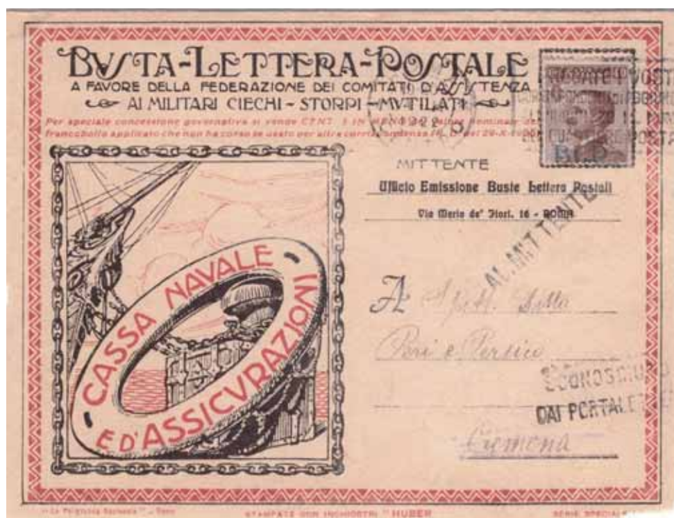
14.02.1922 Busta-Lettera Postale con esemplare da cent. 40 con soprastampa violetta e con timbri lineari accessori "Sconosciuto al portale" e "Al mittente" e restituita al mittente. Viaggiata in uso isolato da Roma diretta a Cremona. Tariffa di primo porto cent. 40.