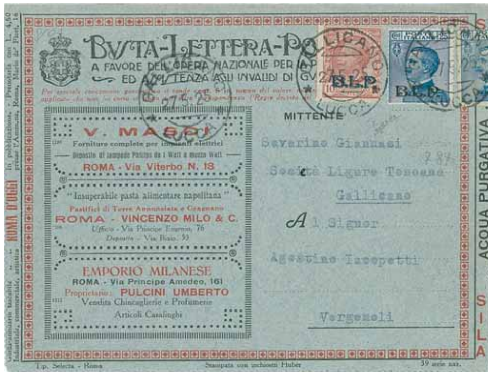
27.05.1923 Busta-Lettera Postale con esemplare da cent. 25 con soprastampa nera e con altro esemplare da cent. 10 con soprastampa nera e complementare gemello a cavallo della busta. Viaggiata da Galliano (RM) a Vergemoli (LU). Tariffa di primo porto cent. 60.