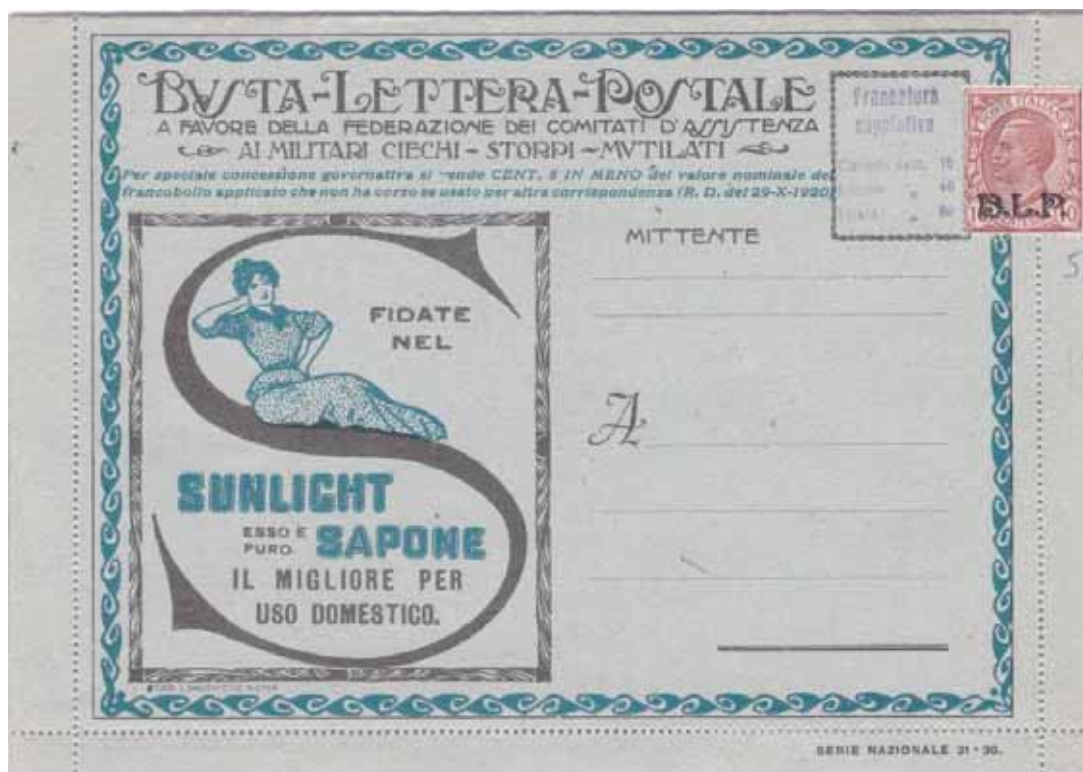
Busta-Lettera Postale nuova con esemplare da Cent.10 con soprastampa nera.