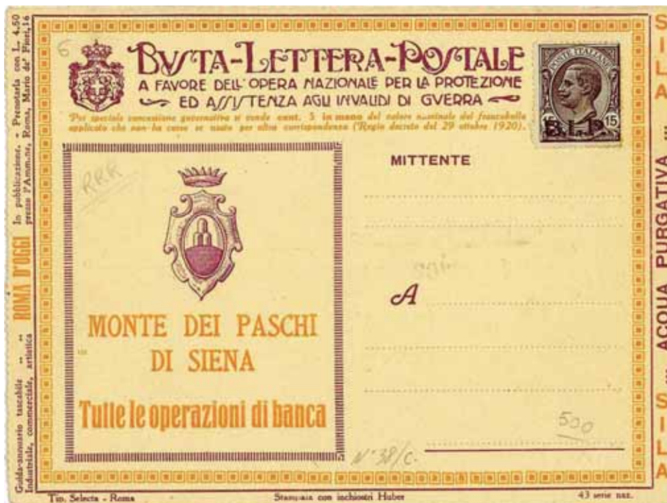
Busta-Lettera Postale nuova con esemplare da cent. 15 con soprastampa ardesia.