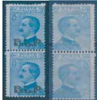
Esemplari in coppia verticale nuovi da cent. 25 con soprastampa nera e con decalco del francobollo. (E)