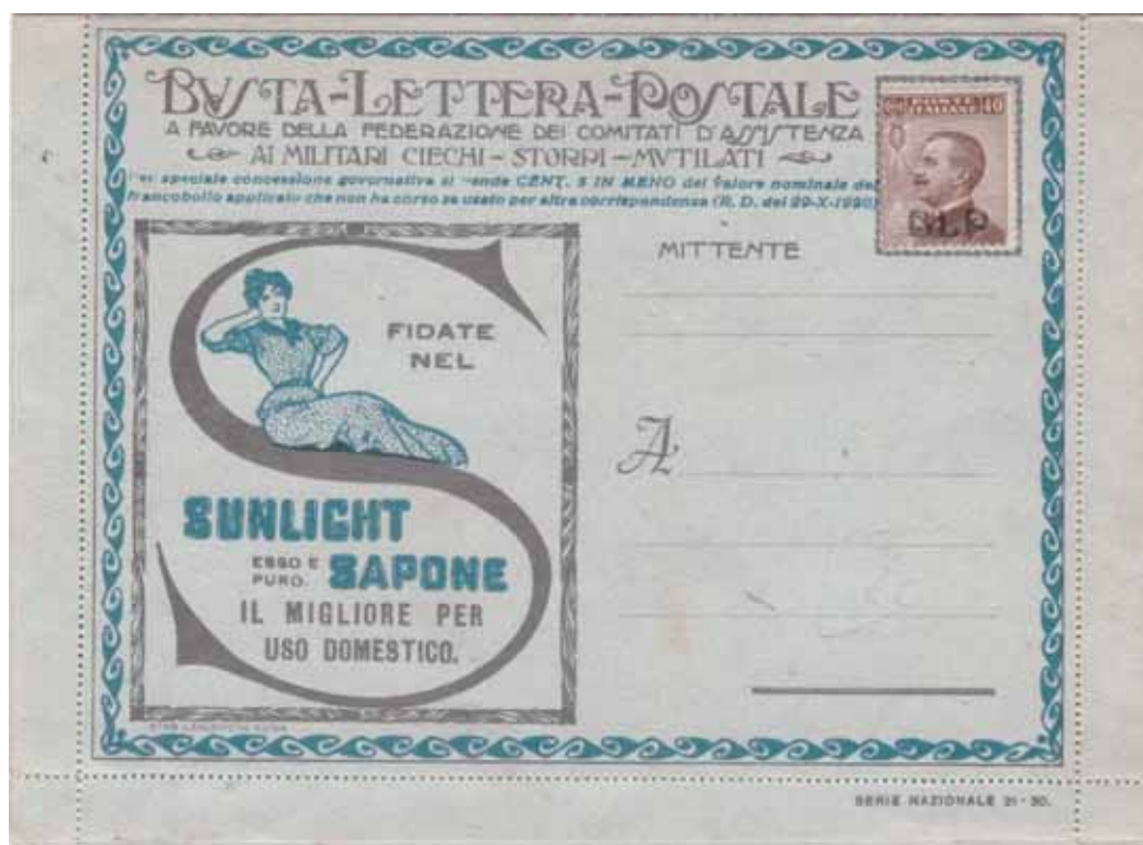
Busta-Lettera Postale nuova con esemplare da cent. 40 con soprastampa violetta.