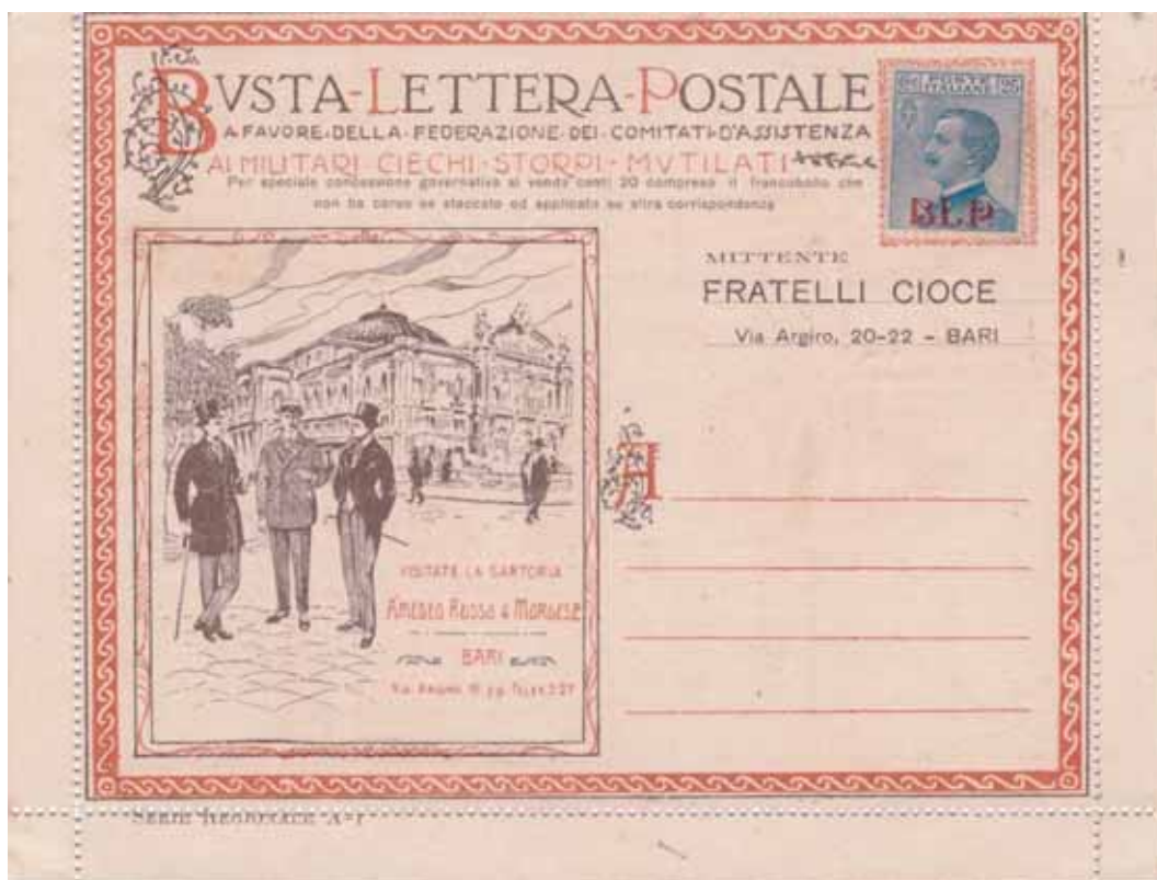
Busta-Lettera Postale nuova con esemplare da cent. 25 con soprastampa rossa.