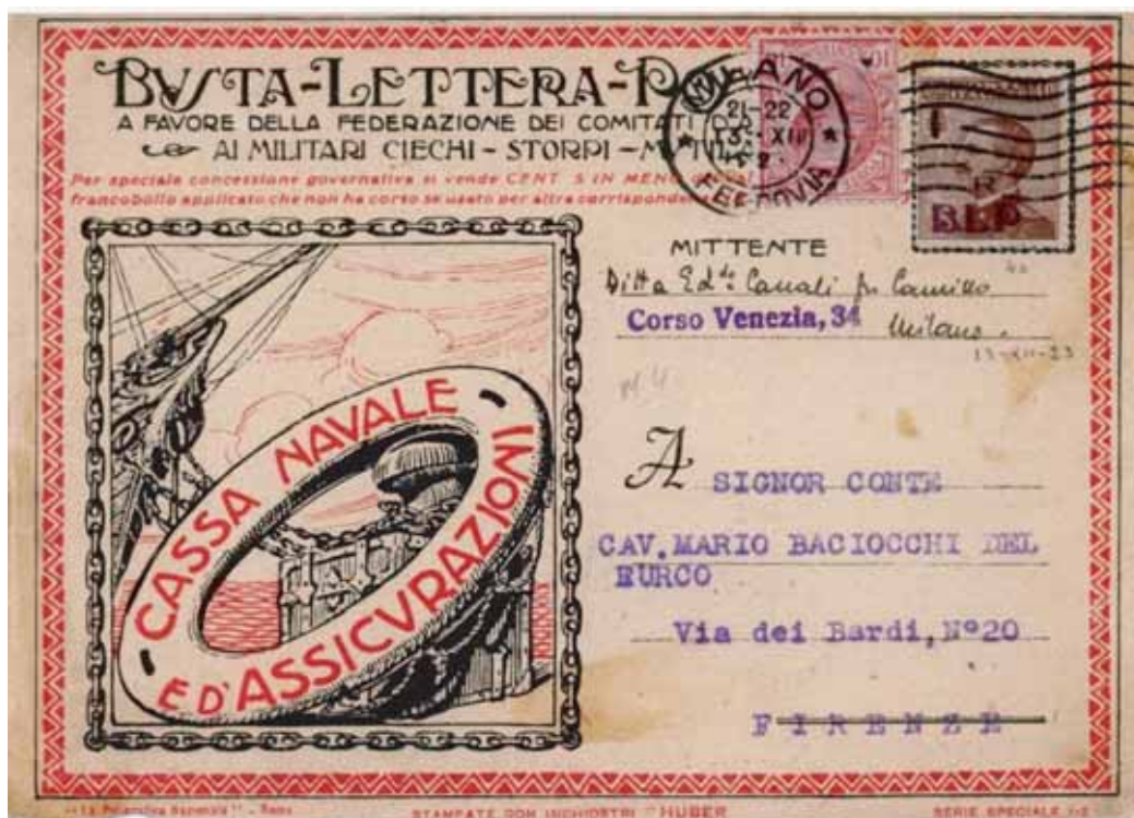
13.19.1923 Busta-Lettera Postale con esemplare da cent. 40 con soprastampa vinacea con valore complementare viaggiata da Milano diretta a Firenze. Tariffa di primo porto cent. 50.