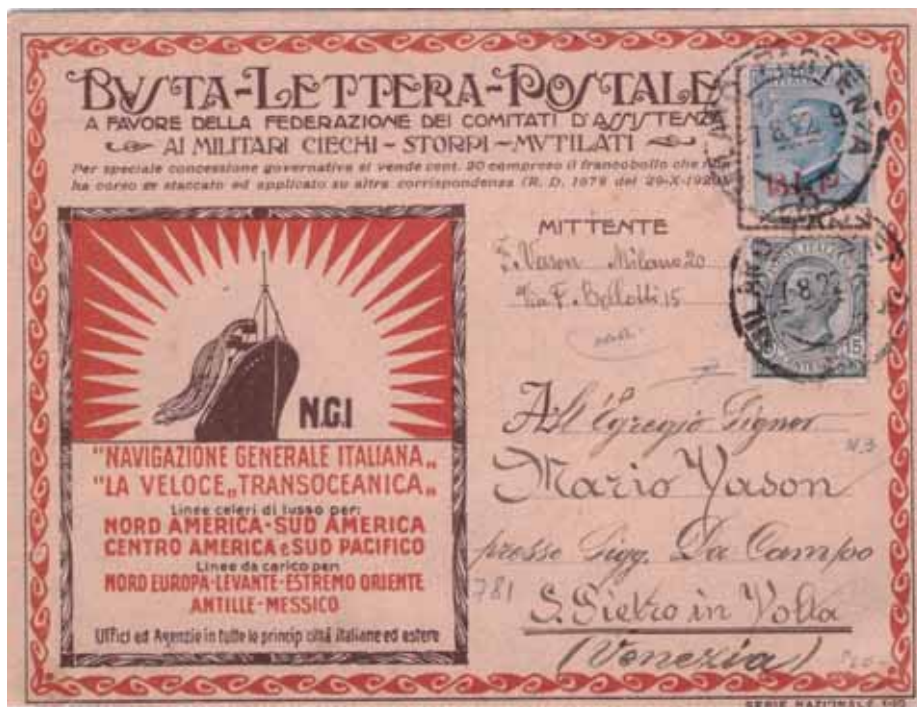
07.08.1922 Busta-Lettera Postale, con cent. 25 con sovrastampa rossa viaggiato con valore complementare da Milano diretta a S. Pietro in Volta (Venezia). Tariffa di primo porto cent. 40.