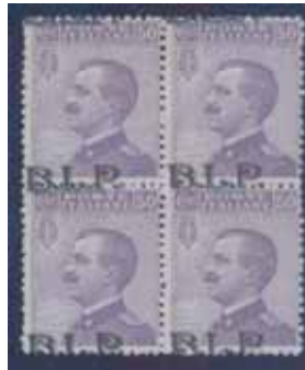
Quartina di esemplare nuovi da cent. 50 con soprastampa nera fortemente spostata in basso e a sinistra. (E)