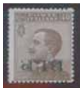
Esemplare nuovo da cent. 40 con soprastampa ardesia capovolta inferiore.