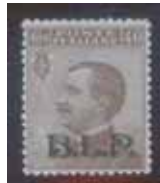
Esemplare nuovo da cent. 40 soprastampa ardesia. (E)