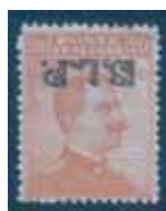
Esemplare nuovo da cent. 20 con soprastampa nera. capovolta spostata in alto. (E)