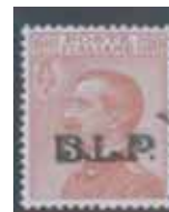
Esemplare nuovo da cent. 30 con soprastampa nera e macchia tipografica. (E)