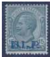
Esemplare nuovo da cent. 15 con soprastampa ardesia. (E)