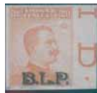
Esemplare nuovo da cent. 20 con soprastampa nera non dentellato. (E)