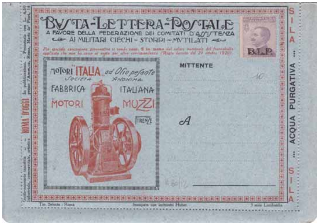
Busta-Lettera Postale nuova con esemplare da cent. 50 con soprastampa nera.