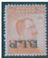
Esemplare nuovo da cent. 20 con soprastampa nera stampata capovolta. (E)