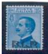
Esemplare nuovo da cent. 25 con soprastampa nera. (E)