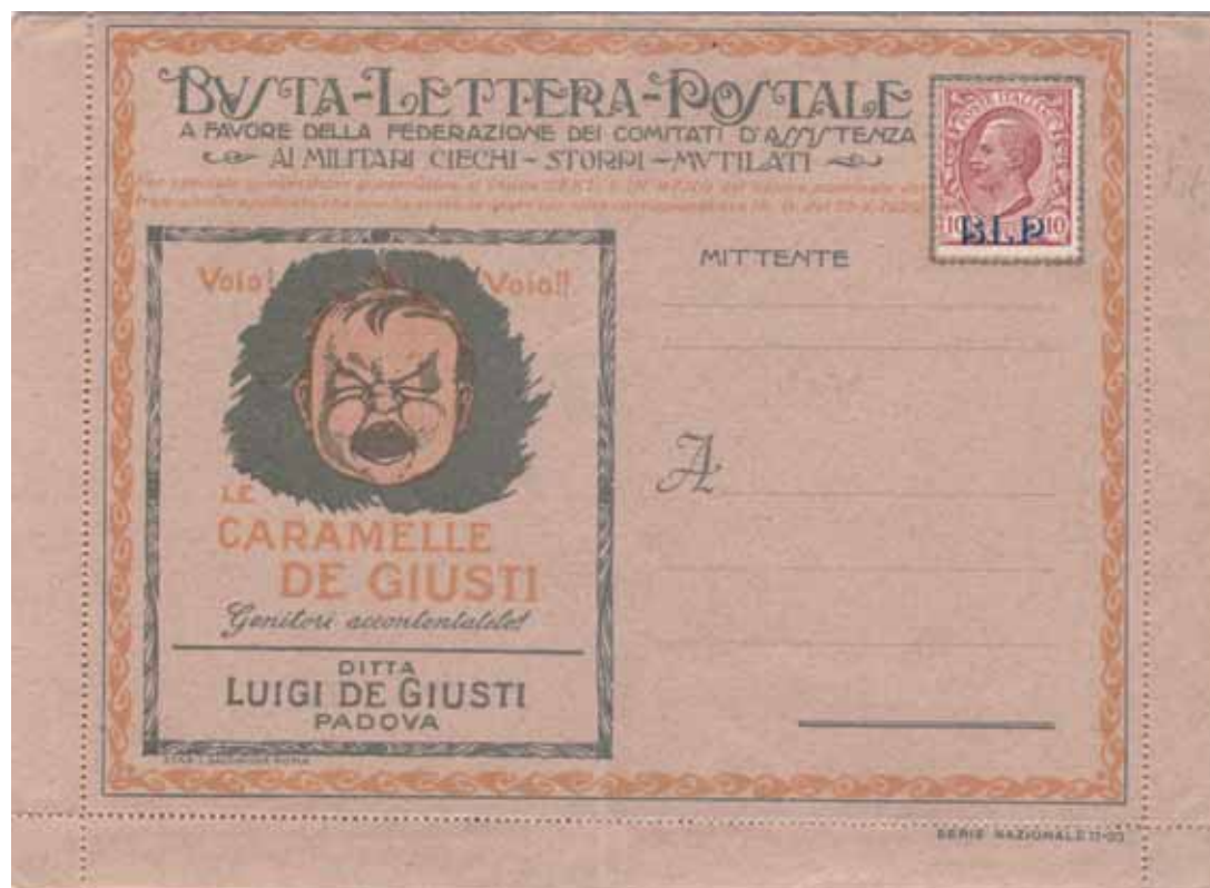
Busta-Lettera Postale nuova con esemplare da Cent.10 con soprastampa azzurra.