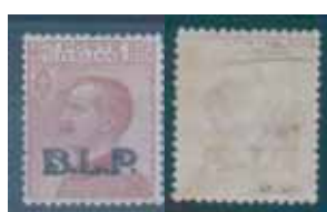
Esemplare nuovo cent. 85 con soprastampa nera e decalco parziale del francobollo al verso. (E)