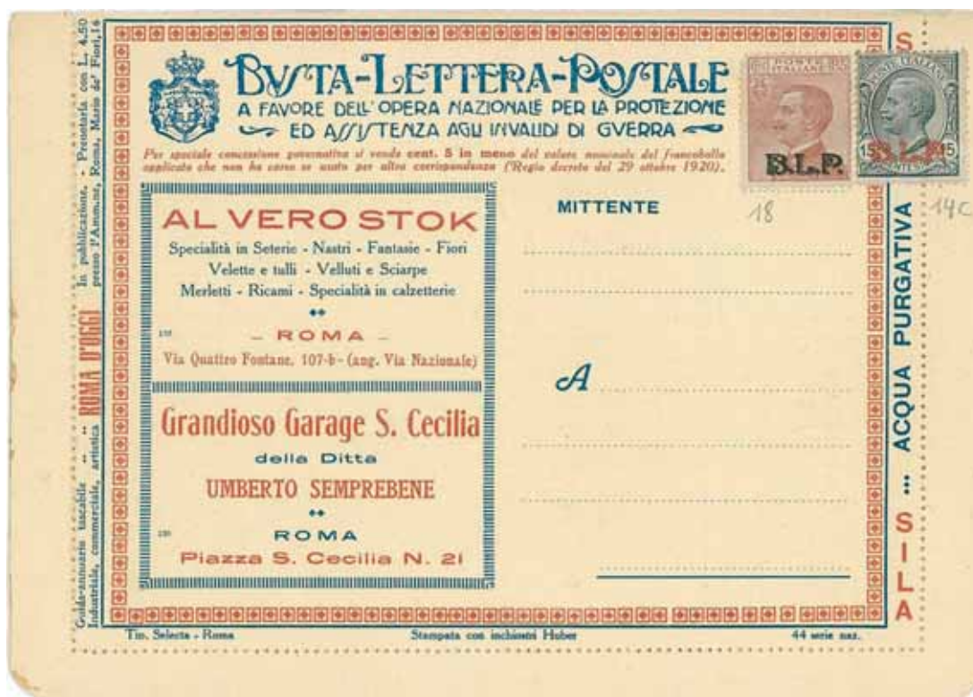
Busta-Lettera Postale nuova con esemplare da cent. 15 con soprastampa rossa, con valore complementare da cent 85 con soprastampa nera.