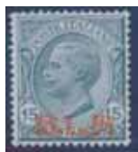
Esemplare nuovo da cent. 15 con soprastampa arancio. (E)