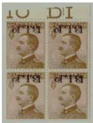
Quartina di esemplari nuovi da cent. 40 con soprastampa ardesia capovolta superiore.