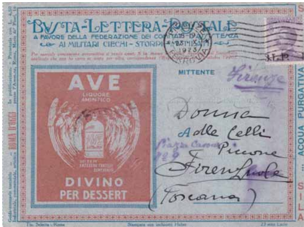
23.10.1923 Busta-Lettera Postale con cent. 50 soprastampa nera fortemente spostata in basso e a sinistra, in uso isolato da Firenze a Firenzuola (FI). Tariffa primo porto cent. 50. Unica nota.(E)