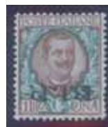
Esemplare nuovo da lire 1 con soprastampa nera capovolta in basso. (E)