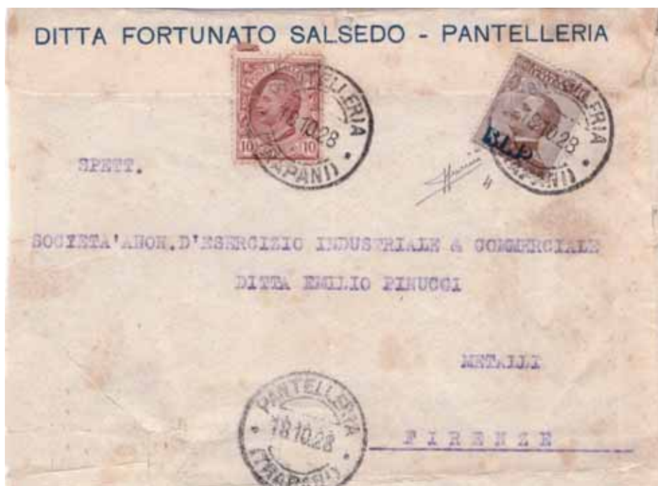
18.10.1928 Lettera con esemplare da cent. 40 soprastampa nera "B.L.P." e valore ordinario complementare in frode postale in quanto vietato l'uso su normale corrispondenza come specificato nel R.D. 1678 del 29 ottobre 1920 viaggiata da Pantelleria (TP) a Firenze e sfuggita a tassazione. Tariffa primo porto cent. 50. (E)