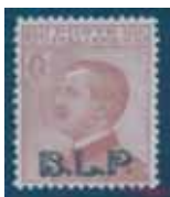
Esemplare nuovo da cent. 85 con soprastampa nera. (E)