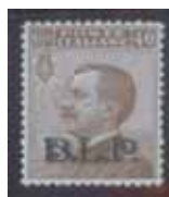
Esemplare nuovo da cent. 40 con soprastampa nera. (E)