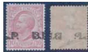
Esemplare nuovo da cent. 10 con soprastampa nera spostata e recto verso. (E)