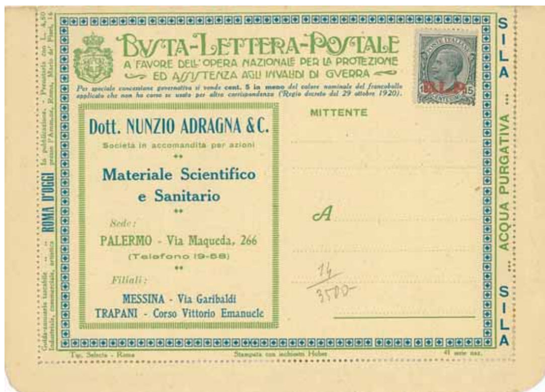
Busta-Lettera Postale nuova con esemplare da cent. 15 con soprastampa arancio.