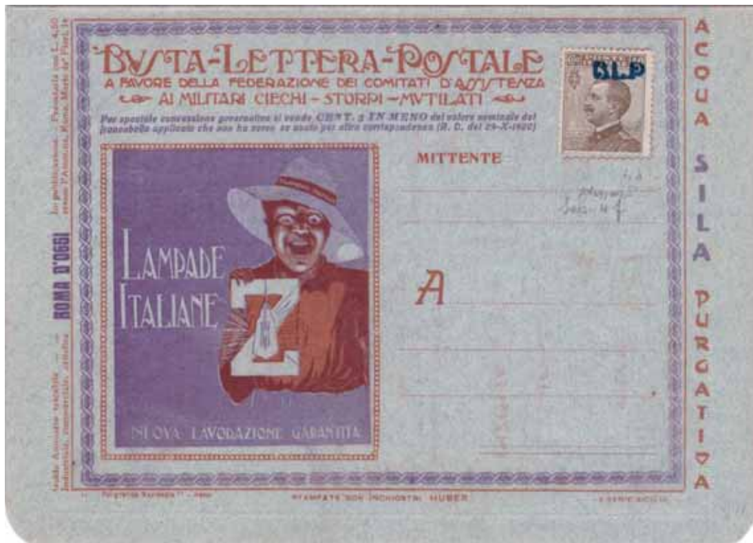
Busta-Lettera Postale nuova con esemplare da cent. 40 con soprastampa azzurro nera spostata in alto a destra.