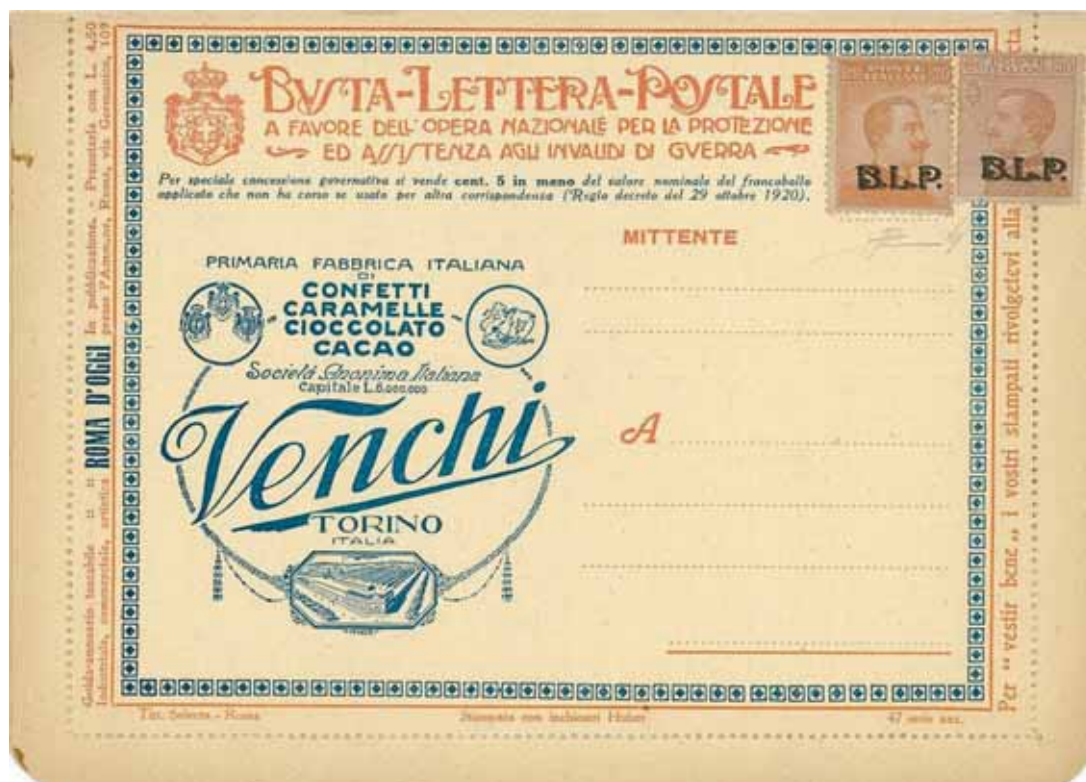
Busta-Lettera Postale nuova con esemplare da cent. 20 con soprastampa nera, con valore complementare da cent 30 con soprastampa nera.