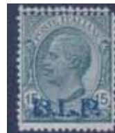
Esemplare nuovo da cent. 15 con soprastampa ardesia con doppia dentellatura. (E)