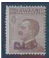
Esemplare nuovo da cent. 40 con soprastampa vinacea.