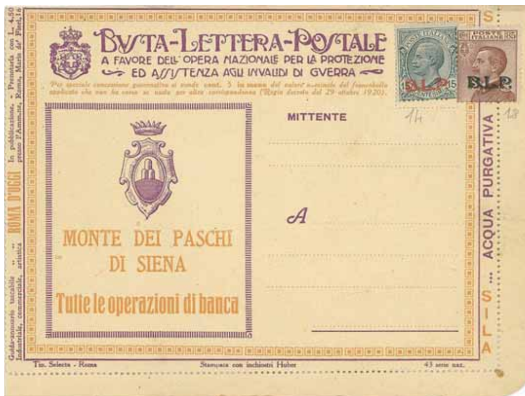
Busta-Lettera Postale nuova con esemplare da cent. 85 con soprastampa nera e valore complementare cent. 15 con soprastampa rossa.