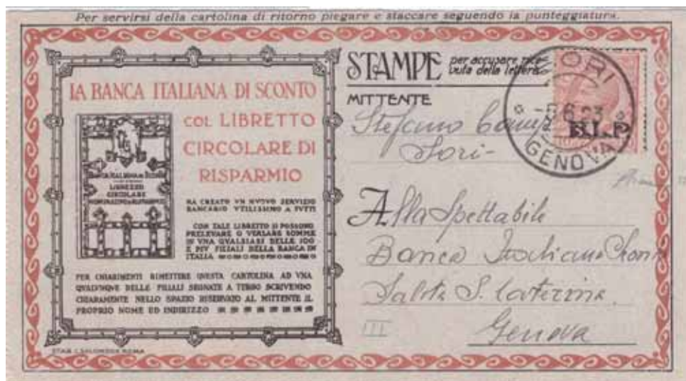
05.06.1923 Cartolina di ritorno di Busta-Lettera Postale affrancata con il cent 10 con sovrastampa litografica nera. Raro caso, di cui se ne conoscono solo altri 3, in cui viene utilizzato un valore con soprastampa "B.L.P." al posto di un francobollo ordinario, viaggiata da Sori (GE) diretta a Genova. Tariffa primo porto stampe cent. 10. (E)