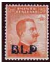
Esemplare nuovo da cent. 20 con soprastampa azzurra. (E)