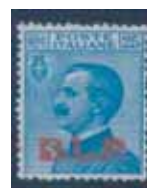
Esemplare nuovo da cent. 25 con soprastampa rossa. (E)