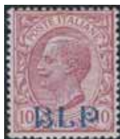
Esemplare nuovo da cent. 10 con soprastampa azzurra.

L'impressione misura 11,5 millimetri di larghezza per 3,8 millimetri di altezza. La distanza tra le soprastampe – interspazio verticale – è di circa 20 millimetri; invece quella tra le soprastampe della stessa fila orizzontale – interspazio orizzontale – è di 8,5 millimetri.