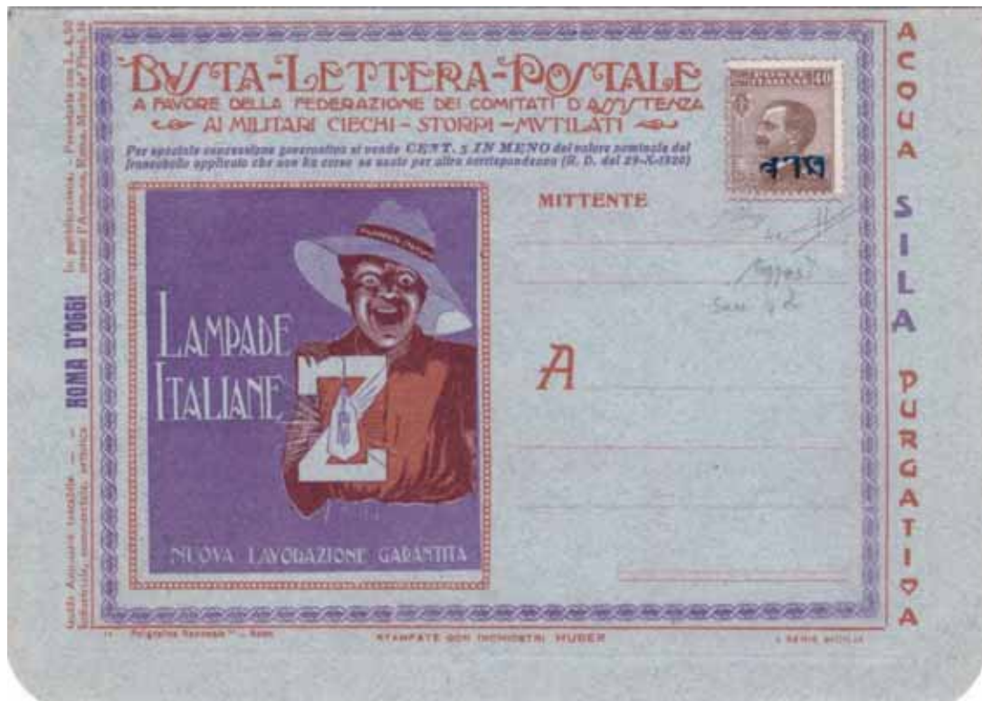
Busta-Lettera Postale nuova con esemplare da cent. 40 con soprastampa azzurro nera capovolta.