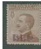
Esemplare nuovo da cent. 40 con soprastampa vinacea senza punto dopo la "P". (E)