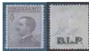
Esemplare nuovo da cent. 40 con soprastampa ardesia stampata al recto.