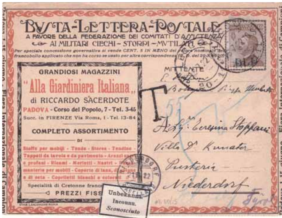
18.07.1922 Busta-Lettera Postale con esemplare di cent. 40 con soprastampa azzurro nera, da Lecco diretta a Niederdorf in Val Pusteria. Tariffa primo porto cent. 40. Inoltrata dall'ufficio postale per errore alla omonima cittadina in Svizzera e per questo tassata in partenza; qui respinta al mittente con annullo di arrivo su etichetta adesiva "Sconosciuto".