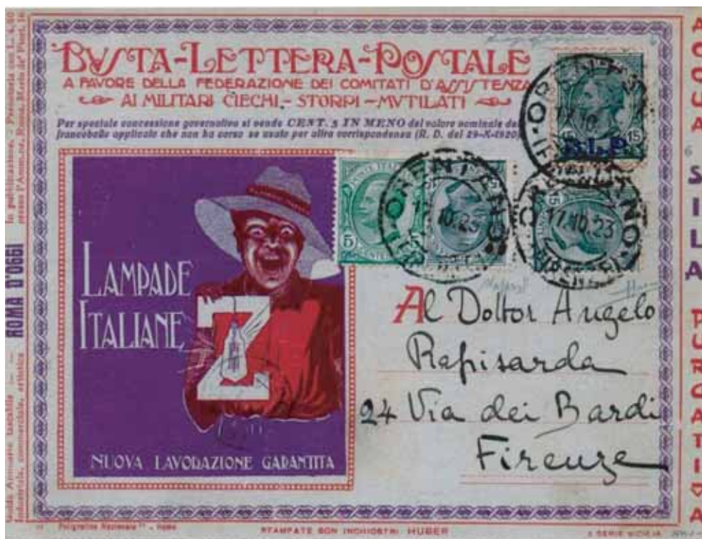
17.10.1923 Busta-Lettera Postale con esemplare da cent. 15 con soprastampa in azzurro e valori complementari, di cui due gemelli da centesimi 15, da Orentano (Firenze) a Firenze. Tariffa di primo porto cent. 50. (E)