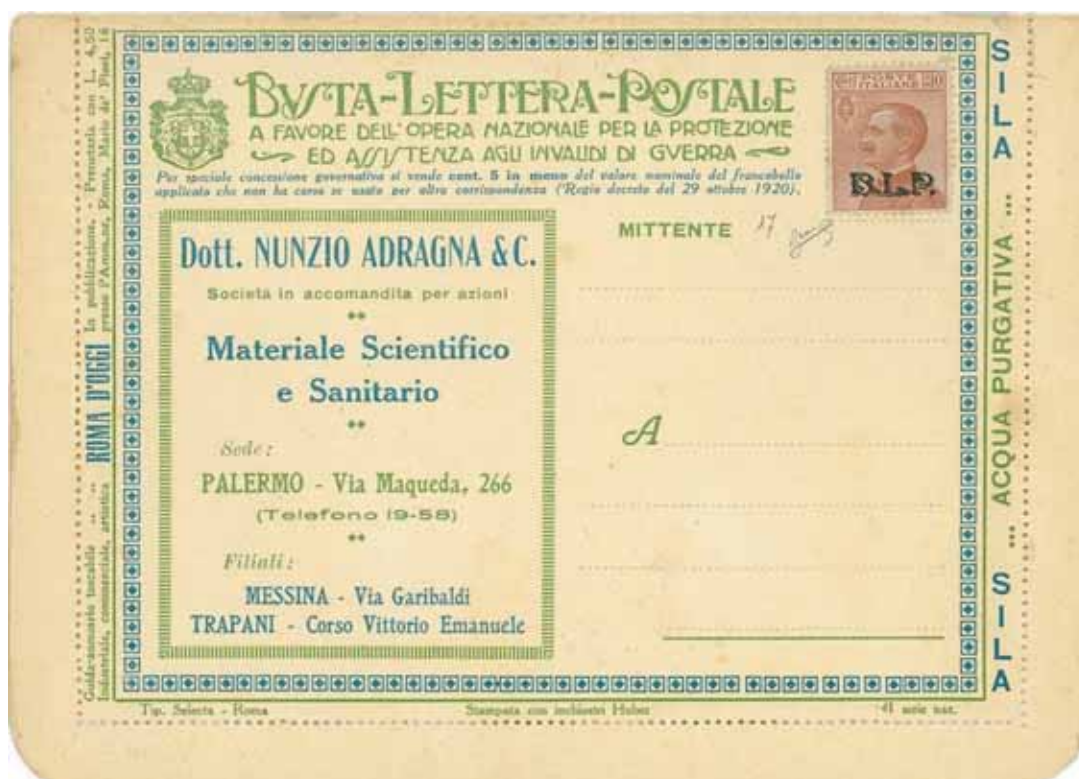
Busta-Lettera Postale nuova con esemplare da cent. 30 con soprastampa nera.