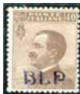
Esemplare nuovo da cent. 40 con soprastampa nera.