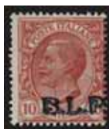
Esemplare nuovo da cent. 10 con soprastampa bruna.