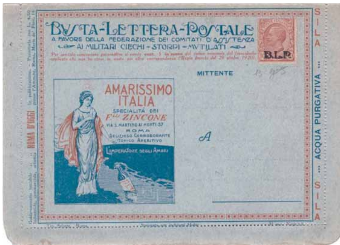
Busta-Lettera Postale nuova con esemplare da Cent.10 con soprastampa nera.