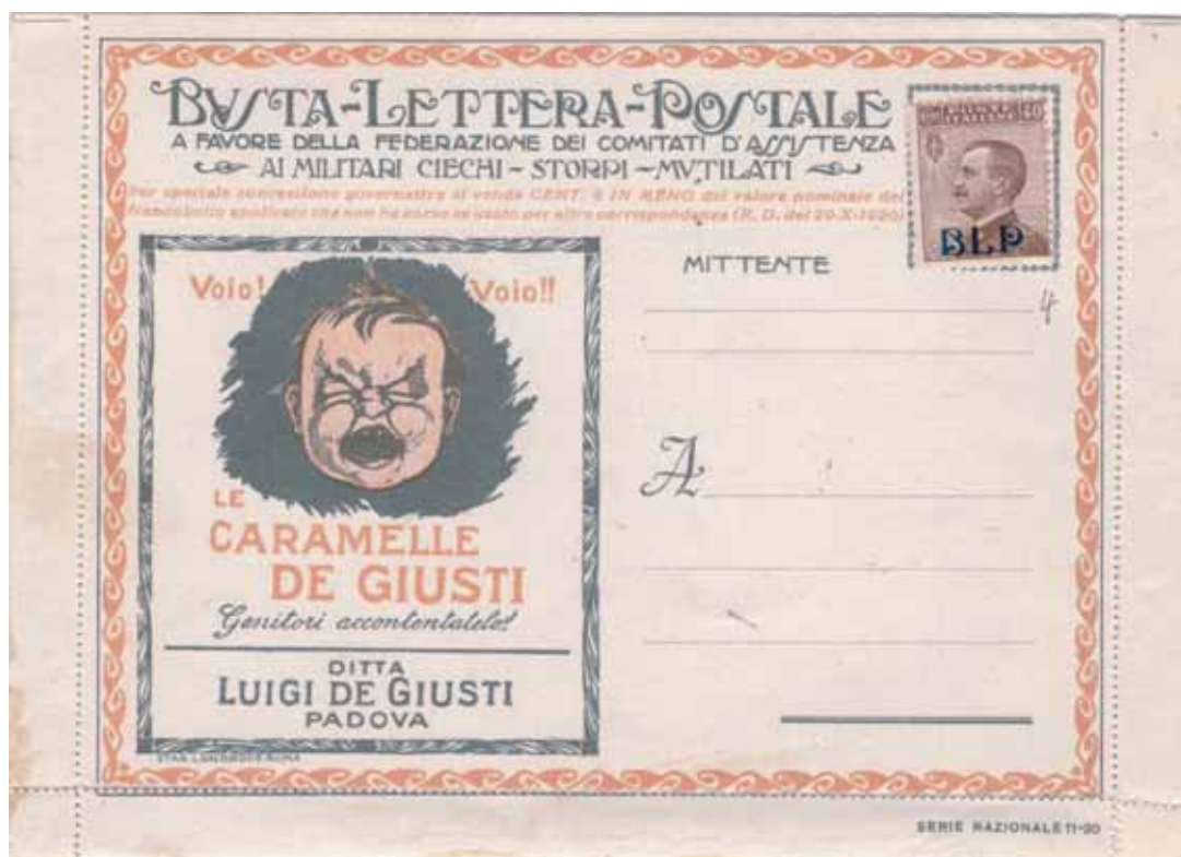
Busta-Lettera Postale nuova con esemplare da cent. 40 con soprastampa nera.