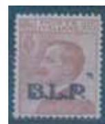
Esemplare nuovo da cent. 85 con soprastampa nera. e macchia tipografica. (E)