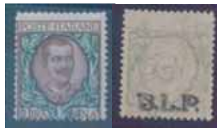
Esemplare nuovo da lire 1 con soprastampa nera stampata al recto. (E)