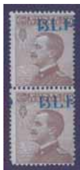
Esemplari in coppia verticale nuovi da cent. 40 con soprastampa azzurro nera spostata in alto a destra, tavole dello Zecchinato.