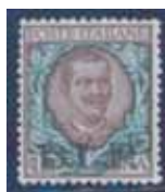
Esemplare nuovo da lire 1 con soprastampa nera. (E)