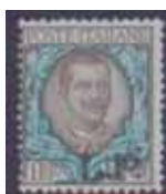
Esemplare nuovo da lire 1 con soprastampa nera con solo le lettere "L.P." (E).