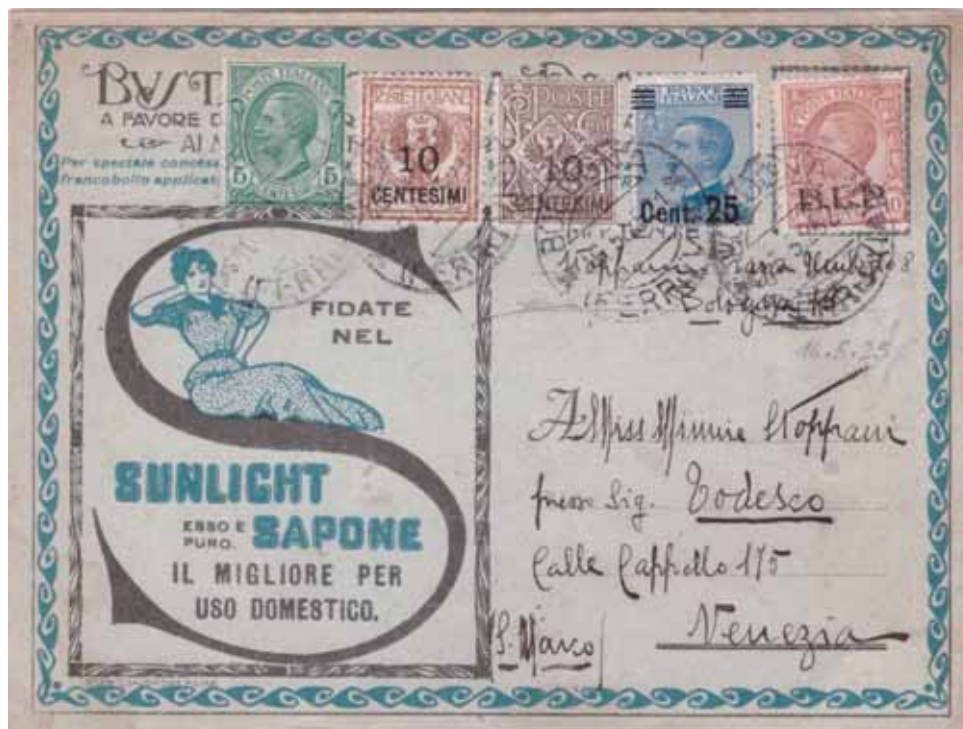
06.05.1925 Busta-Lettera Postale con esemplare da cent. 10 soprastampa nera e valori complementari, da Bologna a Venezia. Presenza di tre valori gemelli da 10 centesimi. Tariffa primo porto cent. 60. (E)