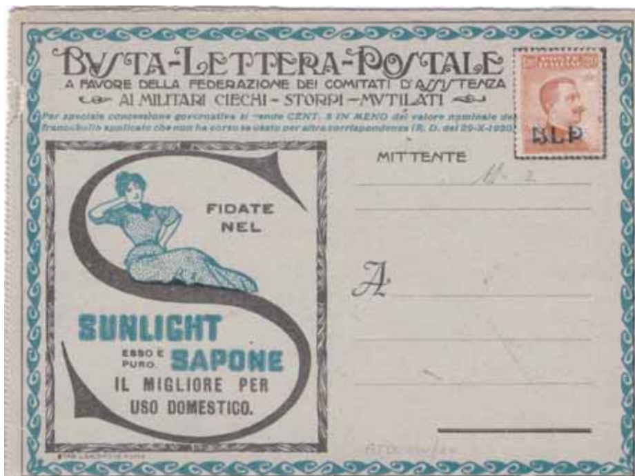
Busta-Lettera Postale nuova con esemplare da cent. 20 con soprastampa azzurra.