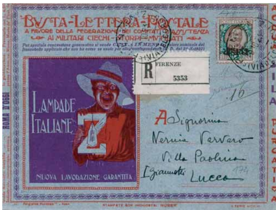
10.10.1923 Busta-Lettera Postale, raccomandata con esemplare da lire 1 con soprastampa nera capovolta, in uso isolato da Firenze a Lucca. Tariffa primo porto cent. 50 più diritto raccomandazione cent. 50. Noti 3 esemplari (E)