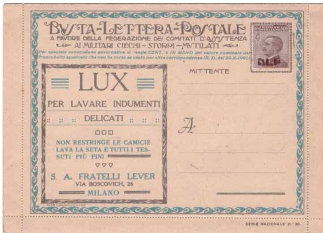
Busta-Lettera Postale nuova con esemplare da cent. 40 con soprastampa vinacea.