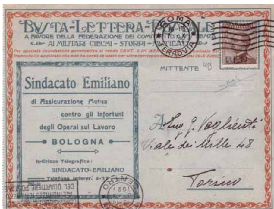
13.08.1921 Busta-Lettera Postale con esemplare da cent. 40 con soprastampa violetta. in uso isolato da Roma diretta a Torino. Tariffa primo porto cent. 40.