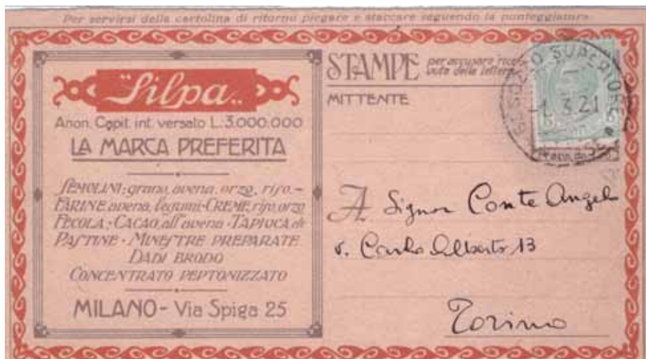
01.03.1921 Cartolina di ritorno di Busta-Lettera Postale affrancata con cent. 5 Leoni valore ordinario viaggiata da Besozzo Superiore (VA) diretta a Torino. Tariffa stampa per cedola di risposta cent 5. (E)