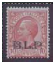
Esemplare nuovo da cent. 10 con soprastampa nera. (E)

L'impressione misura 13,5 millimetri di larghezza per 3,8 millimetri di altezza. La distanza tra le soprastampe – interspazio verticale – è di circa 21 - 22 millimetri; invece quella tra le soprastampe della stessa fila orizzontale – interspazio orizzontale – è di 8,5 millimetri.