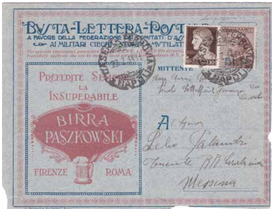
22.02.1934 Busta-Lettera Postale con esemplare da cent. 40 soprastampa azzurro nera 1° tipo. e valore ordinario complementare in frode postale in quanto usato fuori periodo di validità dei "B.L.P." viaggiata da Caserta a Messina e sfuggita a tassazione. Tariffa primo porto cent. 50.