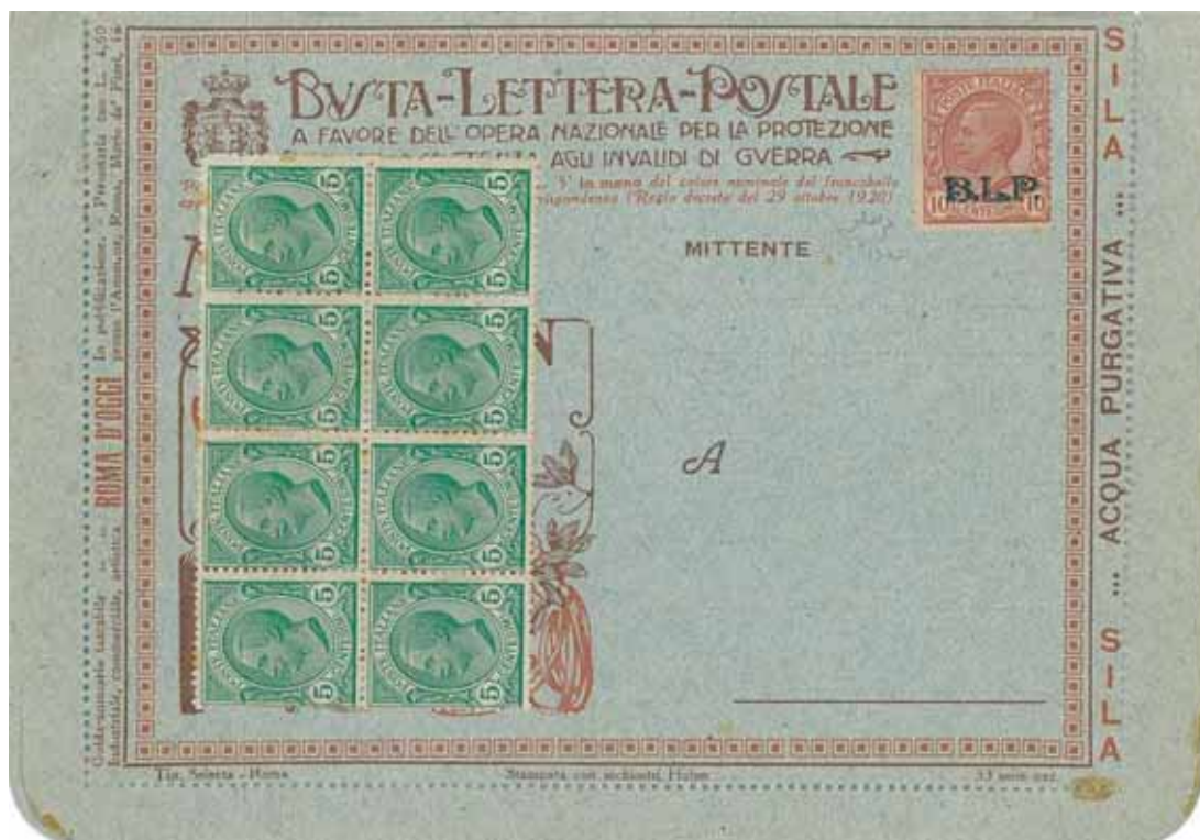
Busta-Lettera Postale nuova con esemplare da Cent.10 con soprastampa azzurra e valori complementari.