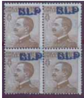
Esemplari in quartina nuovi da cent. 40 con soprastampa azzurro nera spostata in alto a destra. (E)