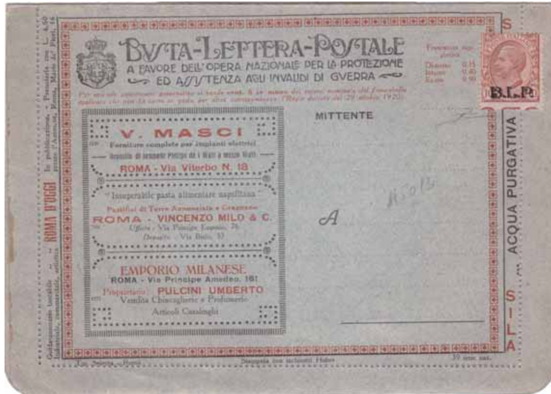
Busta lettera postale nuova con cent. 10 soprastampa nera, varietà di dentellatura con diciture marginali di foglio.