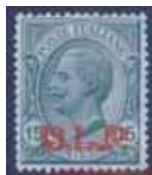
Esemplare nuovo da cent. 15 con soprastampa rossa. (E)