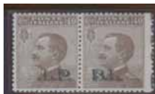
Coppiola di esemplari nuovi, centesimi 40, con soprastampa ardesia, il primo non presenta in soprastampa la lettera "B"; il secondo senza la lettera "P". Conosciuti 12 esemplari del primo ed 11 esemplari del secondo francobollo. (E)