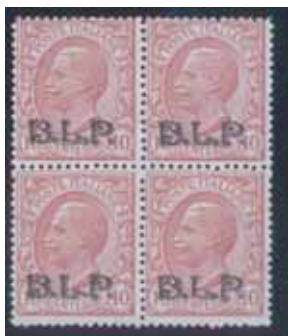
Quartina di esemplari nuovi da cent. 10 con soprastampa nera. (E)

L'impressione misura 11,5 millimetri di larghezza per 3,8 millimetri di altezza. La distanza tra le soprastampe – interspazio verticale – è mutevole perchè numerosi sono stati i rifacimenti delle tavole dovute a rotture o deterioramenti dei caratteri tipografici metallici; invece quella tra le soprastampe della stessa fila orizzontale – interspazio orizzontale – è di 6,5 millimetri.