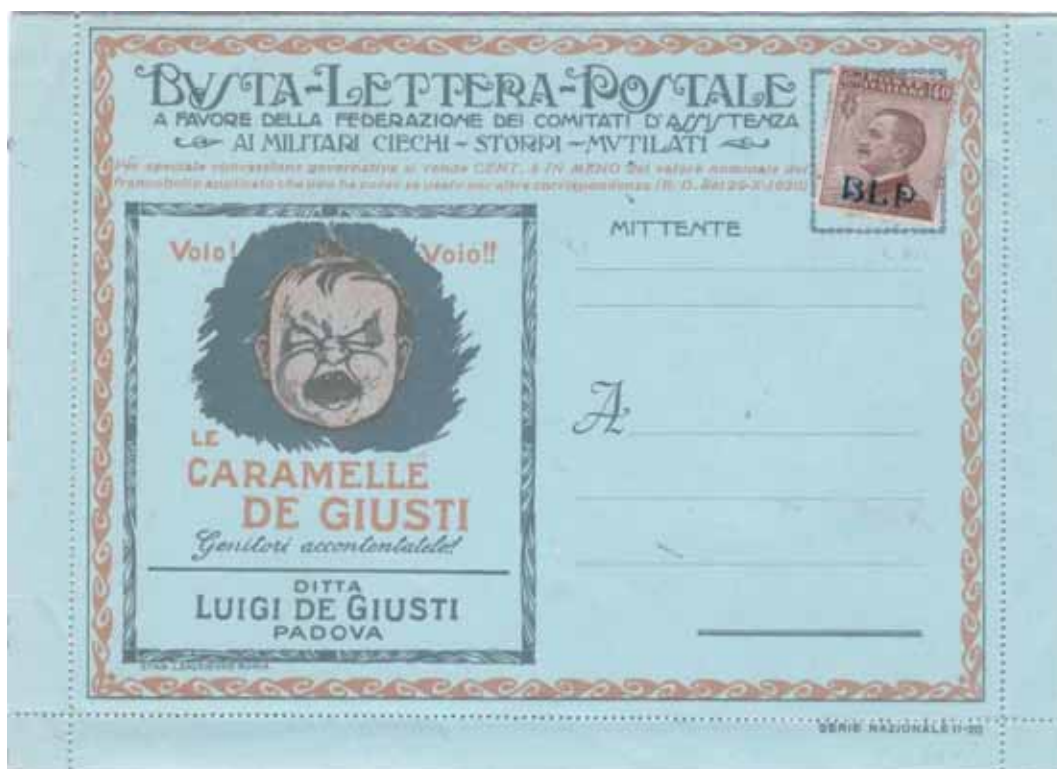
Busta-Lettera Postale con esemplare cent. 40 con soprastampa azzurro nera.