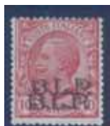
Esemplare nuovo da cent. 10 con doppia soprastampa nera. (E)