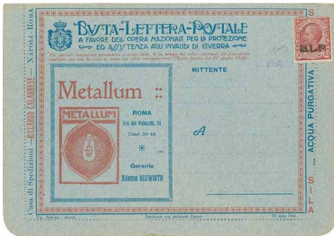
Busta-Lettera Postale nuova con esemplare da cent. 10 con soprastampa bruna.