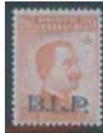
Esemplare nuovo da cent. 20 con soprastampa ardesia. (E)