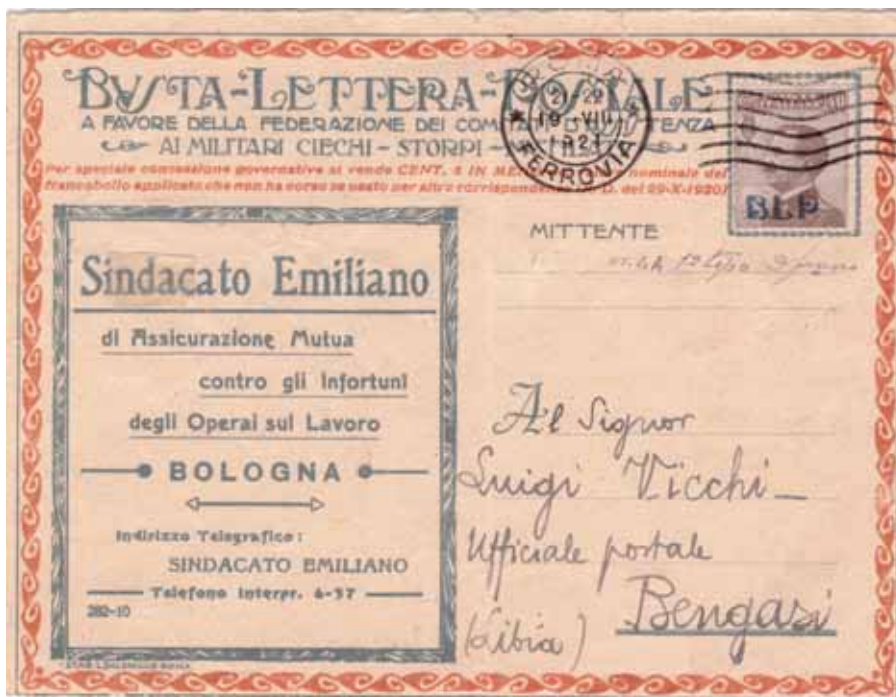
19.08.1921 Busta-Lettera Postale con esemplare di cent. 40 con soprastampa azzurro nera, da Roma diretta a Bengasi in Libia. Tariffa primo porto cent. 40.