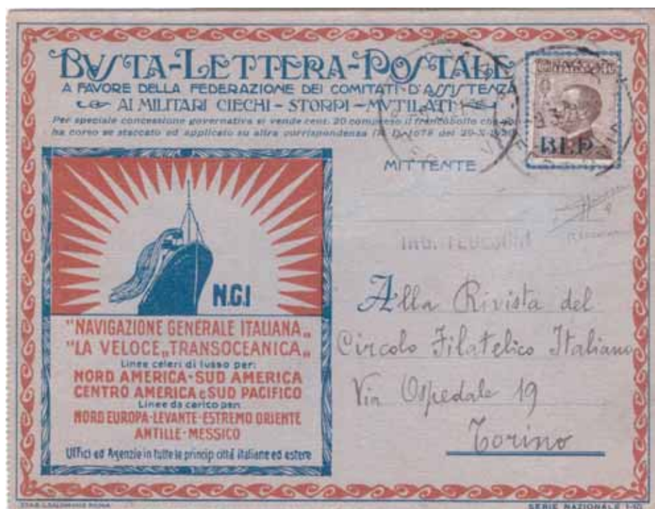
06.03.1921 Busta-Lettera Postale con esemplare da cent. 40 con sovrastampa azzurro nera tavole dello Zecchinato, in uso isolato da Roma diretta a Torino. Tariffa di primo porto cent. 40.