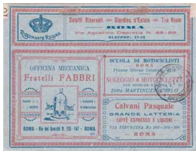
01.02.1924 Busta-Lettera Postale raccomandata con cent. 20 con soprastampa in ardesia e valori complementari in quartina e commemorativo. Viaggiata da Roma a Bologna. Tariffa primo porto centesimi 50 più diritto di raccomandazione centesimi 50. (E) (Riduzione al 30% del retro)