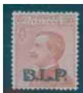
Esemplare nuovo da cent. 30 con soprastampa nera. (E)