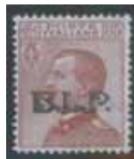
Esemplare nuovo da cent. 85 con soprastampa nera. spostata in alto. (E)