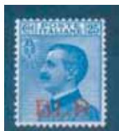
Esemplare nuovo da cent. 25 azzurro con soprastampa rossa. (E)