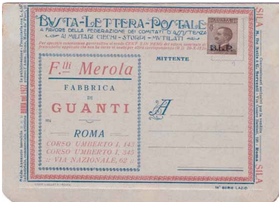
Busta-Lettera Postale nuova con esemplare da cent. 40 con soprastampa ardesia.