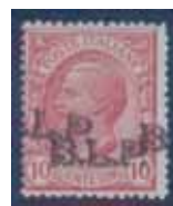
Esemplare nuovo da cent. 10 con doppia soprastampa bruna di cui una spostata e obliqua. (E)