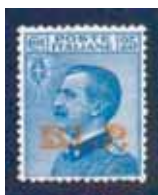
Esemplare nuovo da cent. 25 con soprastampa arancione. (E)