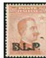
Esemplare nuovo da cent. 20 con soprastampa nera e macchia tipografica. (E)