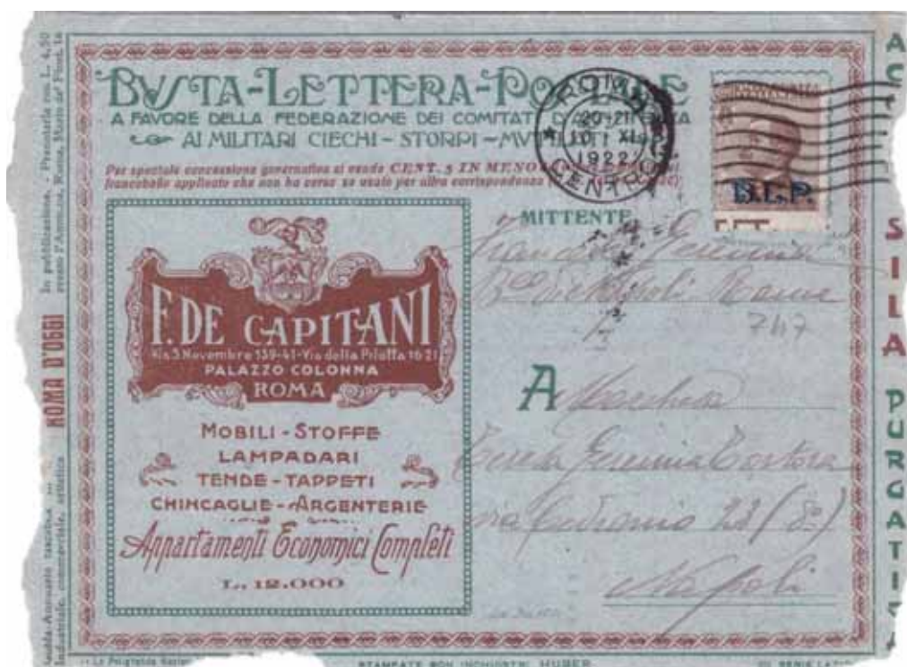
10.11.1922 Busta-Lettera Postale con esemplare da cent. 40 soprastampato in ardesia con dentellatura fortemente spostata in basso e diciture marginali di foglio, in uso isolato da Roma a Napoli. Tariffa primo porto cent. 40. (E)