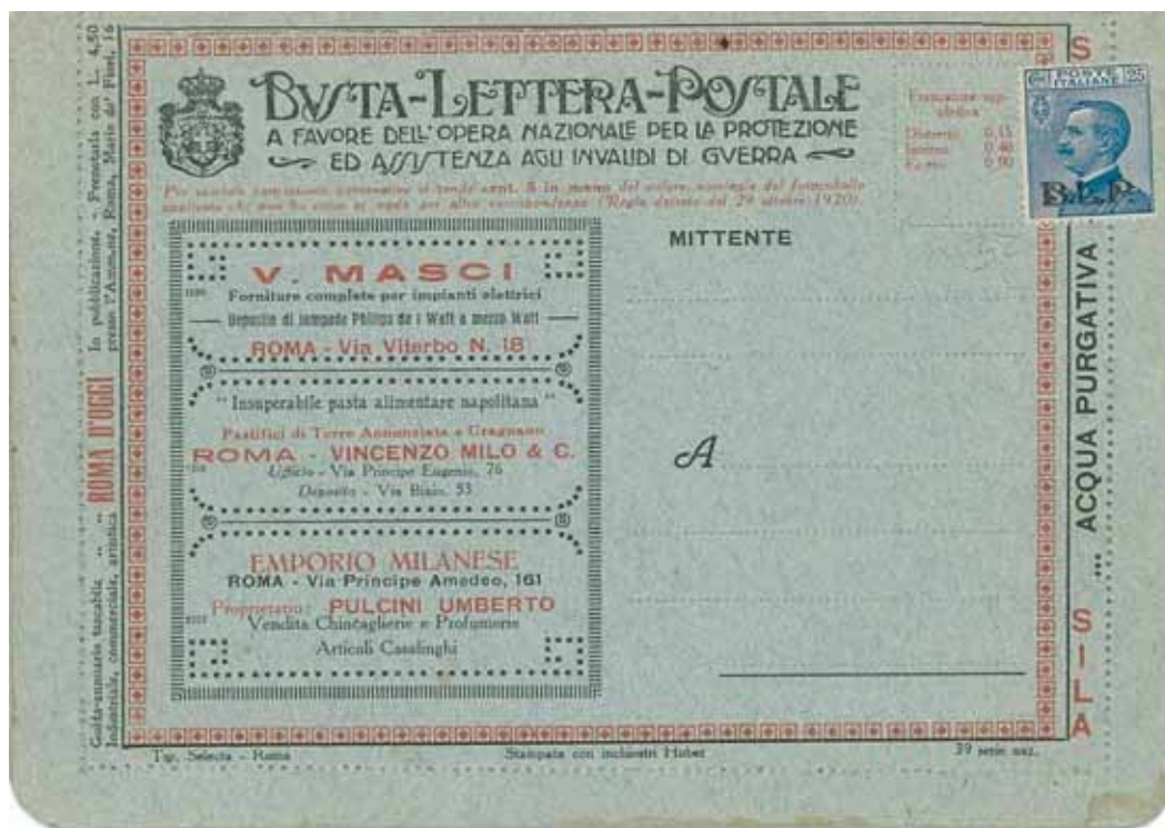
Busta-Lettera Postale nuova con esemplare da cent. 25 con soprastampa nera.