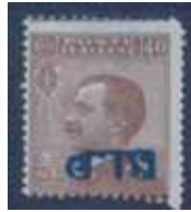
Esemplare nuovo da cent. 40 con soprastampa azzurro nera stampata capovolta.