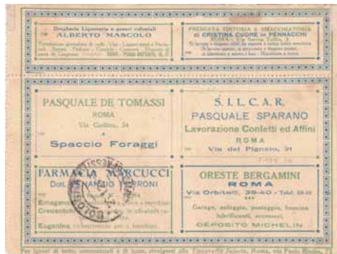
25.01.1924 Busta-Lettera Postale espresso tramite posta pneumatica con esemplare da cent. 10 con sovrastampa bruna, e complementari, con valori gemelli da centesimi 10, un valore commemorativo, un espresso e posta pneumatica da Roma a Bologna. Tariffa di primo porto cent. 50, espresso cent. 60 e posta pneumatica cent.15. (E) (Riduzione al 30% del retro)