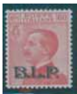
Esemplare nuovo da cent. 60 con soprastampa nera. (E)