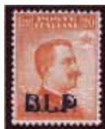
Esemplare nuovo da cent. 20 con soprastampa nera. (E)