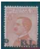
Esemplare nuovo da cent. 30 con soprastampa nera fortemente spostata in basso. (E)