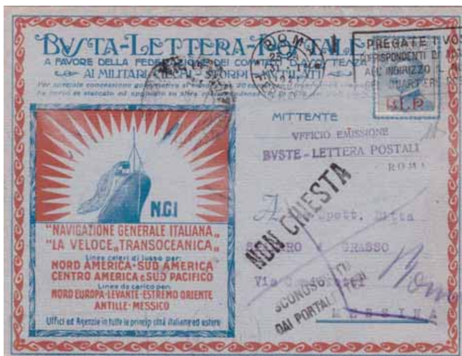
31.01.1921 Busta-Lettera Postale con cent. 25 con soprastampa rossa con timbri lineari accessori "Sconosciuto al portalettore" e "Non chiesta" e restituita al mittente, viaggiata in uso isolato da Roma diretta a Messina. Tariffa di primo porto cent. 25.