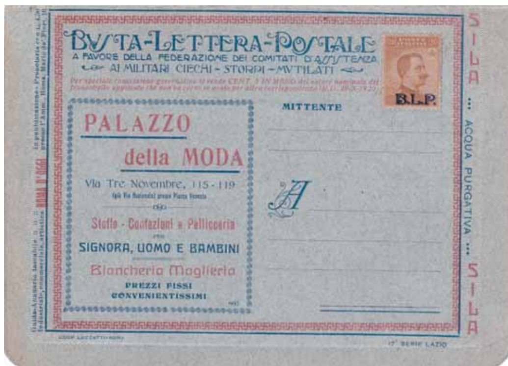
Busta-Lettera Postale nuova con esemplare da cent. 20 con soprastampa nera.