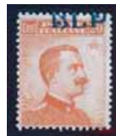
Esemplare nuovo da cent. 20 con soprastampa azzurra fortemente spostata in alto. (E)