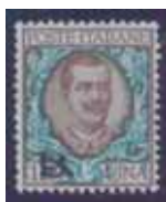
Esemplare nuovo da lire 1 con soprastampa nera della sola "B". Due esemplari noti. (E)