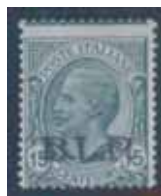
Esemplare nuovo da cent. 15 con soprastampa nera. (E)