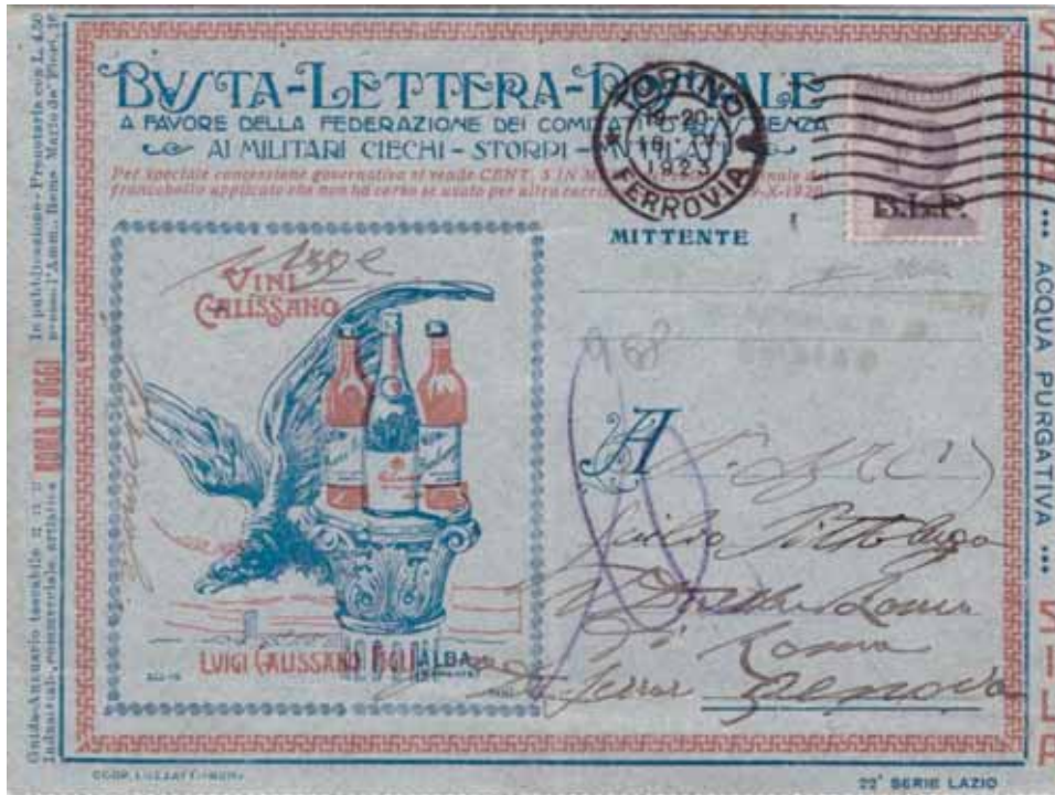
18.04.1923 Busta-Lettera Postale con cent. 50 con soprastampa nera in uso isolato da Torino a Genova. Tariffa di primo porto cent. 50. (E)