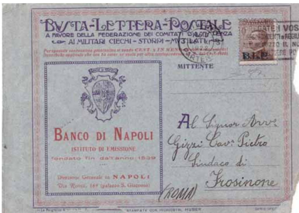
25.11.1922 Busta-Lettera Postale con cent. 40 con soprastampa ardesia in uso isolato da Milano a Frosinone. Tariffa di primo porto cent. 40. (E)