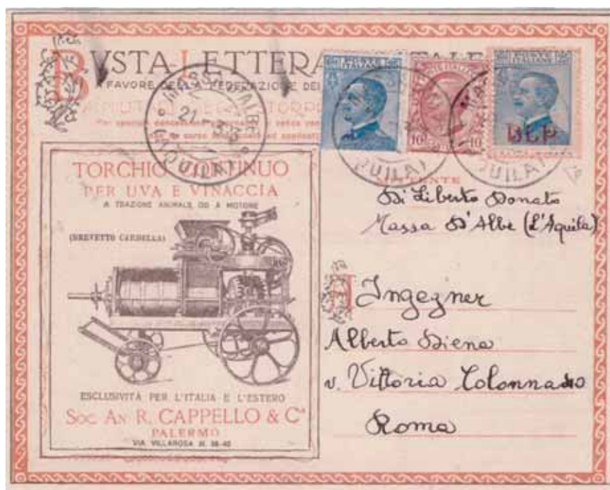
21.03.1923 Busta-Lettera Postale con esemplare da cent. 25 con soprastampa rossa e valori complementari, con valori gemelli da Massa d'Albe (AQ) diretta a Roma. Tariffa primo porto cent. 50.