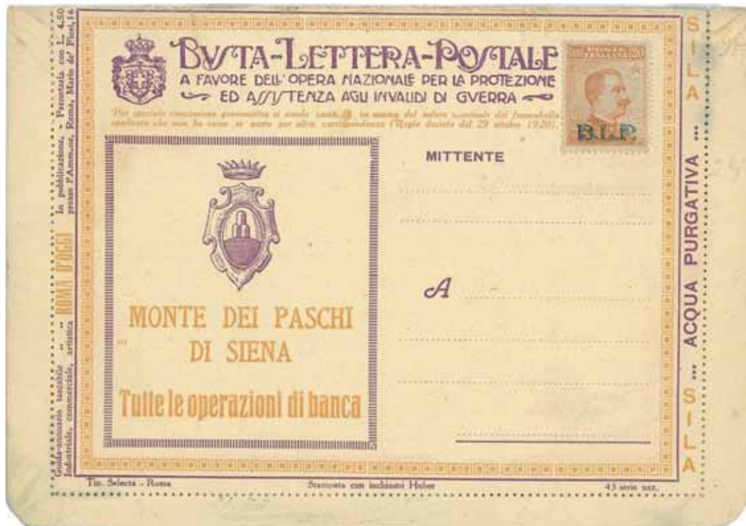
Busta-Lettera Postale nuova con esemplare da cent. 20 con soprastampa ardesia.