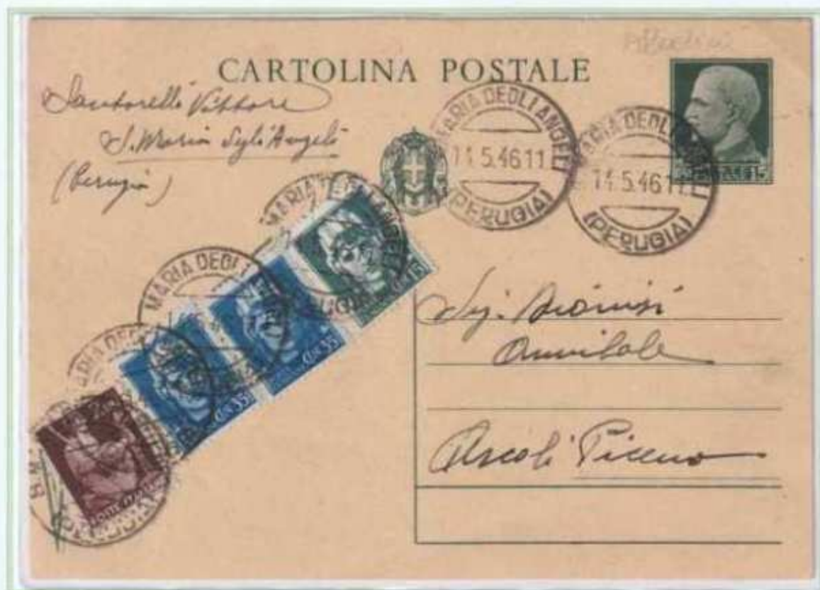
14/05/1946 - Cartolina postale tariffa 3 L. da S. Maria degli Angeli a Ascoli Piceno assolta integrando una cartolina postale del regno da 15 c. . I francobolli furono apposti per coprire la scritta "VINCEREMO".