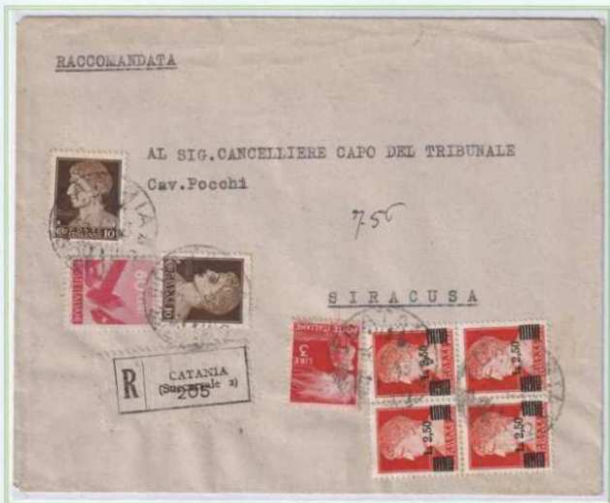
04/06/1946 - Lettera raccomandata tariffa 14 L. (4 L. di lettera e 10 L. di raccomandazione) da Catania a Siracusa, i valori imperiale e democratica sono accompagnati da una quartina del 2,50 L. soprastampato di luogotenenza.