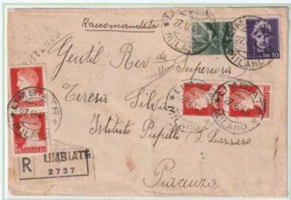
27/06/1946 - Lettera 2 porti raccomandata tariffa 18 L (8 L di 2 porti di lettera e 10 L di raccomandazione) da Limbiate a Piacenza, assolta con valori imperiale, democratica e luogotenenza emissione di Roma.