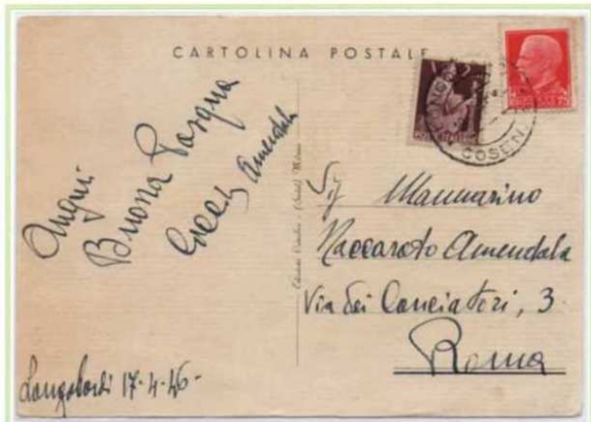
19/04/1946 - Cartolina illustrata tariffa 2 l. da Longobardi a Roma. La cartolina fu affrancata in eccesso di 75 c. molto probabilmente il mittente utilizzò il valore imperiale con l'effigie del Re come propaganda elettorale, il referendum per la scelta fra monarchia e repubblica era infatti prossimo.