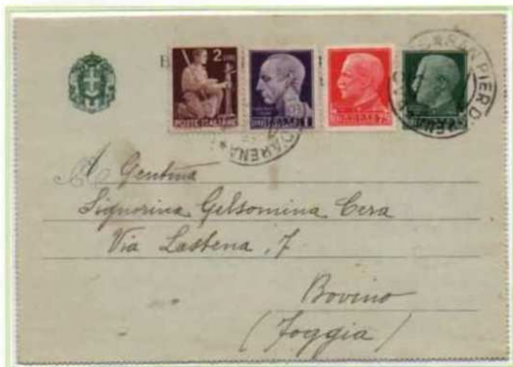
18/04/1946 - Biglietto postale da 25 c. del Regno spedito come lettera tariffa 4 l. da Sampierdarena a Bovino, oltre ai valori imperiale e democratica è presente un valore di luogotenenza emissione di Roma.