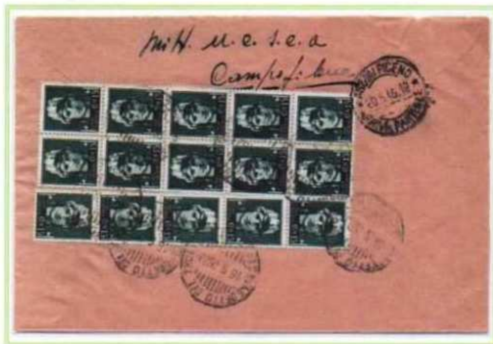
18/05/1946 - Lettera semplice tariffa 4 L da San Benedetto del Tronto ad Ascoli Piceno. Affrancatura fronte/retro con ben 21 valori, classico esempio dello smaltimento dei valori di piccolo taglio sollecitato dal Ministero nel bollettino n° 8 del marzo 1946.