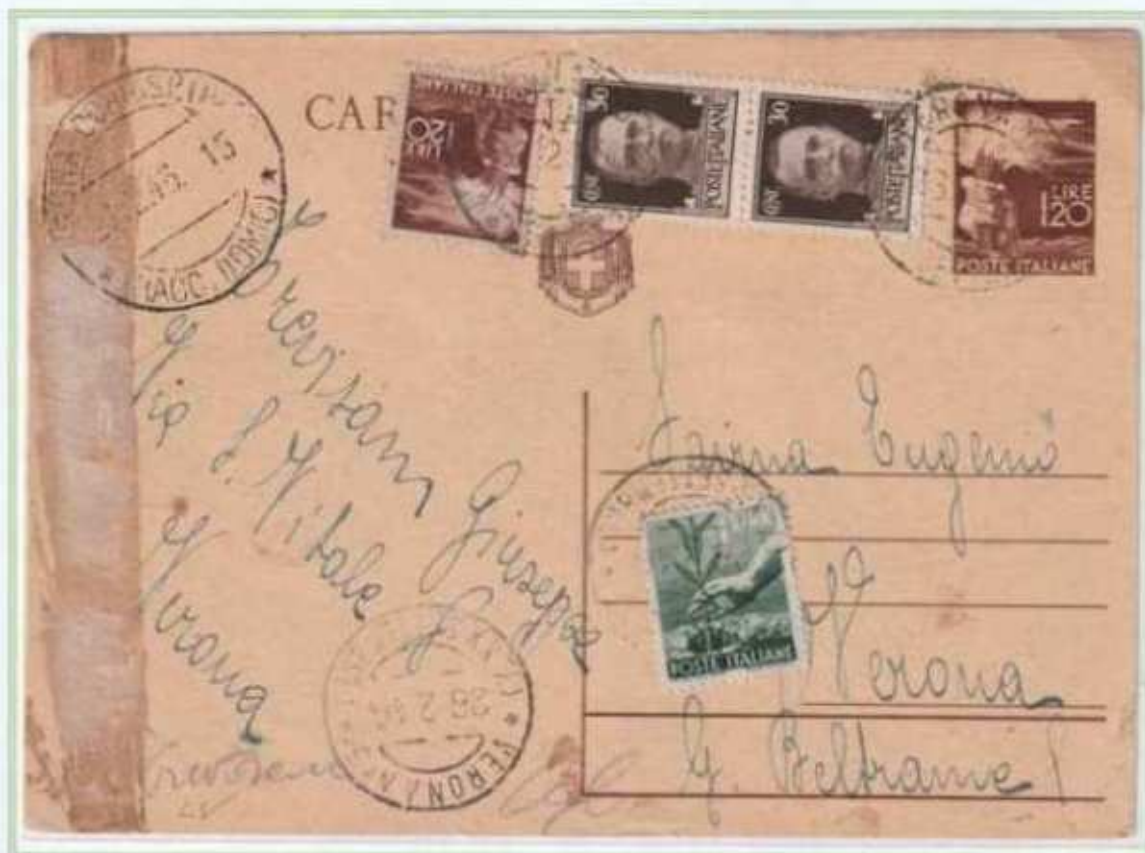
26/02/1946 - Avviso di ricevimento tariffa 4 l. da Verona per città. In luogo del normale A.R. fu utilizzata in emergenza una cartolina postale da 1,20 l. democratica.