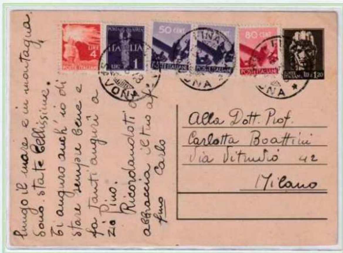
16/03/1948 - Cartolina postale tariffa 8 L da Finalpia a Milano.