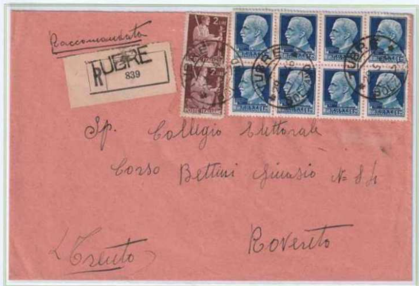
29/05/1946 - Lettera raccomandata tariffa 14 l. (4 l. di lettera e 10 l. di raccomandazione) da Tubre a Rovereto.