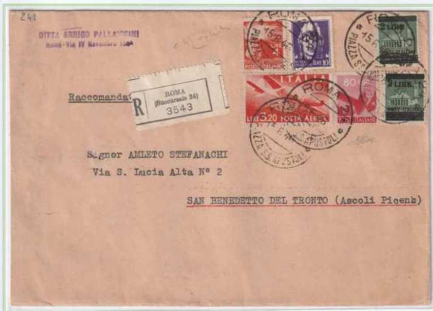
15/06/1946 - Lettera 3 porti raccomandata tariffa 22 l. (12 l. di 3 porti di lettera e 10 l. di raccomandazione) da Roma a S. Benedetto del Tronto, l'uso del 4 l. democratica emesso il 10 maggio con il valore di posta aerea e l'imperiale fu possibile per soli cinquanta giorni.