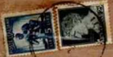
15/05/1946 - Stampe 21 porti raccomandate con assegno tariffa 30 l. (21 l. di 21 porti di stampe, 5 l. di raccomandazione aperta e 4 l. di assegno) da Casalbordino a Civitella Roveto.