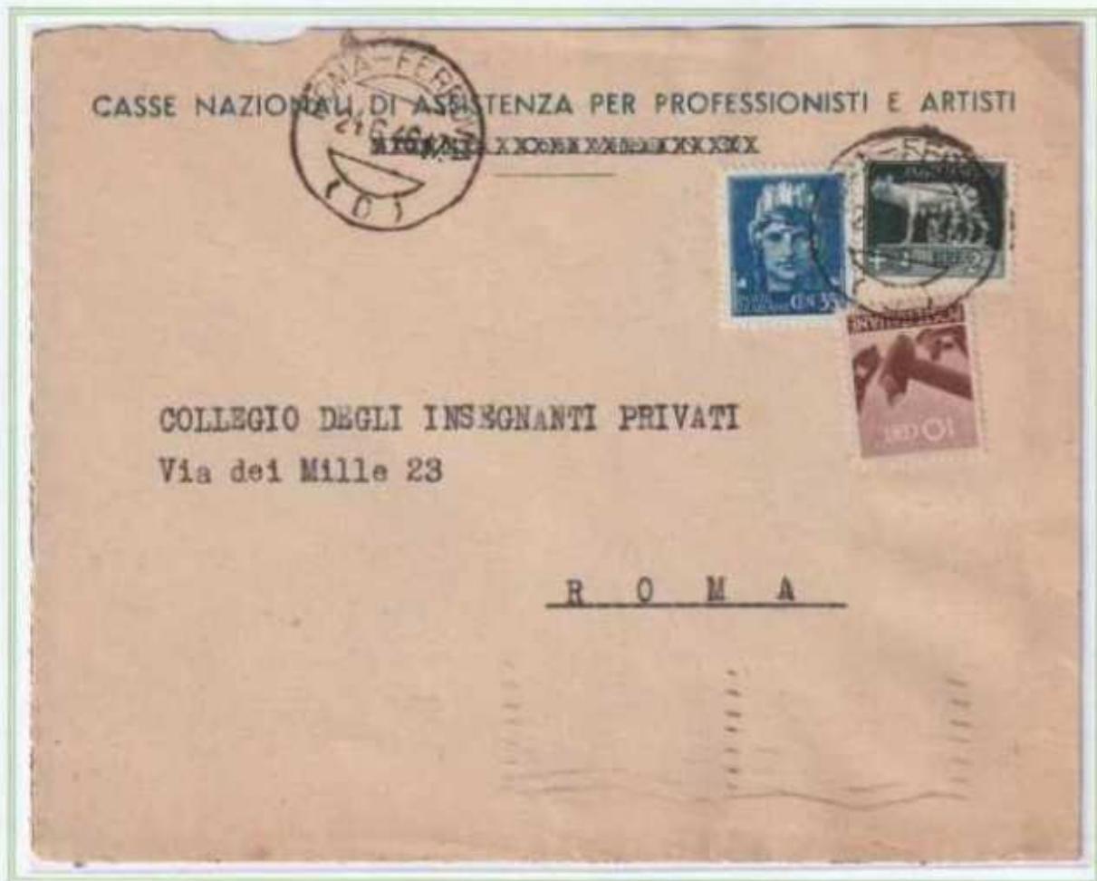
24/06/1946 - Lettera in distretto tariffa 3 l. da Roma per città.