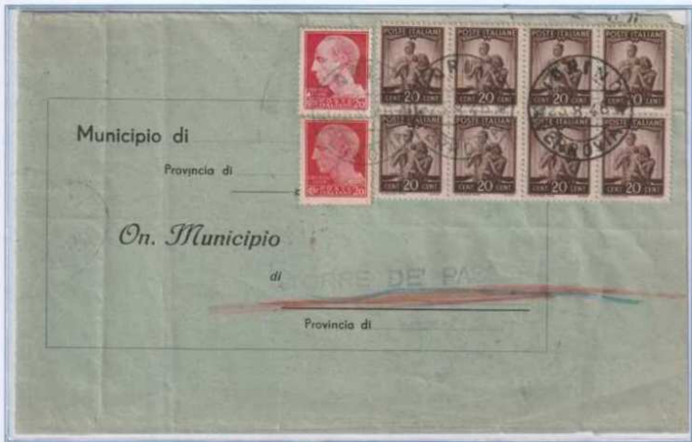
23/08/1946 - Lettera sindaci tariffa 21, da Torino a Torre de Passeri, affrancatura con tre gemelli, ai 20 c. democratica si uniscono il 20 c. imperiale il 20 c. luogotenenza emissione di Novara fuori corso da oltre un mese.