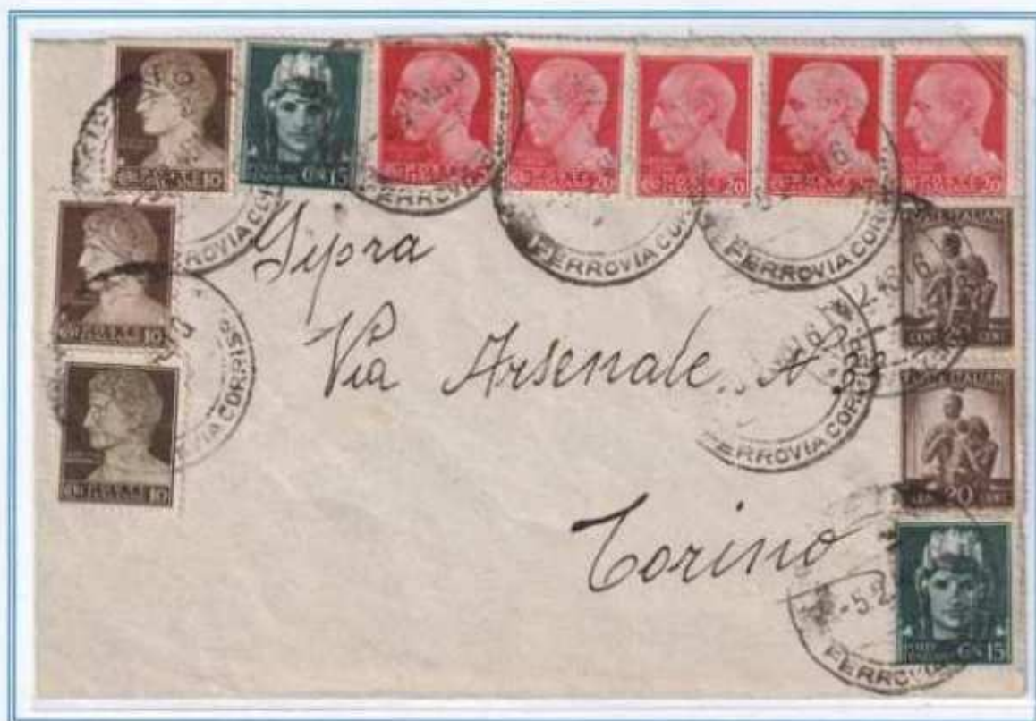
05/02/1946 - Lettera semplice tariffa 4 l. da Milano a Torino, il 10 c. imperiale è in combinazione con il valore democratica e a diversi valori di luogotenenza sia emissione di Roma che di Novara. Affrancatura interessante che comprende i gemelli del 10 c. e una triplice gemellare del 20 c., inoltre la lettera affrancata con la vecchia tariffa di 2 l. valida fino al 31 gennaio non venne tassata.