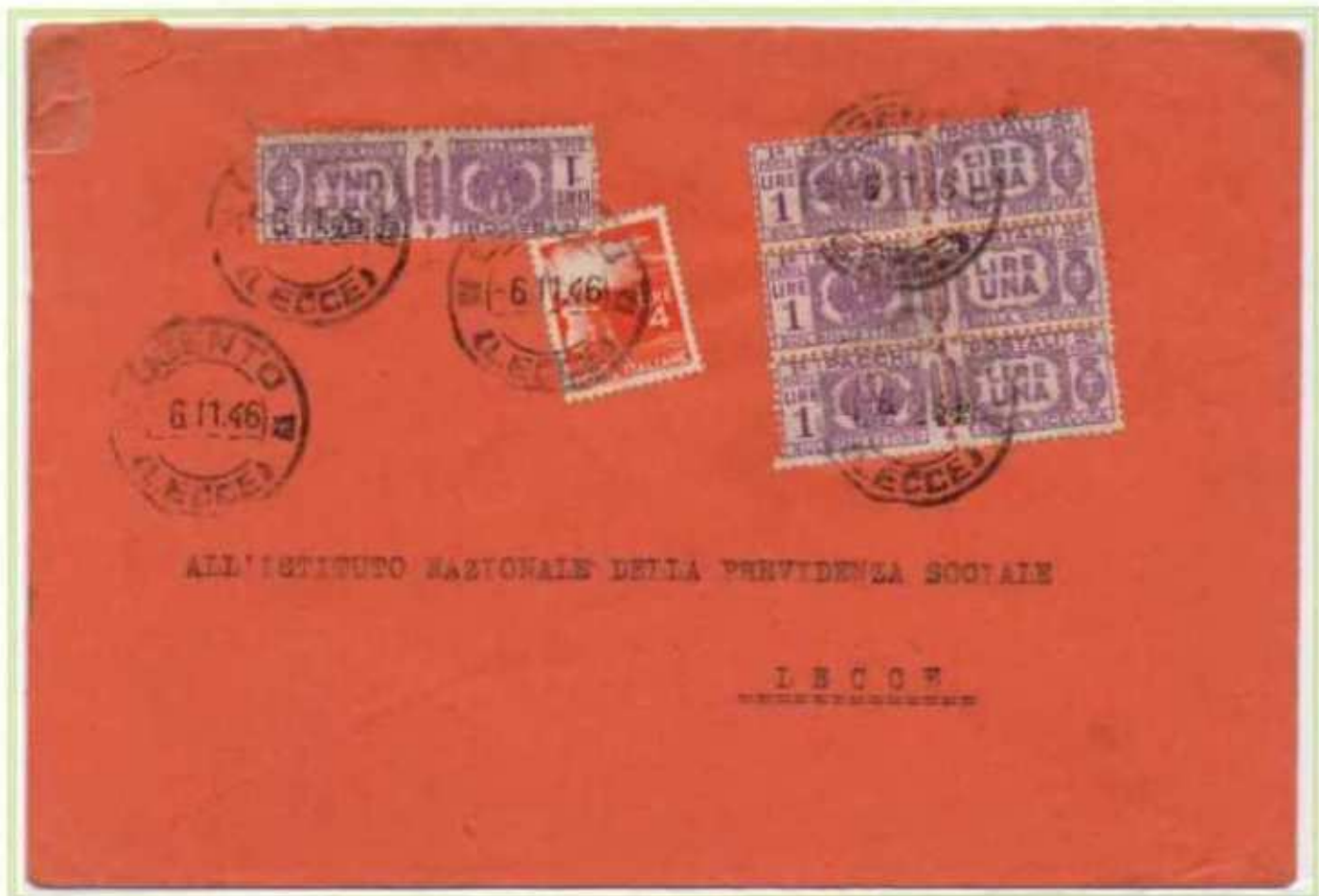
06/11/1946 - Lettera 2 porti tariffa 8 L. da Ugento a Lecce.