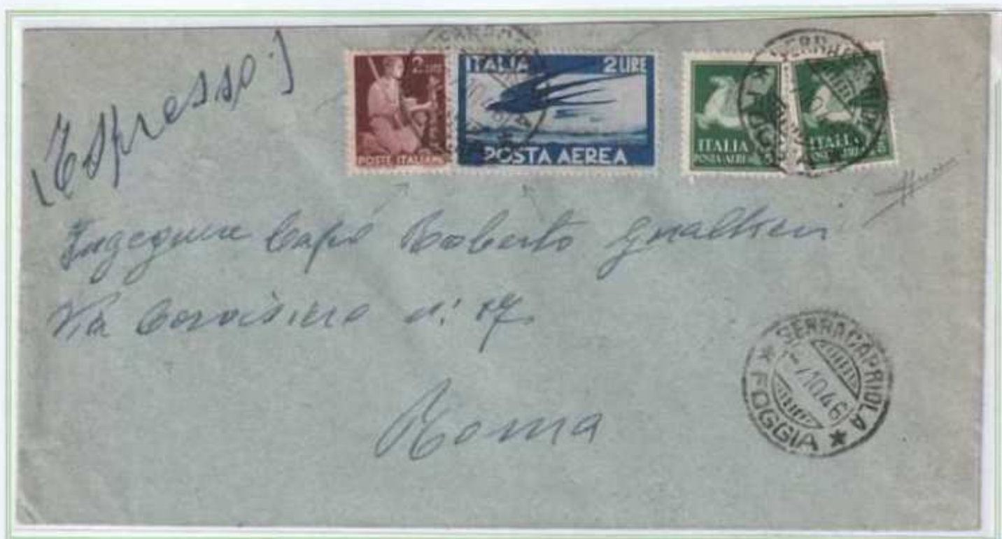
07/10/1946 - Lettera espresso tariffa 14 L. (4 L. di lettera e 10 L. di espresso) da Serracapriola a Roma. (e)