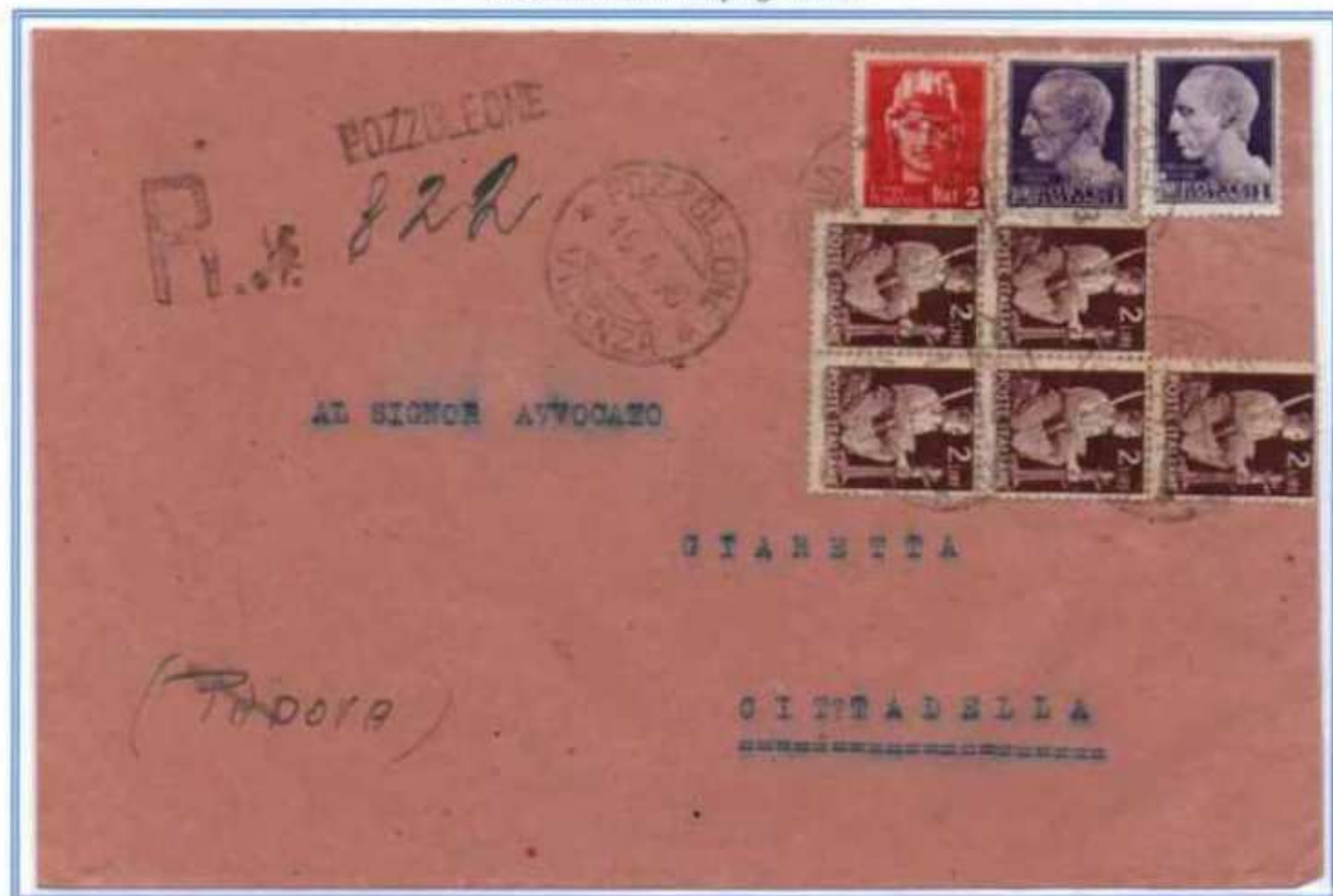
15/04/1946 - Lettera raccomandata tariffa 14 l. (4 l. di lettera e 10 l. di raccomandazione) da Pozzoleone a Cittadella. L'affrancatura con doppi gemelli oltre ai valori imperiale e democratica è completata con un 2 l. luogotenenza di Roma e un valore da 1 l. luogotenenza di Novara.