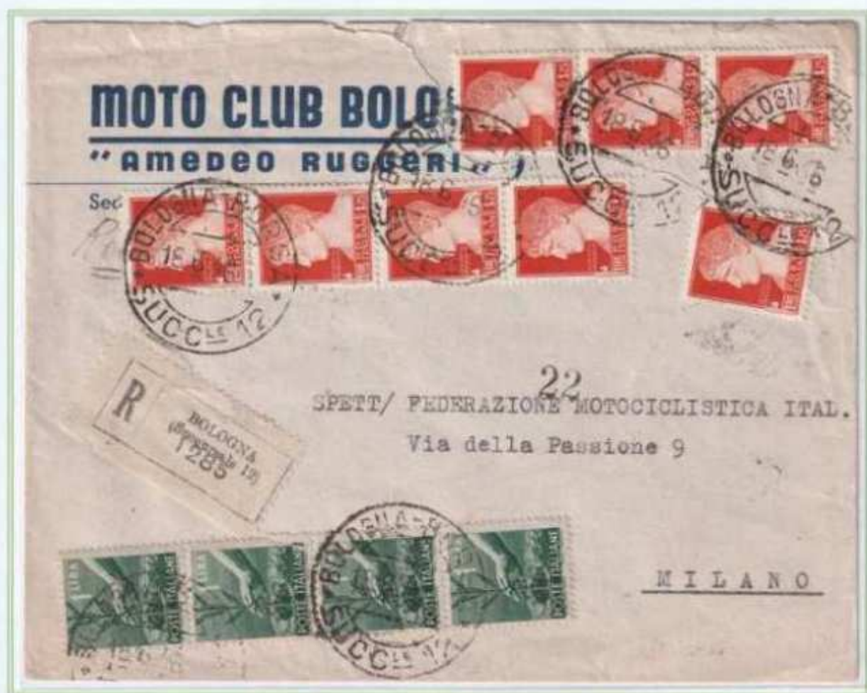
18/06/1946 - Lettera 2 porti raccomandata tariffa 18 l. (8 l. di 2 porti di lettera e 10 l. di raccomandazione) da Bologna a Milano,