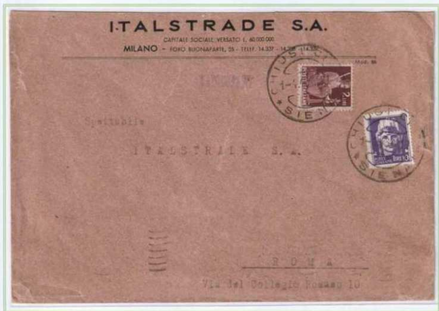
01/04/1946 - Lettera 3 porti tariffa 12L da Chiusi a Roma.