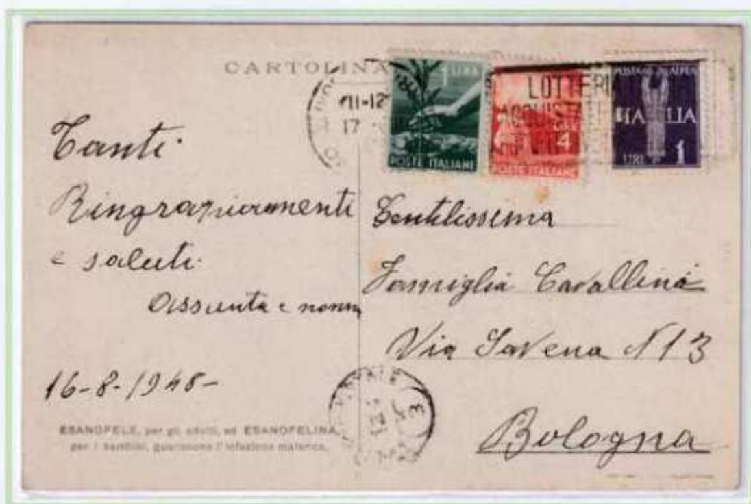
17/08/1948 - Cartolina illustrata tariffa 6 L, da Milano a Bologna con uso tardivo del valore imperiale.