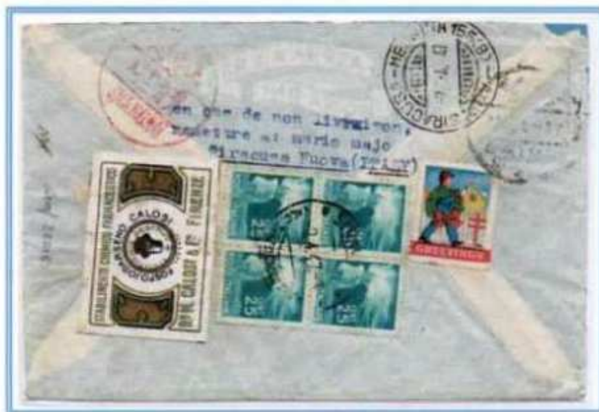
02/04/1947 - Lettera 2 porti raccomandata estero tariffa 45 l. ((15 l. per il 1° porto di lettera, 10 l. per il 2° porto di lettera e 20 l. di raccomandazione) da Siracusa a Shanghai (Cina). Destinazione non comune