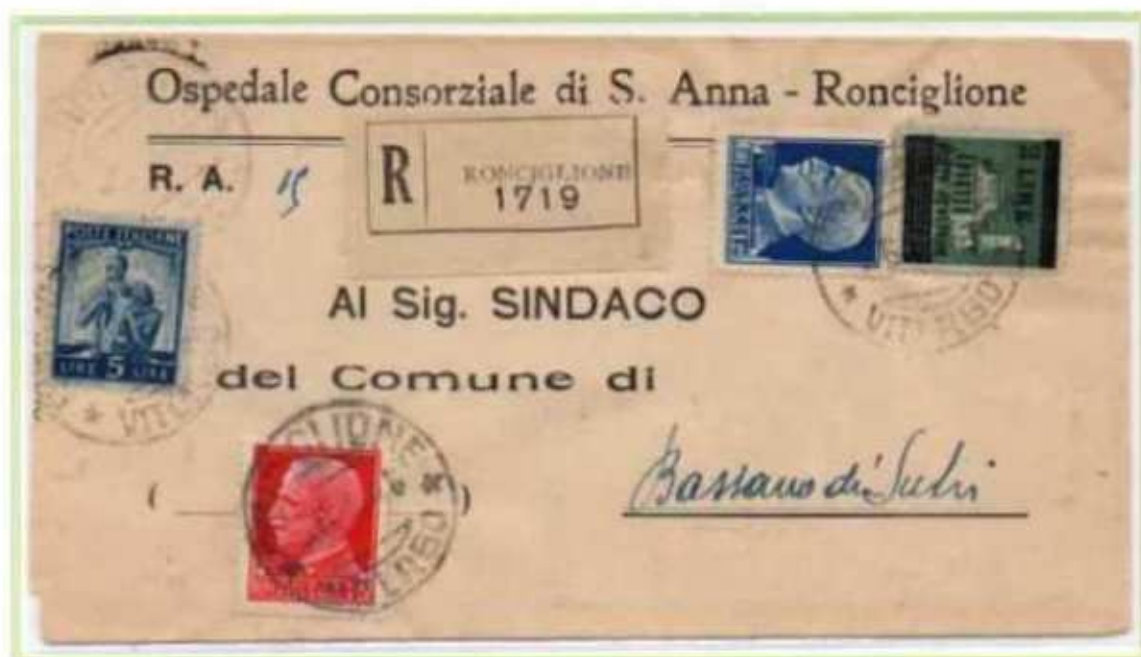
06/02/1946 - Lettera aperta raccomandata tariffa 91 (4 l. di lettera e 5 l. di raccomandazione aperta) da Ronciglione a Bassano di Sutri, oltre ai valori imperiale e democratica completa l'affrancatura un valore soprastampato di luogotenenza.