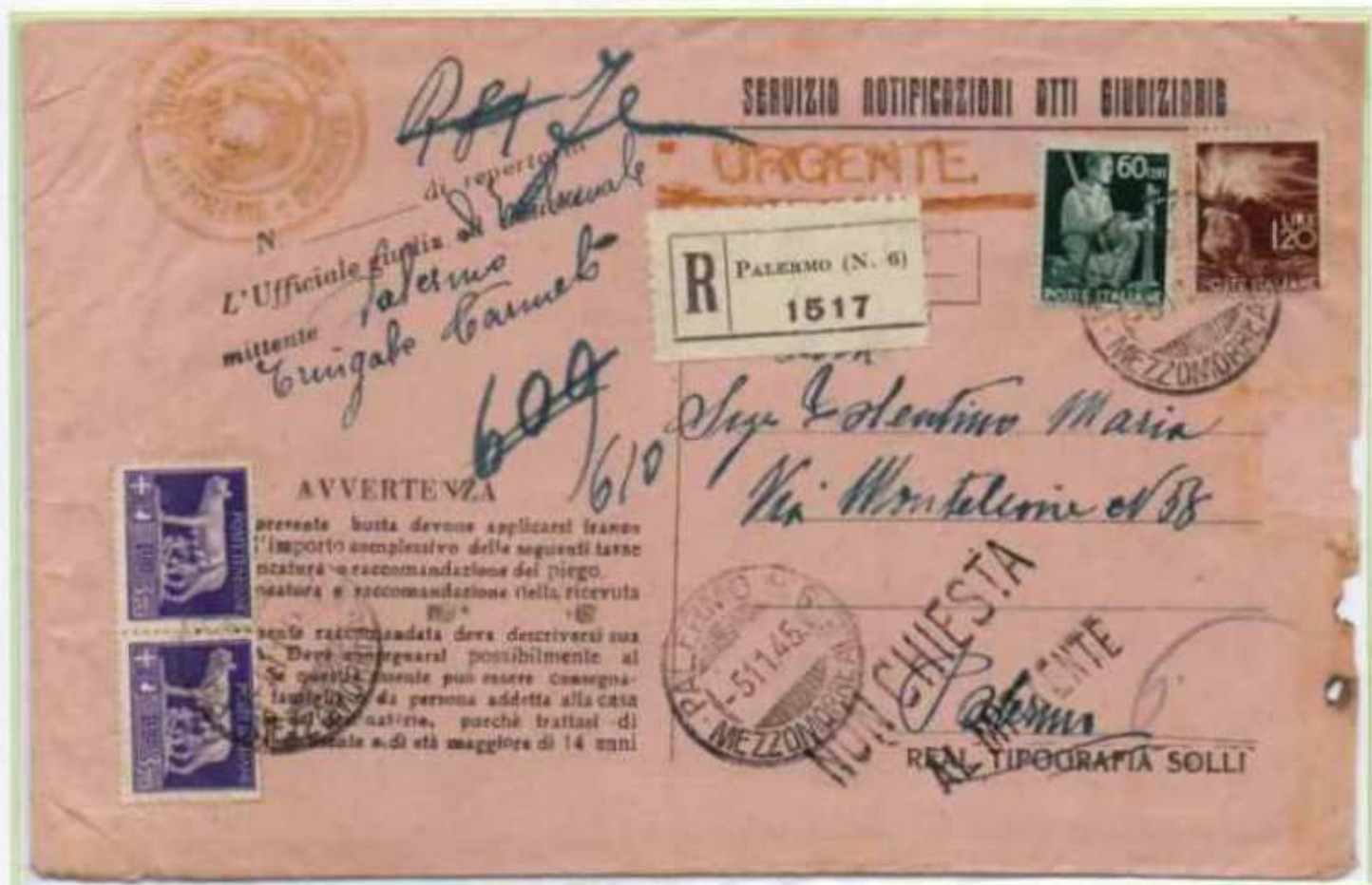
05/11/1945 - Manoscritto raccomandato atti giudiziari tariffa 9,20 l. (2,40 l. di manoscritto, 2,40 l. raccomandazione aperta, 2 l. avviso di ricevimento e 2,40 l. di raccomandazione dell'avviso di ricevimento) da Palermo per città.