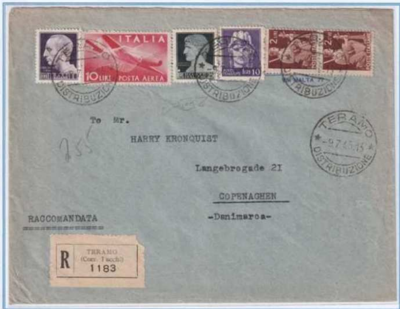
09/07/1946 - Lettera 2 porti estero raccomandata da 21 a 40 gr tariffa 45 L. (15 L. 1° porto di lettera, 10 L. 2° porto di lettera e 20 L. di raccomandazione) da Teramo a Copenaghen (Danimarca). Affrancatura in eccesso di 5 L. (e)