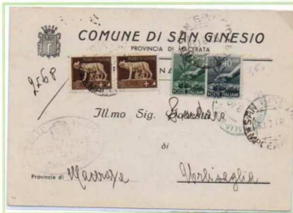
30/08/1946 - Cartolina postale tariffa ridotta fra sindaci tariffa 1,50 l. da Sane Ginesio a Urbisaglia.