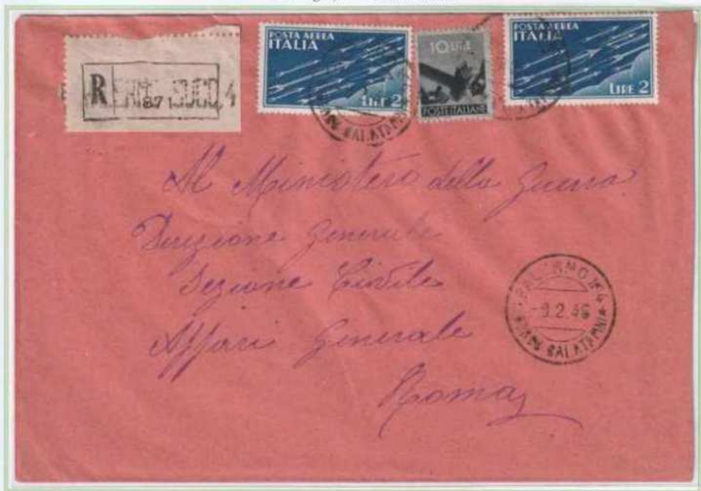
09/02/1946 - Lettera raccomandata tariffa 14 l. (4 l. di lettera e 10 l. di raccomandazione) da Palermo a Roma.