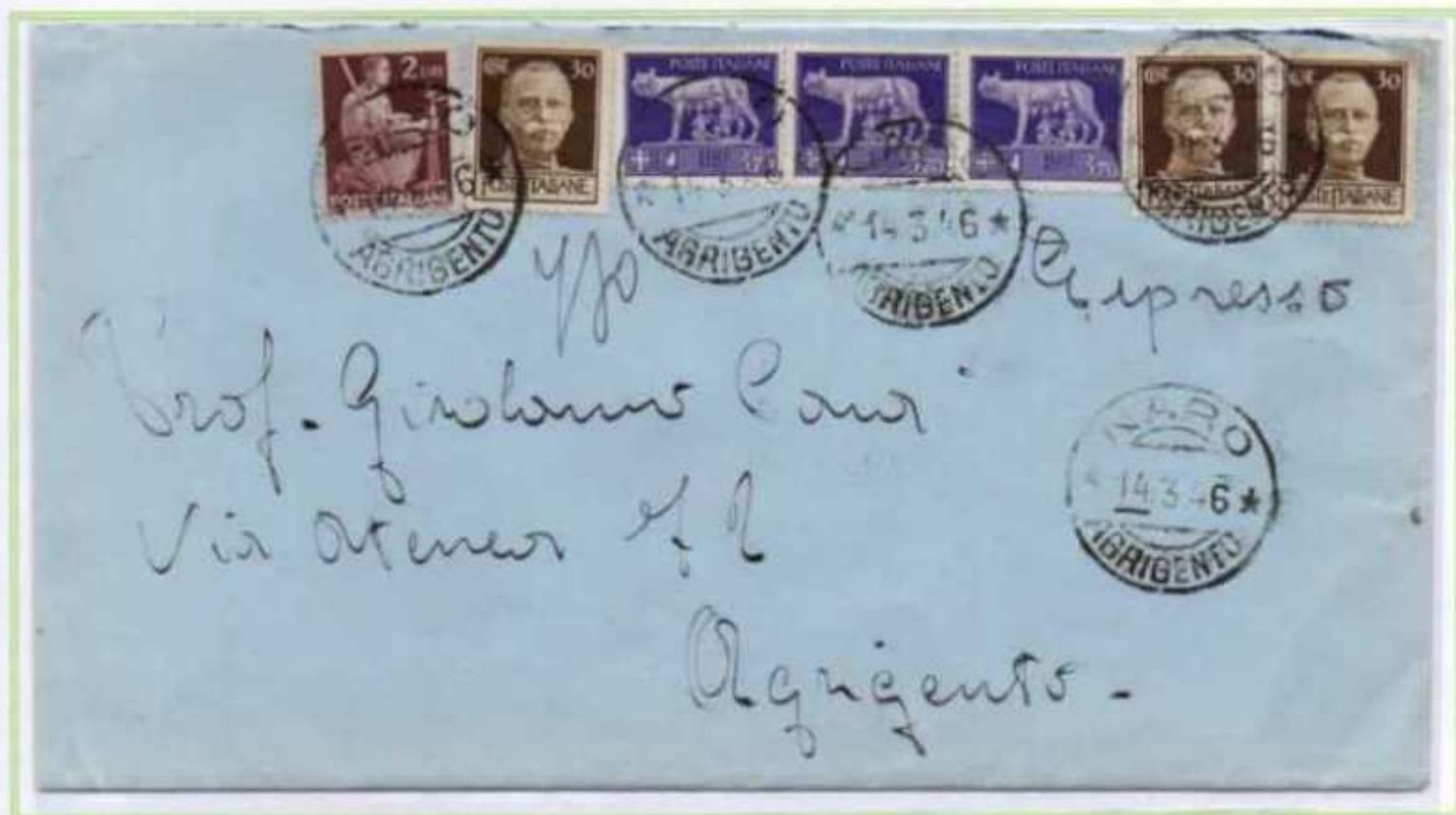
14/03/1946 - Lettera espresso tariffa 14 l. (4 l. di lettera e 10 l. di espresso) da Naro ad Agrigento.