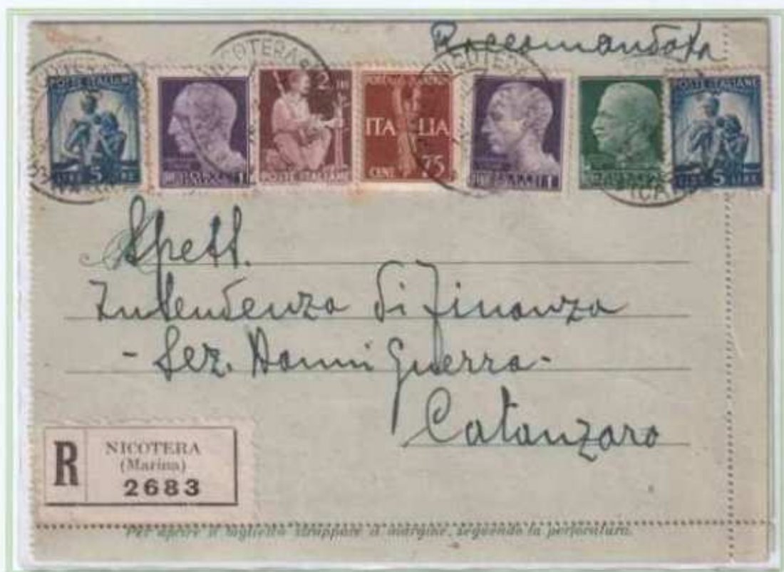
15/03/1946 - Biglietto postale raccomandato tariffa 15 L. (5 L. di biglietto postale e 10 L. di raccomandazione) da Nicotera a Catanzaro.