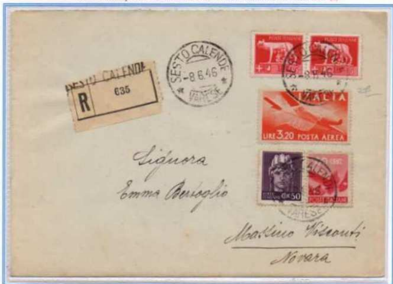
08/06/1946 - Lettera raccomandata tariffa 14 L. (4 L. di lettera e 10 L. di raccomandazione) da Sesto Calende a Massino Visconti. Le buste affrancate con il 5 lire e i francobolli della serie democratica sono molto rare. Affrancatura in eccesso di 50 cent. (e)