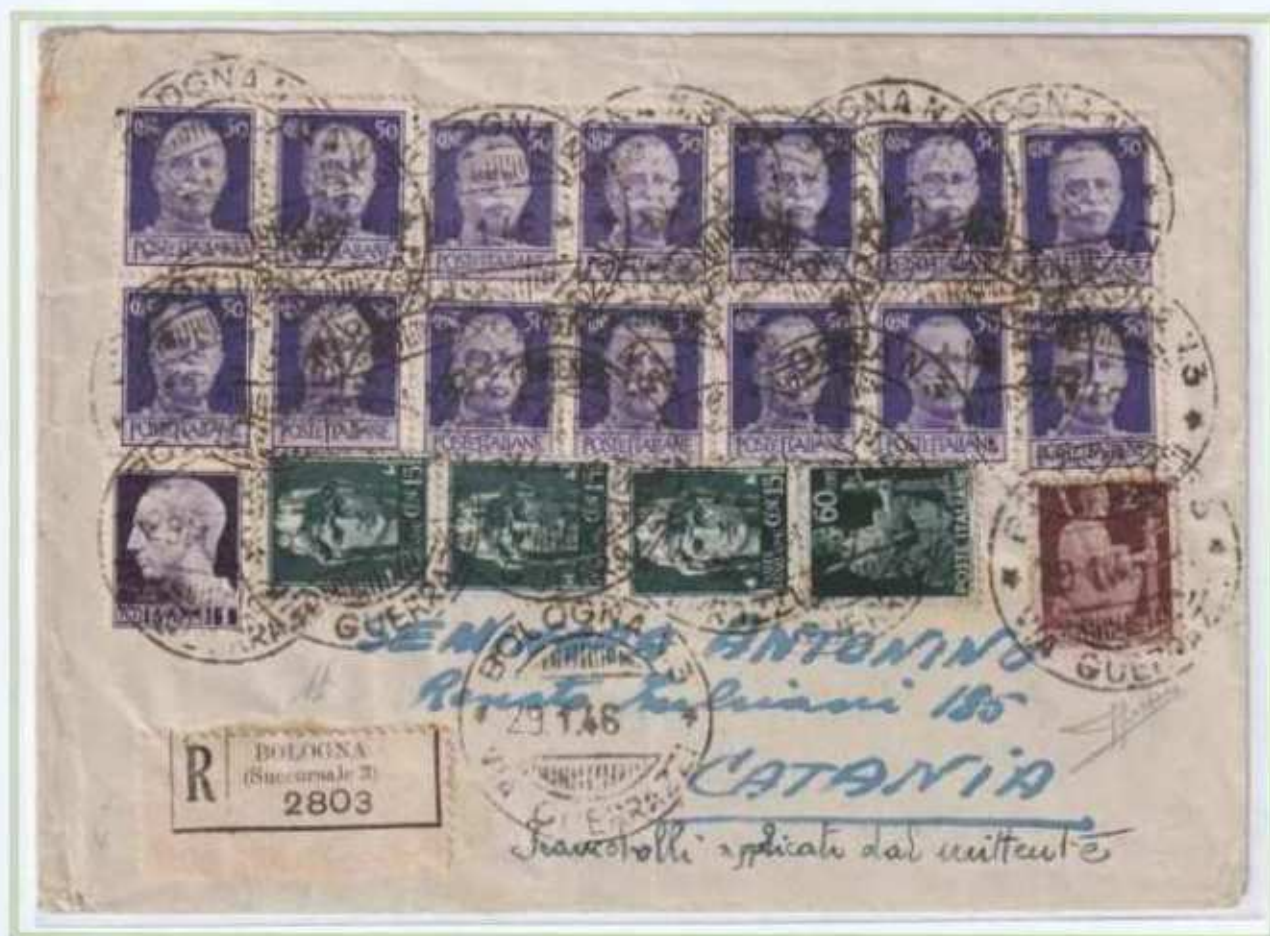
29/01/1946 - Lettera 3 porti raccomandata tariffa 11 L (6 L per i tre porti di lettera e 5 L di raccomandazione) da Bologna a Catania. L'affrancatura comprende oltre ai valori imperiale e democratica altri 14 valori di luogotenenza emissione di Roma. (c)