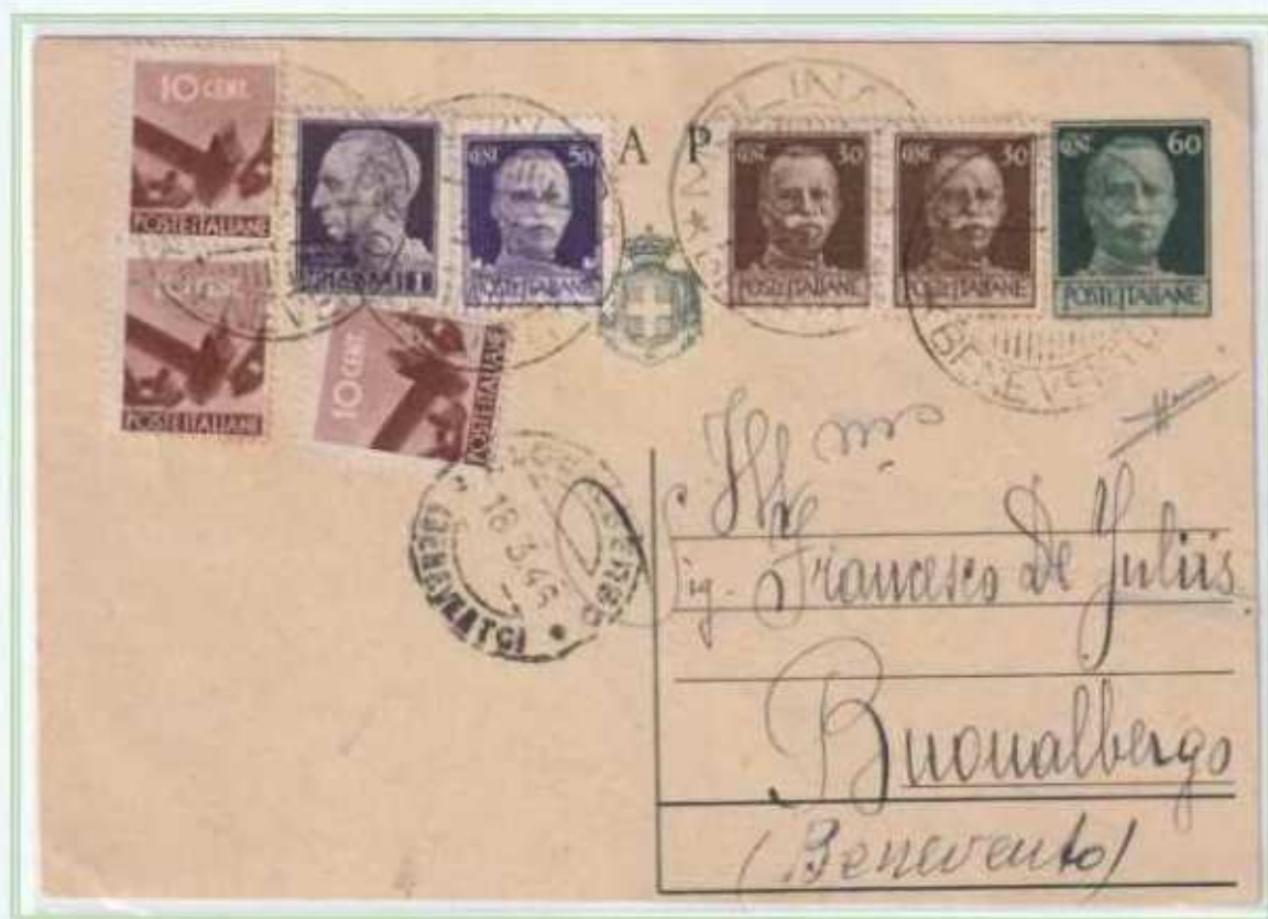
18/03/1946 - Cartolina postale tariffa 3 l. da Molinara a Buonalbergo assolta con i valori imperiale e democratica che integrano una cartolina postale da 60 c. luogotenenza ed altri tre valori di luogotenenza emissione di Roma.