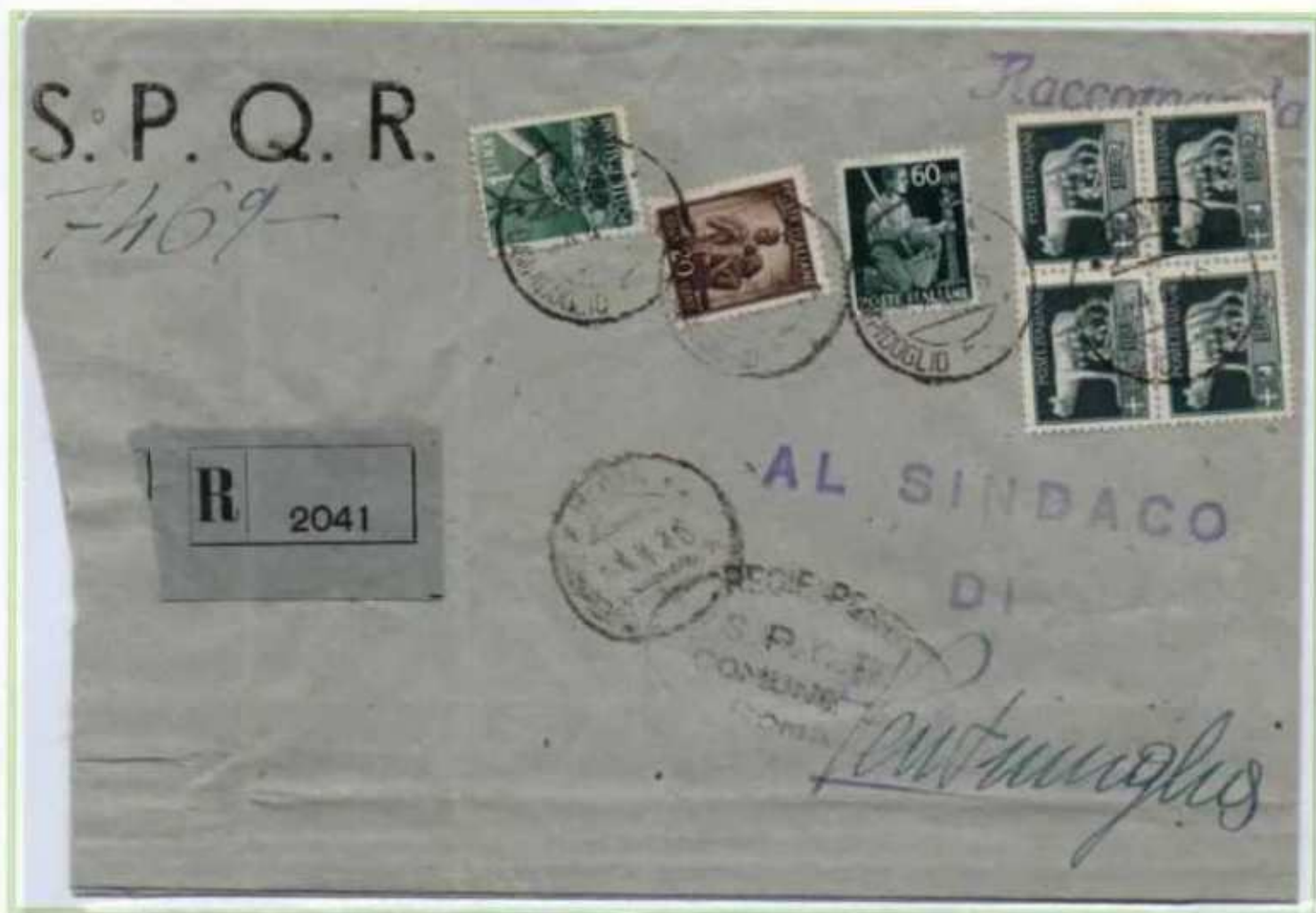
04/04/1946 - Lettera sindaci raccomandata tariffa 12 l. (2 l. di lettera sindaci e 10 l. di raccomandazione) da Roma a Ventimiglia.