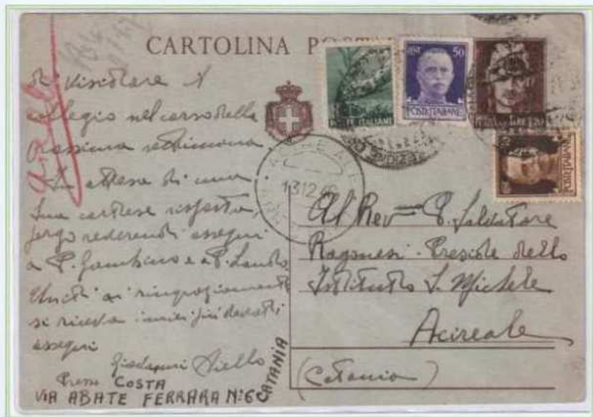
12/12/1946 - Cartolina postale tariffa 3 l. da Catania a Acireale assolta integrando una cartolina postale da 1,20 l. di luogotenenza. I due valori del regno erano fuori corso da circa sei mesi ma furono tollerati.