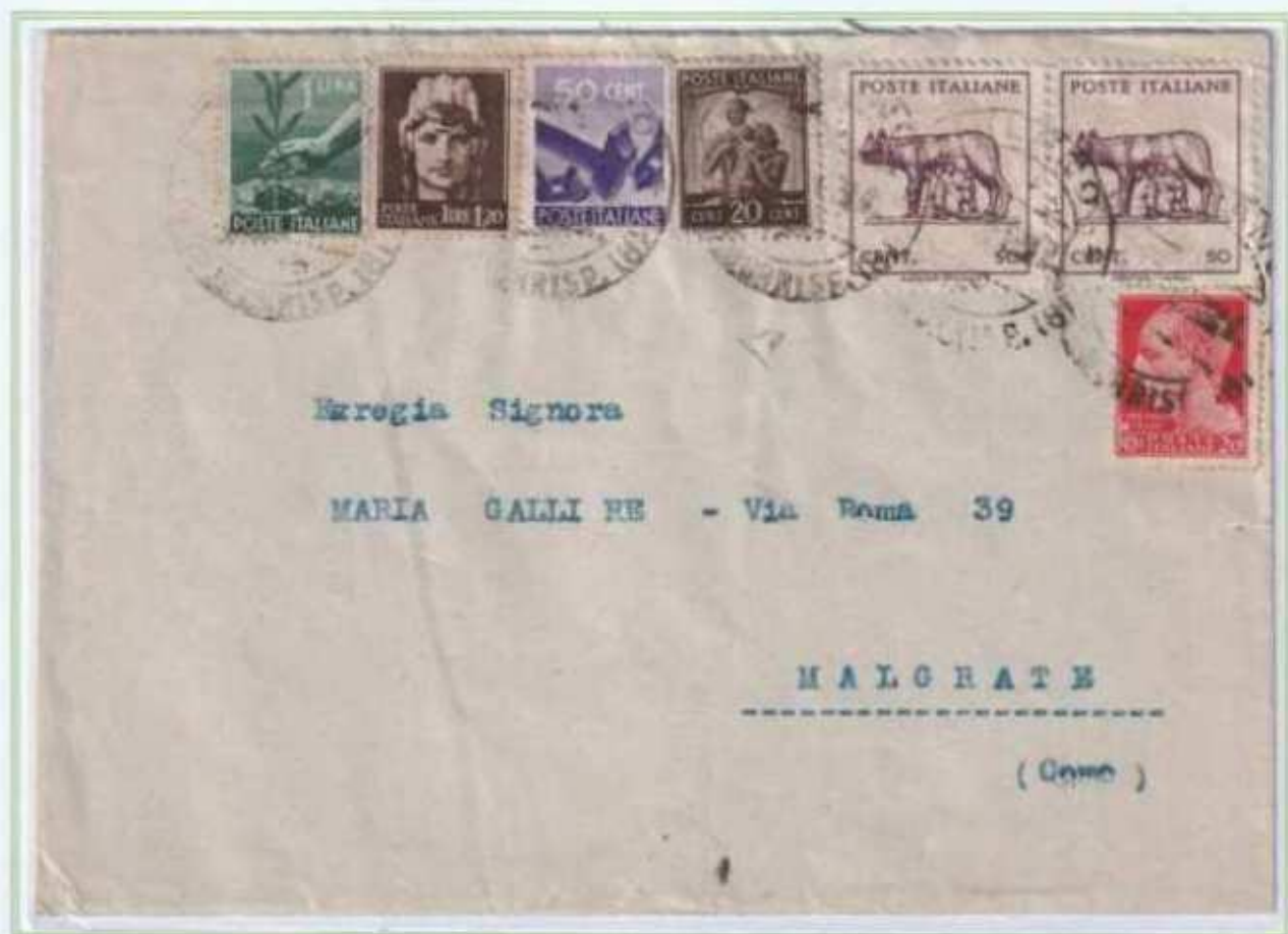
14/10/1946 - Lettera semplice tariffa 41, da Milano a Malgrate assolta con francobolli imperiale, democratica e luogotenenza. Affrancatura con doppi valori gemelli e uso della lupa capitolina nel nord.