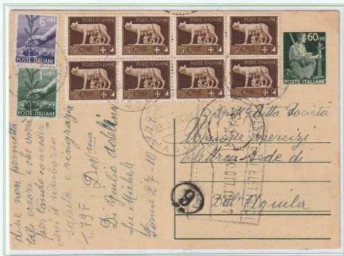
28/10/1947 - Cartolina postale tariffa 8 L. da Forma a L'Aquila assolta integrando una CP da 60 centesimi democratica. Gli otto valori del 5 c. erano fuori corso da circa 15 mesi ma come spesso accadeva furono tollerati.