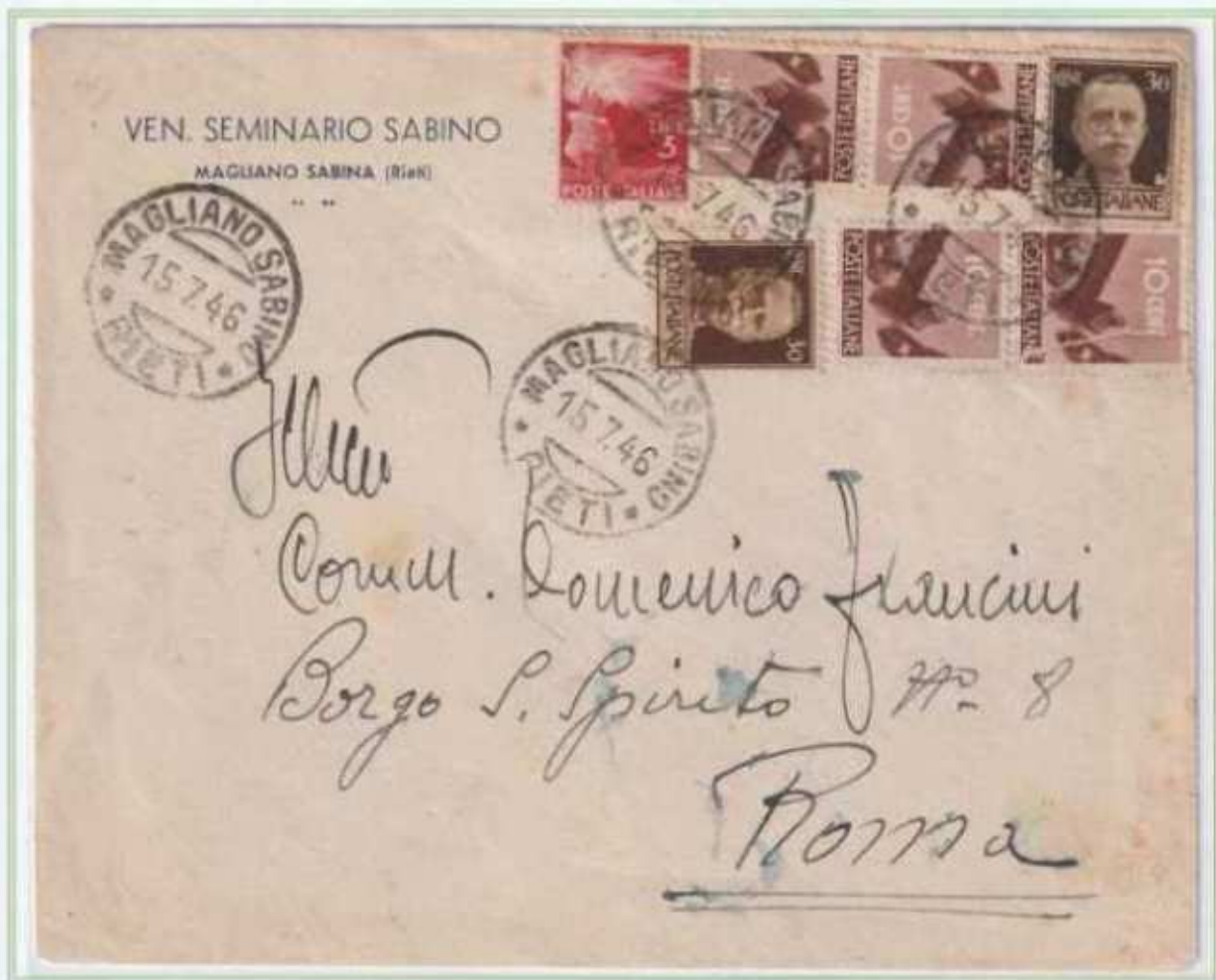
15/07/1946 - Lettera semplice tariffa 4 l. da Magliano Sabino a Roma, ai valori imperiale e democratica si unisce il gemello da 30 c. luogotenenza emissione di Roma.