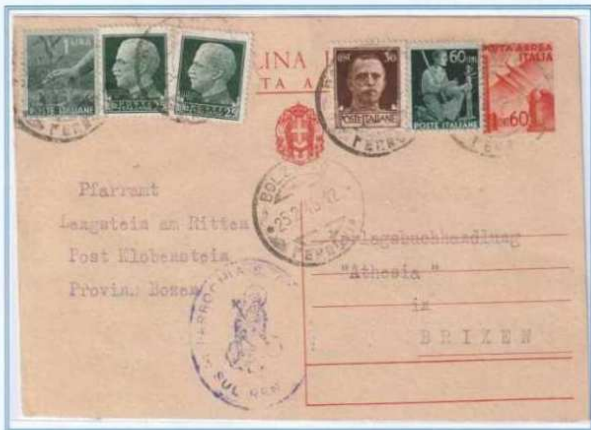
25/02/1946 - Cartolina postale tariffa 3 l. da Bolzano a Bressanone, assolta integrando una CP da 60 centesimi Posta Aerea del Regno con francobolli imperiale e democratica.