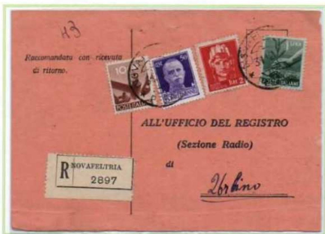
31/12/1945 - Cartolina postale raccomandata tariffa 3,60 L. (1,20 L. di cartolina postale e 2,40 L. di raccomandazione aperta) da Novafeltria a Urbino. Oltre ai valori imperiale e democratica è presente un 2 L. luogotenenza emissione di Roma.