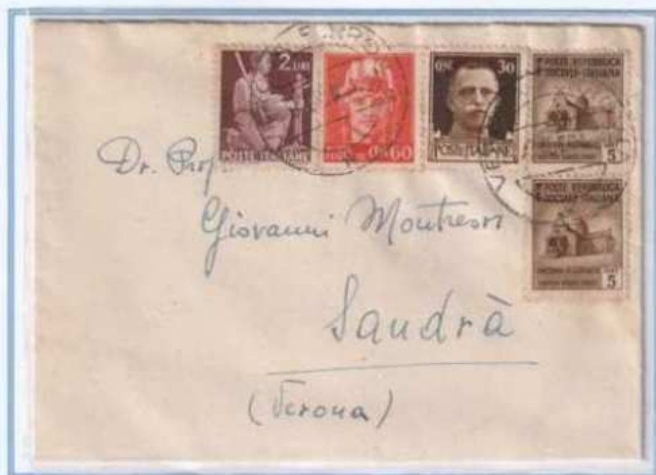
27/03/1946 - Lettera in distretto tariffa 3 L. da Verona a Sandra, affrancatura di quattro diversi periodi storici. i valori imperiale e democratica sono affiancati dai valori R.S.I. e luogotenenza emissione di Novara.