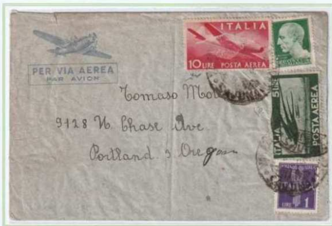
29/03/1946 - Lettera estero posta aerea fino a 5 gr tariffa 36 L. (5 L. di lettera e 31 L. per un porto di posta aerea) da Savona a Portland (USA). (e)