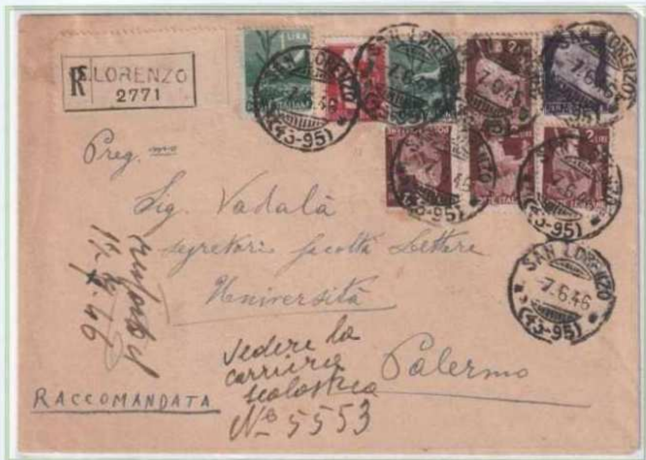
07/06/1946 - Lettera in distretto raccomandata tariffa 13 L (5 L di lettera in distretto e 10 L di raccomandazione) da San Lorenzo a Palermo con doppi valori gemelli.