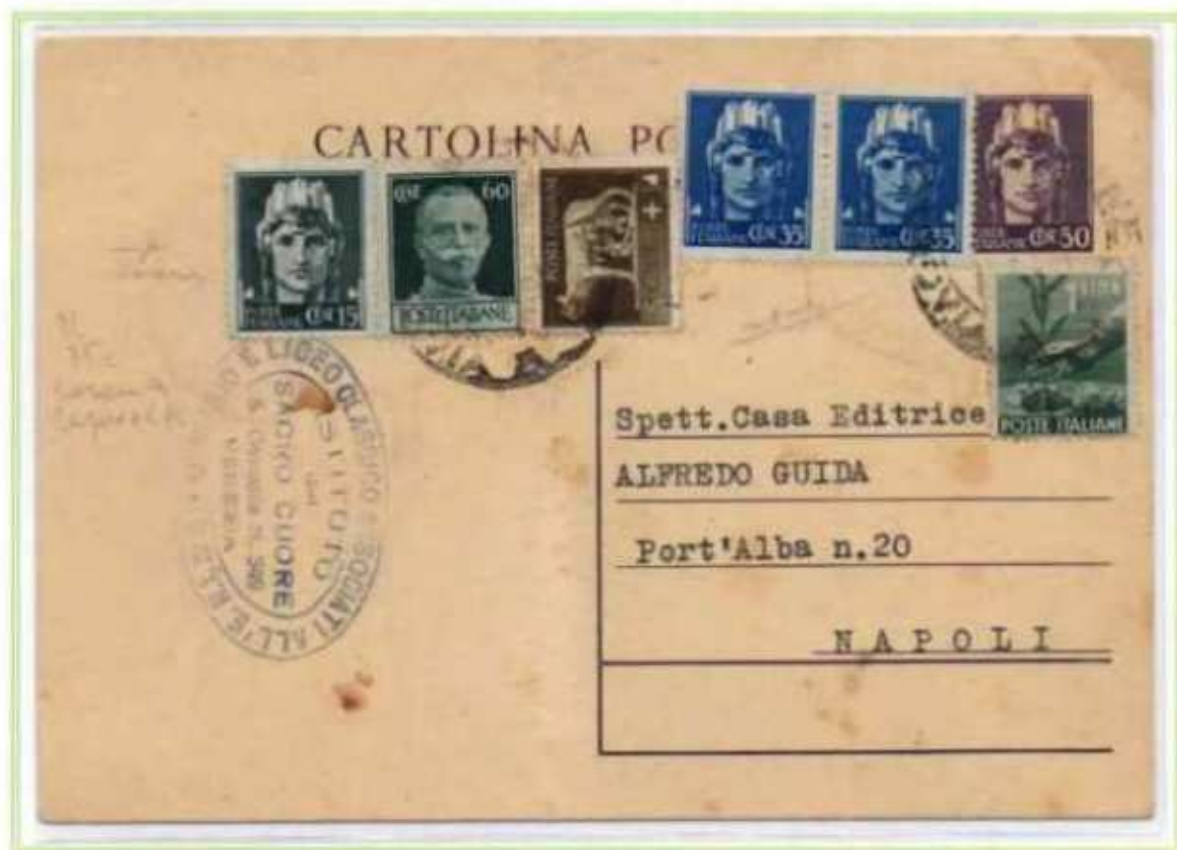
02/11/1946 - Cartolina postale tariffa 3 L. da Venezia a Napoli. I francobolli della serie imperiale con fasci e democratica sono apposti su una cartolina postale da 50 c. luogotenenza insieme anche ad un 60 c. luogotenenza emissione di Roma.