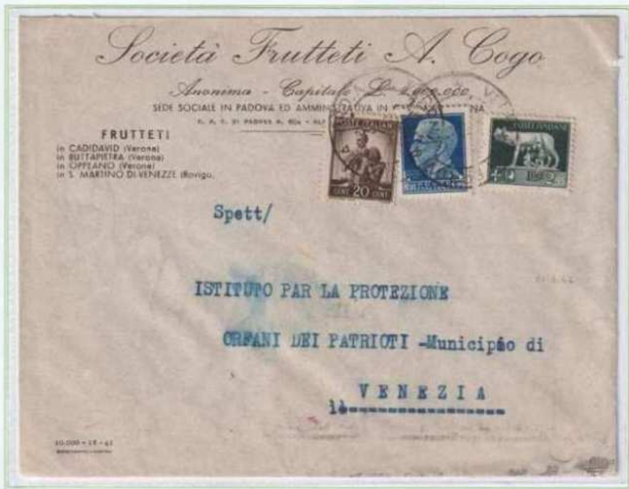
21/06/1946 - Lettera semplice tariffa 4 l. da Verona a Venezia.