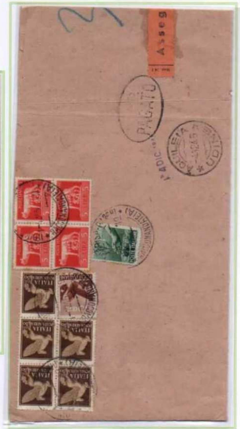
01/12/1945 - Stampe editori 51 porti raccomandate con assegno tariffa 23,60 l. (20,40 l. per i 51 porti di stampe, 1,20 l. per la raccomandazione e 2 l. per l'assegno) da Udine ad Aquileia.