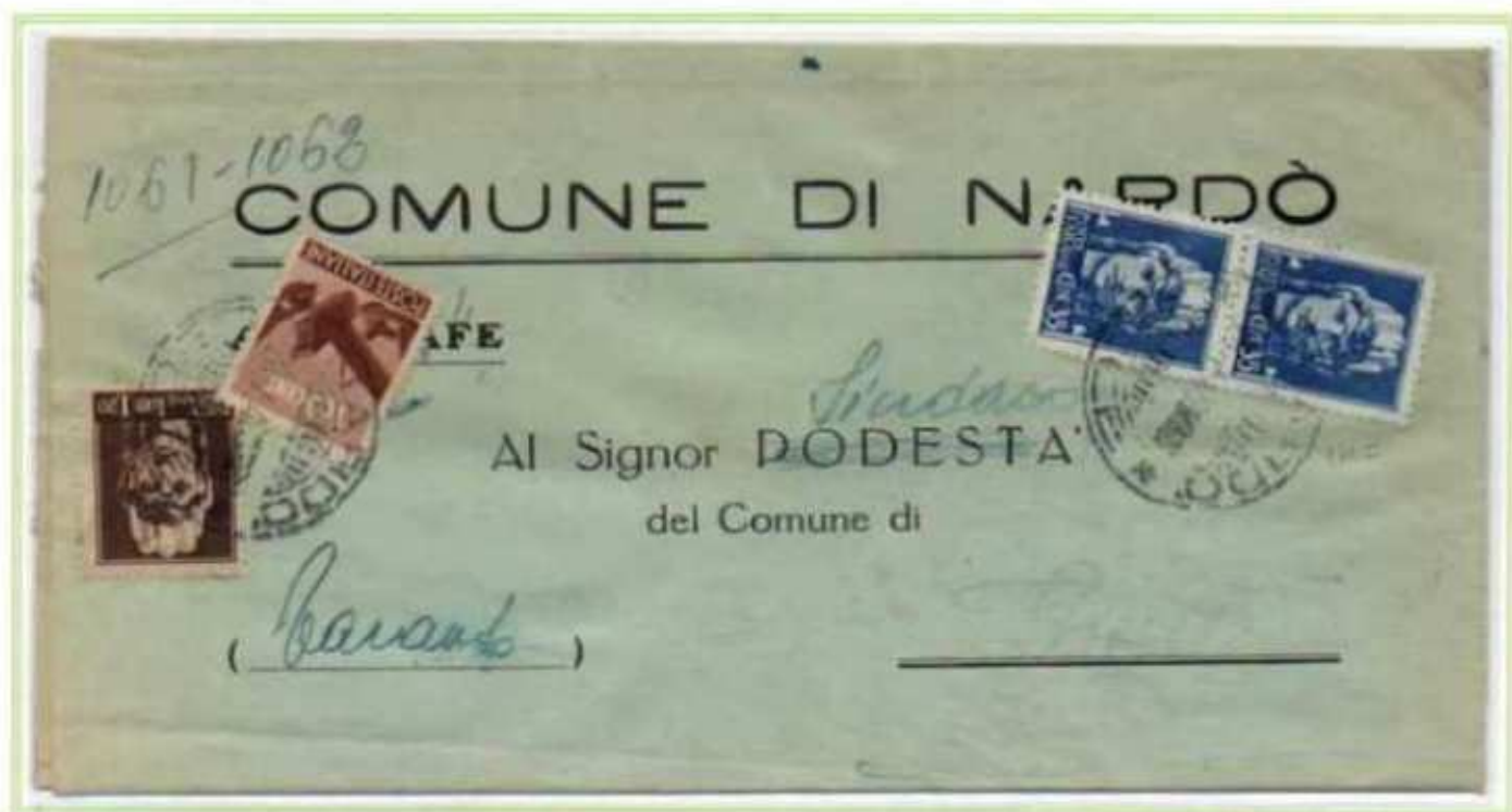
28/07/1946 - Lettera sindaco tariffa 2 L. da Nardò a Ginosa, utilizzo dei valori imperiale negli ultimi giorni di tolleranza, l'affrancatura comprende anche un valore di luogotenenza emissione di Roma.