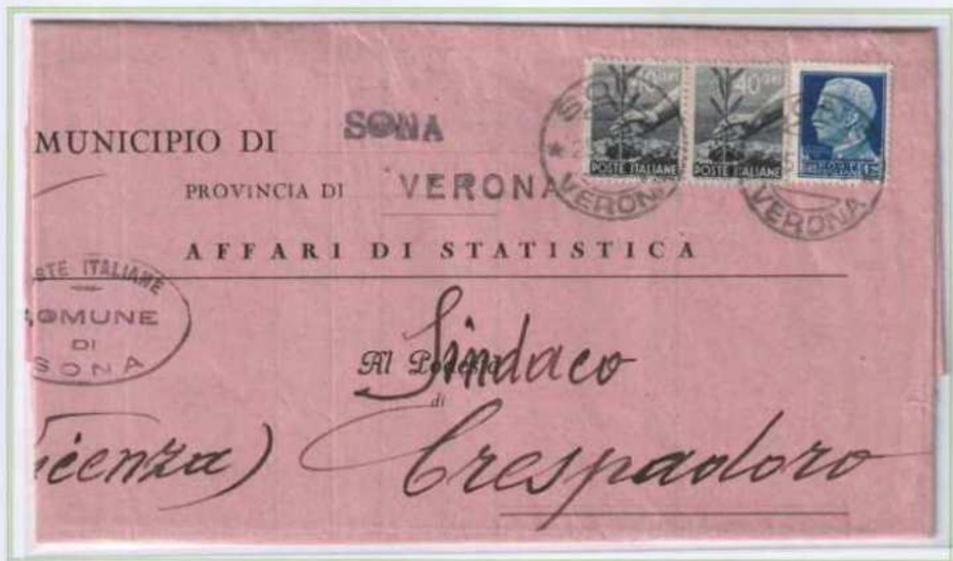
25/06/1946 - Lettera sindaci tariffa 2 l. da Sonza a Crespadoro in eccesso di 5 c.