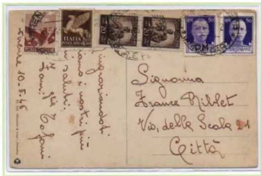
13/05/1946 - Cartolina postale in distretto tariffa 2 L. da Firenze per città, assolta con l'uso tardivo del sovrastampato P.M. unitamente al valore gemello del regno.