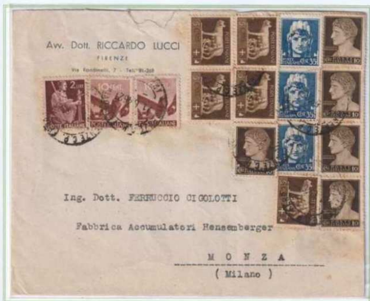
21/06/1946 - Lettera tariffa 4 L. da Firenze a Monza. Affrancatura con tre gemelli del 10 c. con i valori imperiale e democratica integrati da quattro valori di luogotenenza emissione di Novara il cui uso in Toscana è inusuale.