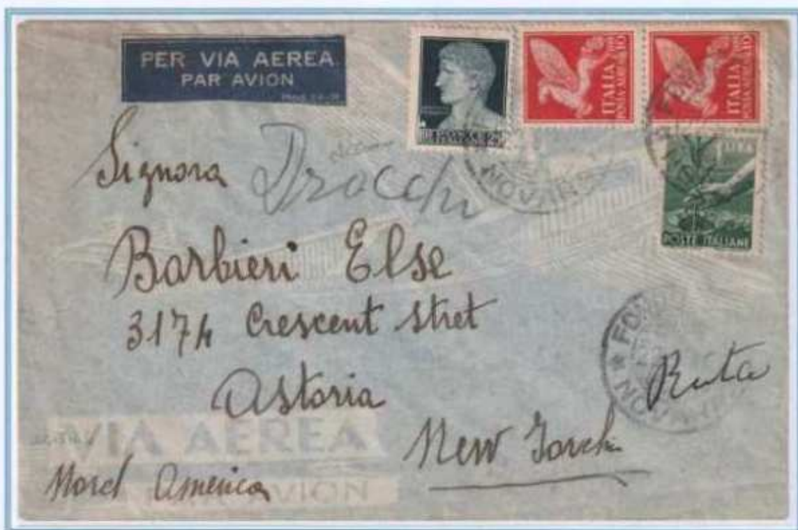
22/05/1946 - Lettera estero posta aerea fino a 5 gr tariffa 46 L. (15 L. di lettera e 31 L. per un porto di posta aerea) da Fondotoce Verbania a New York (Stati Uniti).