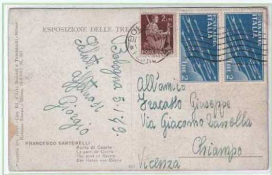
05/01/1949 - Cartolina illustrata tariffa 6 l. da Bologna a Chiampo con i valori imperiale di posta aerea fuori corso da cinque giorni.