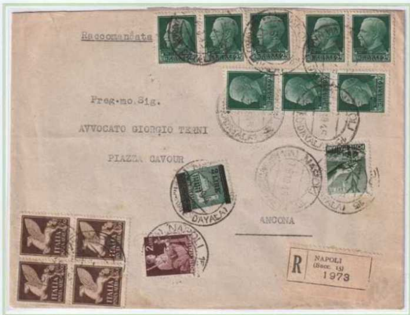
16/10/1945 - Lettera 2 porti raccomandata tariffa 9 L (4 L di 2 porti lettera e 5 L di raccomandazione) da Napoli ad Ancona con valori gemelli.