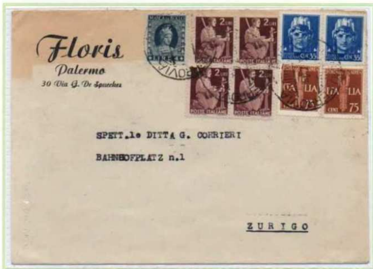
25/07/1946 - Lettera estero tariffa 15 l. da Palermo a Zurigo (Svizzera), i francobolli della serie imperiale e posta aerea sono affiancati dai valori di democratica e da una marca da bollo da 4 l. Tariffa in difetto di 80 c. e uso non ammesso della marca da bollo come francobollo ordinario.