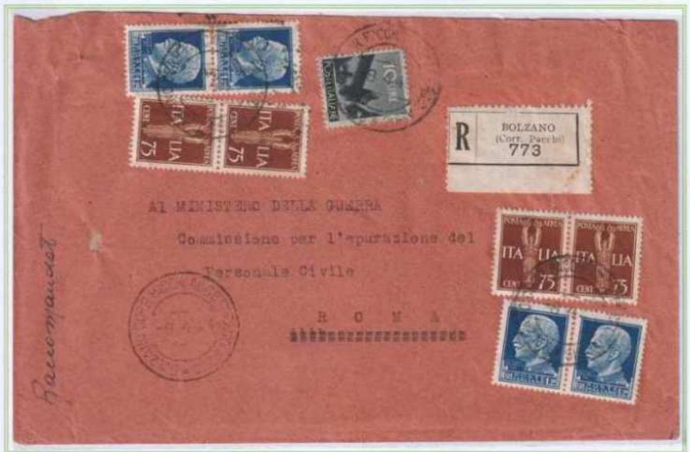
08/04/1946 - Lettera 2 porti raccomandata tariffa 18 L (8 L di 2 porti di lettera e 10 L di raccomandazione) da Bolzano a Roma.