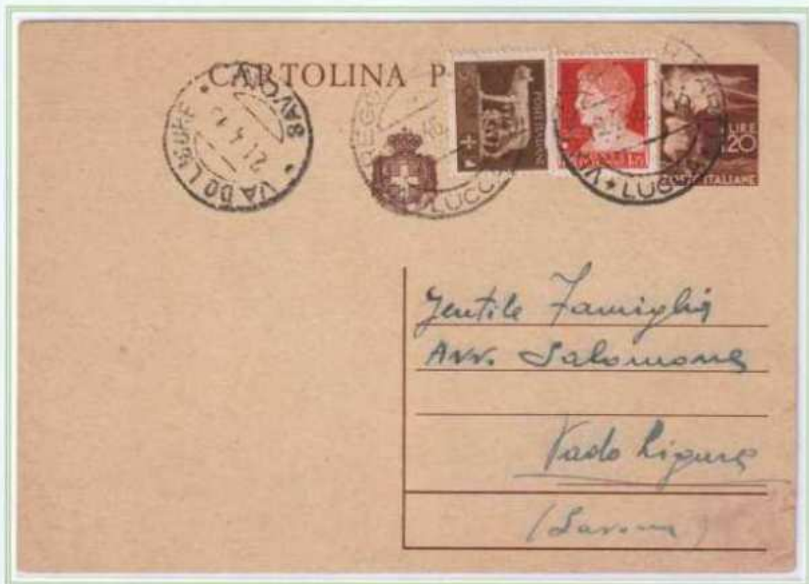
19/04/1946 - Cartolina postale tariffa 3 l. da Viareggio a Vado Ligure, assolta integrando una cartolina postale da 1,20 l. democratica.