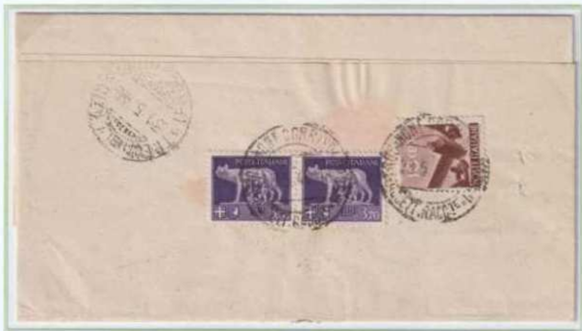
28/05/1946 - Manoscritto sindaci raccomandato tariffa 7,50 L. (2,50 L. di manoscritto sindaci, 5,00 L. raccomandazione aperta) da Frosinone a Trevi nel Lazio.