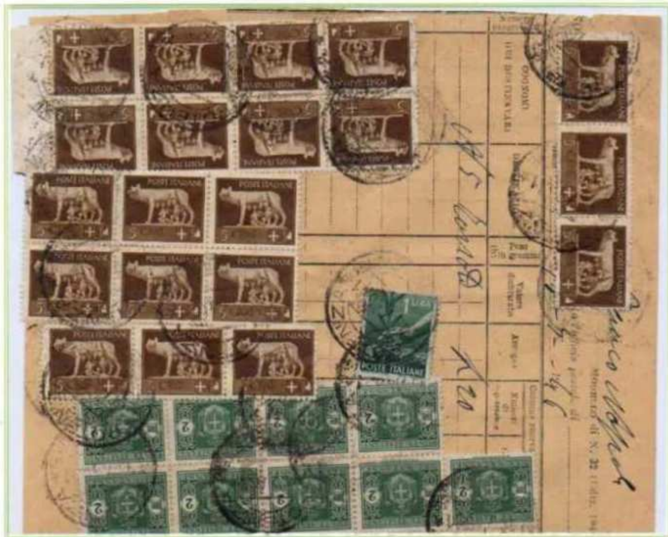
13/07/1946 - Mod. 32 delle Poste usato come tassazione cumulativa per complessive 20 l. dall'ufficio postale di Potenza.