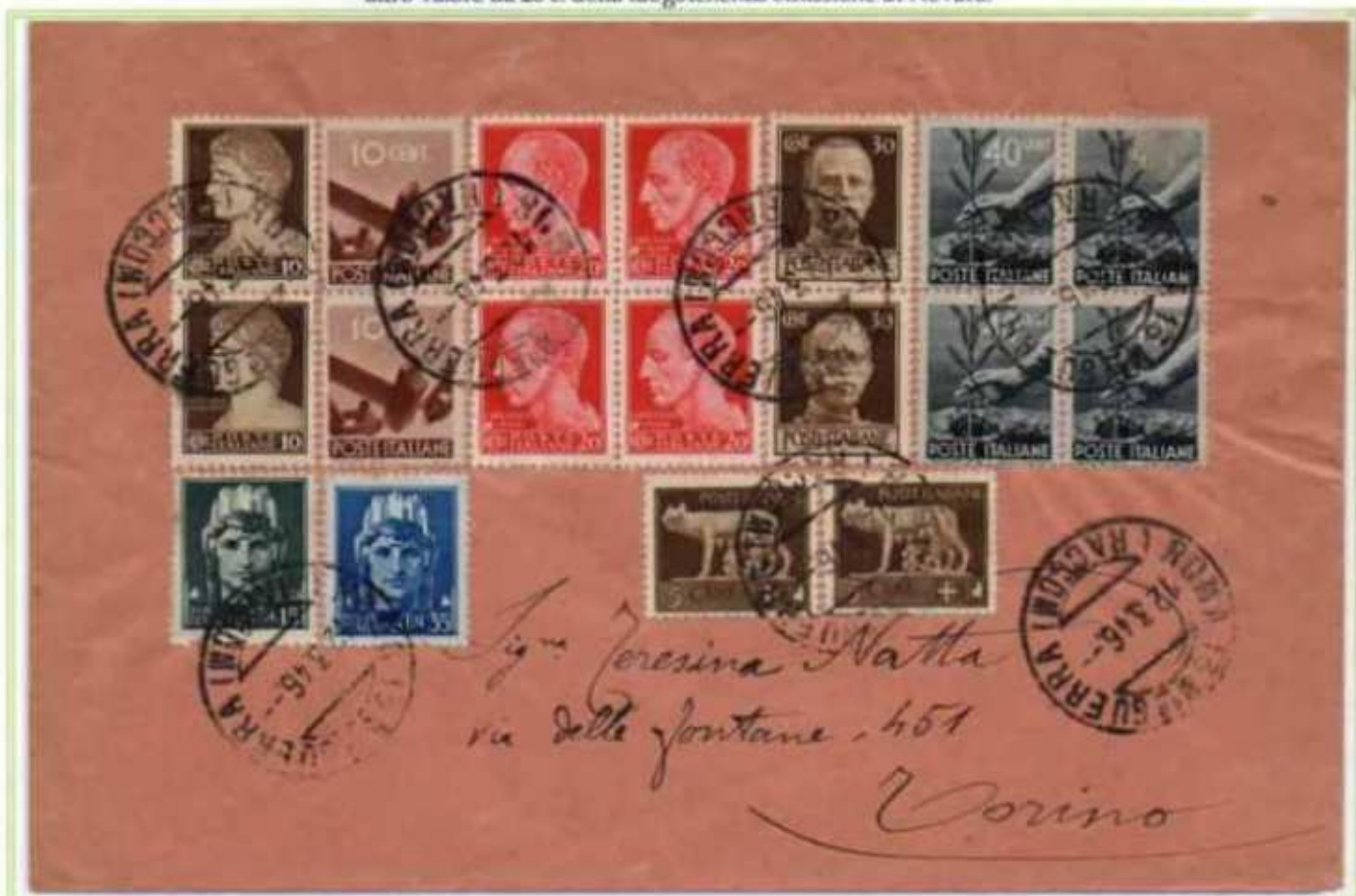
12/03/1946 - Lettera semplice tariffa 4 l. da Roma a Torino, insieme ai francobolli imperiale con fasci e democratica compongono l'affrancatura una coppia del 10 c. e una coppia del 30 c. luogotenenza emissione di Roma.