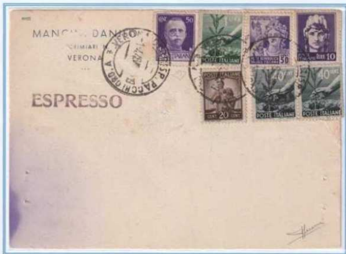
01/04/1946 - Cartolina postale espresso tariffa 13 l. (3 l. di cartolina postale e 10 l. di espresso) da Verona a Bologna (timbro di arrivo al verso). Affrancatura con francobolli di quattro diversi periodi con valori gemelli. Ai valori imperiale e democratica sono accostati un valore R.S.I. ed uno di luogotenenza emissione di Roma.