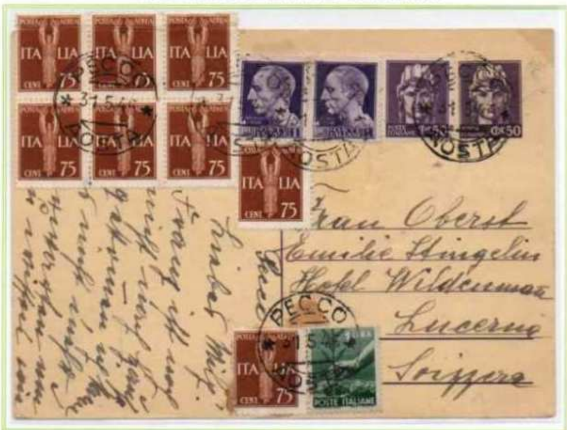
31/05/1946 - Cartolina Postale estero tariffa 10 l. da Pecco a Lucerna (Svizzera) assolta integrando una cartolina postale da 50 c. luogotenenza, i valori democratica e p.a. del regno sono affiancati da due valori da 1 l. con fasci luogotenenza di Novara.