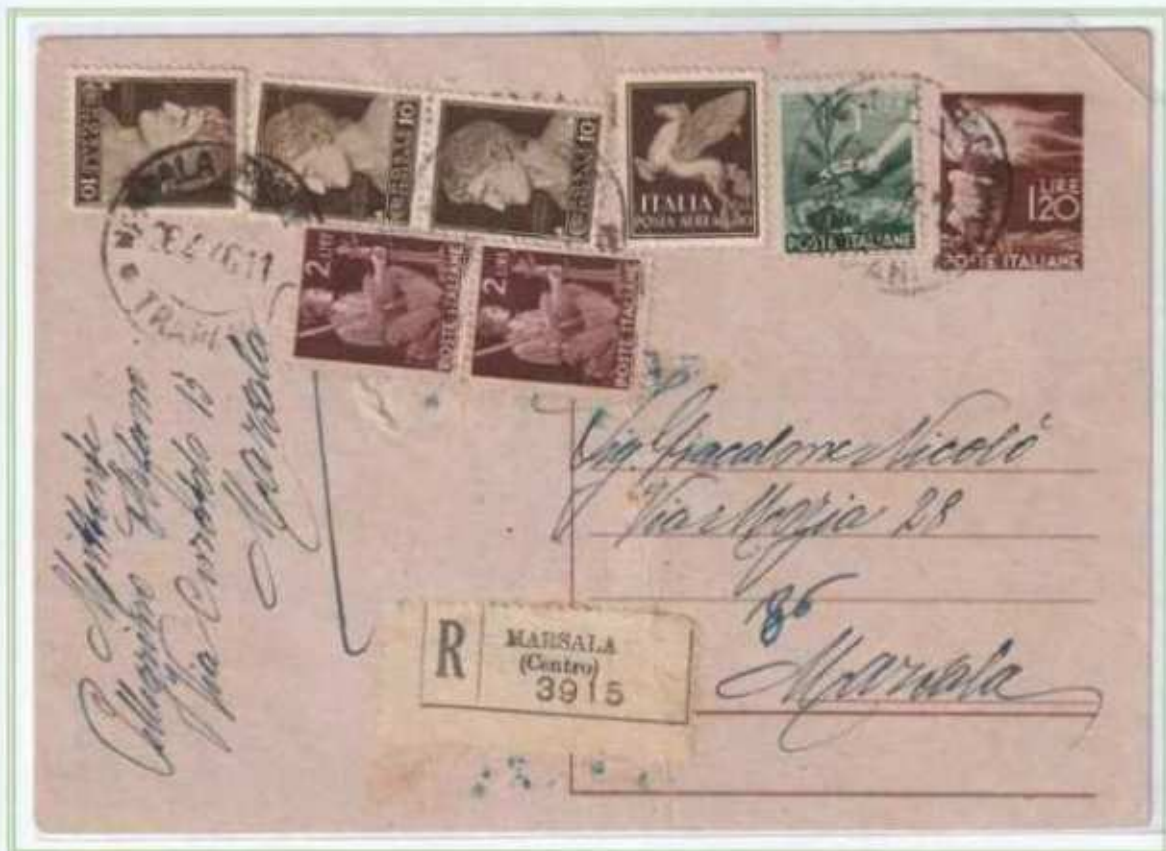
26/04/1946 - Cartolina postale in distretto raccomandata tariffa 7 L. (2 L. di cartolina postale in distretto e 5 L. di raccomandazione aperta) da Marsala per città.