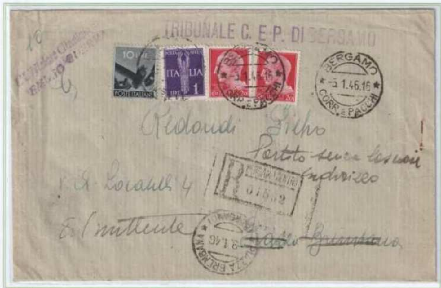
05/01/1946 - Lettera raccomandata atti giudiziari tariffa 11,40 l. (2 l. di lettera, 5 l. di raccomandazione, 2 l. di avviso di ricevimento e 2,40 l di raccomandazione aperta per l'avviso di ricevimento). Oltre ai valori imperiale e democratica completano l'affrancatura due valori di luogotenenza emissione di Novara.