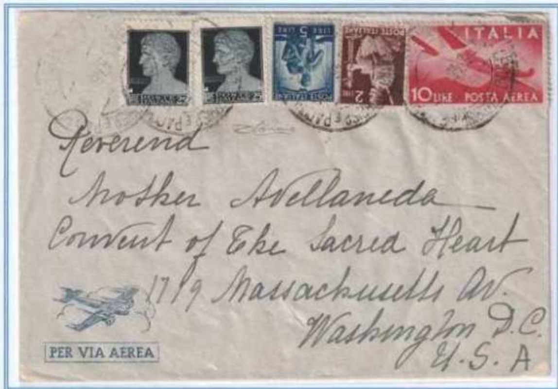
13/03/1946 - Lettera estero posta aerea 2 porti da 6 a 10 gr tariffa 67 L (51 di lettera estro e 62 L per 2 porti di posta aerea) da Roma a Washington D.C. (Stati Uniti). (e)