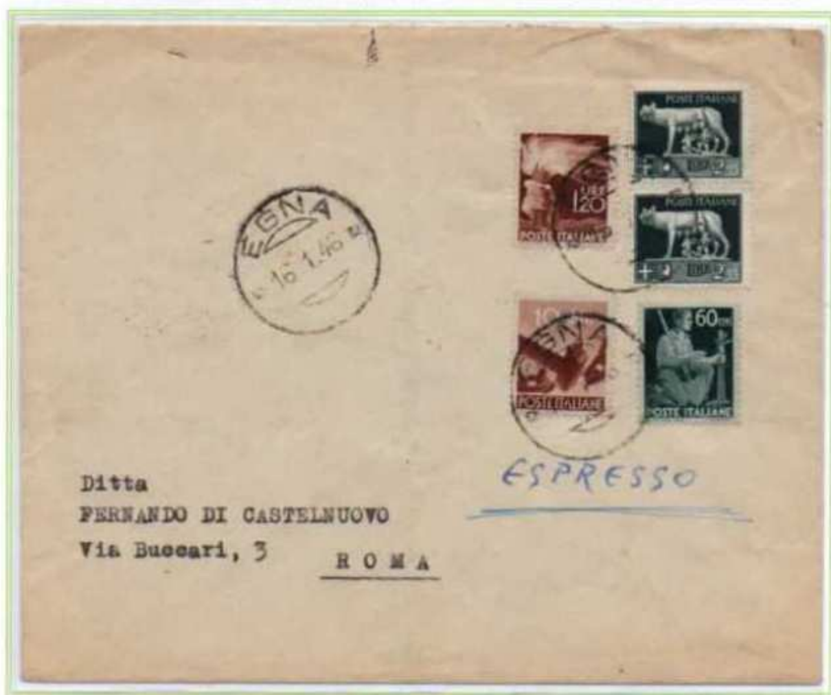
16/01/1946 - Lettera espresso tariffa 7 L. (2 L. di lettera e 5 L. di espresso) da Eгна a Roma.