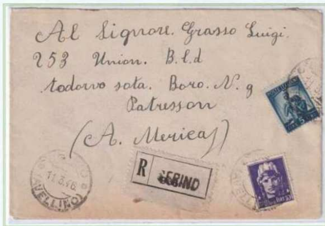
11/03/1946 - Lettera estero raccomandata tariffa 15L ((5 L. di lettera e 10 L. raccomandazione) da Serino a Paterson (Stati Uniti).