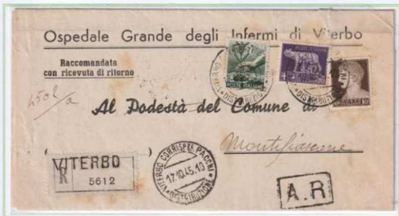
17/10/1945 - Manoscritto raccomandato tariffa 4,80 l. (2,40 l. di manoscritto e 2,40 l. di raccomandazione aperta) da Viterbo a Montefiascone.