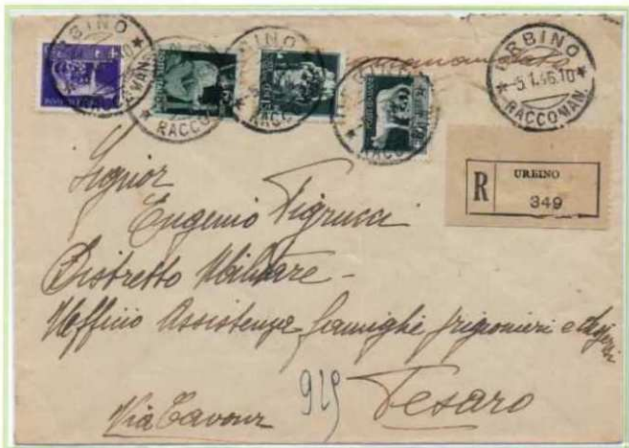
05/01/1946 - Lettera raccomandata tariffa 7 L. (2 L. di lettera e 5 L. di raccomandazione) da Urbino a Pesaro.