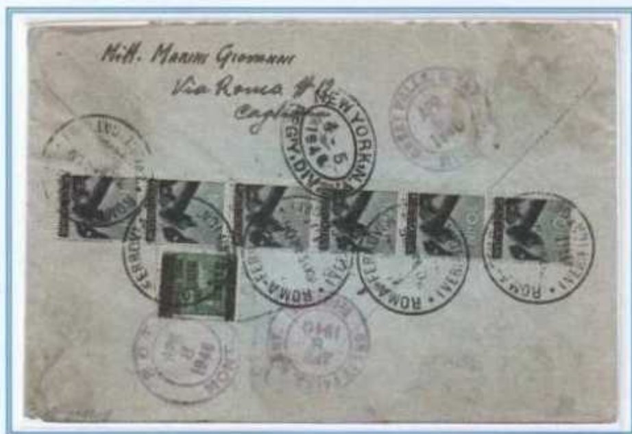
28/03/1946 - Lettera estero raccomandata posta aerea 3 porti (da 10 a 15 grammi) tariffa 108 l. ((5 l. di lettera, 10 l. di raccomandazione e 93 l. di 3 porti di posta aerea, 31 l. ogni 5 grammi) da Cagliari a Great Falls e poi a Butte (Stati Uniti). La lettera venne affrancata inizialmente per 46 l., ad un successivo controllo fu integrata per altre 62 l., con i francobolli apposti al retro della busta tutti annullati "ROMA FERROVIA (VERIFICATORE)". Oltre ai valori imperiale e democratica si riscontrano anche due valori di luogotenenza.