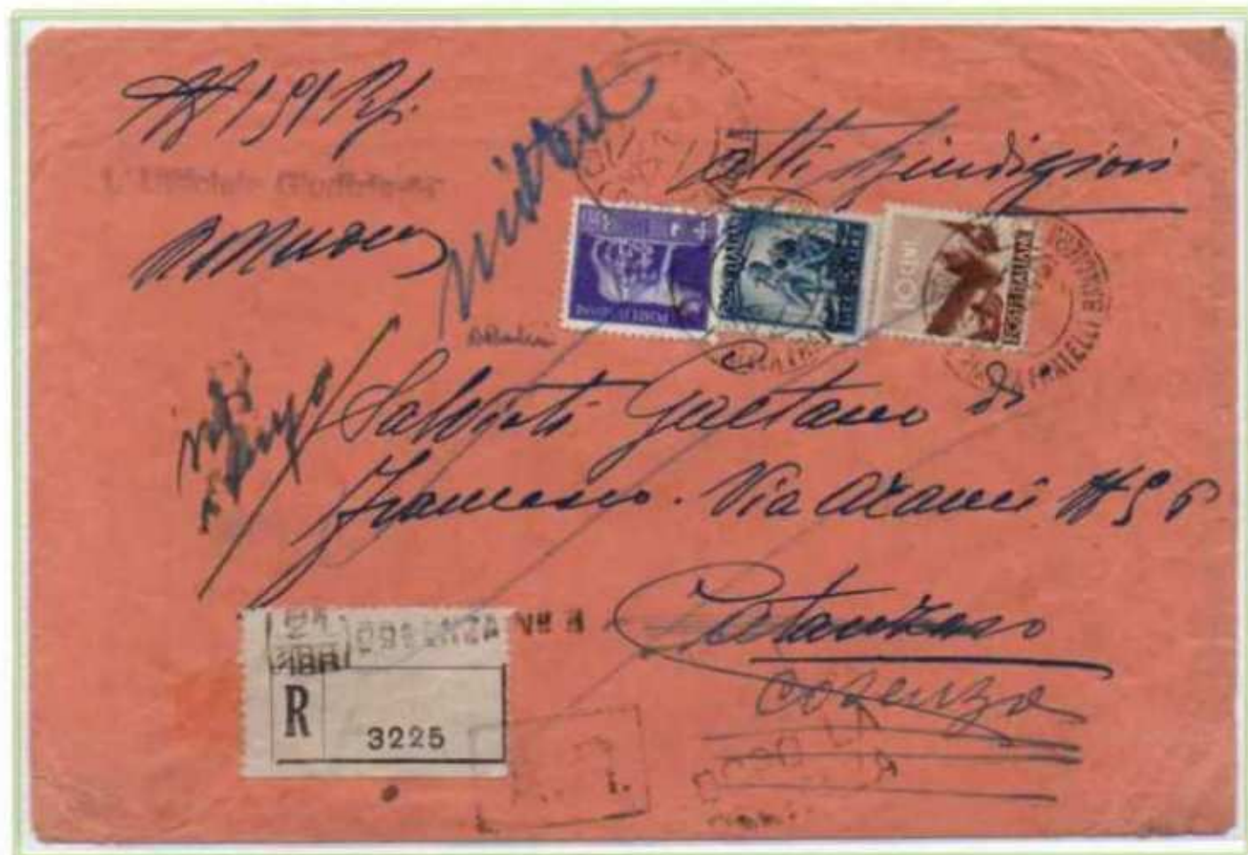
25/01/1946 - Lettera raccomandata atti giudiziari tariffa 8,80 l. (2 l. di lettera, 2,40 l. raccomandazione aperta, 2 l. avviso di ricevimento e 2,40 l. di raccomandazione dell'avviso di ricevimento) da Cosenza a Catanzaro.