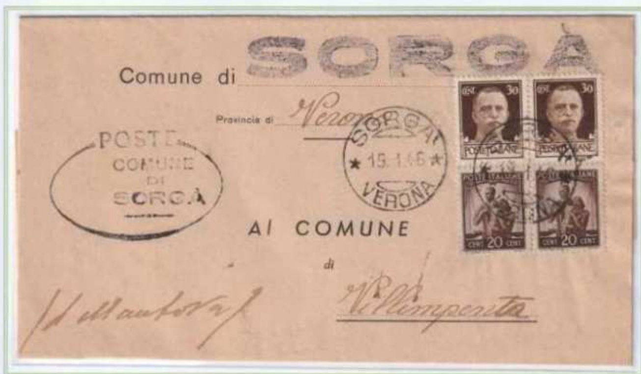
15/01/1946 - Lettera sindaci tariffa 1 L da Sorgà a Villimpenta.