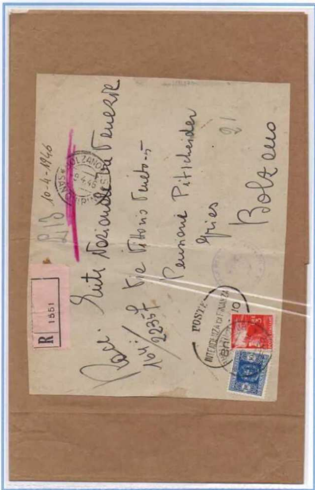
09/04/1946 - Lettera in distretto raccomandata con tassa a carico del destinatario tariffa 13 l. (3 l. di lettera e 10 l. di raccomandazione) da Bolzano per città. La tassa fu assolta con una mista fra valori ordinari e segnatasse.