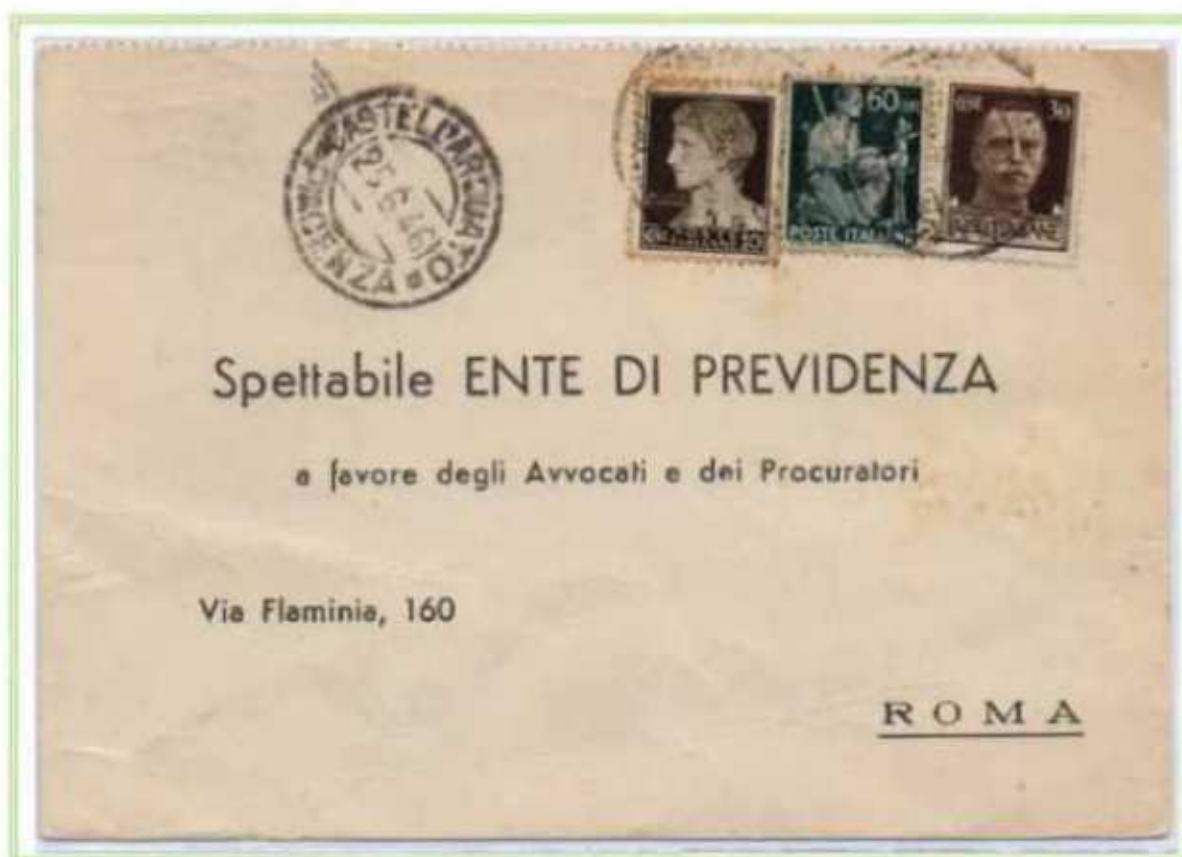
25/06/1946 - Stampe tariffa 1 l. da Castell'Arquato a Roma, al valore imperiale e democratica è accostato un 10 c. luogotenenza emissione di Novara.