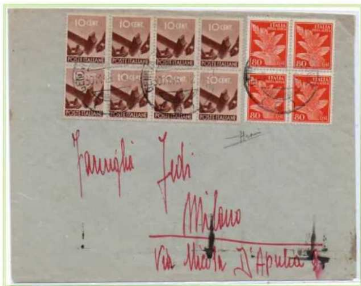
30/11/1946 - Lettera semplice tariffa 4 l. da Genova a Milano.