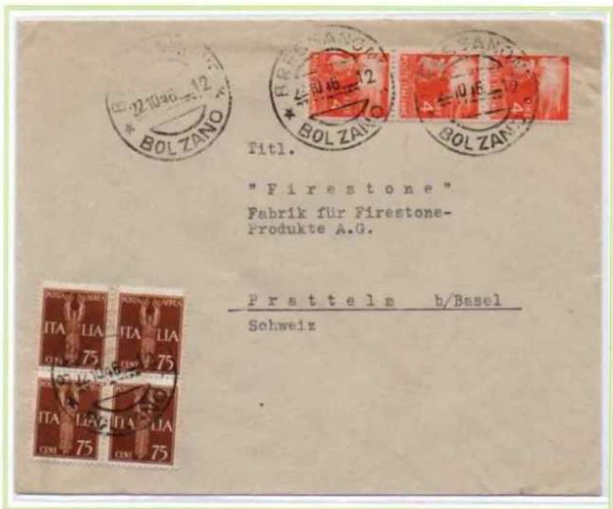
22/10/1946 - Lettera estero tariffa 15 l. da Bressanone a Pratteln (Svizzera).