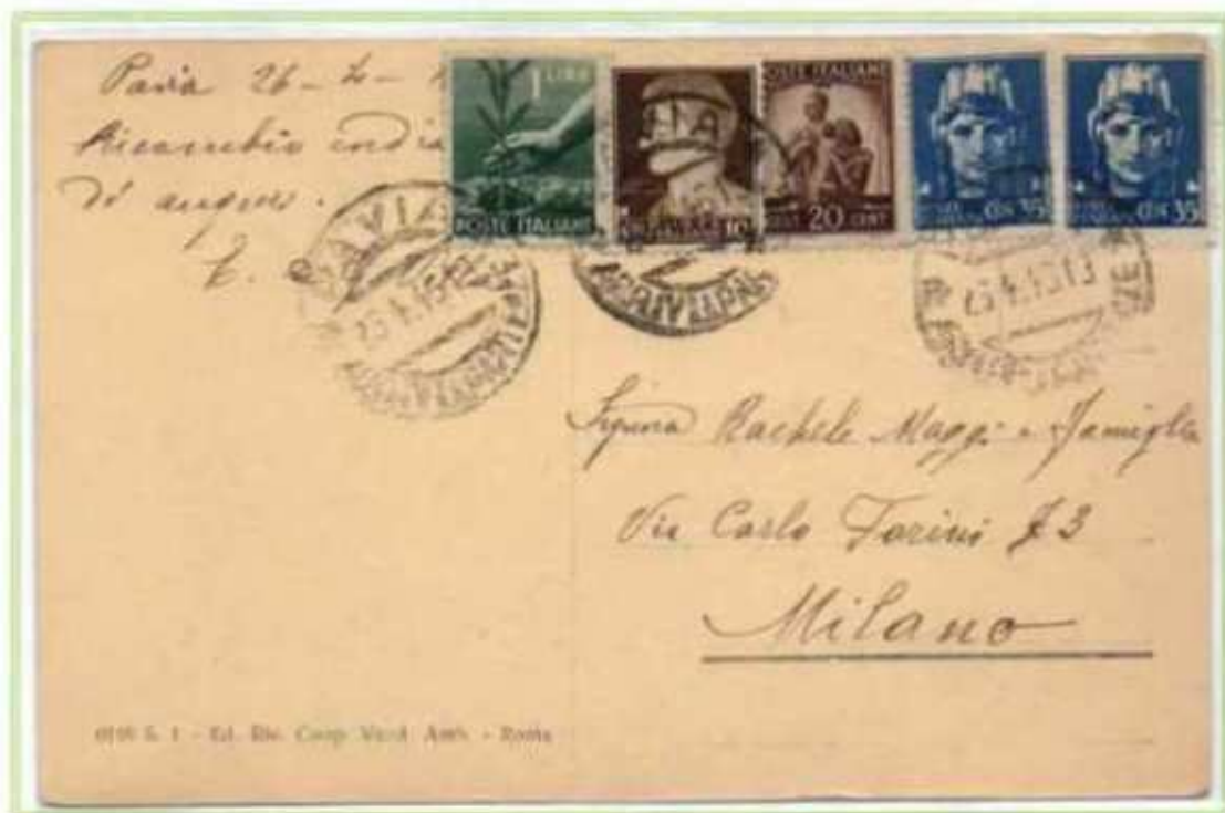
26/04/1946 - Cartolina illustrata 5 parole tariffa 2 l. da Pavia a Milano.