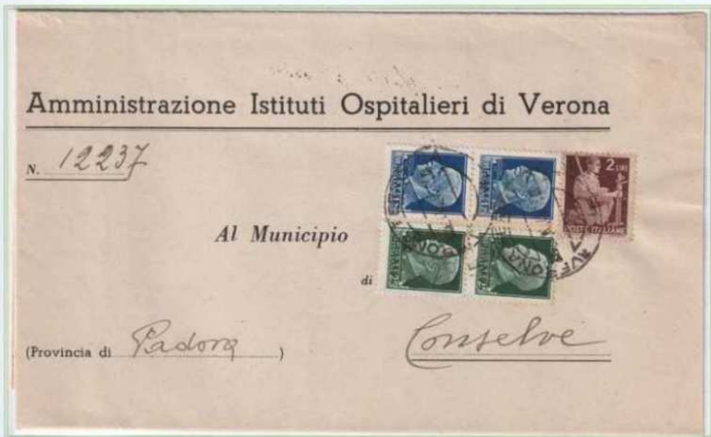
24/05/1946 - Manoscritto primo porto tariffa 5 l. da Verona a Conselve.