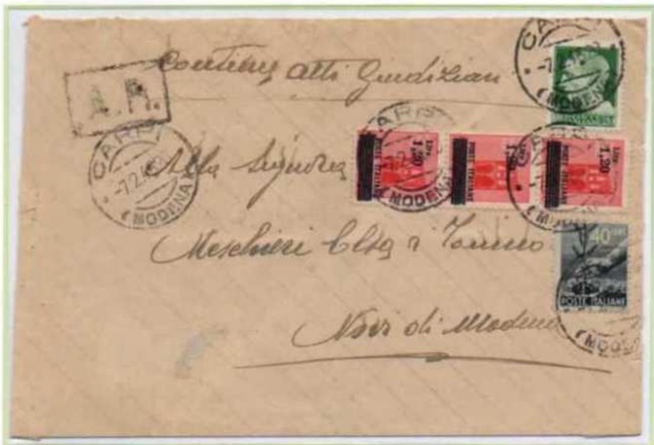
07/02/1946 - Lettera raccomandata atti giudiziari tariffa 23 l. (4 l. di lettera, 10 l. di raccomandazione, 4 l. avviso di ricevimento, 5 l. di raccomandazione aperta per l'avviso di ricevimento) da Carpi a Novi di Modena. Affrancata in eccesso di 1 l. dovuta al fatto che alcuni Uffici Provinciali con circolari avevano indicato in 10 l. il costo dell'A.R. in luogo delle legittime 9 l.