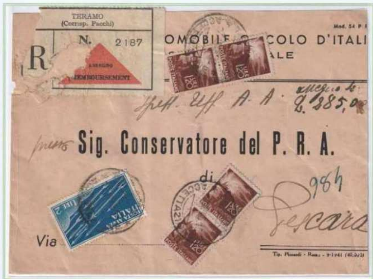
07/12/1945 - Manoscritto raccomandato con assegno tariffa 6,80 l. (2,40 l. di manoscritto, 2,40 l. di raccomandazione aperta e 2 l. di assegno) da Teramo a Pescara.