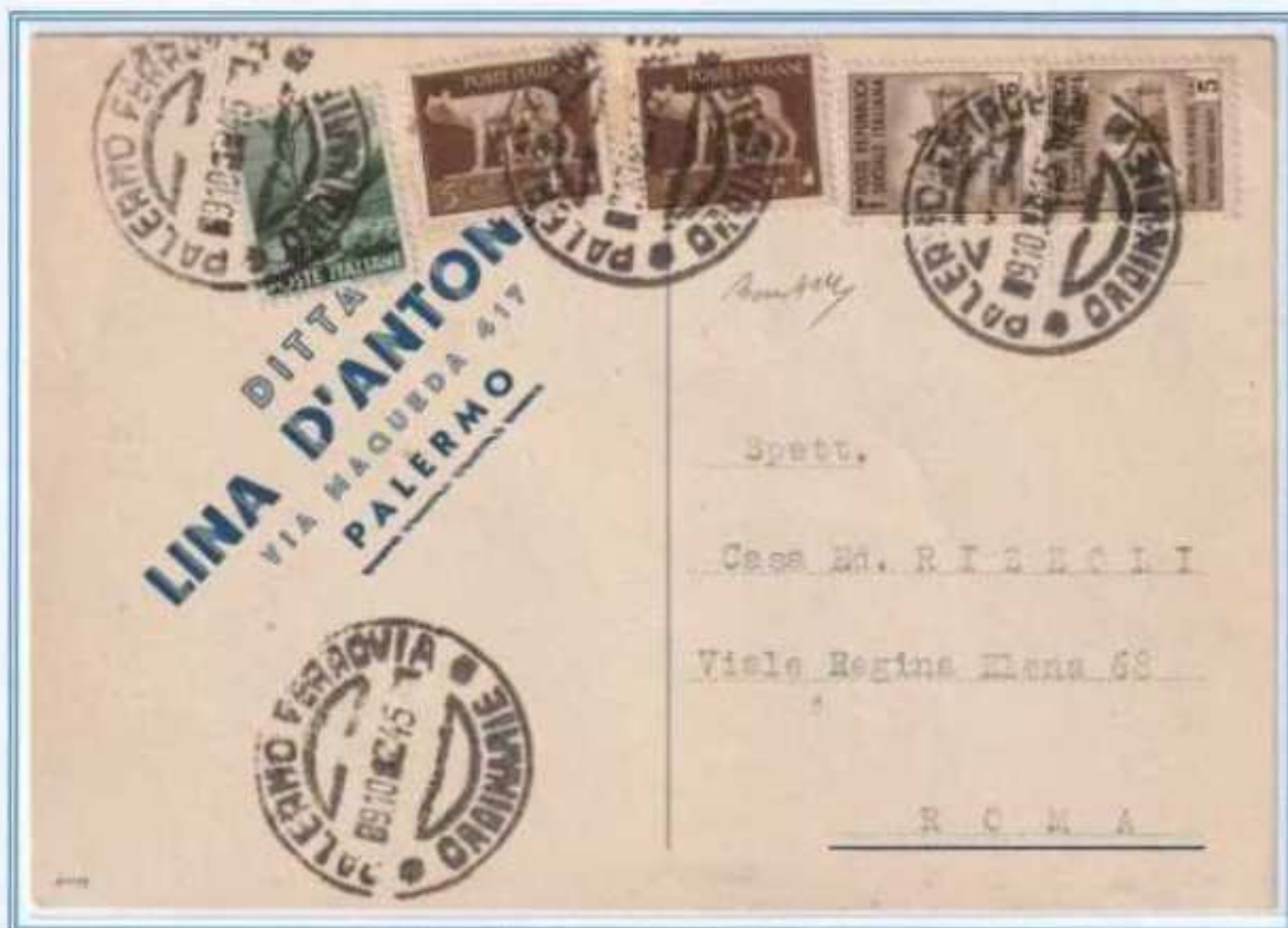
09/10/1945 - Cartolina postale tariffa 1,20 L. da Palermo a Roma. Il valore di democratica è associato a quattro valori del 5 c., due della serie imperiale e due della RSI usati in Sicilia.