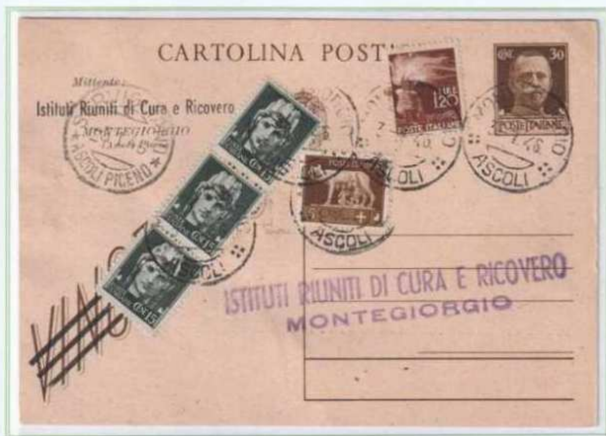
03/01/1946 - Cartolina postale 30 centesimi "VINCEREMO" usata come avviso di ricevimento tariffa 2 L, da Montegiorgio a Servigliano.