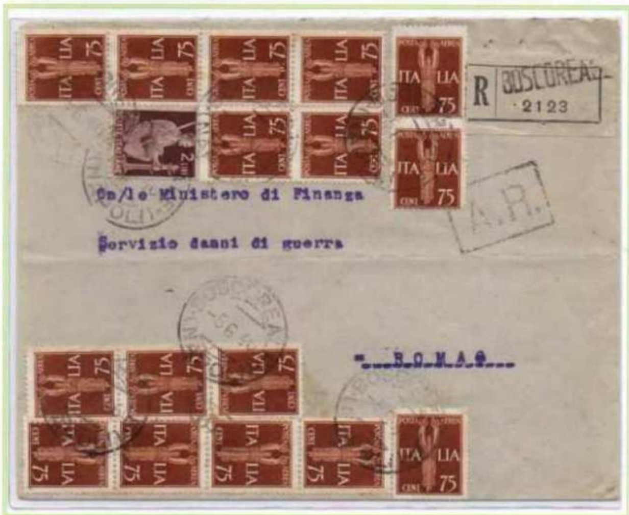
05/06/1946 - Lettera raccomandata tariffa 14 l. (4 l. di lettera, 10 l. di raccomandazione) da Boscoreale a Roma con 16 valori del 75 c. posta aerea.