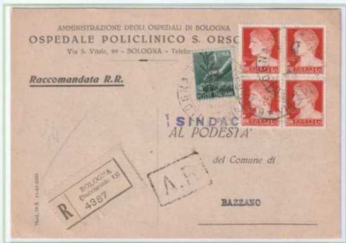
25/06/1946 - Cartolina postale raccomandata tariffa 8 l. (3 l. di cartolina postale e 5 l. di raccomandazione aperta) da Bologna a Bazzano.