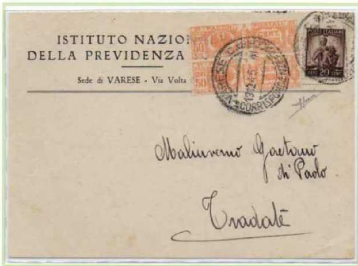
13/12/1945 - Cartolina postale tariffa 1,20 l. da Varese a Tradate.