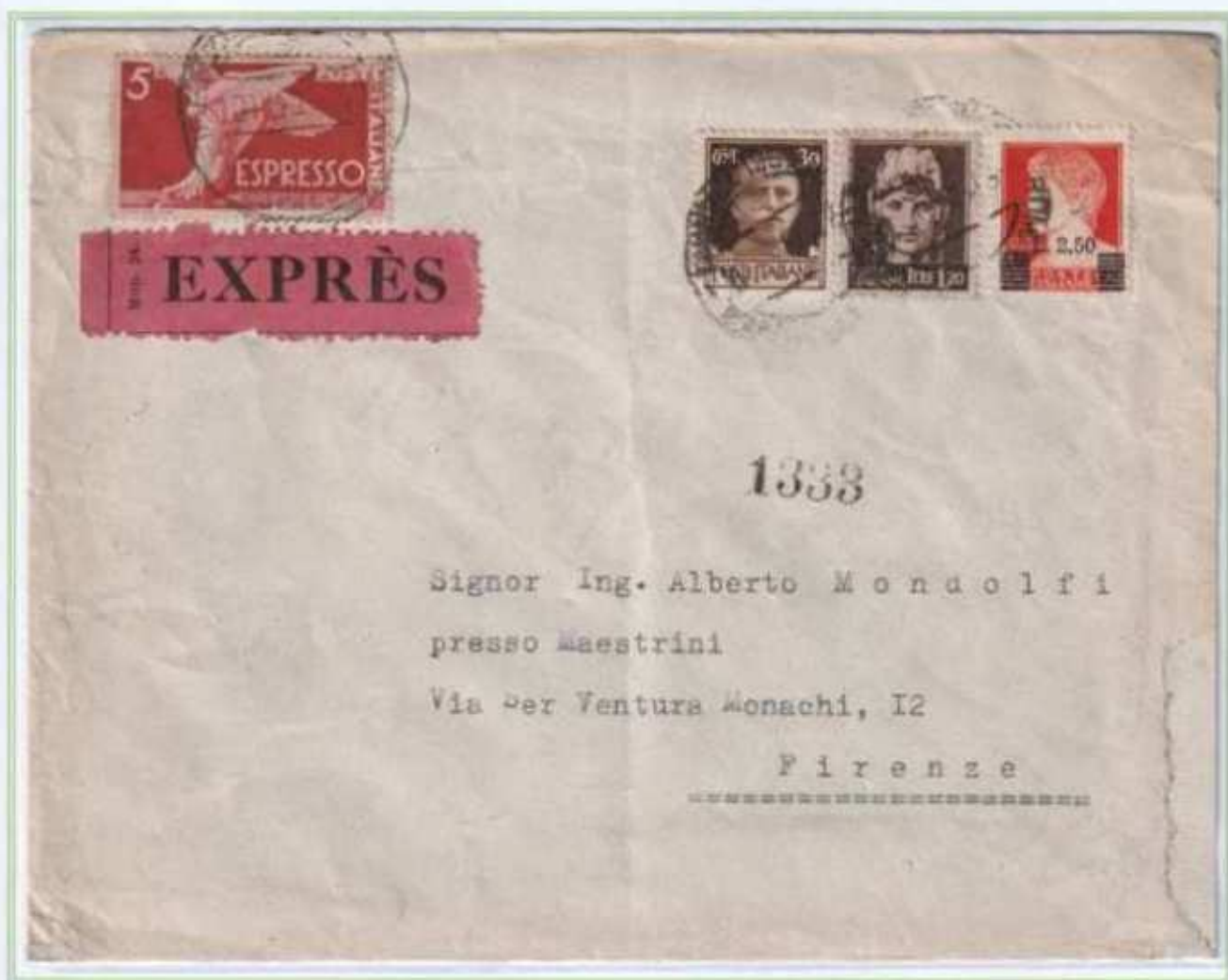
10/11/1945 - Lettera 2 porti espresso tariffa 9 L (4 L di 2 porti di lettera e 5 L di espresso) da Roma a Firenze. I valori imperiale e democratica sono insieme a due valori di luogotenenza.