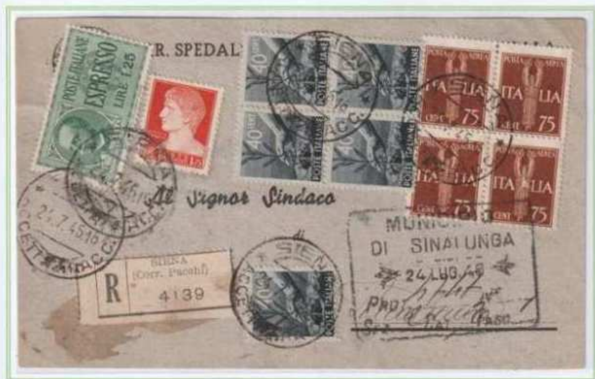
24/07/1946 - Cartolina postale raccomandata tariffa 8 L. (3 L. di cartolina postale e 5 L. di raccomandazione aperta) da Siena a Sinalunga. Il valore espresso fu usato come ordinario