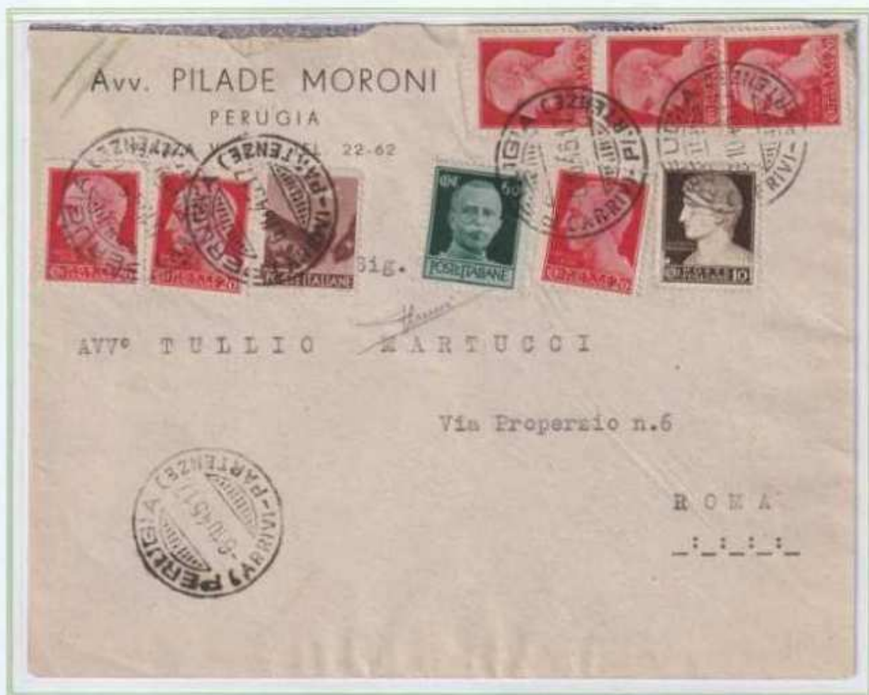
06/10/1945 - Lettera semplice tariffa 2 l. da Perugia a Roma il 10 c. imperiale è in combinazione con il gemello della democratica insieme ad altri valori di luogotenenza emissione di Roma. (c)