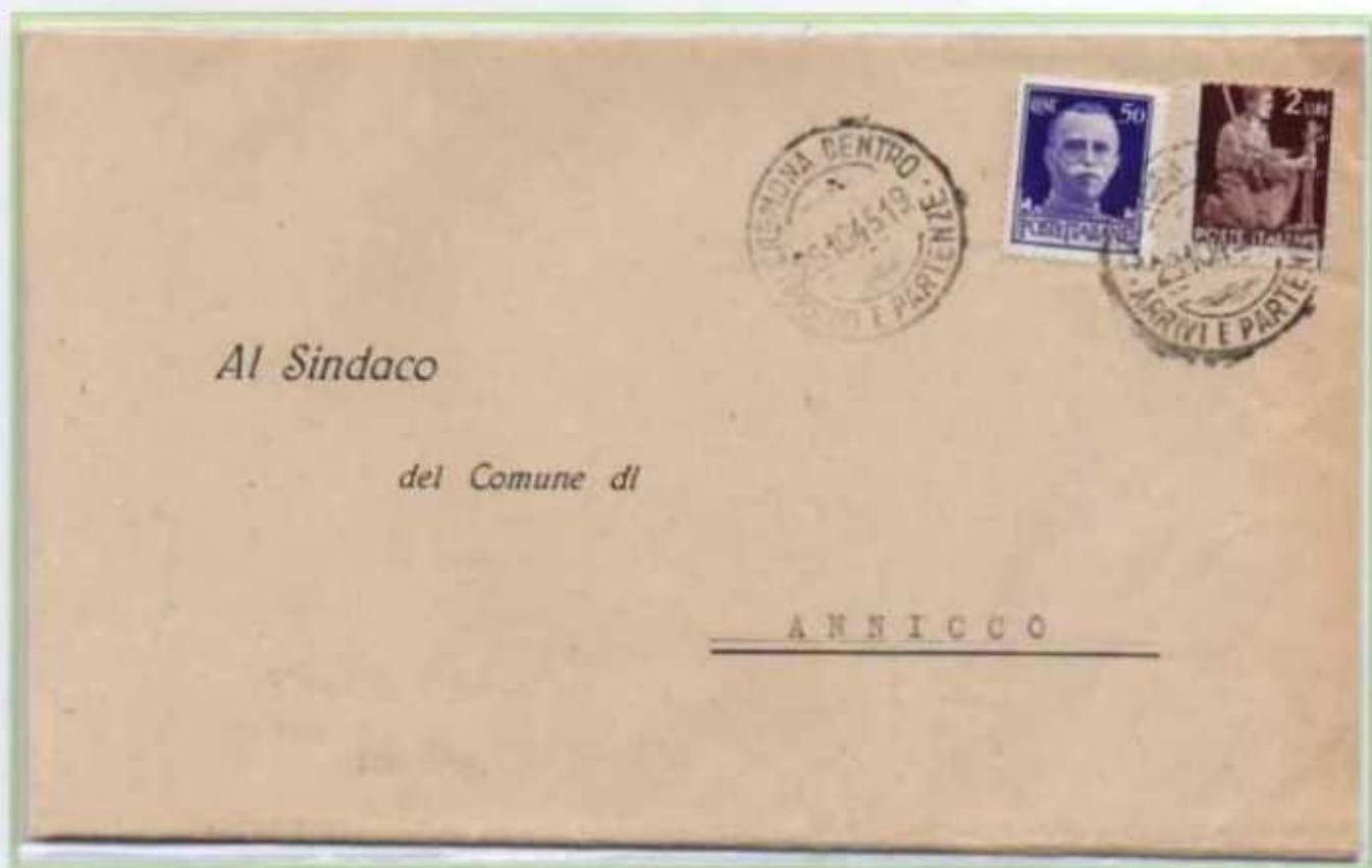
29/10/1945 - Manoscritto tariffa 2,40 l. da Cremona ad Annicco, affrancato in eccesso di 10 c.