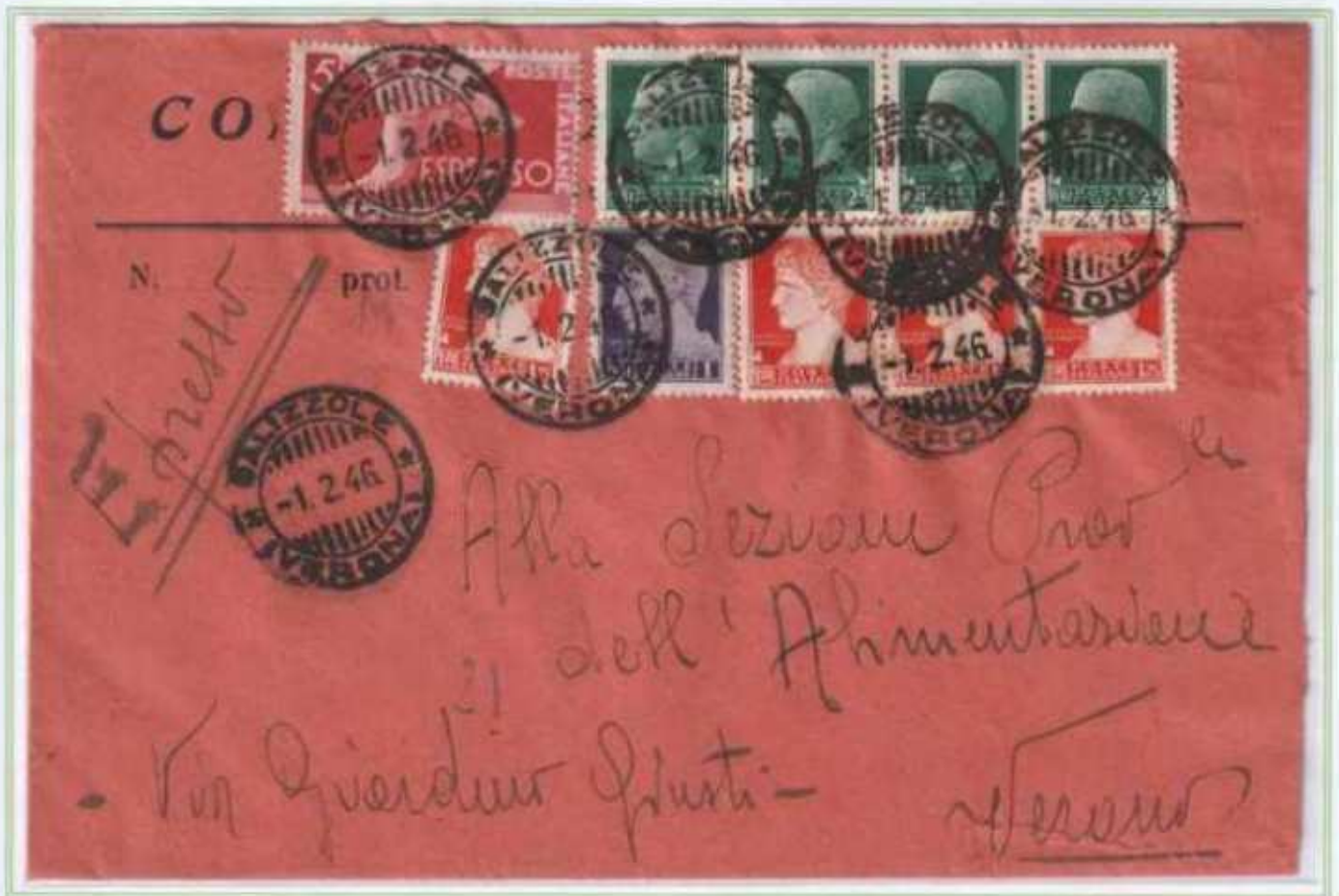
01/02/1946 - Lettera espresso tariffa 14 l. (4 l. di lettera e 10 l. di espresso) da Salizzole a Verona nel 1° giorno di variazione delle tariffe postali.