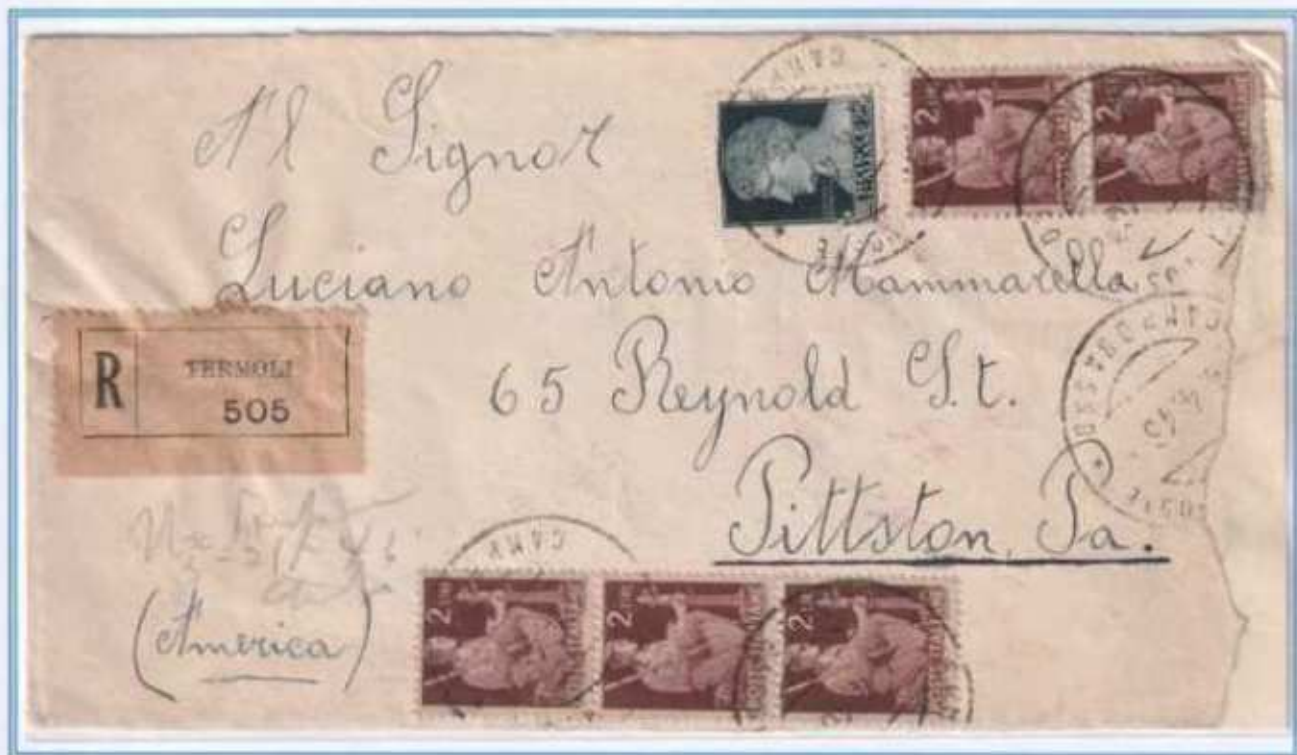
04/04/1946 - Lettera estero raccomandata tariffa 35 L (15 L di lettera e 20 L di raccomandazione) da Termoli a Pittston (Stati Uniti).