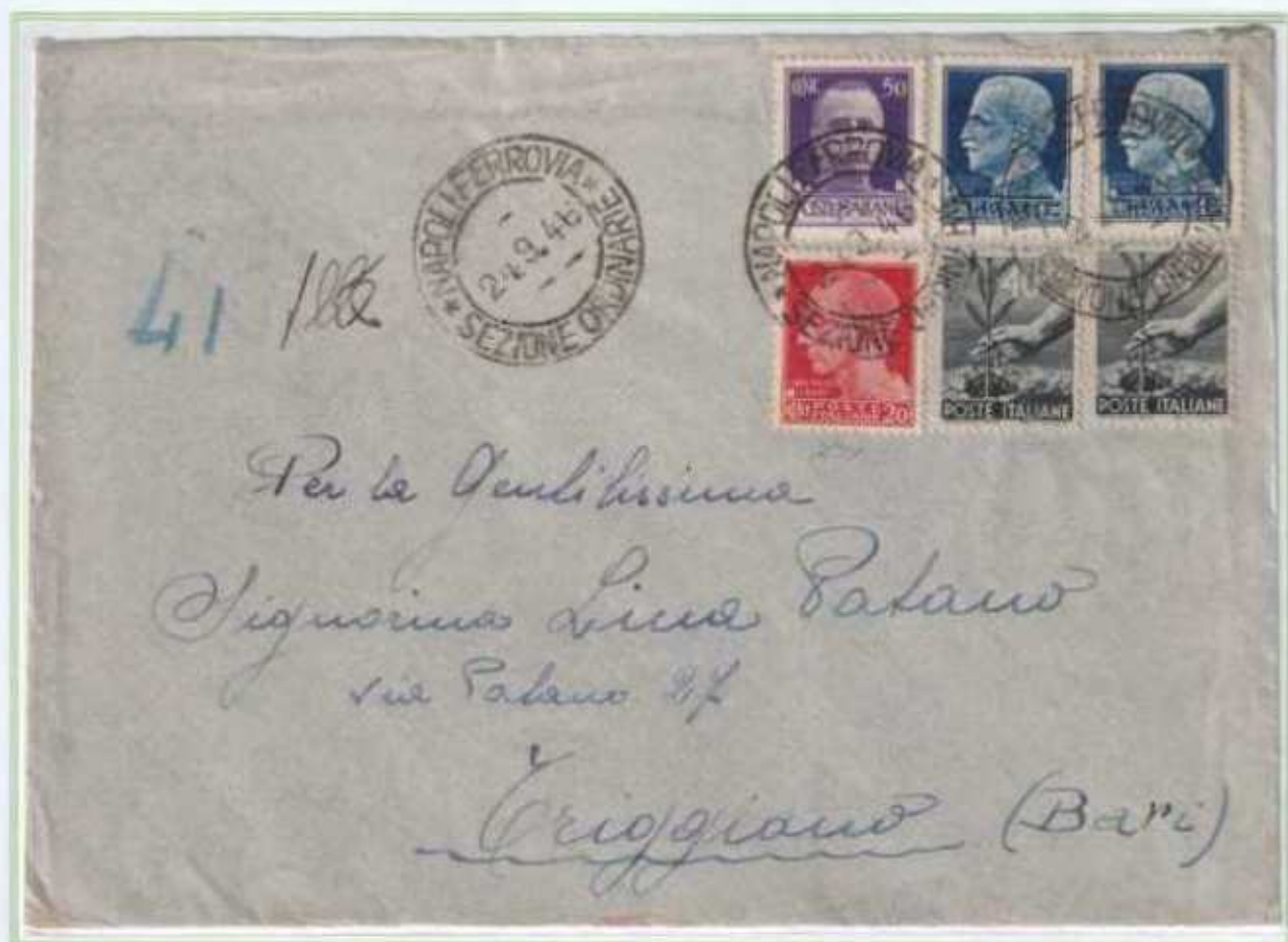
24/09/1946 - Lettera semplice tariffa 4 L. da Napoli a Triggiano, i francobolli imperiale erano tutti fuori corso da oltre due mesi ma in questo caso la lettera non fu tassata.