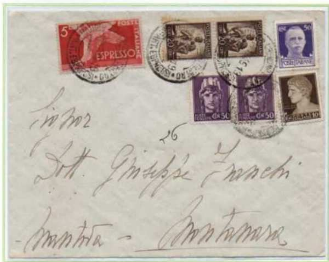
14/12/1945 - Lettera espresso tariffa 7 l. (2 l. di lettera e 5 l. di espresso) da Cremona a Montanara. Ai valori imperiale e democratica è accostata una coppia del gemello da 50 c. luogotenenza emissione di Novara.