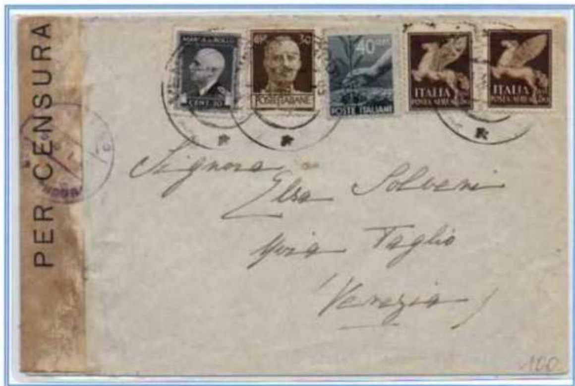
25/01/1946 - Lettera in distretto 2 porti tariffa 2 l. da Venezia per città, oltre al valore democratica concorrono all'affrancatura un valore di luogotenenza emissione di Roma, due valori di posta aerea del regno e una marca da bollo.