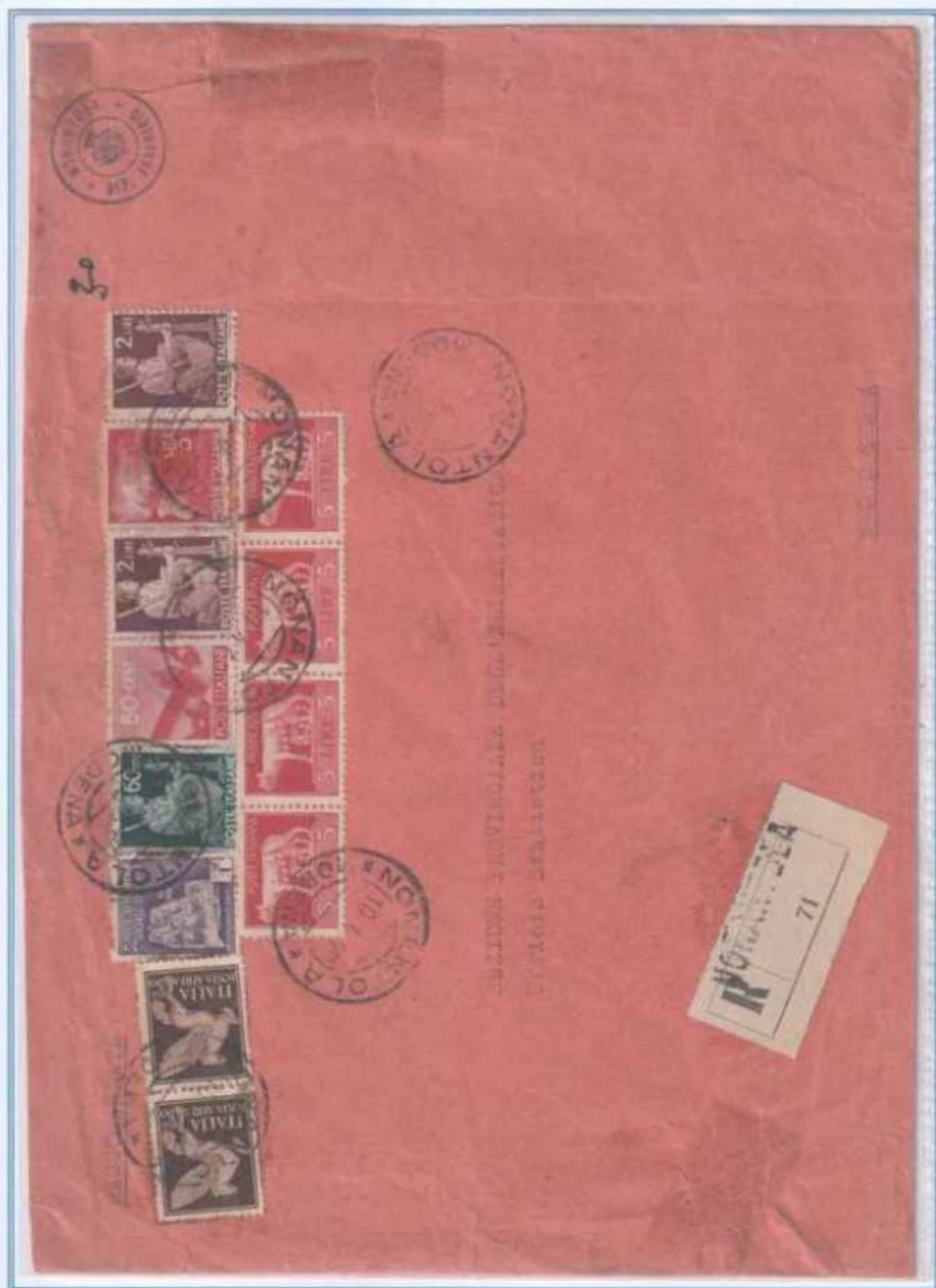
10/04/1946 - Lettera 5 porti raccomandata tariffa 30 L. (20 L. di 5 porti di lettera e 10 L. di raccomandazione) da Nonantola a Modena. Affrancatura con francobolli di quattro diversi periodi, ai valori imperiale e democratica si aggiungono un valore R.S.I. e una striscia di quattro di luogotenenza emissione di Roma.