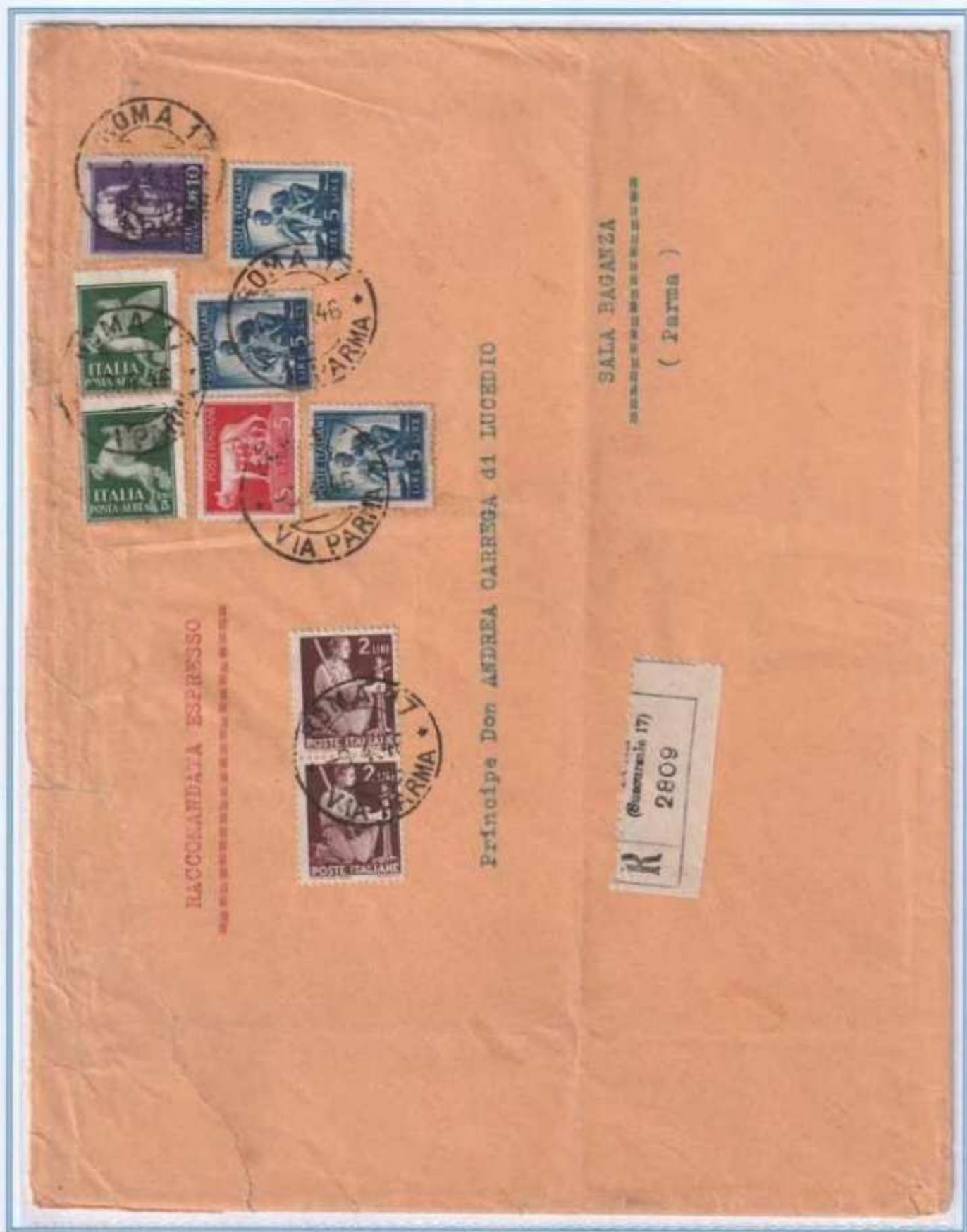
09/04/1946 - Lettera 6 porti raccomandata espresso tariffa 44 l. (24 l. di 6 porti di lettera, 10 l. di raccomandazione e 10 l. di espresso) da Roma a Sala Bagarzza. Ai valori imperiale/democratica si accompagnano due francobolli di luogotenenza emissione di Roma.

Non comune affrancatura con tre diversi francobolli da 5 lire.