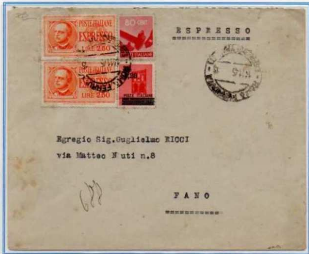
14/11/1945 - Lettera espresso tariffa 7 l. (2 l. di lettera e 5 l. di espresso) da Roma a Fano.