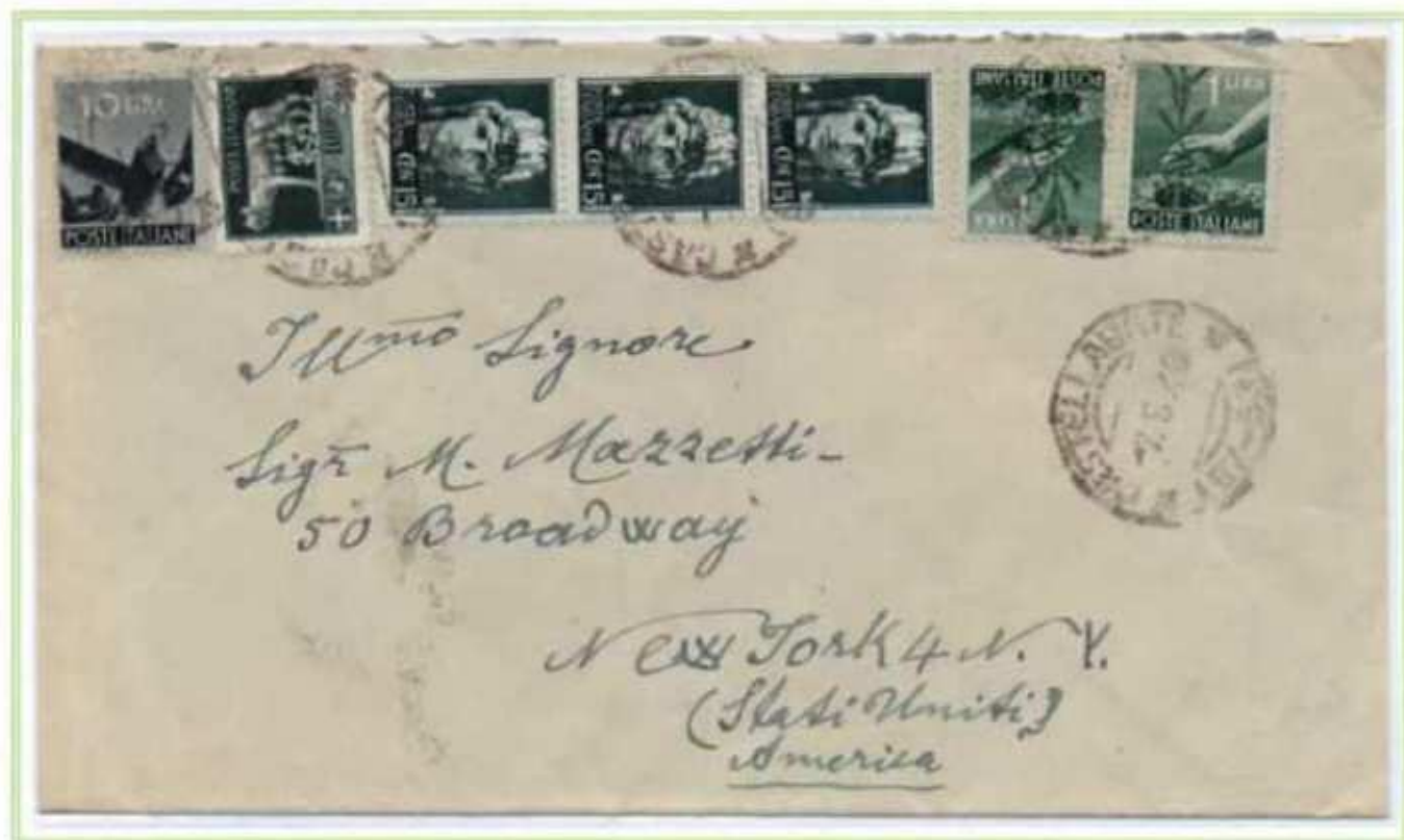
07/05/1946 - Lettera estero tariffa 15 l. da Castellabate a New York (USA).