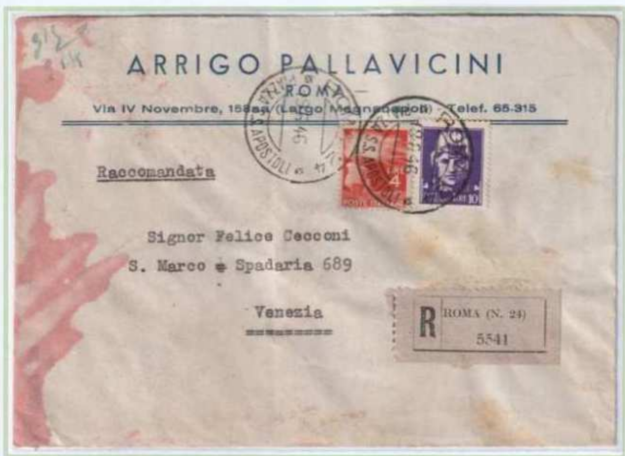
19/06/1946 - Lettera raccomandata tariffa 14 L. (4 L. di lettera e 10 L. di raccomandazione) da Roma a Venezia, uso in periodo di Repubblica possibile per soli 18 giorni.