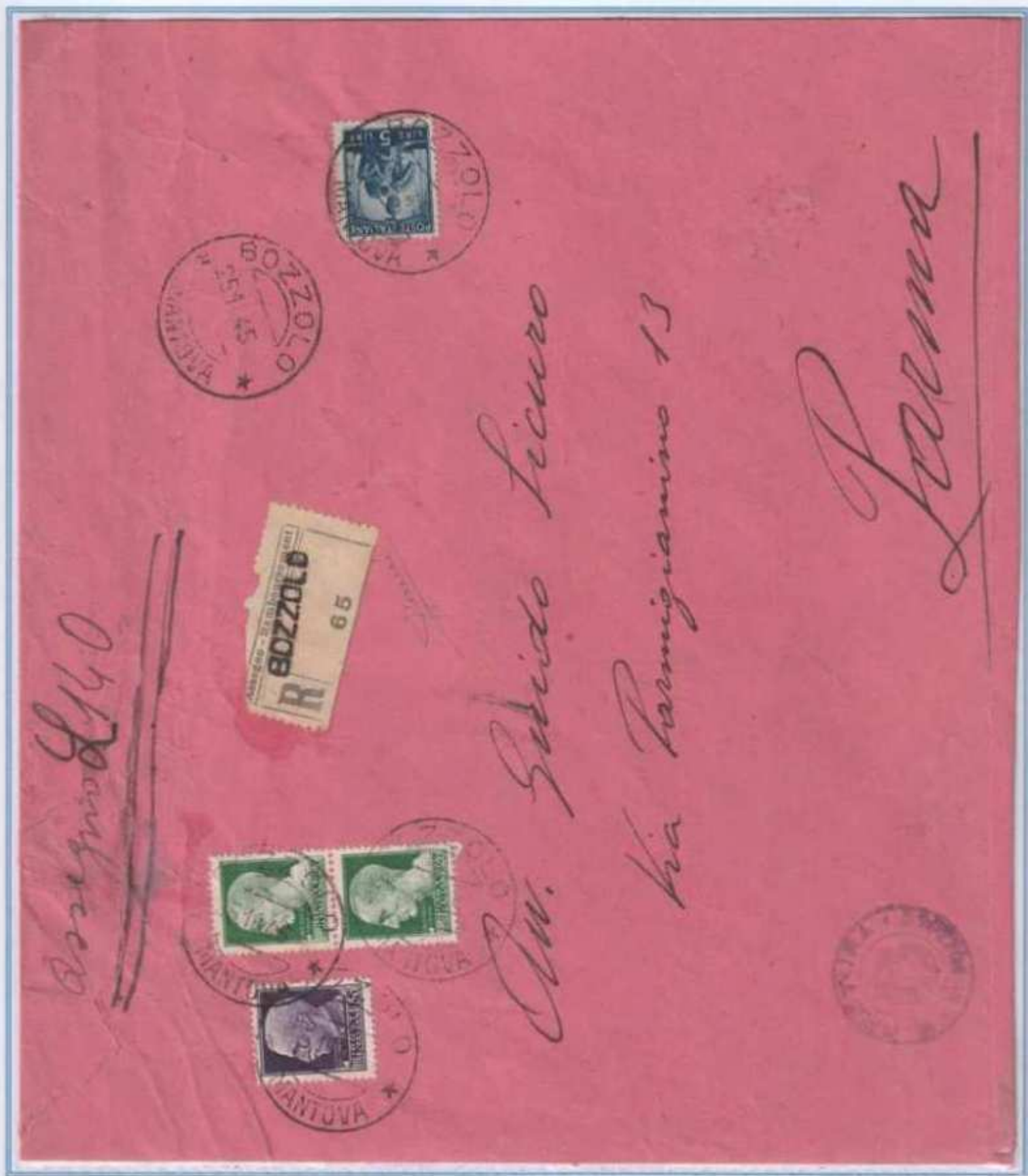
25/10/1945 - Lettera 44 porti raccomandata con assegno tariffa 95 l. (88 l. di 44 porti di lettera, 5 l. di raccomandazione e 2 l. di assegno) da Bozzolo a Parma. Affrancatura rara sia per la tariffa postale che per l'uso degli alti valori imperiale per l'interno. (e)