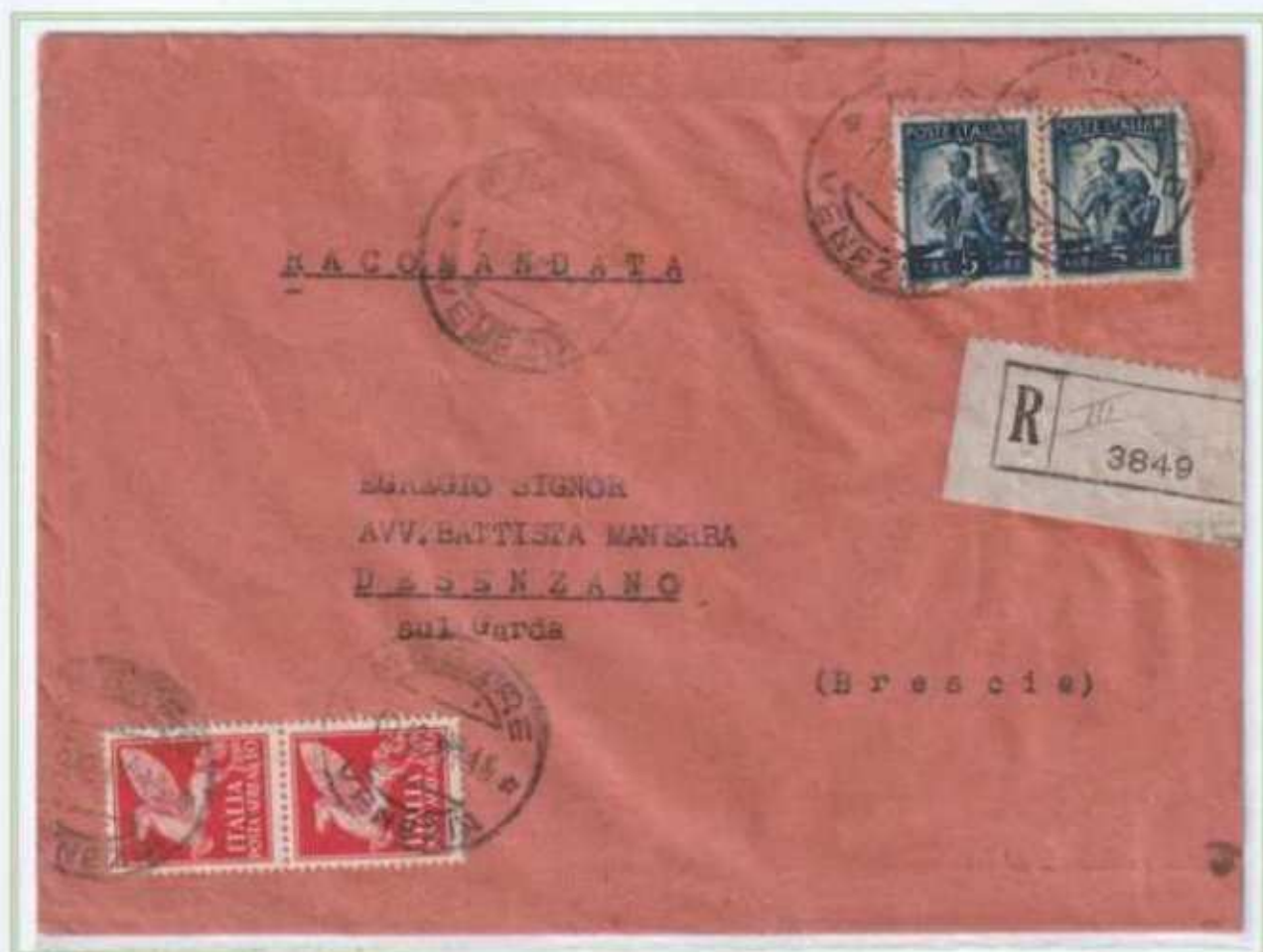
19/12/1947 - Lettera raccomandata tariffa 30 l. (10 l. di lettera e 20 l. di raccomandazione) da Mestre a Desenzano sul Garda.