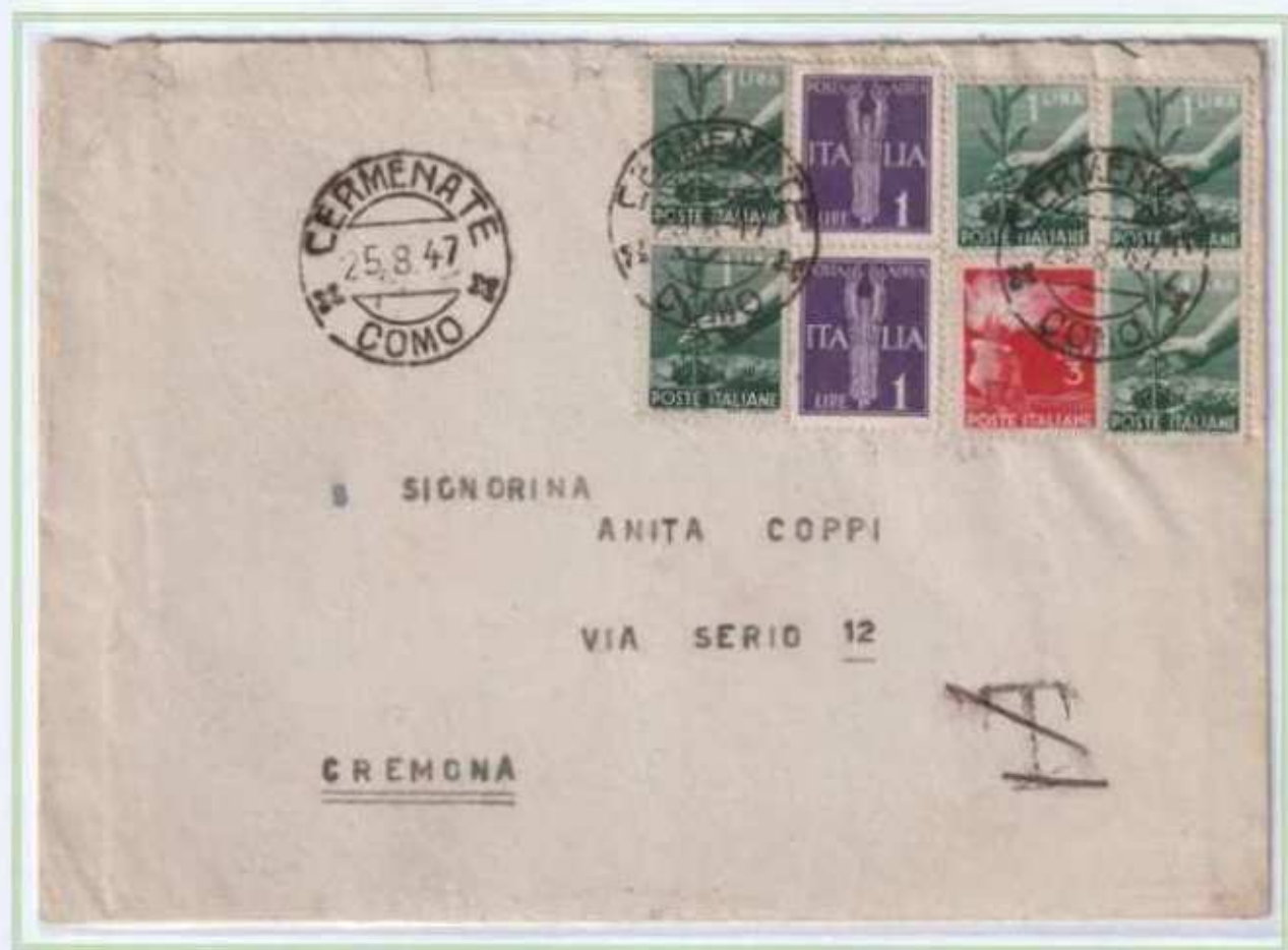
25/08/1947 - Lettera tariffa 10 L. da Cermenate a Cremona dapprima tassata e poi detassata.