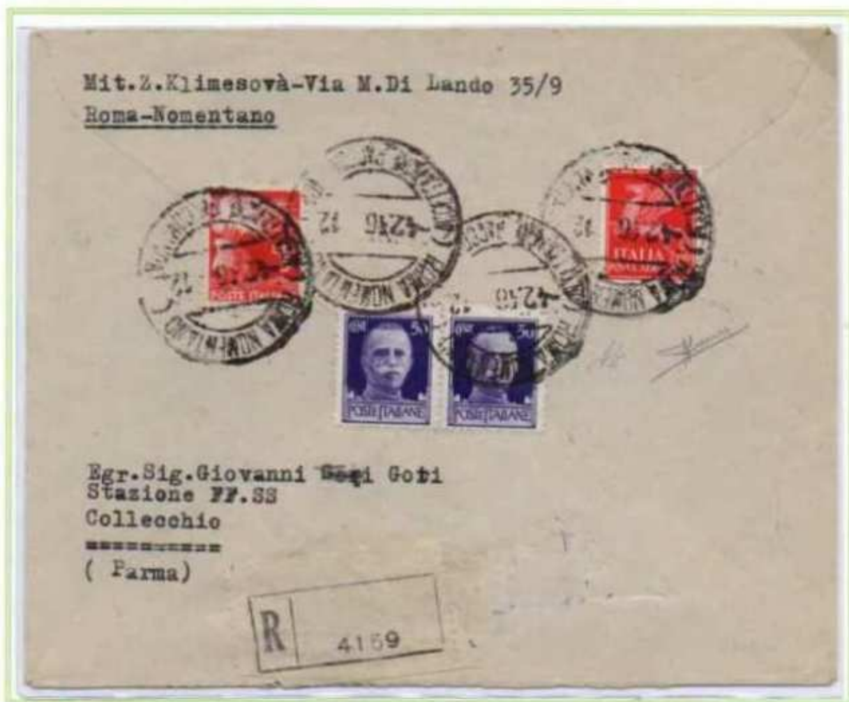
04/02/1946 - Lettera raccomandata tariffa 14 L. (4 L. di lettera e 10 L. di raccomandazione) da Roma a Collecchio.