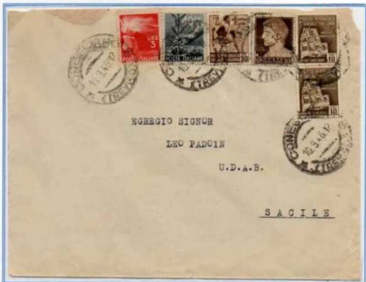
10/09/1946 - Lettera semplice tariffa 4 L. da Conegliano a Sacile, affrancatura tripla mista con gemelli del 10 c.. I valori imperiale e R.S.I. erano fuori corso ma la lettera non fu tassata.