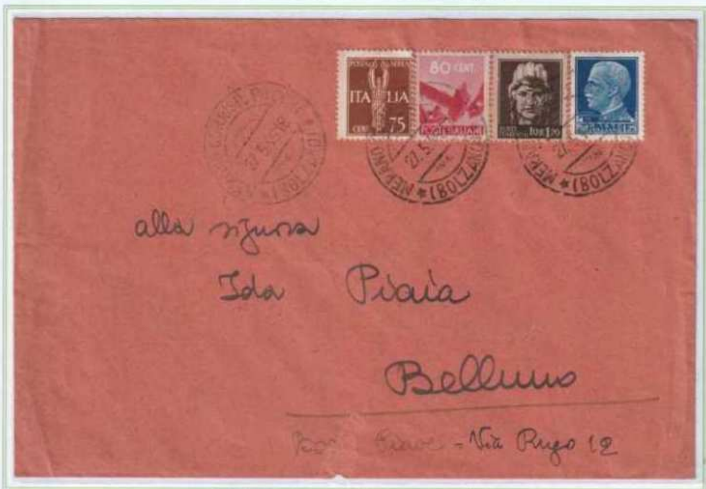
27/05/1946 - Lettera tariffa 4 l. da Merano a Belluno.