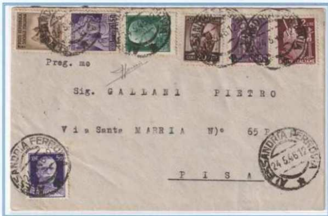
24/05/1946 - Lettera tariffa 4 L da Alessandria a Pisa. Affrancatura con francobolli di quattro diversi periodi storici con tre gemelli del 50 c.. Oltre all'imperiale e alla democratica sono presenti due valori R.S.I. e un valore di luogotenenza emmissione di Novara. (e)