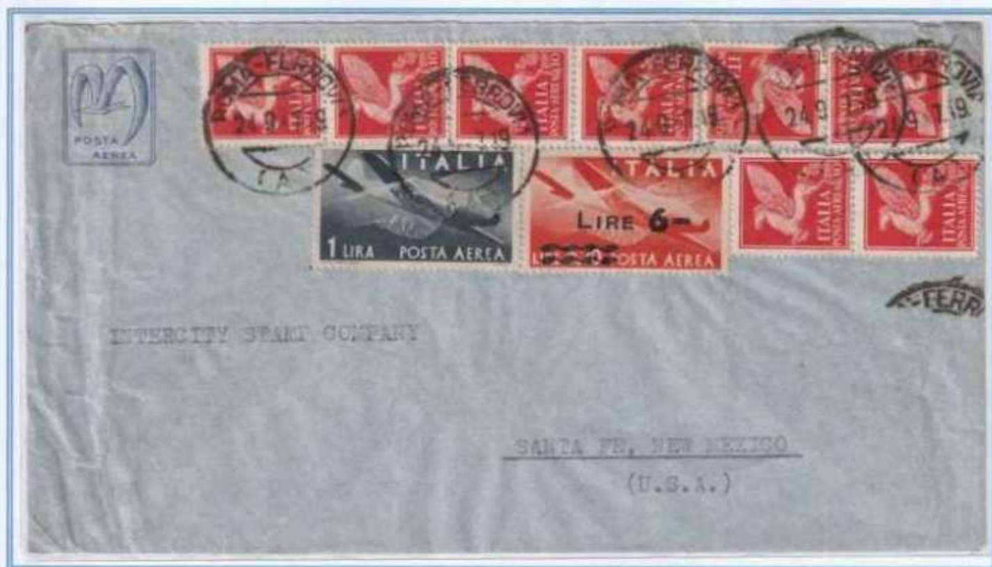
24/09/1947 - Lettera estero posta aerea tariffa 87 l. (30 l. di lettera e 57 l. per 1 porto di posta aerea) da Roma a Santa Fe (Stati Uniti). (e)