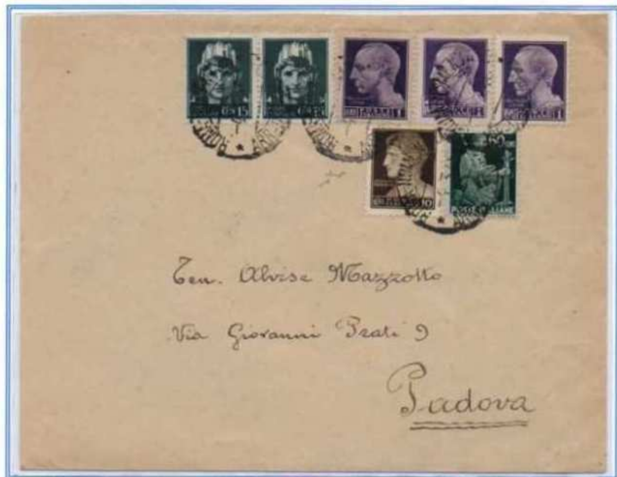
04/03/1946 - Lettera semplice tariffa 4 l. da Roma a Padova. L'affrancatura oltre ai valori imperiale con fasci e democratica comprende anche un valore da 1 l. e 10 c. luogotenenza di Novara ed un valore da 1 l. luogotenenza emissione di Roma. Tripla gemellare.