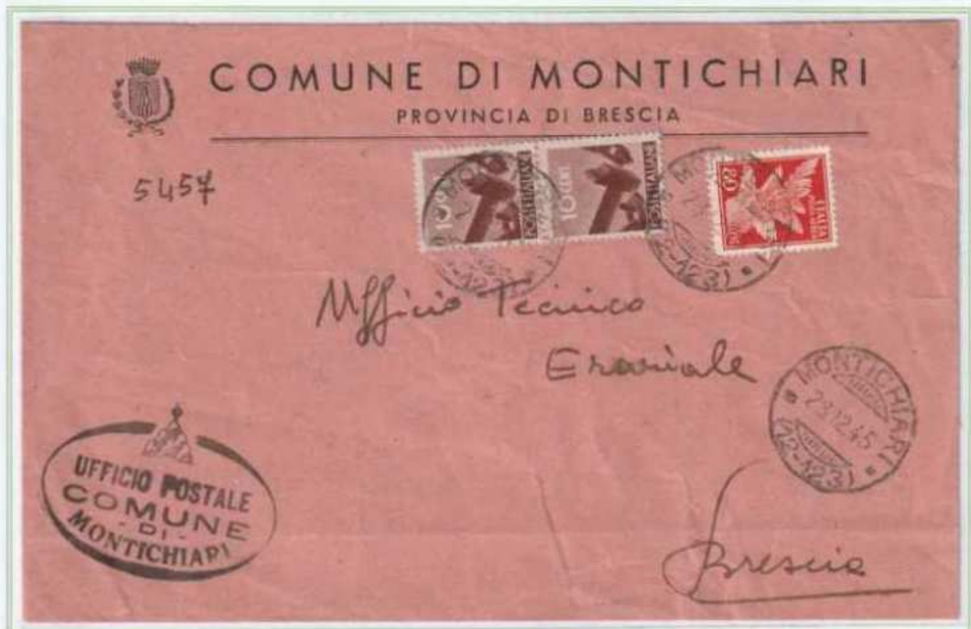
28/12/1945 - Lettera sindaci tariffa 1 L. da Montichiari a Brescia.