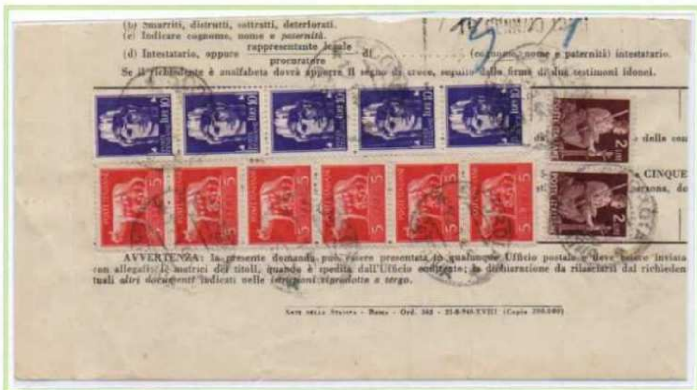
12/01/1946 - Talloncino di Modello B.I. 5 di duplicazione di buoni postali fruttiferi rilasciato dall'ufficio postale di Scordia. La tassa di 84 l. fu assolta con francobolli imperiale, democratica e luogotenenza emissione di Roma.