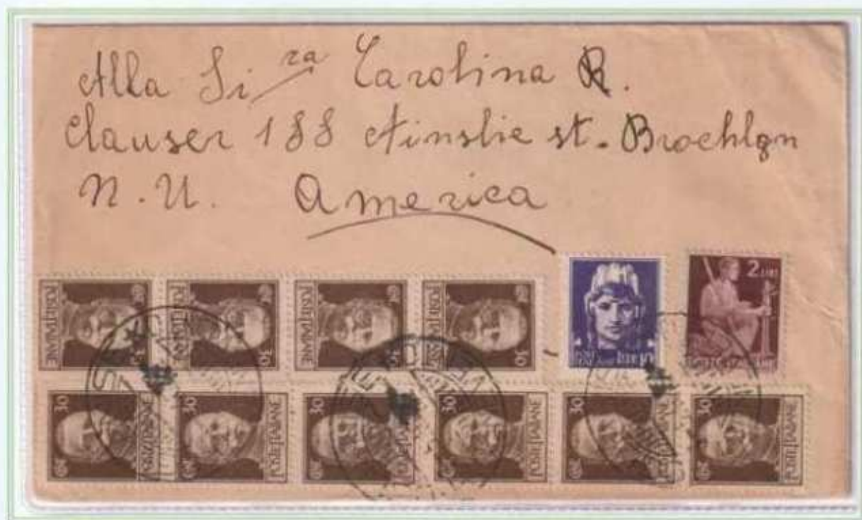
03/05/1946 - Lettera estero tariffa 15 l. da Foglianise a Brooklyn (Stati Uniti), i valori imperiale e democratica sono affiancati da dieci valori del 30 c. luogotenenza emissione di Roma.