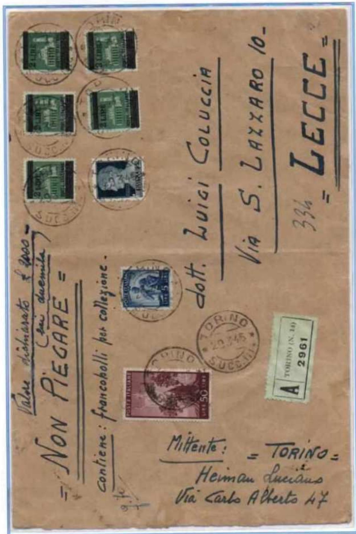
29/03/1946 - Lettera di 5 porti assicurata per 2000 l. (19 porti di assicurazione) tariffa 90 l. (20 l. di 5 porti di lettera, 10 l. di raccomandazione, 60 l. di assicurazione - 6 l. per le prime 200 l. e 54 l. per le restanti 1.800 l. - 3 l. ogni 100 l. successive alle prime 200 l.) da Torino a Lecce. Oltre ai valori democratica e imperiale sono presenti 5 francobolli di luogotenenza del 2 l. soprastampato su 25 c.