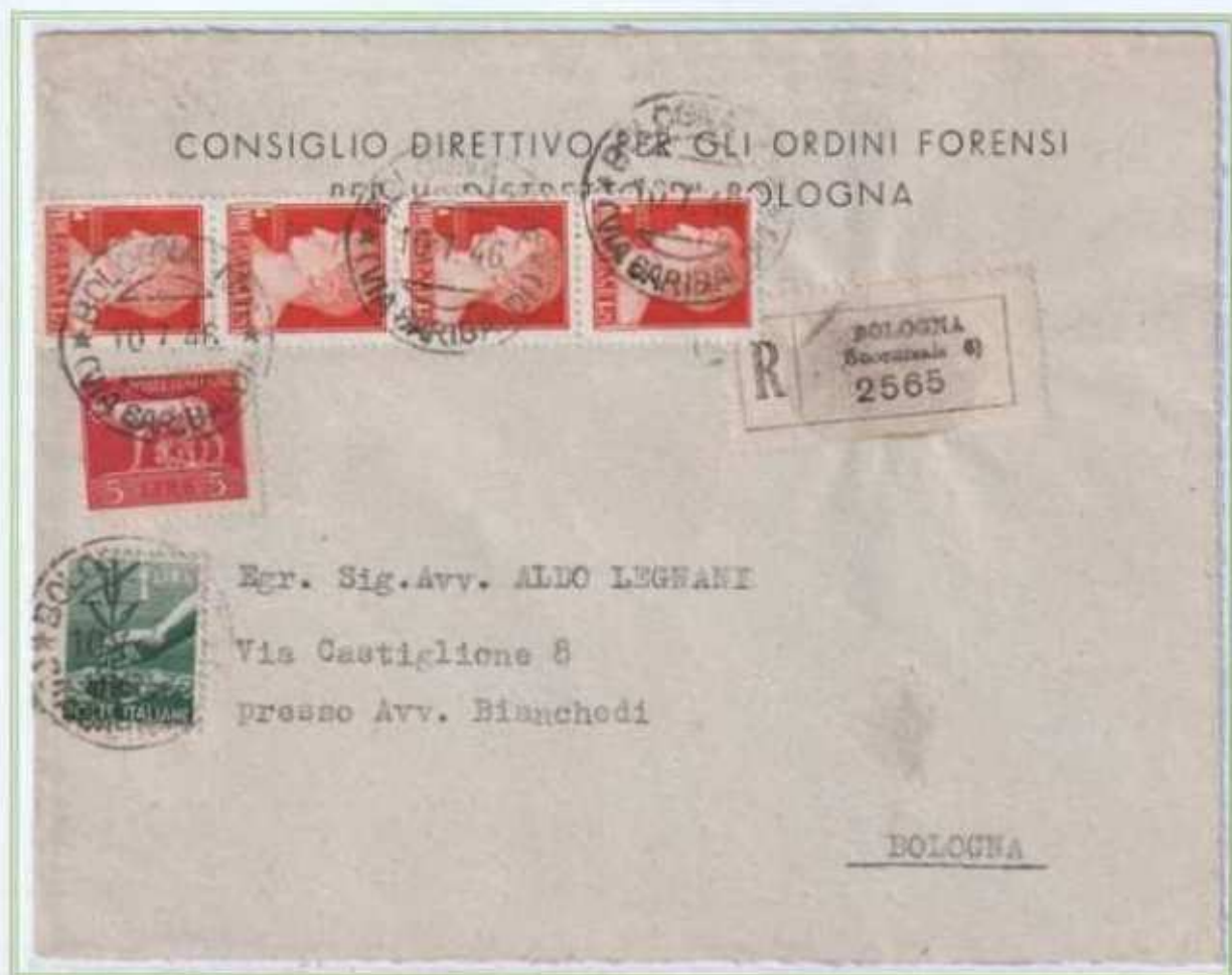
10/07/1946 - Lettera in distretto raccomandata tariffa 13 L (3 L di lettera in distretto e 10 L di raccomandazione) da Bologna per città con i francobolli imperiale usati nel periodo di tolleranza che durò fino a fine luglio. L'affrancatura fu completata con un valore di luogotenenza emissione di Roma.