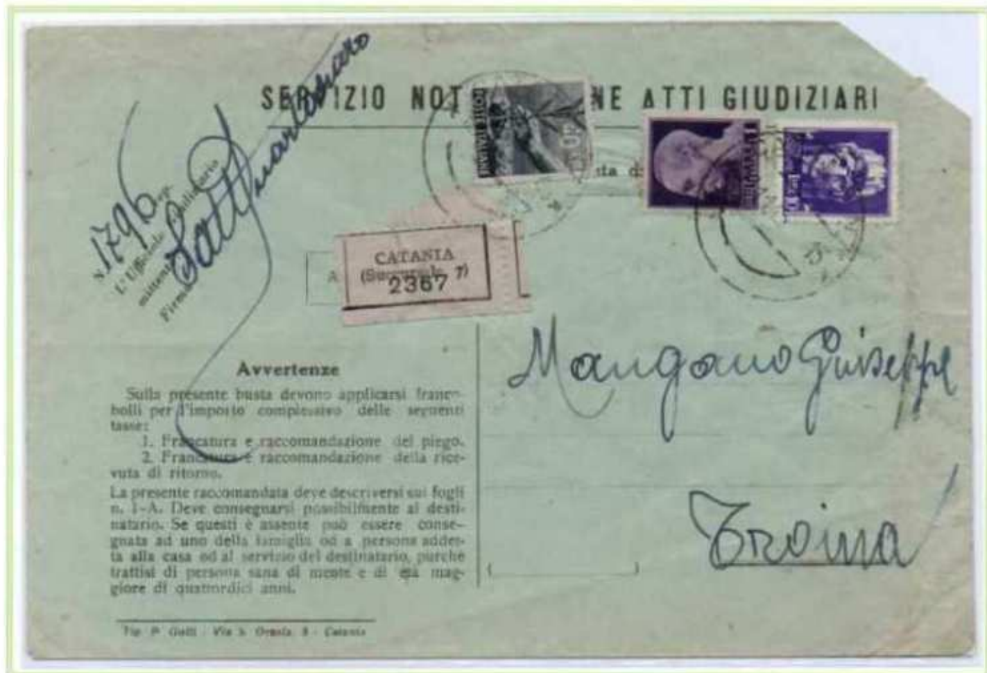
17/11/1945 - Lettera raccomandata atti giudiziari tariffa 11,40 l. (2 l. di lettera, 5 l. di raccomandazione, 2 l. di avviso di ricevimento e 2,40 l. di raccomandazione aperta per l'avviso di ricevimento) da Catania a Troina. L'affrancatura comprende anche un valore di luogotenenza emissione di Roma.