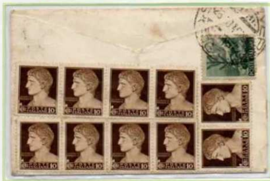
26/10/1946 - Biglietto da visita tariffa 2 L. da San Severo a San Paolo Civitate, affrancato con il valore democratica e dieci valori del 10 c. imperiale. In arrivo a San Paolo la corrispondenza fu tassata in quanto i valori del 10 c. non validi perchè fuori corso.