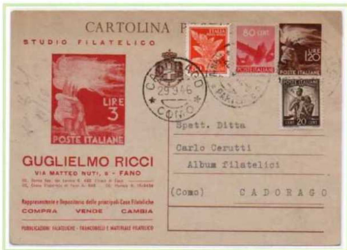
26/09/1946 - Cartolina postale tariffa 3 l. da Fano a Cadorago, combinazione di gemelli non comune.