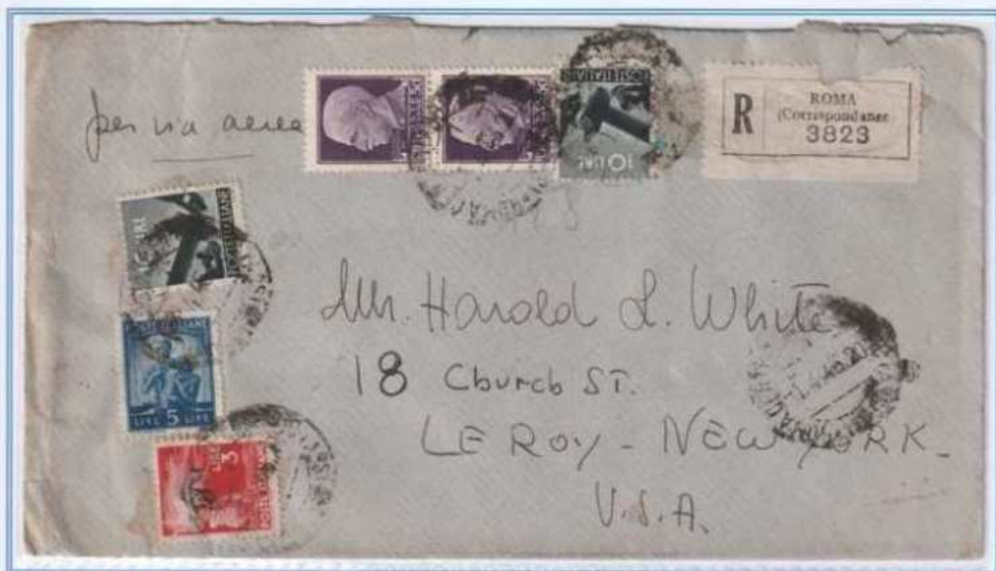
01/04/1946 - Lettera estero raccomandata posta aerea 3 porti (da 11 e 15 grammi) tariffa 128 L. (15 L. di lettera, 20 L. di raccomandazione e 93 L. per i 3 porti di posta aerea- 31 L. ogni 5 grammi -) da Roma a New York (Stati Uniti)