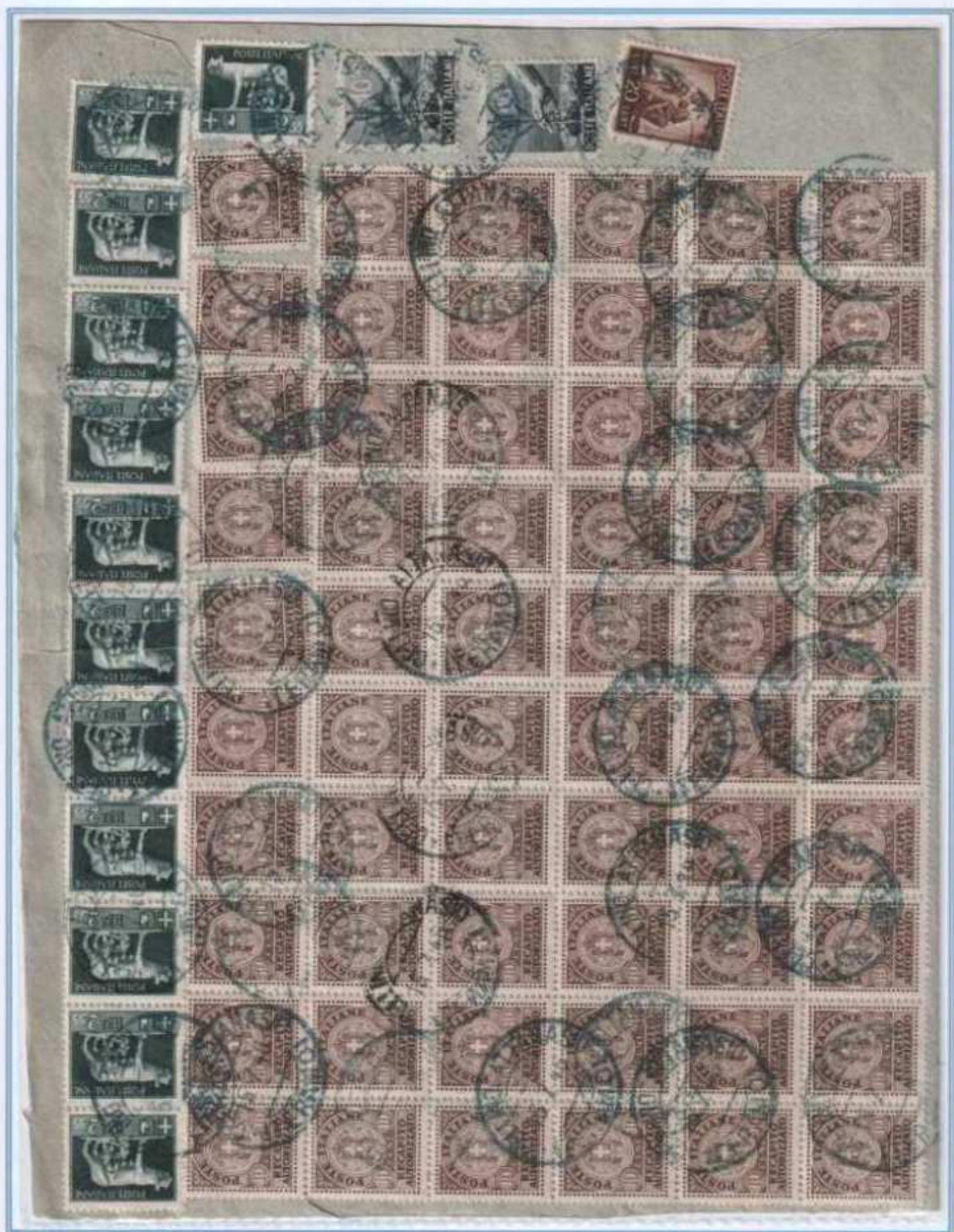
15/07/1946 - Lettera 7 porti raccomandata tariffa 38 L (28 L di 7 porti di lettera, 10 L di raccomandazione) da Cellino Attanasio a Teramo. Afrancatura in difetto di 40 c.