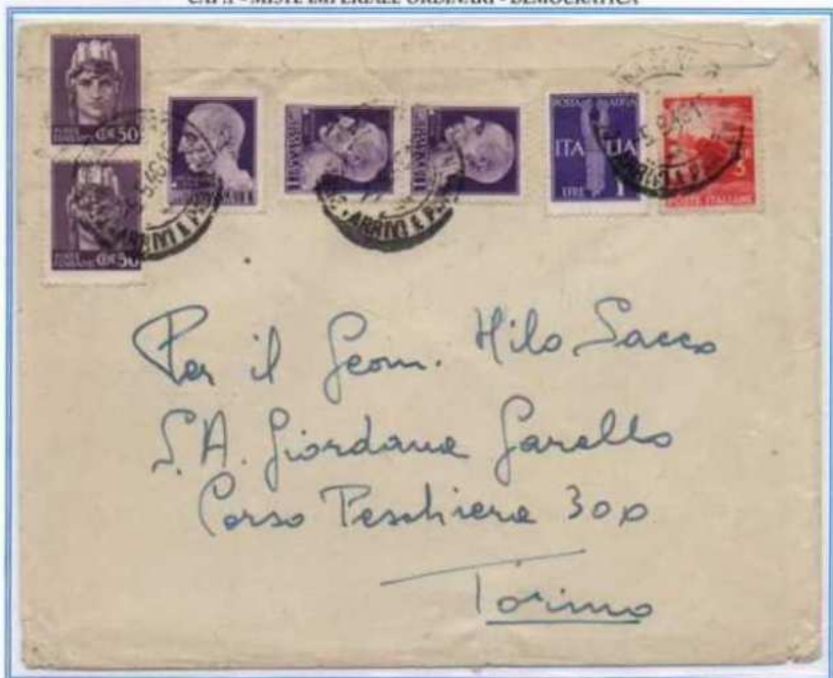
05/05/1946 - Lettera 2 porti tariffa 8 l. da Cremona a Torino. Affrancatura con gemelli da 1 l. che oltre ai valori imperiale e democratica è completata con una coppia della lira con fasci e una coppia del 50 c. luogotenenza emissione di Novara.