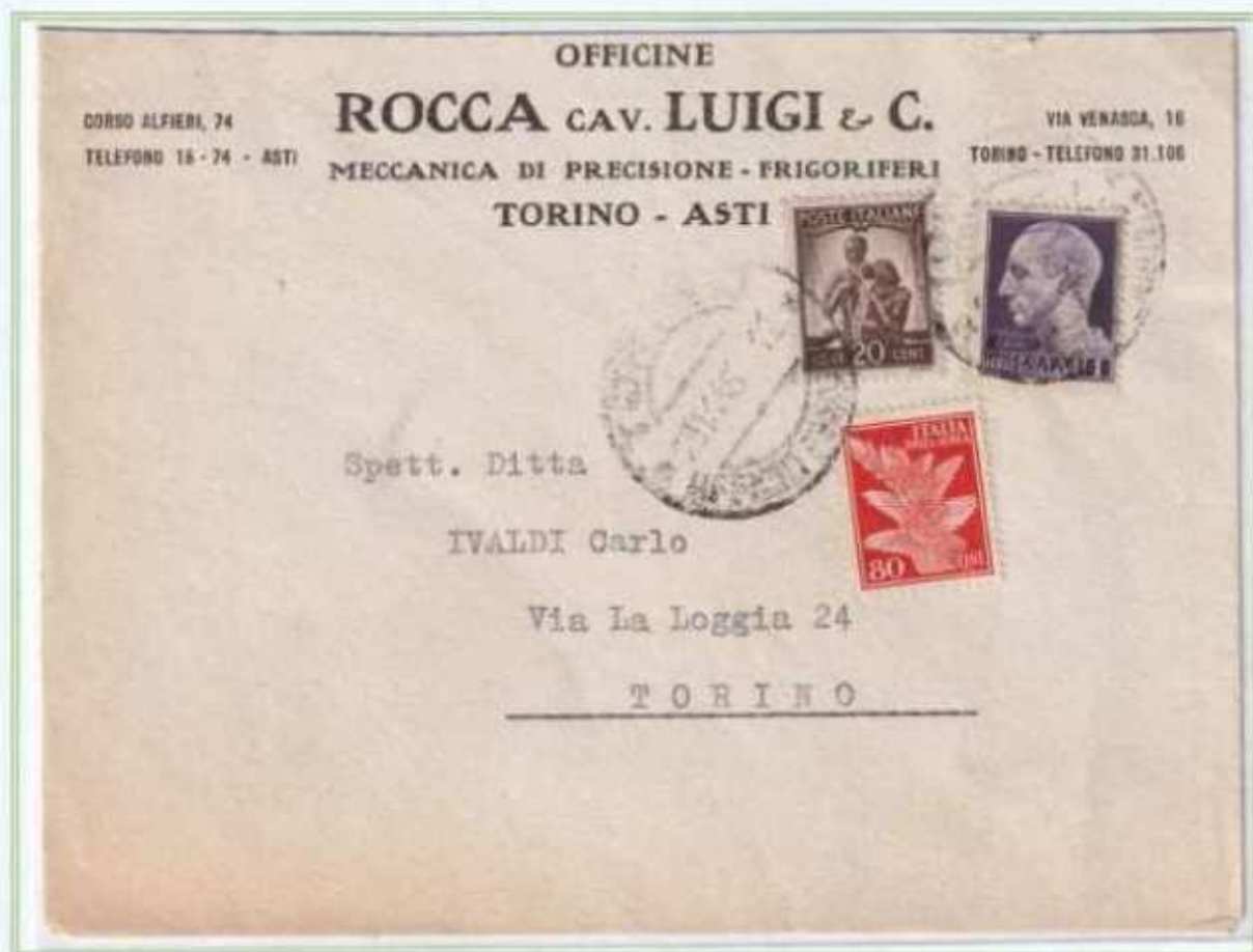
29/11/1945 - Lettera 2 porti in distretto tariffa 21, da Torino per città. L'utilizzo del valore da 1 L. luogotenenza emissione di Roma in Piemonte è inusuale e sporadico.