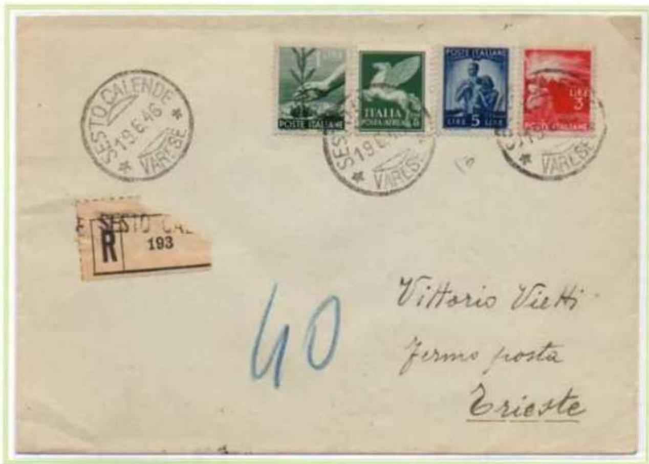
19/06/1946 - Lettera raccomandata tariffa 14 l. (4 l. di lettera e 10 l. di raccomandazione) da Sesto Calende a Trieste.