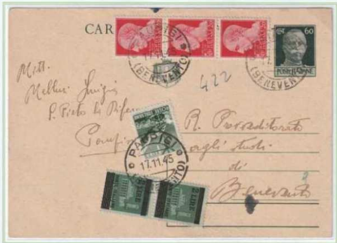
17/11/1945 - Cartolina postale espresso tariffa 6,20 L. (1,20 L. di cartolina postale e 5 L. di espresso) da Paupisi a Benevento, i francobolli imperiale e democratica insieme ad una coppia del 2 L. soprastampato luogotenenza integrano una CP da 60 c. luogotenenza.