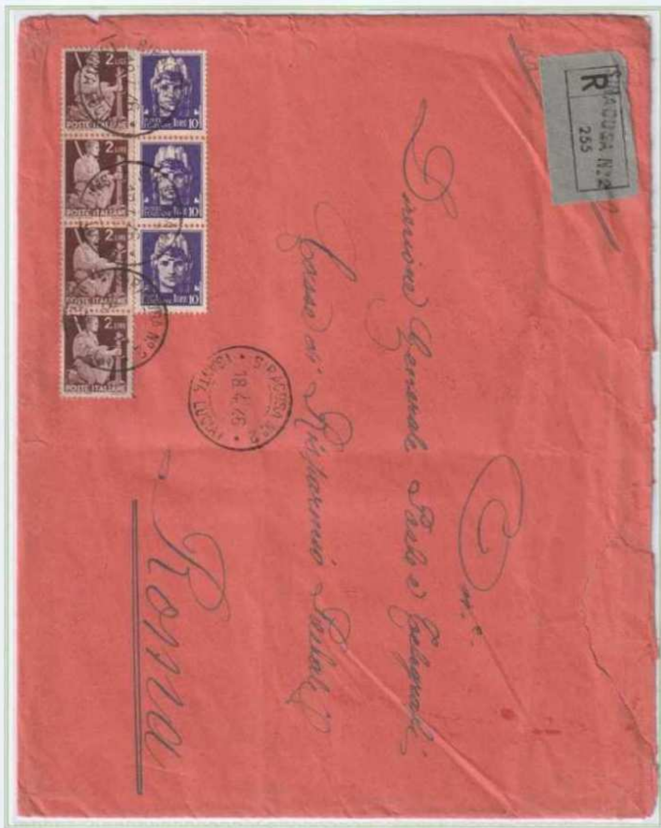
18/04/1946 - Lettera 7 porti raccomandata tariffa 38 l. (28 l. di 7 porti di lettera e 10 l. di raccomandazione) da Siracusa a Roma.