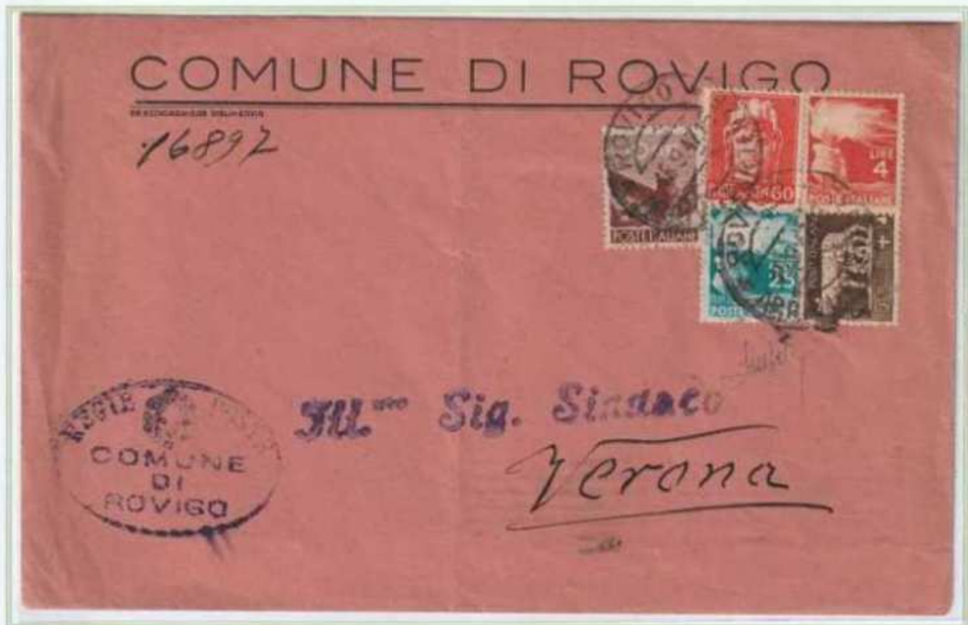
15/09/1947 - Lettera sindaci in tariffa ridotta tariffa 5 L. da Rovigo a Verona. Combinazione inusuale del 5 c. imperiale con il 25 c. democratica conseguenza dell'uso fuori corso da oltre un anno del francobollo imperiale. Inoltre gli stessi valori sembrano riutilizzati in frode postale, nonostante questo la lettera non venne tassata.