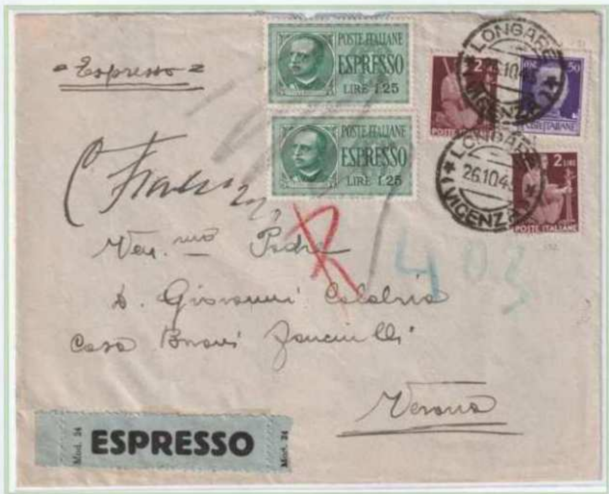
26/10/1945 - Lettera espresso tariffa 7 L. (2 L. di lettera e 5 L. di espresso) da Longare a Verona.