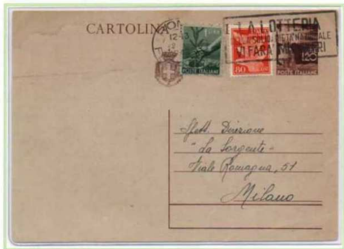
22/05/1946 - Cartolina postale tariffa 3 L, da Roma a Milano.