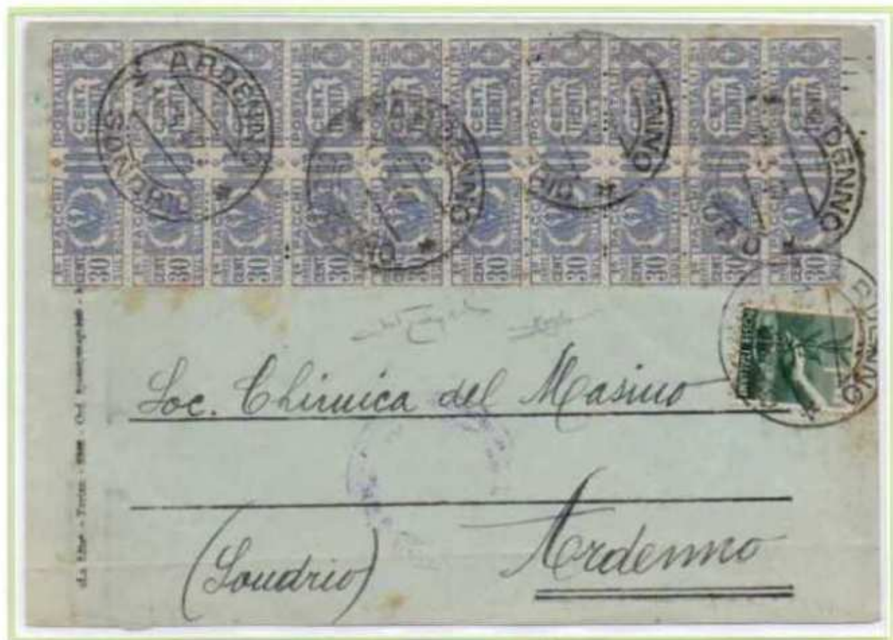
18/03/1947 - Lettera in distretto tariffa 3 L. da Ardenno per città affrancata in eccesso di 1 L.