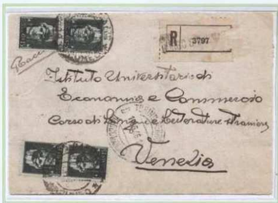
17/06/1946 - Lettera raccomandata tariffa 14 L. (4 L. di lettera e 10 L. di raccomandazione) da Borgo San Dalmazzo a Venezia. Affrancatura fronte/retro con ben 23 valori, l'affrancatura oltre che dai 15 c. imperiale e dai 3 L. democratica è completata con il 35 c. con fasci luogotenenza emissione di Novara.