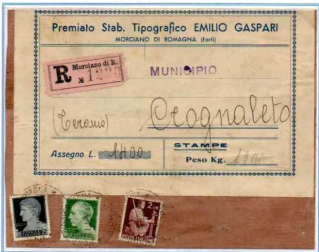
11/04/1946 - Stampe 38 porti raccomandate con assegno tariffa 47 l. (38 l. di 38 porti di stampe, 5 l. di raccomandazione aperta e 4 l. di assegno) da Morciano di Romagna a Crognaleto.