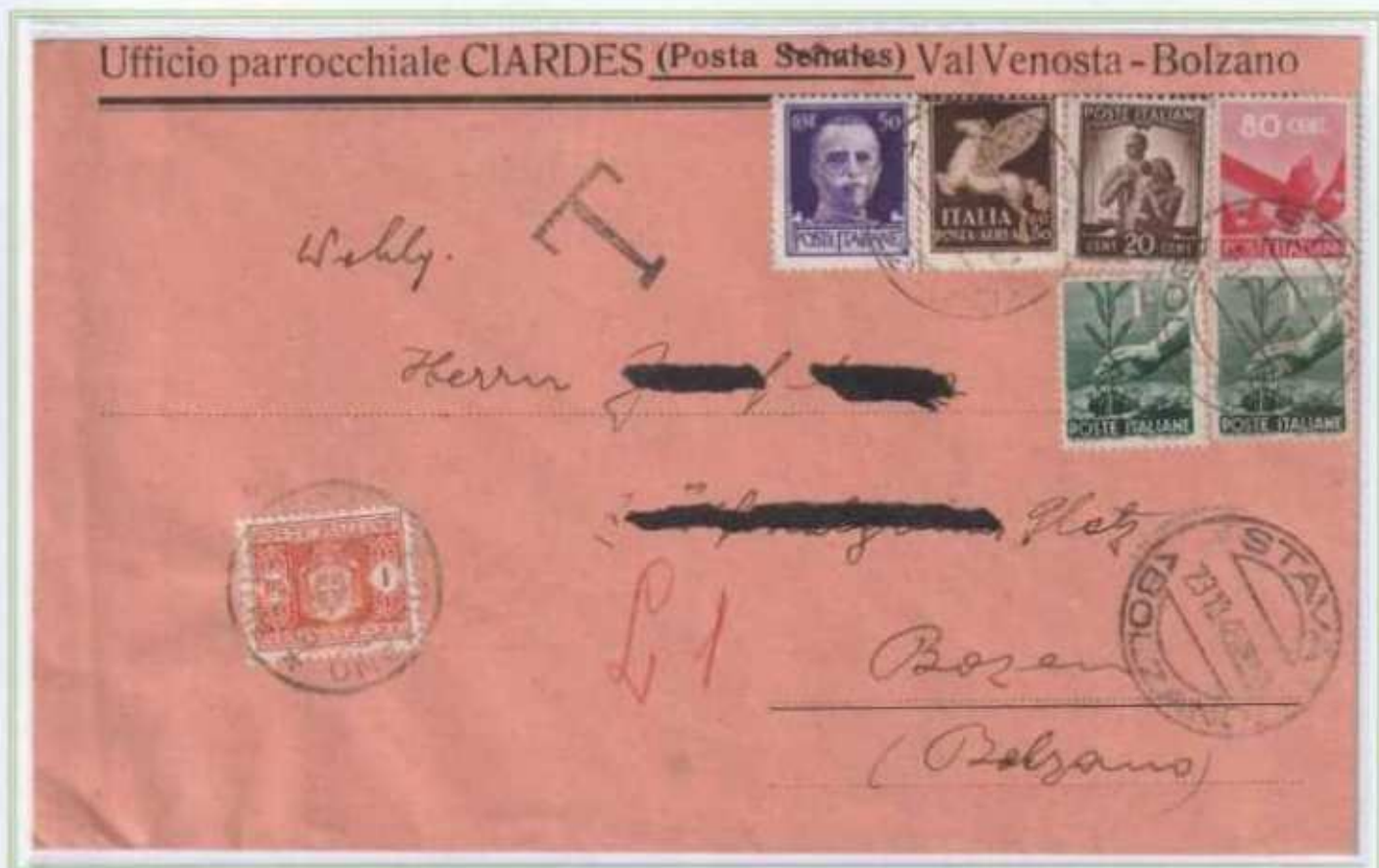
23/10/1946 - Lettera semplice tariffa 4 L da Stava a Bolzano. Il 50 c. imperiale fuori corso da quasi quattro mesi non fu ritenuto valido e in arrivo a Bolzano la lettera fu tassata per 1 L. (il doppio dell'importo mancante).