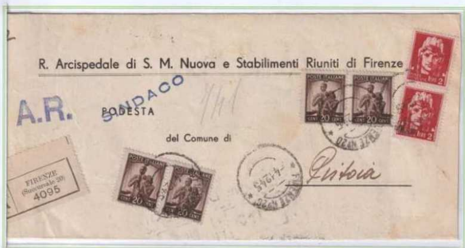
04/12/1945 - Manoscritto raccomandato tariffa 4,80 L. (2,40 L. di manoscritto e 2,40 L. di raccomandazione aperta) da Firenze a Pistoia.