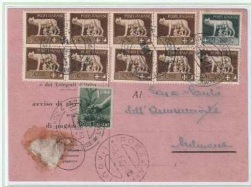
05/07/1946 - Avviso di ricezione tariffa 4 L. da Prezza a Sulmona.