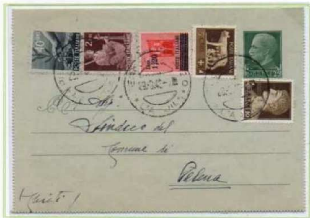
29/03/1946 - Biglietto Postale affrancato come lettera tariffa 4 l. da Pescocostanzo a Palena.