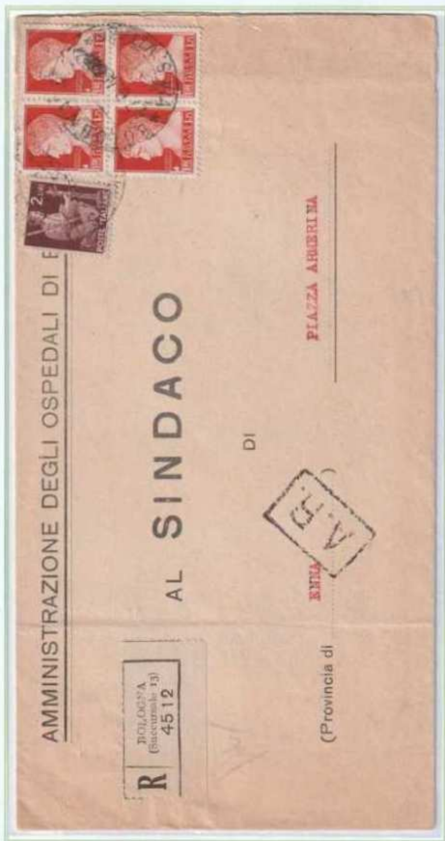
27/06/1946 - Lettera raccomandata aperte tariffa 9 L. (4 L. di lettera e 5 L. di raccomandazione aperta) da Bologna a Piazza Armerina.