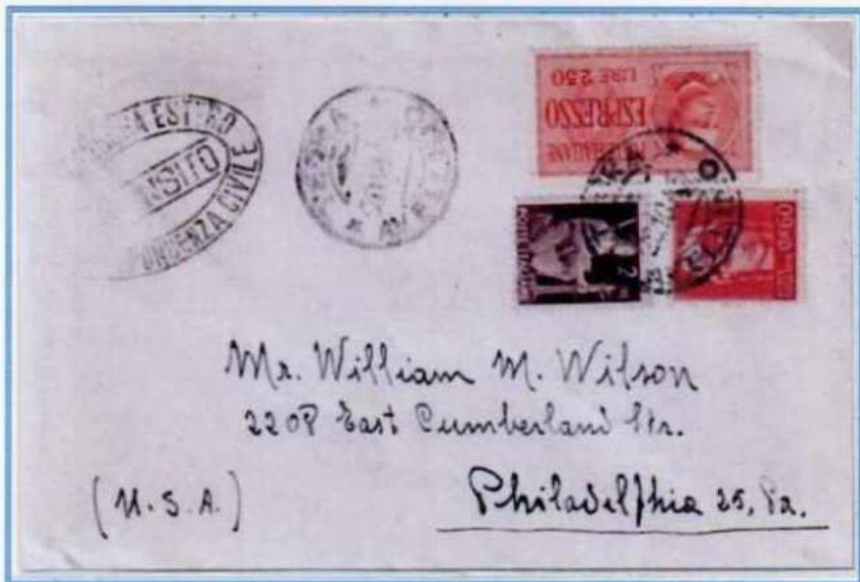
20/10/1945 - Lettera estero tariffa 5 l. da Teora a Philadelphia (Stati Uniti) affrancata in eccesso di 10 c., il valore espresso venne usato come ordinario.