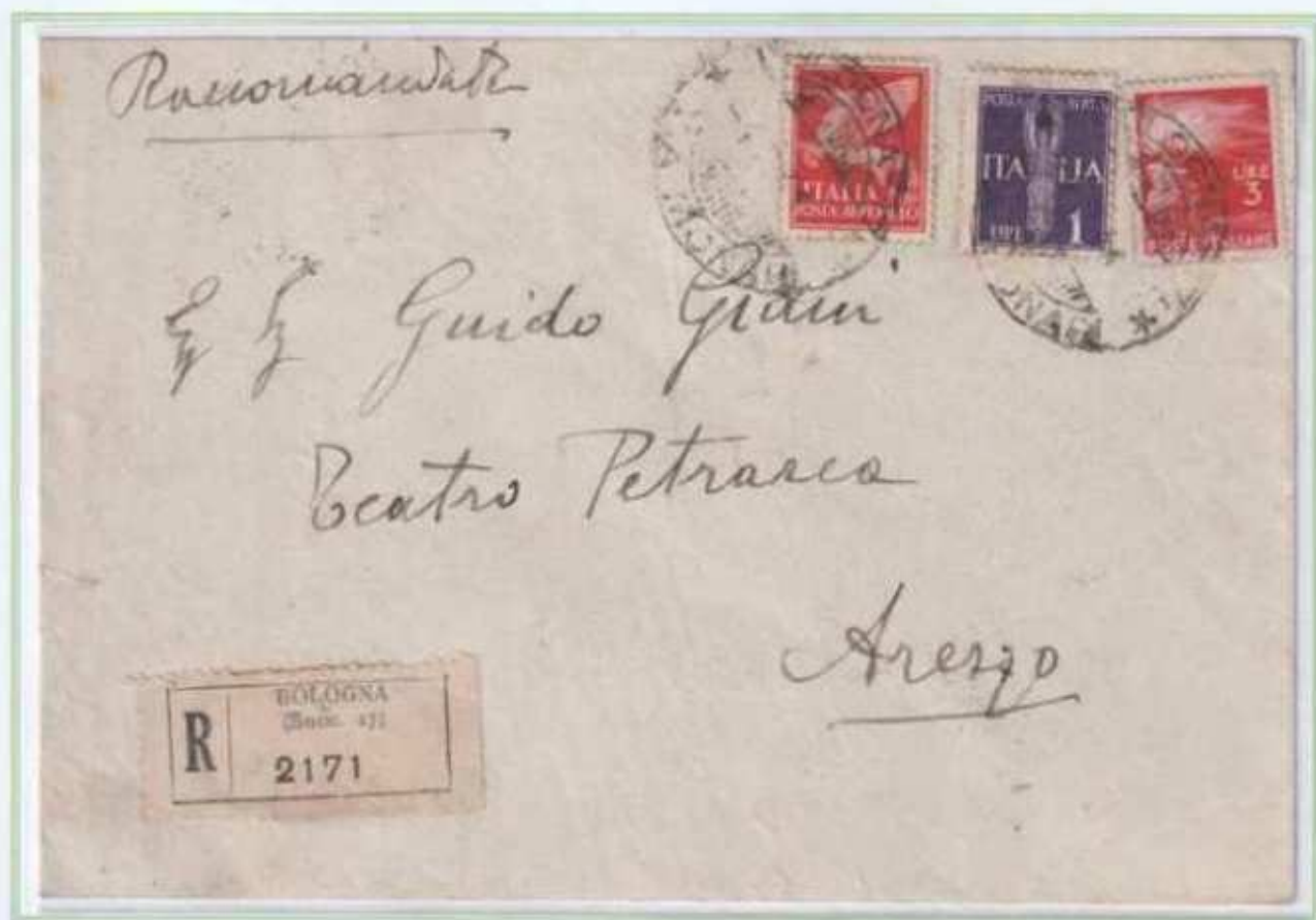
04/02/1946 - Lettera raccomandata tariffa 14 l. (4 l. di lettera e 10 l. di raccomandazione) da Bologna ad Arezzo.