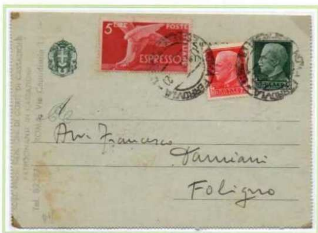
10/01/1946 - Biglietto posta espresso tariffa 7 l. da Roma a Foligno, assolta integrando un BP da 25 c. del regno con un 75 c. imperiale ed un francobollo espresso da 5 l. democratica. Tariffa in difetto di 1 l.