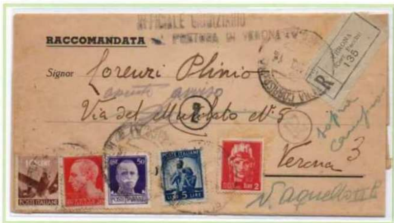
12/11/1945 - Lettera in distretto raccomandata atti giudiziari tariffa 7,80 l. (1 l. di lettera in distretto, 2,40 l. di raccomandazione aperta, 2 l. di avviso di ricevimento, 2,40 l. di raccomandazione aperta per l'avviso di ricevimento) da Verona per città, ai valori imperiale e democratica si aggiungono due valori luogotenenza emissione di Roma.