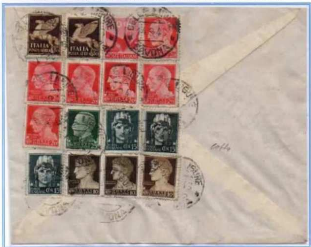
14/09/1946 - Lettera semplice tariffa 4 l. da Celle Ligure a Genova. Affrancatura con tre gemelli dove ai valori imperiale e democratica si aggiungono tre valori del 20 c. un valore del 15 c. e due valori del 10 c. luogotenenza emissione di Novara. Su questa lettera i francobolli erano tutti fuori corso ad eccezione del 50 c. posta aerea ed il valore democratica.