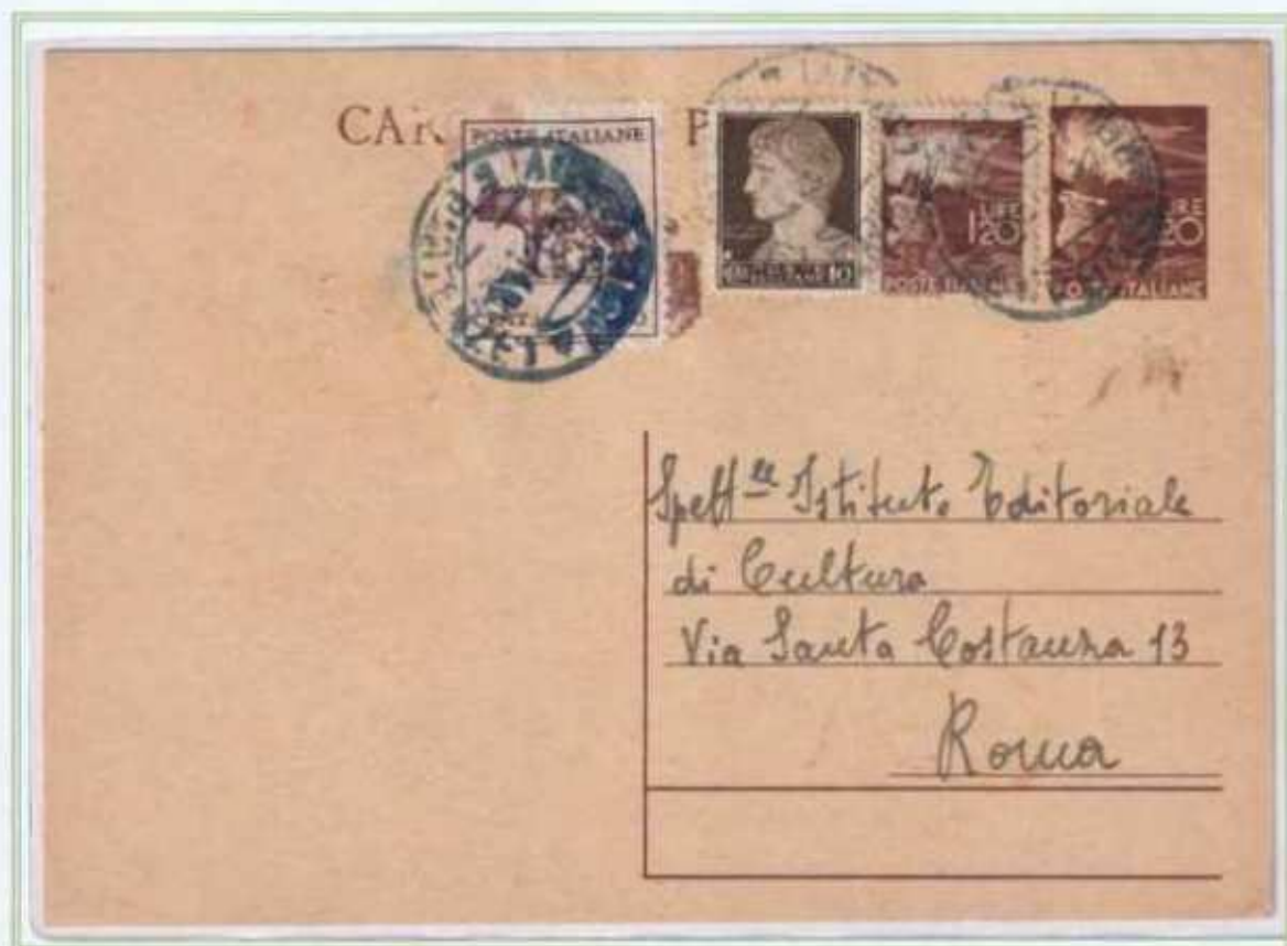
18/03/1946 - Cartolina postale tariffa 3 l. da Sora a Roma assolta integrando una cartolina postale democratica da 1,20 L. i valori imperiale e democratica sono insieme ad un valore della lupa capitolina.