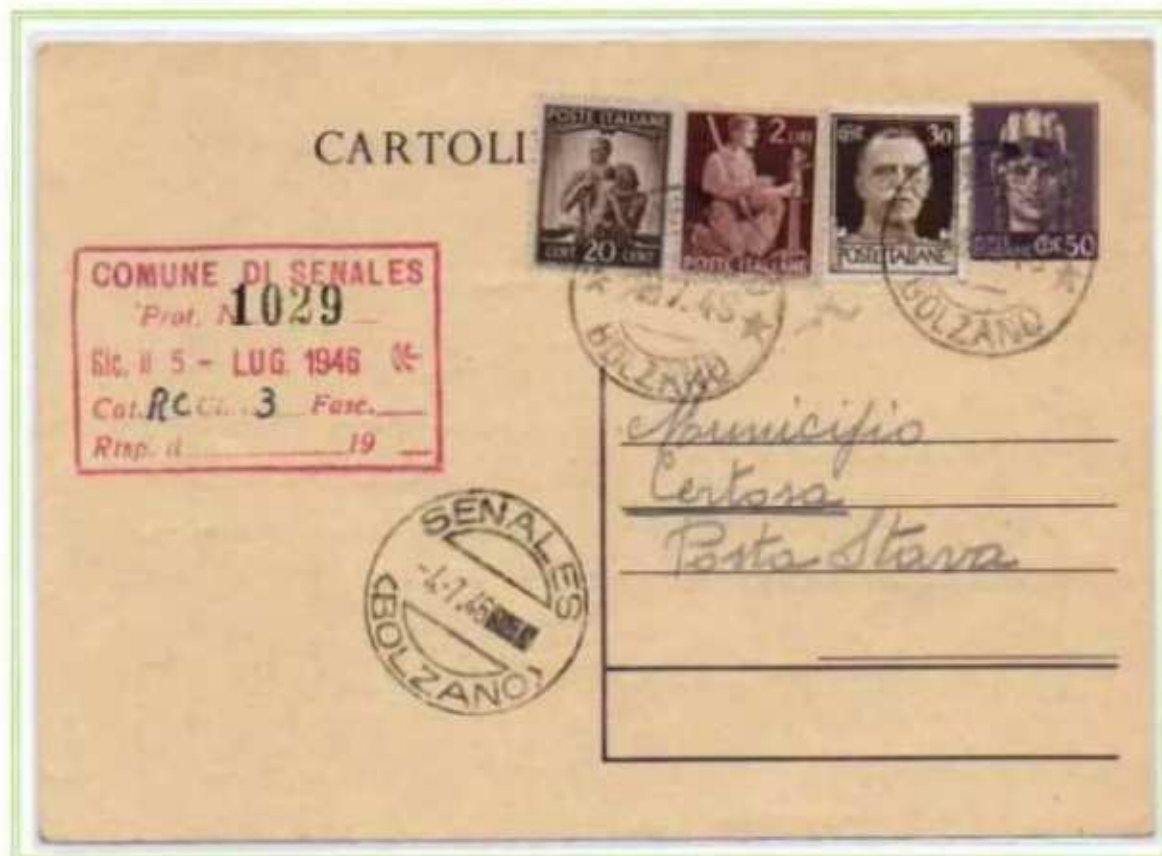
02/07/1946 - Cartolina postale tariffa 3 l. da Campodazzo a Senales assolta integrando una cartolina postale da 50 c. di luogotenenza. -