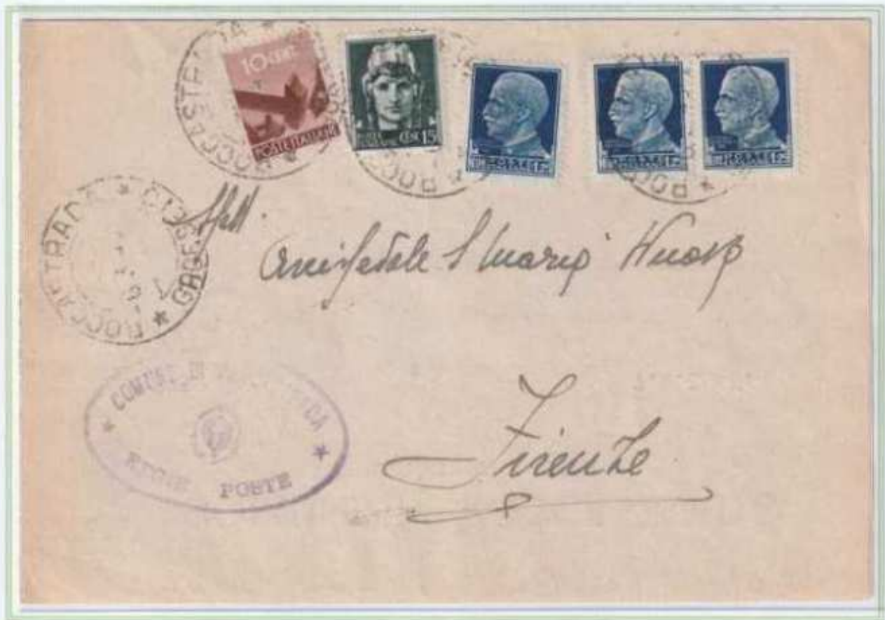
06/03/1946 - Lettera tariffa 4 L da Roccastrada a Firenze.