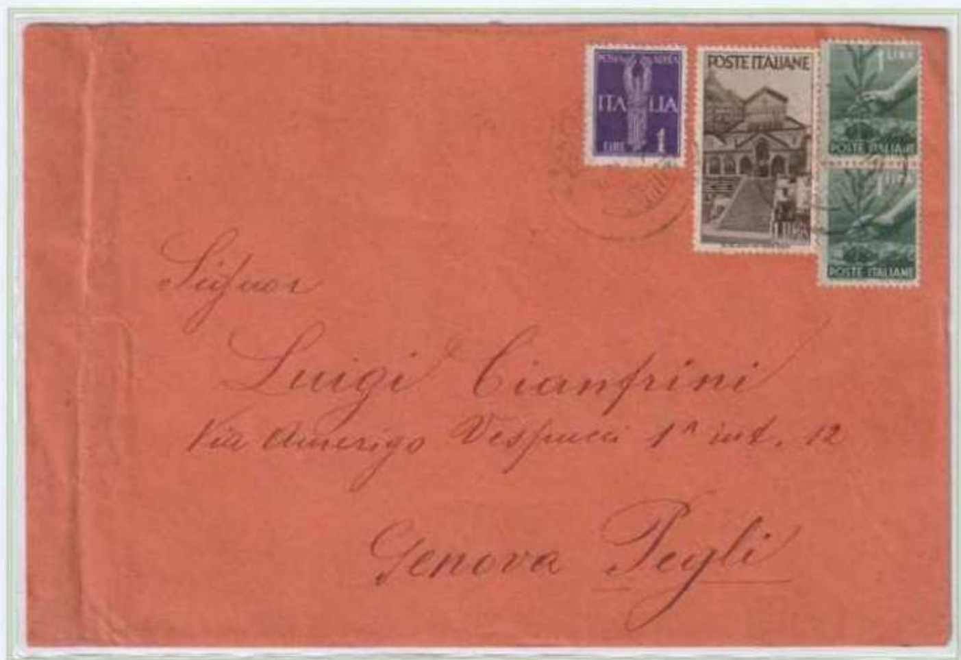
10/11/1946 - Lettera tariffa 4 L. da L'Aquila a Pegli affrancatura con tre diversi francobolli da 1 L.