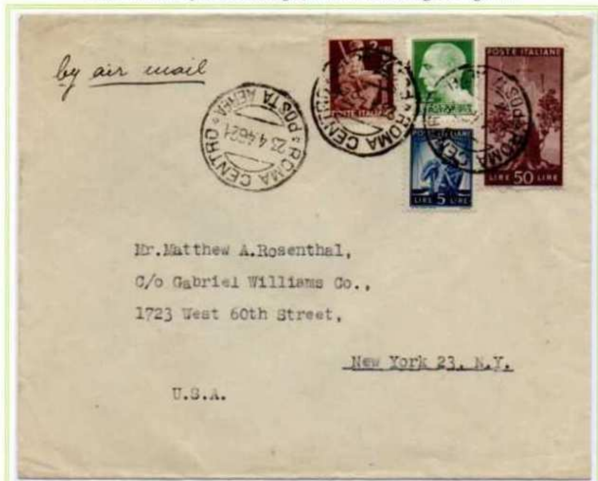
23/04/1946 - Lettera estero posta aerea 2 porti (fra 6 e 10 grammi) tariffa 77 l. (15 l. di lettera, 62 l. per 2 porti di posta aerea, 31 l. ogni 5 grammi) da Roma a New York (USA).