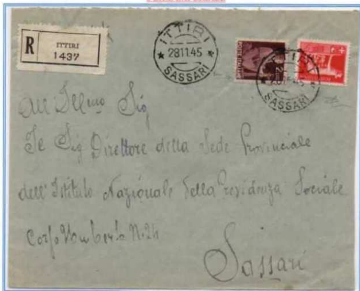
28/11/1945 - Lettera raccomandata tariffa 7 L. (2 L. di lettera e 5 L. di raccomandazione) da Ittiri a Sassari. Le buste affrancate con il 5 lire imperiale e i francobolli della serie democratica sono molto rare. (e)