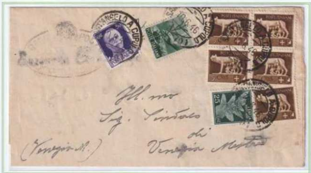
10/06/1946 - Lettera sindaci tariffa 2 l. da Santangelo a Cupolo a Mestre.