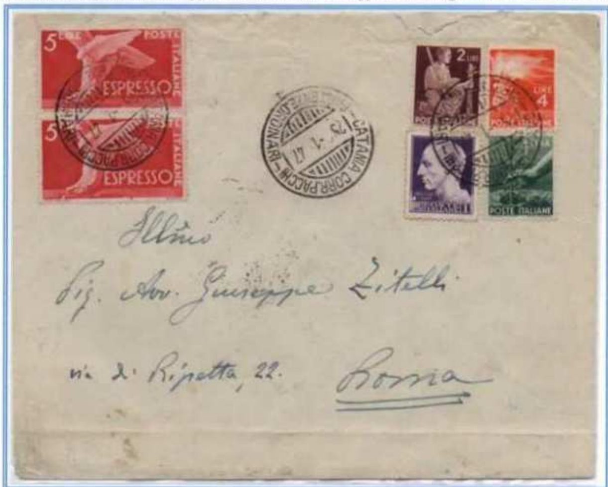
25/01/1947 - Lettera 2 porti espresso tariffa 18 l. (8 l. per i 2 porti di lettera e 10 l. di espresso) da Catania a Roma. Affrancatura con gemelli da 1 l. con il valore imperiale usato molto tardivamente e comunque tollerato.