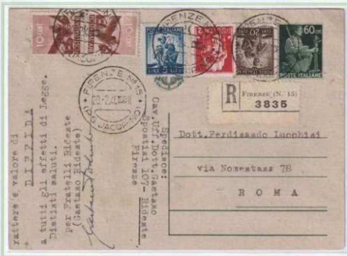
20/02/1946 - Cartolina postale raccomandata tariffa 8 l. (3 l. di cartolina postale e 5 l. di raccomandazione aperta) da Firenze a Roma assolta integrando una cartolina postale da 60 c. democratica.