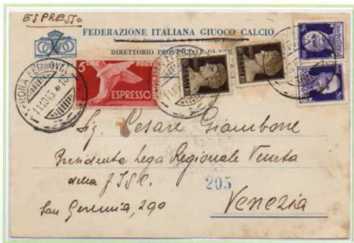
11/10/1945 - Cartolina postale espresso tariffa 6,20 l. (1,20 l. di cartolina postale e 5 l. di espresso) da Verona a Venezia, insieme ai valori imperiale e democratica completano l'affrancatura due valori di luogotenenza emissione di Novara.