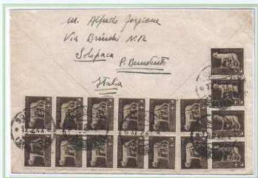
17/02/1947 - Lettera estero tariffa 15 L da Solopaca a Philadelphia (Stati Uniti). Affrancatura fronte/retro con francobolli democratica ed imperiale, questi ultimi fuori corso da oltre sette mesi.