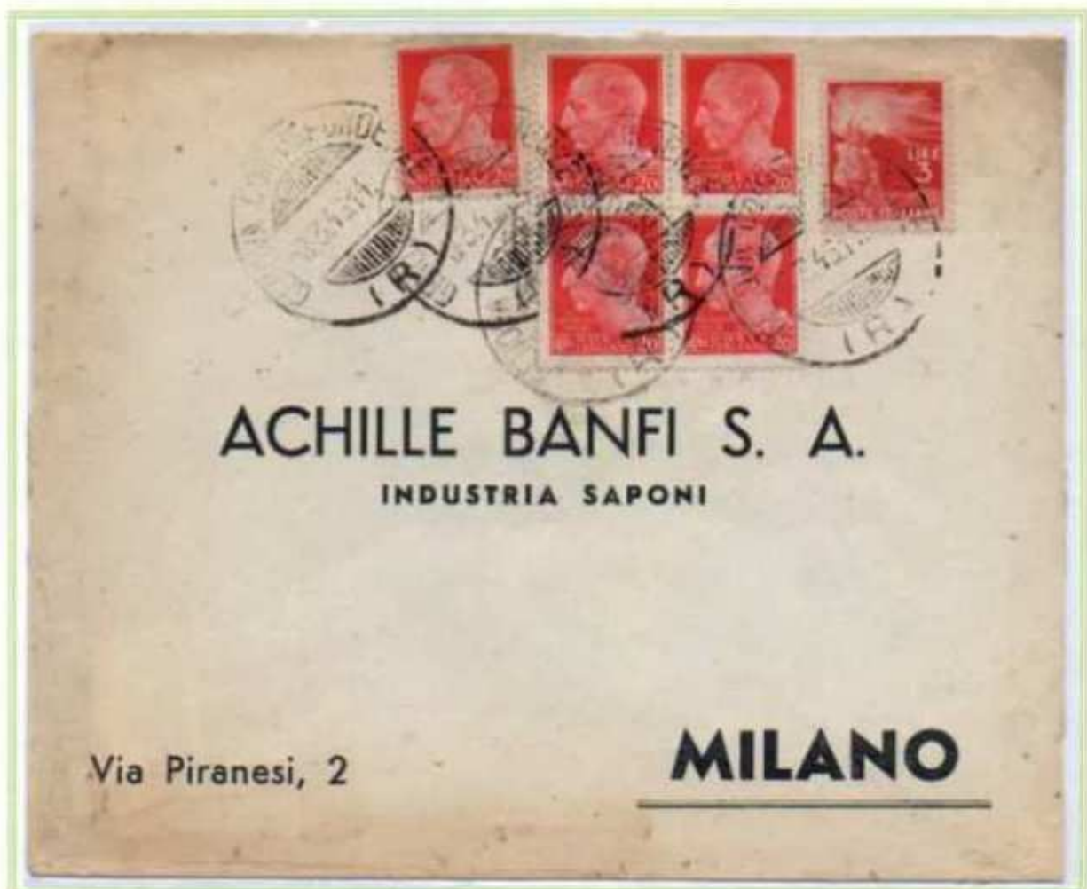
08/03/1946 - Lettera semplice tariffa 4 l. da Genova a Milano, al valore da 20 c. imperiale e democratica si affianca un altro valore da 20 c. della luogotenenza emissione di Novara.