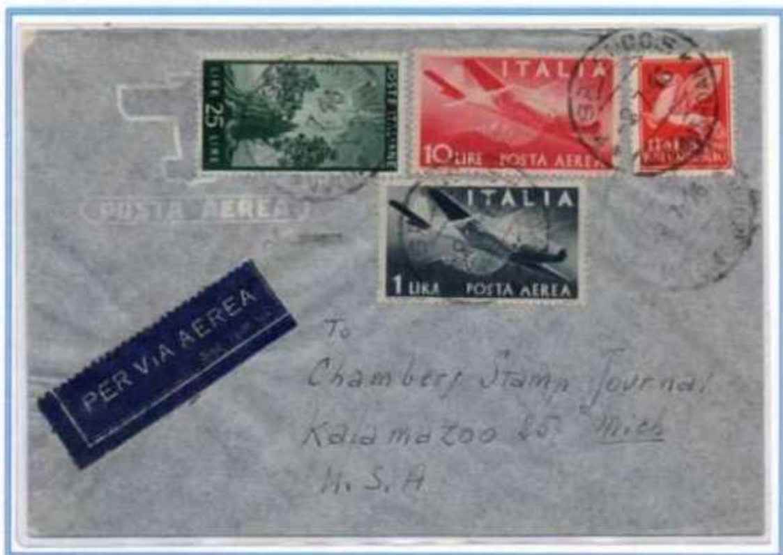
08/07/1946 - Lettera posta aerea, peso fino a 5 grammi, tariffa 36 l. (15 l. di lettera e 31 l. di un porto aereo) da Pisa a Kalamazoo (Stati Uniti). Affrancatura non comune con i gemelli di posta aerea. (e)