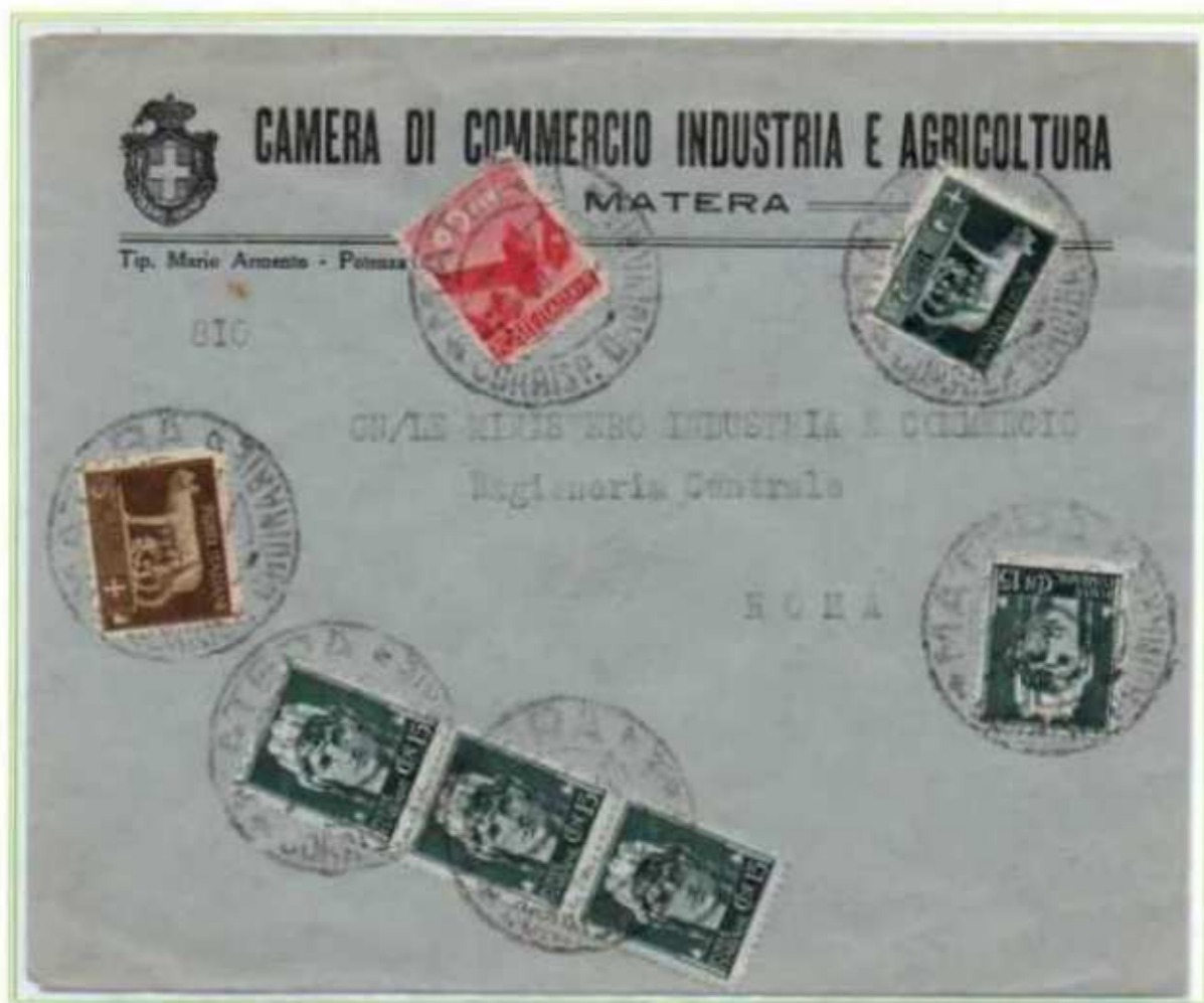
01/02/1946 - Lettera tariffa 4 L. da Matera a Roma, spedita nel primo giorno del cambio della tariffa di lettera che passò da 2 a 4 lire.