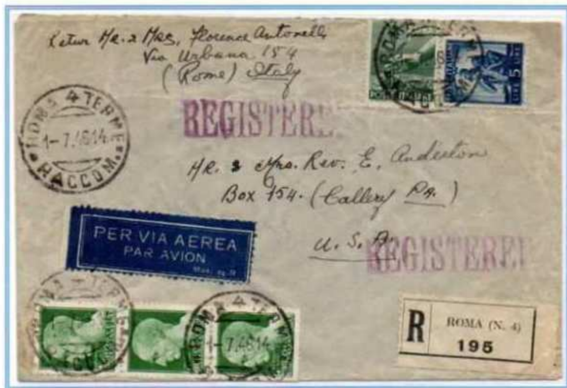
01/07/1946 - Lettera estero raccomandata posta aerea (fino a 5 grammi) tariffa 66 L. ((15 L. di lettera, 20 L. di raccomandazione e 31 L. per 1 porto di posta aerea) da Roma a Callery (USA).