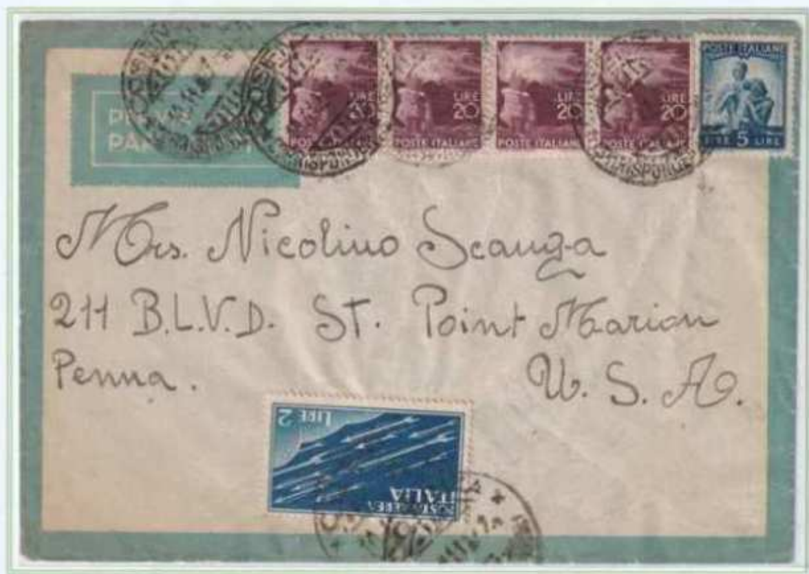
10/11/1947 - Lettera estero posta aerea (fino a 5 grammi) tariffa 87 l. ((30 l. di lettera e 57 l. per 1 porto di posta aerea) da Cosenza a Point Marion (Stati Uniti).