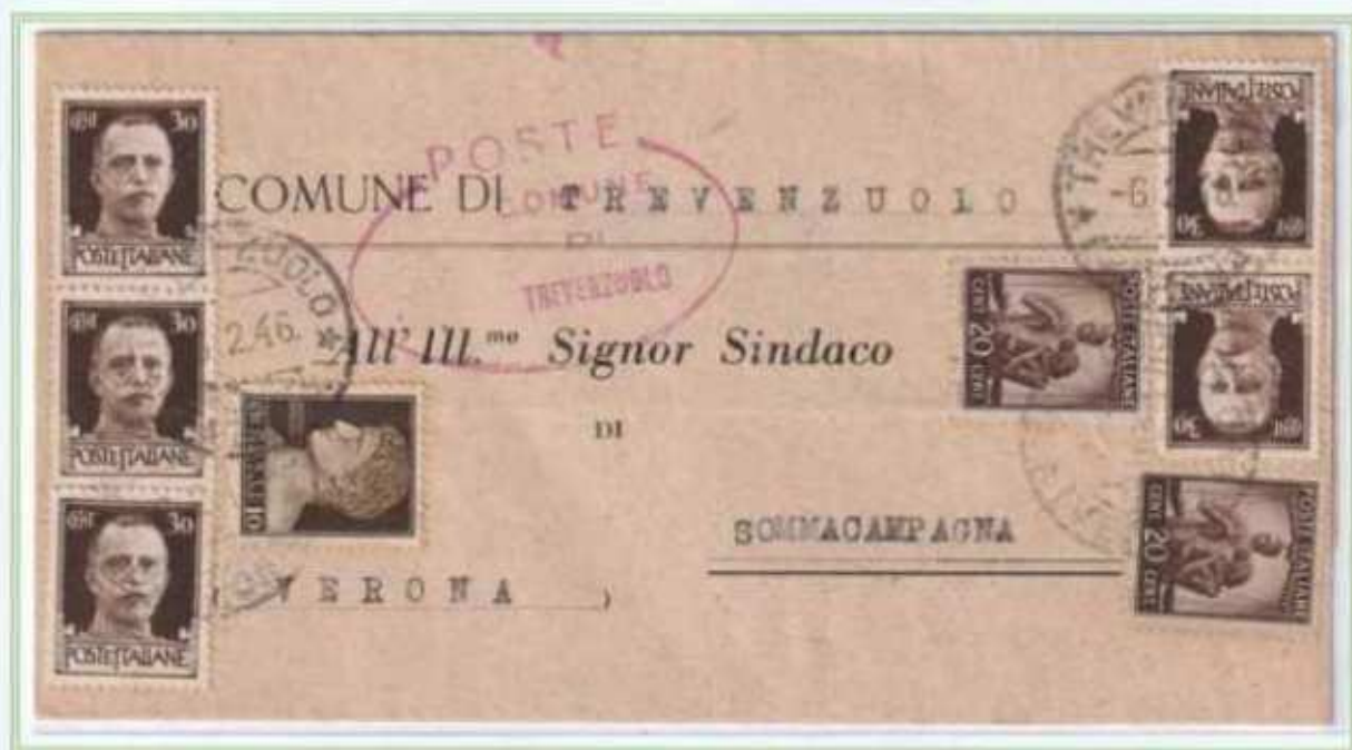
06/02/1946 - Lettera sindaci tariffa 2 l. da Trevenzuolo a Sommacampagna assolta con valori imperiale e democratica unitamente ad un valore luogotenenza emissione di Novara.