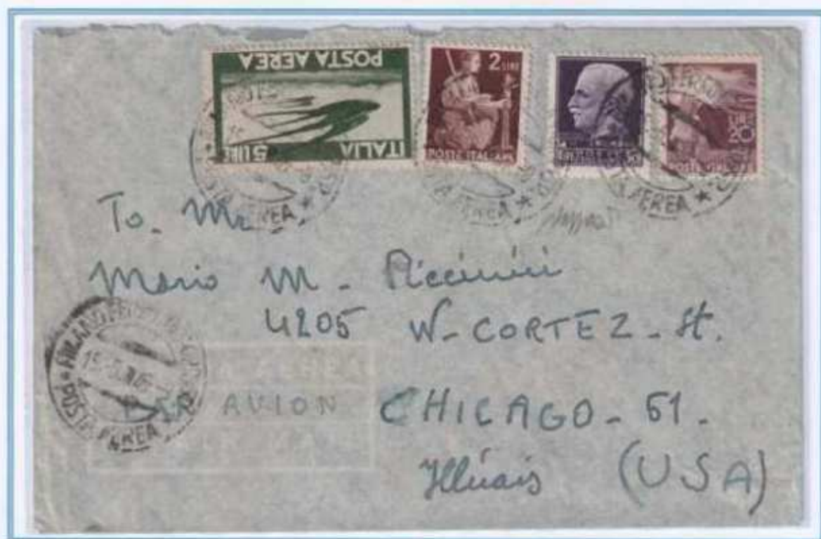
15/06/1946 - Lettera estero posta aerea 2 porti (da 6 a 10 grammi) tariffa 77 L. (15 L. di lettera, e 62 L. - 31 L. ogni 5 grammi - per i 2 porti posta aerea) da Milano a Chicago (Stati Uniti). Utilizzo dell'alto valore della serie imperiale in periodo di Repubblica.