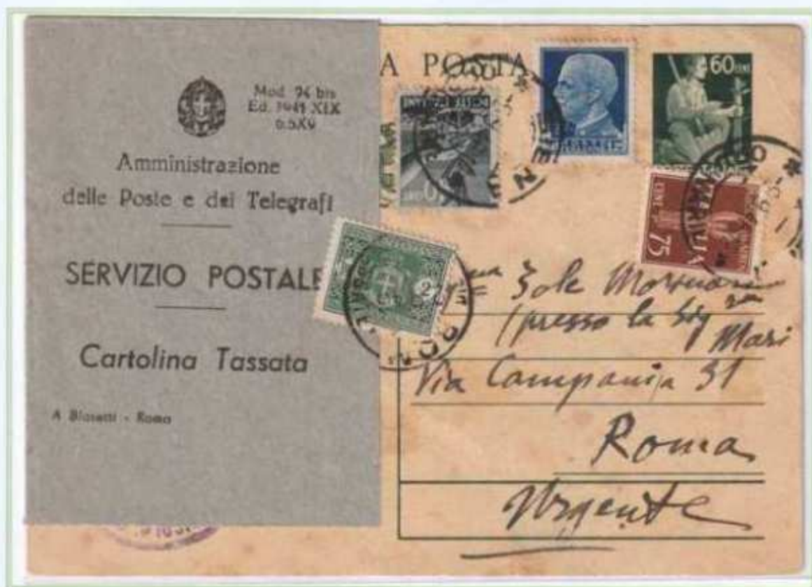
09/09/1946 - Cartolina postale tariffa 3 L. da Siena a Roma assolta integrando una cartolina postale da 60 c. democratica, in arrivo a Roma la cartolina fu tassata per 2 L. in quanto il valore imperiale era scaduto da due mesi.