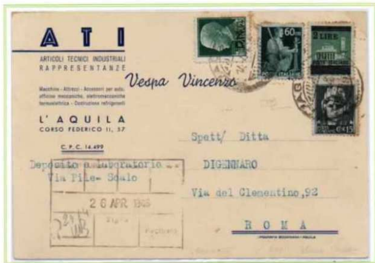
14/04/1946 - Cartolina postale tariffa 3 L. da L'Aquila a Roma, assolta con l'uso tardivo del sovrastampato P.M. tollerato insieme ad un valore di luogotenenza soprastampato e ai valori democratica e imperiale. (e)