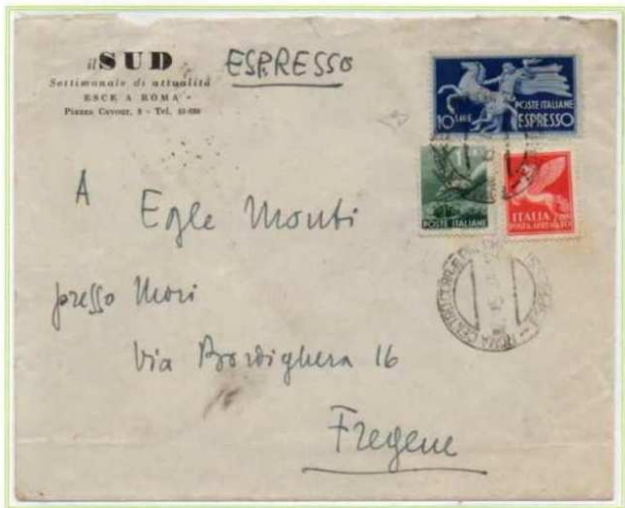
07/05/1947 - Lettera espresso tariffa 21 l. ((6 l. di lettera e 15 l. di espresso) da Roma a Fregene.