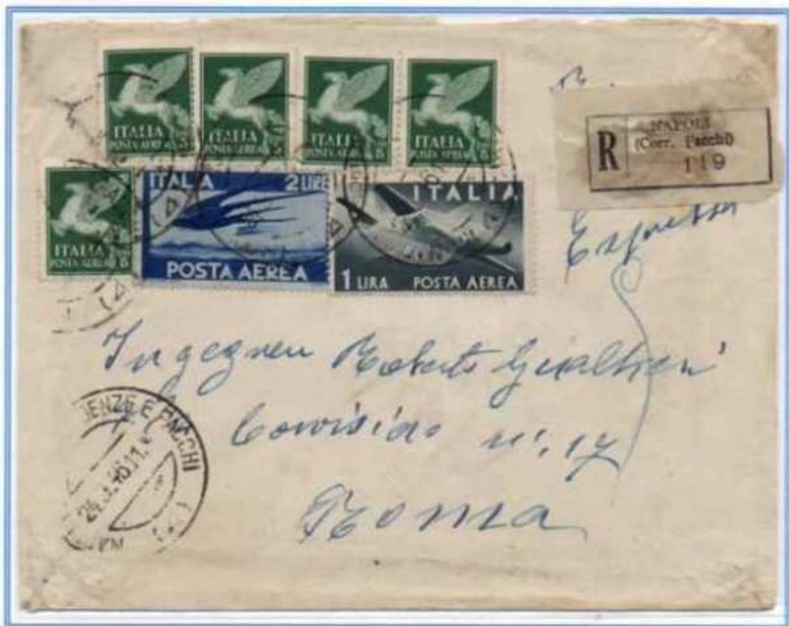
24/09/1946 - Lettera 2 porti raccomandata espresso tariffa 28 l. (8 l. di 2 porti di lettera, 10 l. di raccomandazione e 10 l. di espresso) da Napoli a Roma. Affrancatura con solo valori di posta aerea. (c)