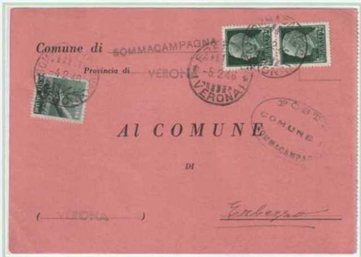
04/02/1946 - Cartolina postali sindaci tariffa 1,50 L da Sommacampagna a Erbezzo.