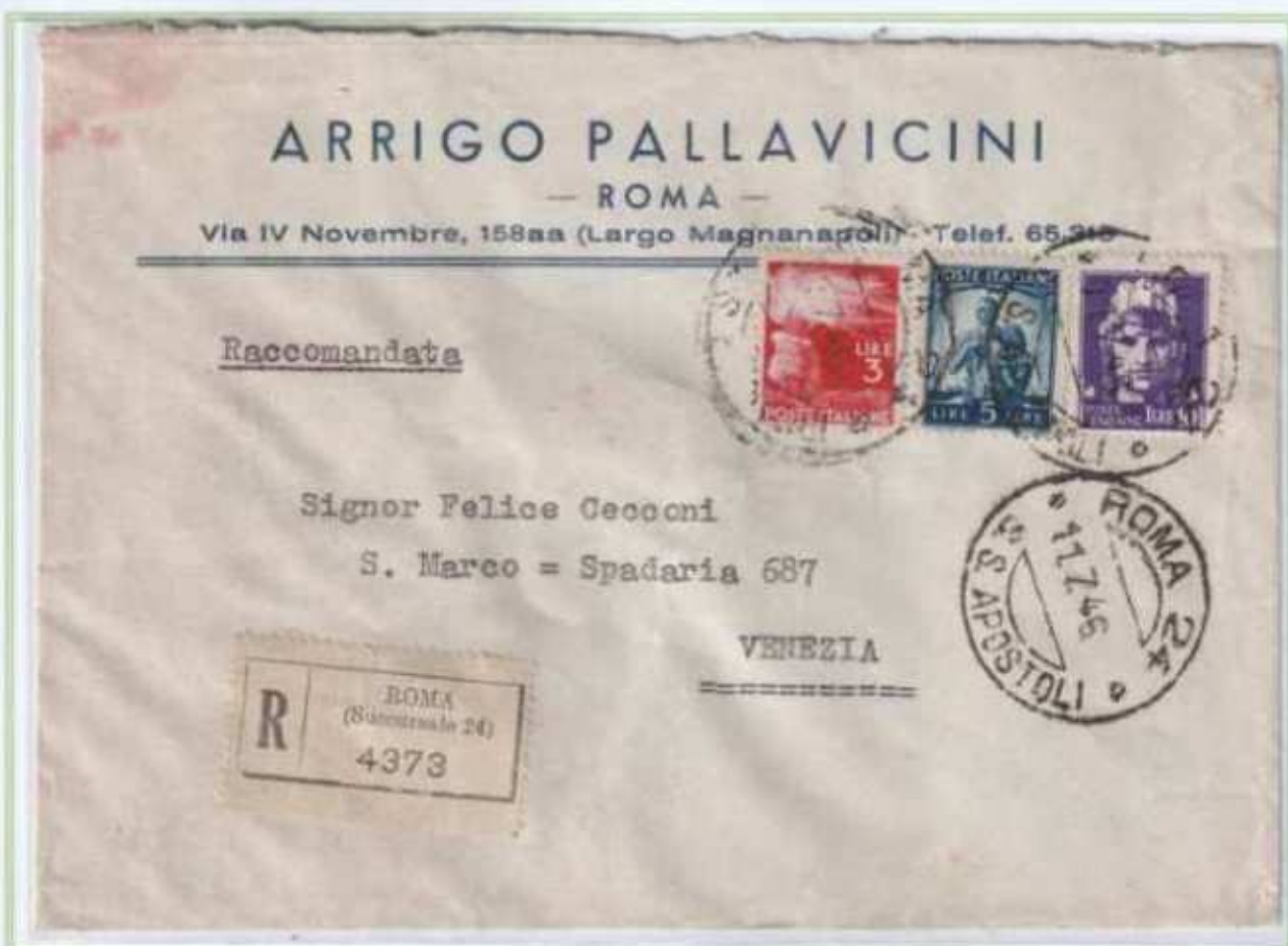
11/07/1946 - Lettera 2 porti raccomandata tariffa 18 L. (8 L. di 2 porti di lettera e 10 L. di raccomandazione) da Roma a Venezia.