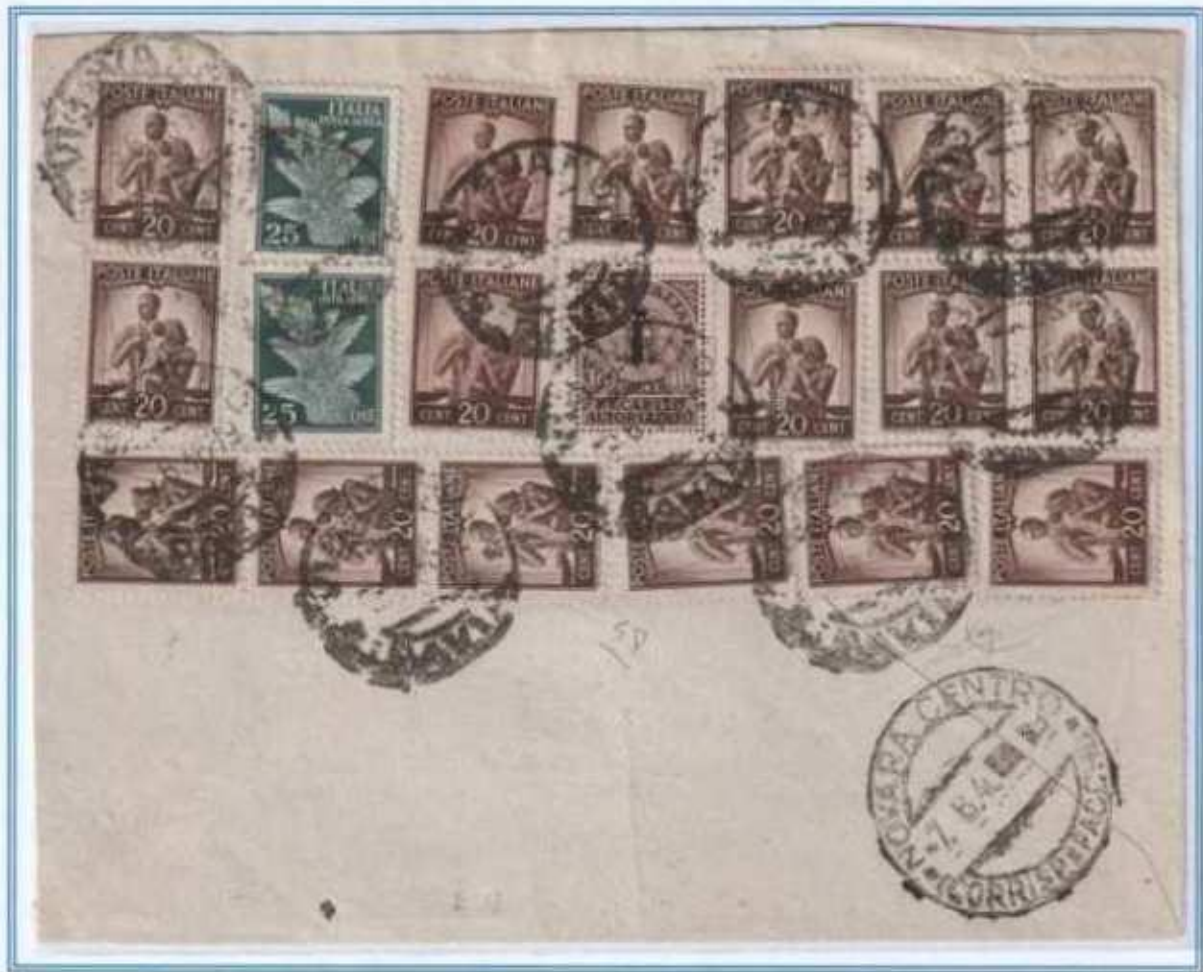
05/06/1946 - Lettera semplice tariffa 4 l. da Vigevano a Novara, per completare l'affrancatura insieme ai valori imperiale e democratica venne utilizzato come ordinario un francobollo per recapito autorizzato R.S.I. con fascetto soprastampato.