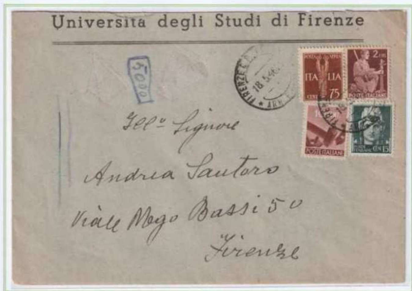
18/05/1946 - Lettera in distretto tariffa 3 L. da Firenze per città.