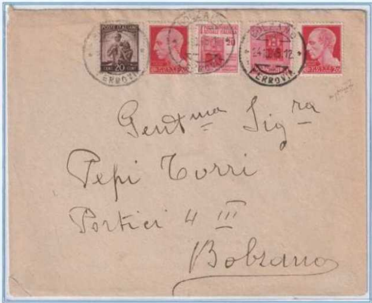
24/10/1946 - Lettera in distretto tariffa 1 L da Bolzano per città, i valori da 20 c. imperiale e democratica sono affiancati da altri tre valori da 20 c., due della R.S.I e uno della luogotenenza emissione di Roma. (e)