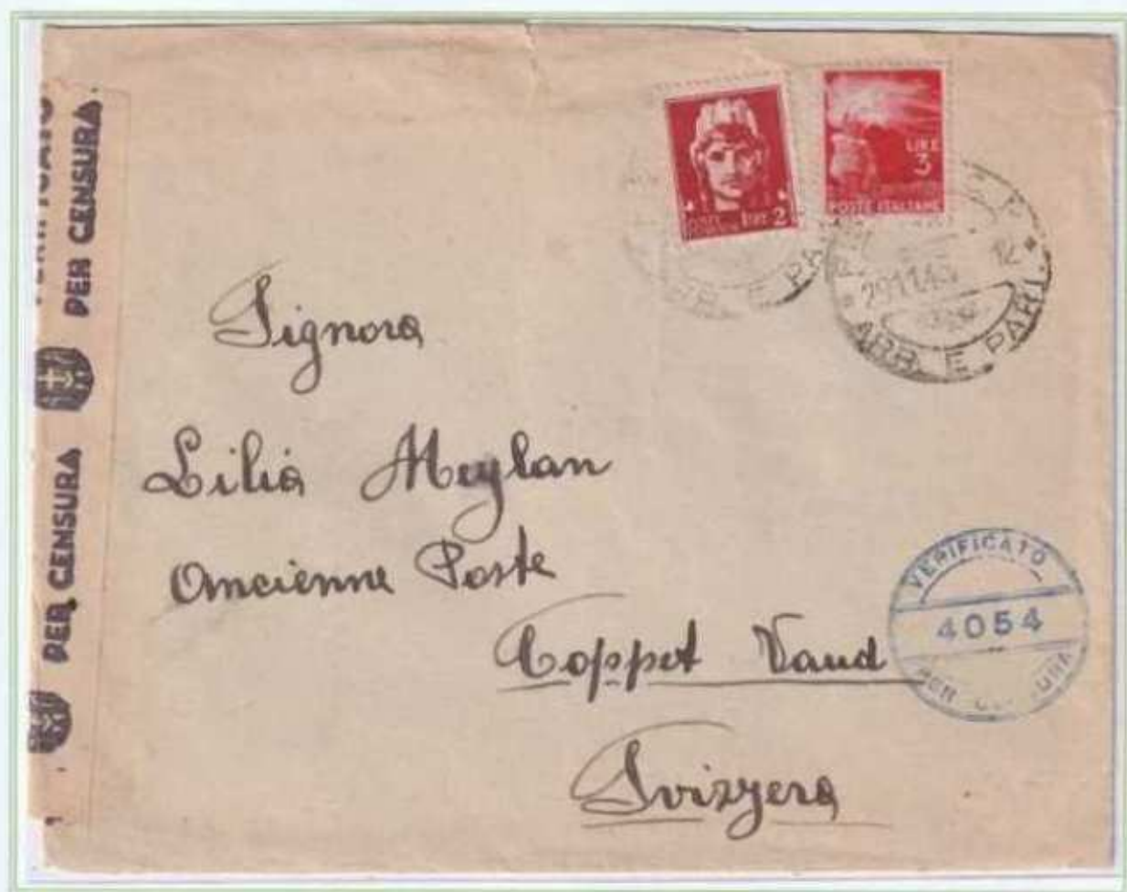
29/11/1945 - Lettera estero tariffa 5 L da Pistoia a Coppet Vaud (Svizzera) sottoposta a censura.