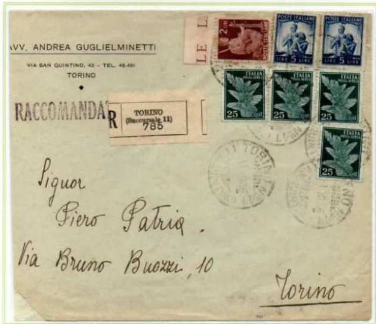
31/10/1946 - Lettera in distretto raccomandata tariffa 13 l. (3 l. di lettera e 10 l. di raccomandata) da Torino per città.