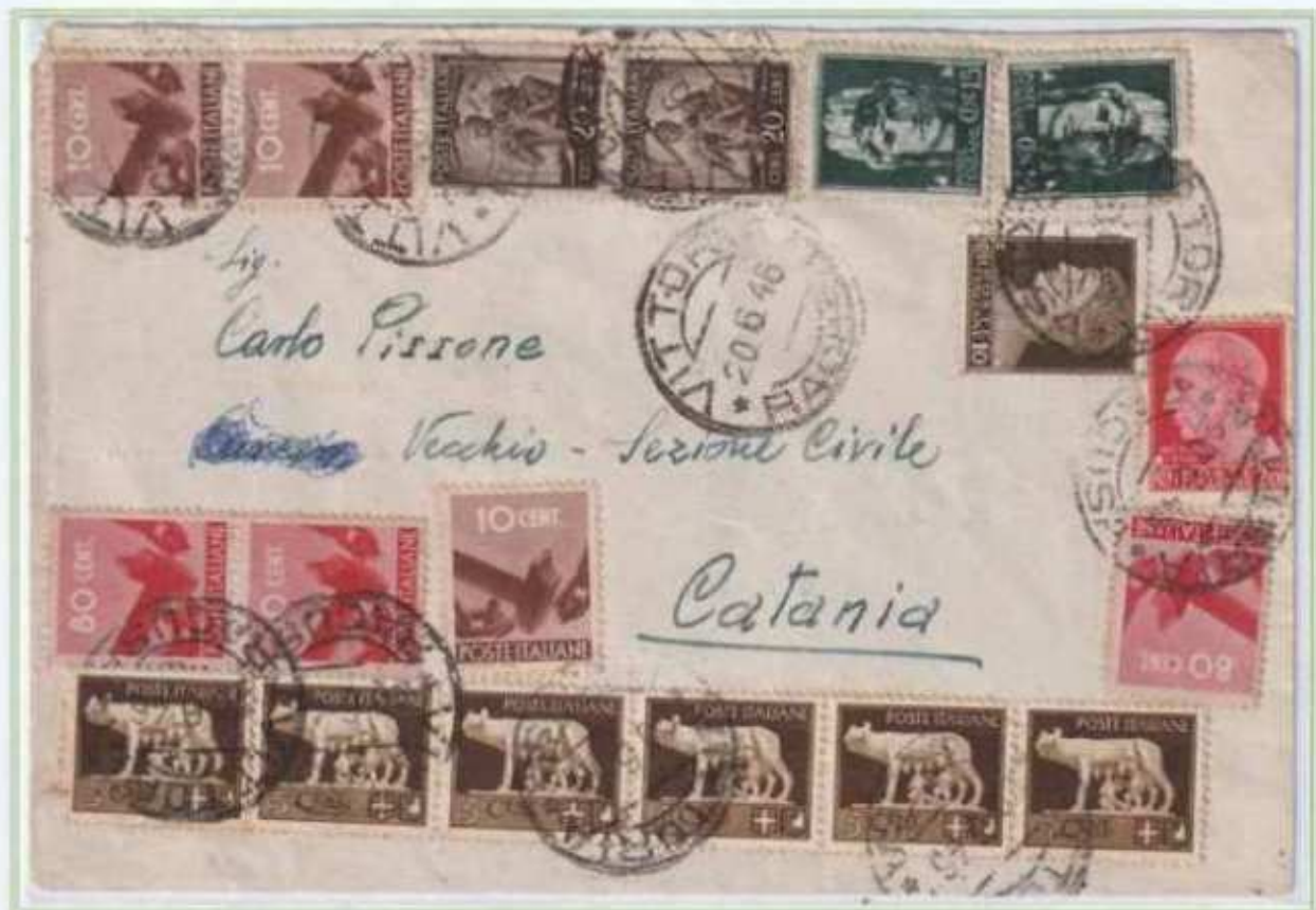
20/06/1946 - Lettera semplice tariffa 4 l. da Vittoria a Catania assolta con soli francobolli centesimali e con doppi gemelli.