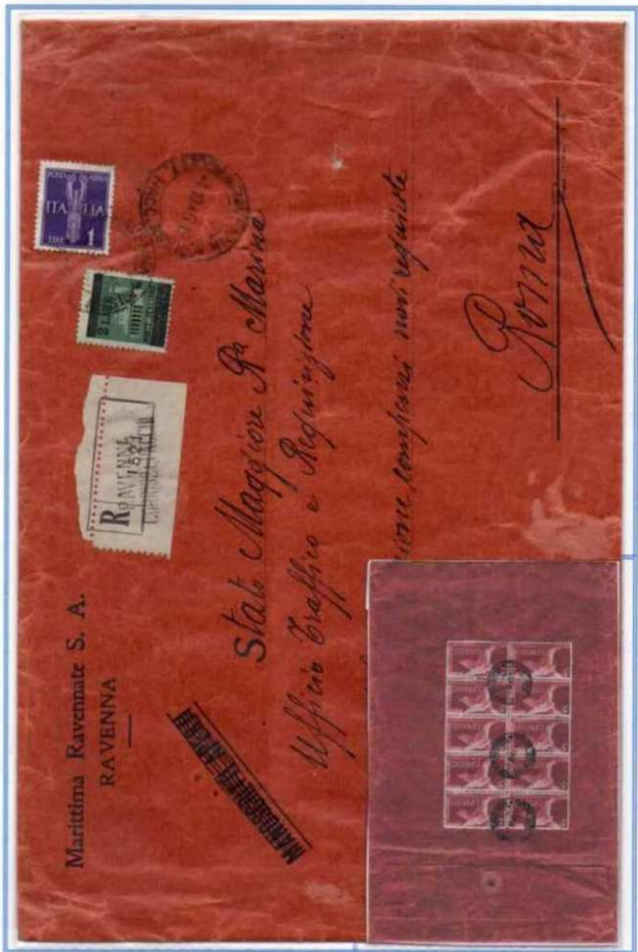
04/10/1945 - Lettera 24 porti raccomandata tariffa 53 L. (48 L. di 24 porti di lettera e 5 L. di raccomandazione) da Ravenna a Roma. L'affrancatura imperiale - democratica è integrata da un 2 L. soprastampato di luogotenenza. Uso del 5 L. espresso nel 4° giorno di emissione.