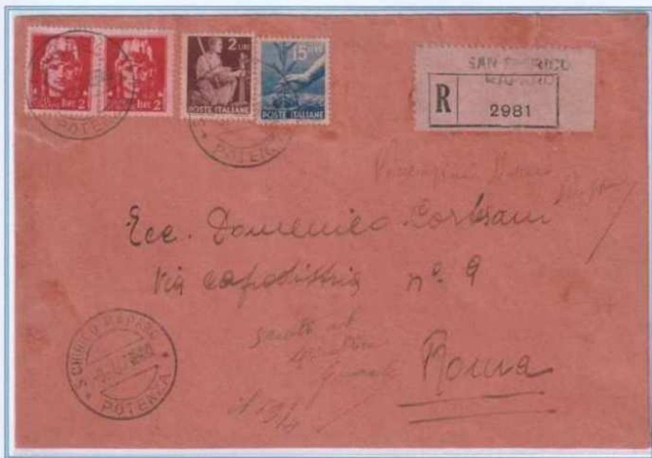
09/04/1947 - Lettera raccomandata tariffa 21 L (6 L di lettera e 15 L di raccomandazione) da S. Chirico Raparo a Roma. Affrancatura gemellare con uso fuori corso e non tassati dei valori imperiale, questo rese possibile il non comune abbinamento con il 15 L democratica emesso il 3 luglio 1946.