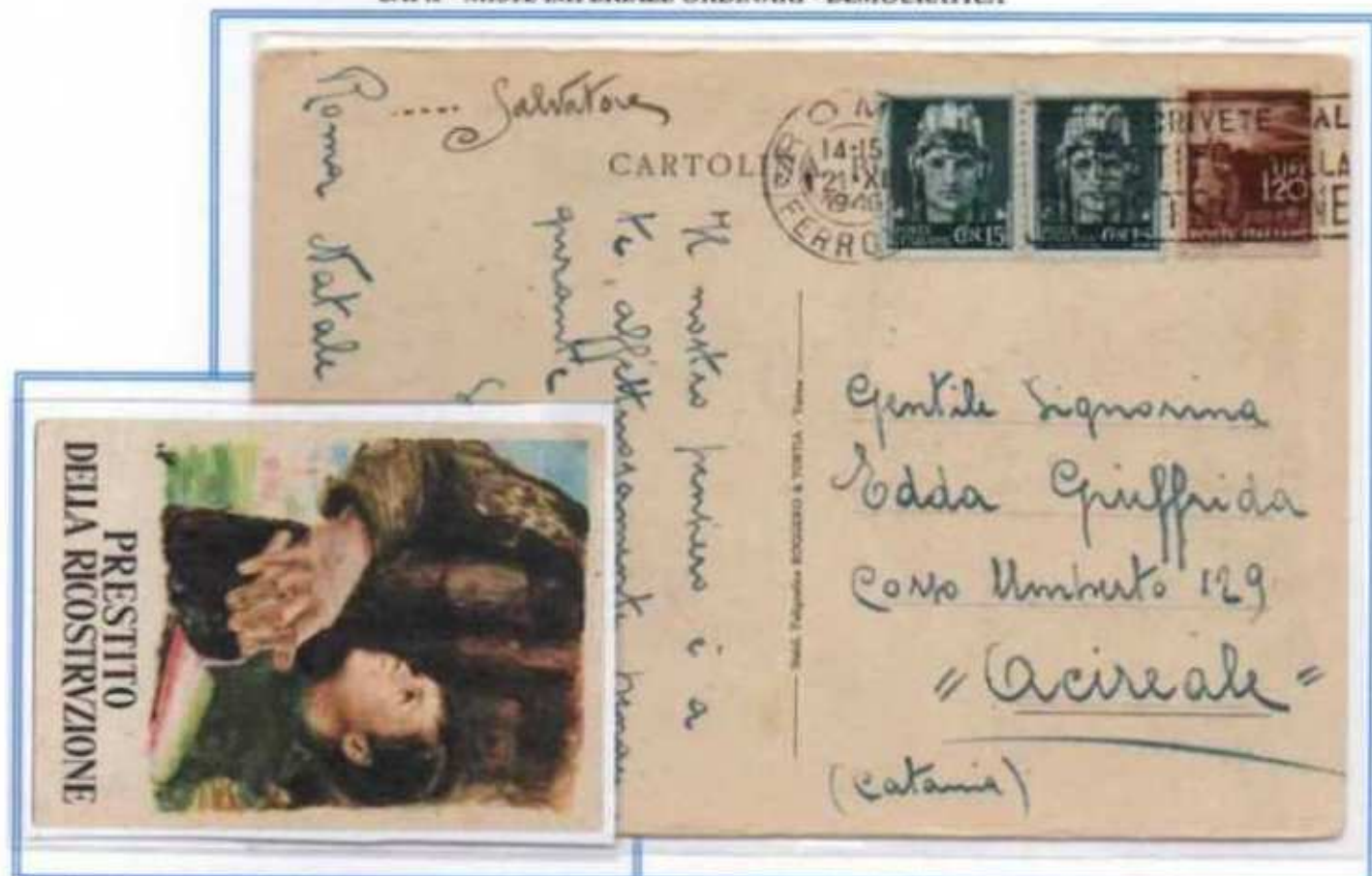
21/12/1946 - Cartolina postale tariffa ridotta "Prestito della Ricostruzione" tariffa 1,50 l. da Roma ad Acireale assolta con una coppia del 15 c. imperiale e un 1,20 l. democratica. I valori imperiale erano fuori corso da sei mesi ma come spesso accadeva furono tollerati.