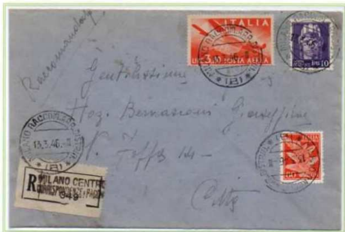
13/03/1946 - Lettera in distretto raccomandata tariffa 13 L (3 L di lettera in distretto e 10 L di raccomandazione) da Milano per città affrancata in eccesso di 1 L. Il 10 L luogotenenza di Novara ebbe una vita postale molto breve infatti fu emesso agli inizi di marzo e andò fuori corso il 18 luglio.