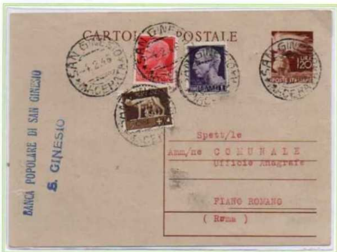
04/02/1946 - Cartolina postale tariffa 3 l. da San Ginesio a Fiano Romano, assolta integrando una CP da 1,20 l. democratica con due francobolli imperiale con fasci e un valore di luogotenenza emissione di Roma.