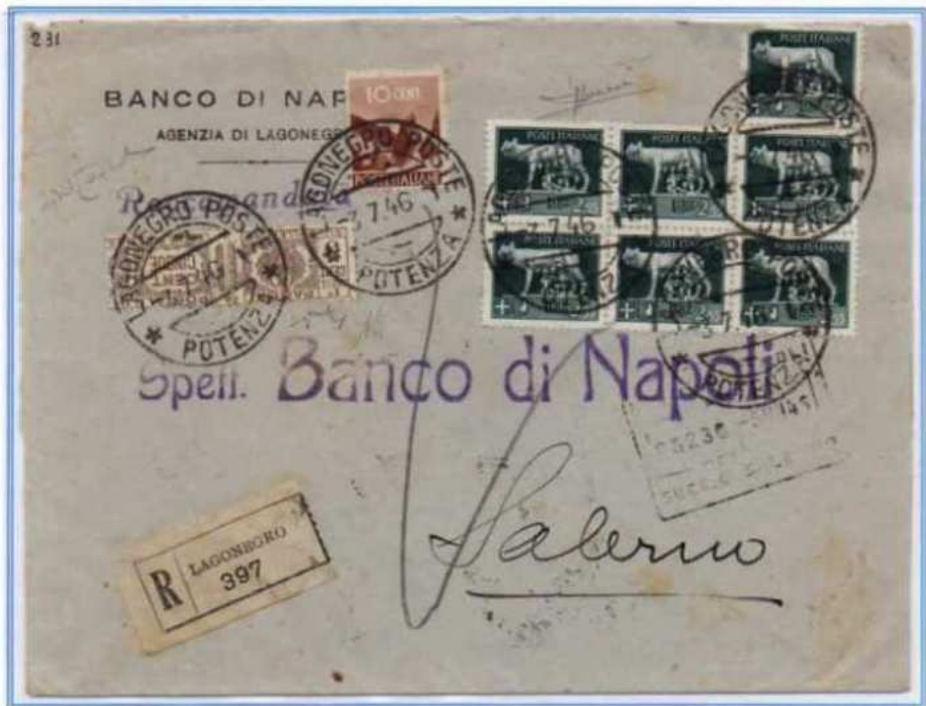
03/07/1946 - Lettera 2 porti raccomandata tariffa 18 l. (8 l. di 2 porti di lettera e 10 l. di raccomandazione) da Lagonero a Salerno. (e)