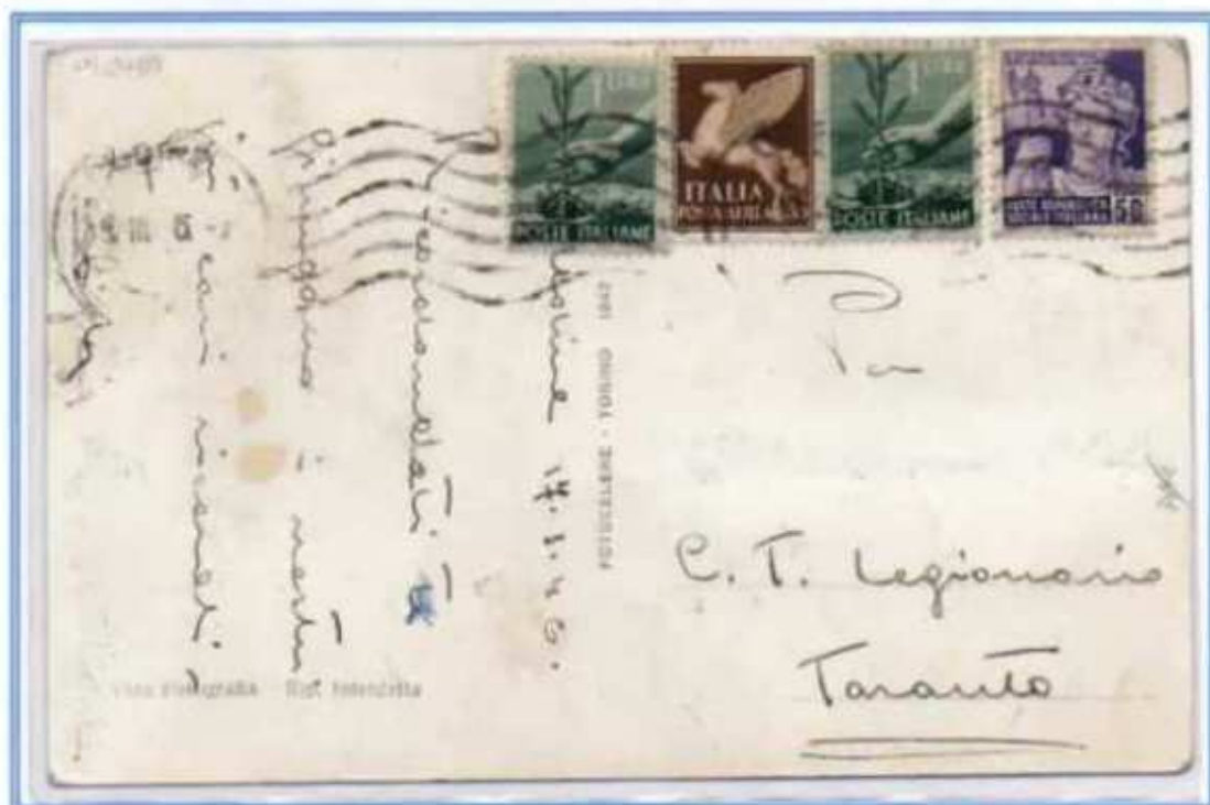
19/03/1946 - Cartolina postale tariffa 3 l. da Udine a Taranto, affrancatura mista con valori di tre diversi periodi storici.