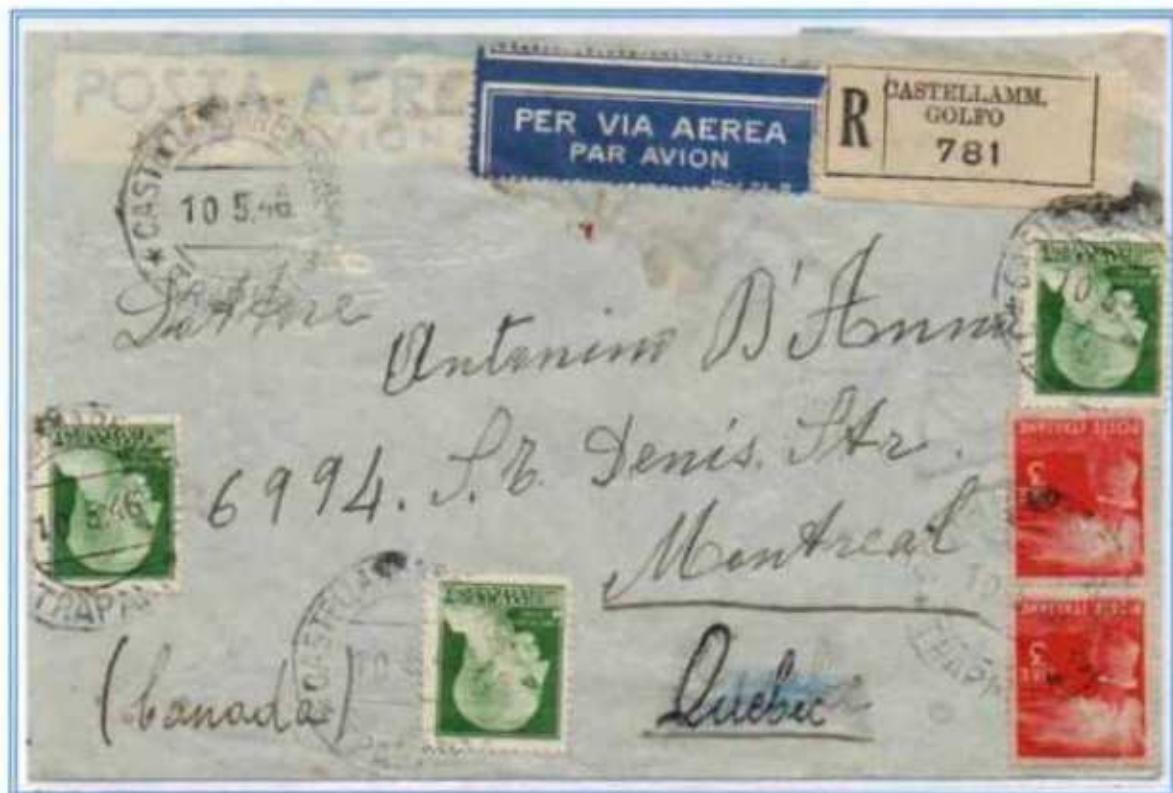
10/05/1946 - Lettera estero raccomandata posta aerea (fino a 5 grammi) tariffa 66 L. ((15 L. di lettera, 20 L. di raccomandazione e 31 L. per 1 porto di posta aerea) da Castellammare del Golfo a Quebec (Canada).