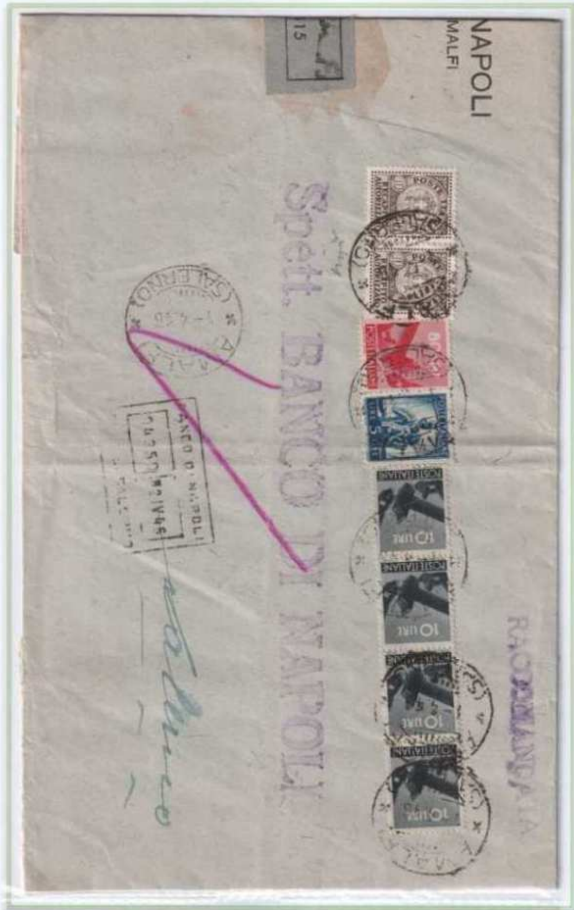
01/04/1946 - Lettera 9 porti raccomandata tariffa 46 l. (36 l. di 9 porti di lettera e 10 l. di raccomandazione) da Amalfi a Salerno. I due valori del recapito autorizzato sono utilizzati come ordinari.