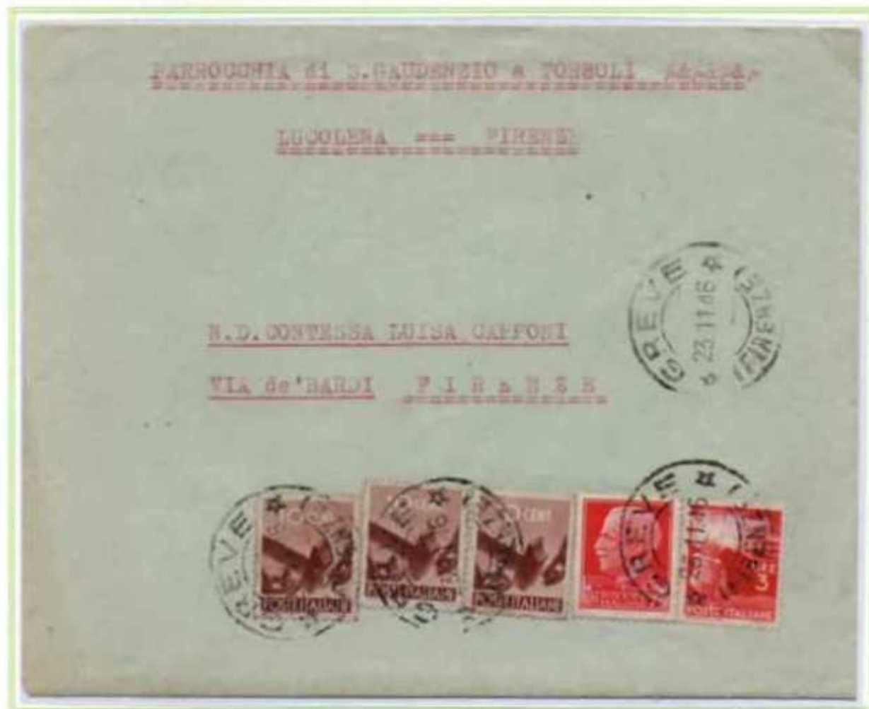
23/11/1946 - Lettera semplice tariffa 4 l. da Greve a Firenze, affrancata in eccesso di 5 c..