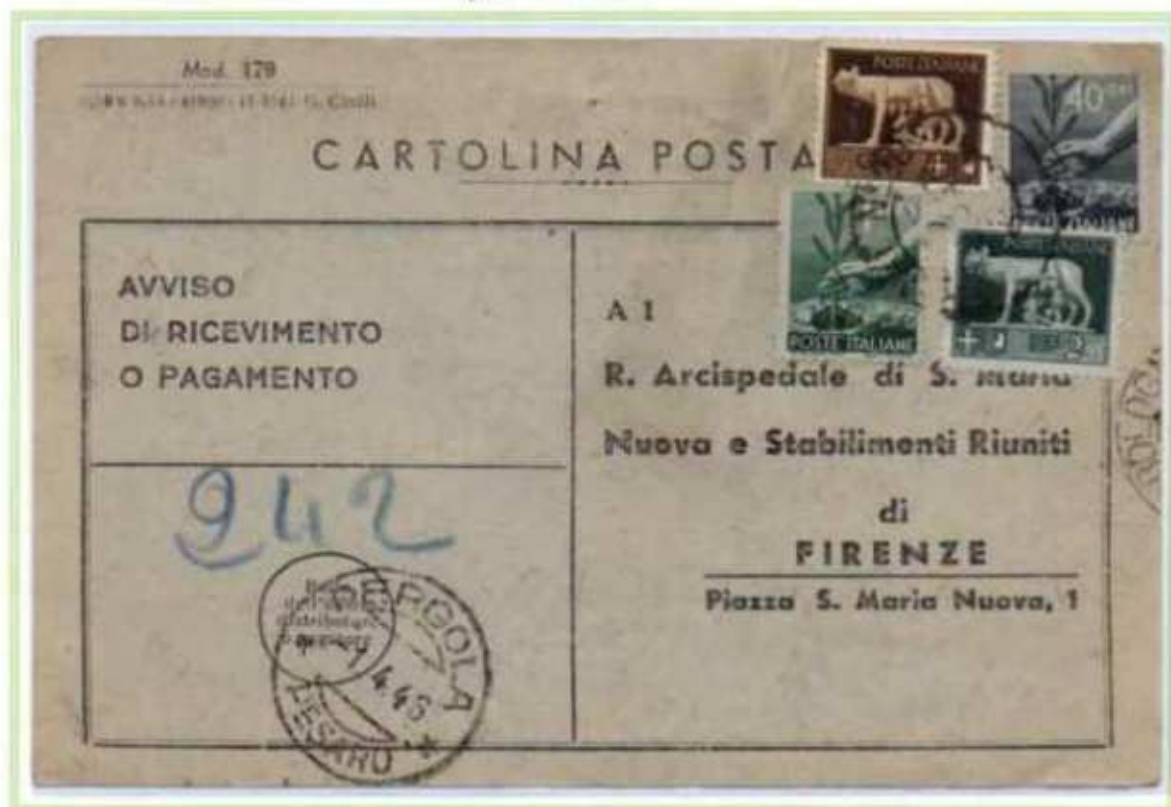
29/03/1946 - Avviso di ricevimento Mod. 179 tariffa 4 L. da Firenze a Pergola.