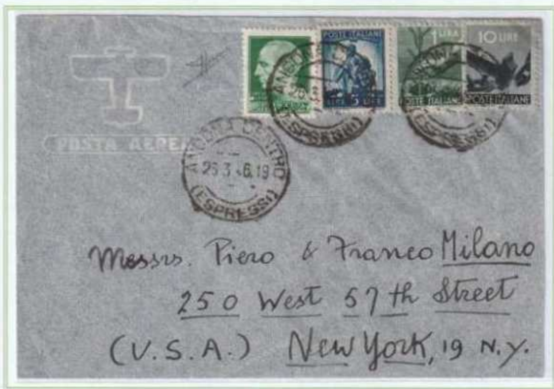
26/03/1946 - Lettera estero posta aerea fino a 5 gr tariffa 36 L. (5 L. di lettera e 31 L. per un porto di posta aerea) da Ancona a New York (USA).