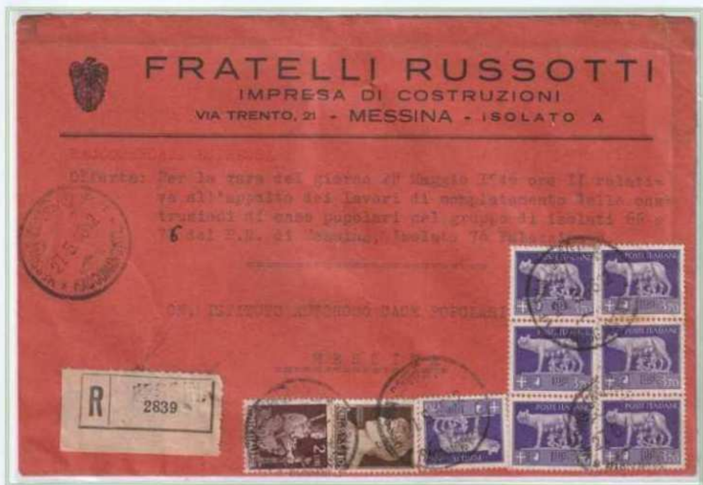
27/05/1946 - Lettera 2 porti raccomandata espresso tariffa 28 L. (8 L. di 2 porti di lettera, 10 L. raccomandazione e 10 L. di espresso) da Messina per città.