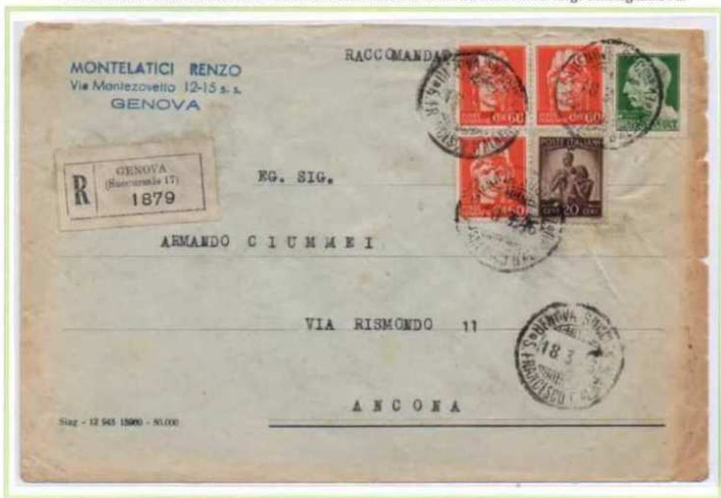
18/03/1946 - Lettera 3 porti raccomandata tariffa 22 l. ((12 l. di 3 porti di lettera e 10 l. di raccomandazione) da Genova a Ancona. Oltre al valore imperiale e democratica sono presenti tre valori del 60 c. luogotenenza emissione di Novara