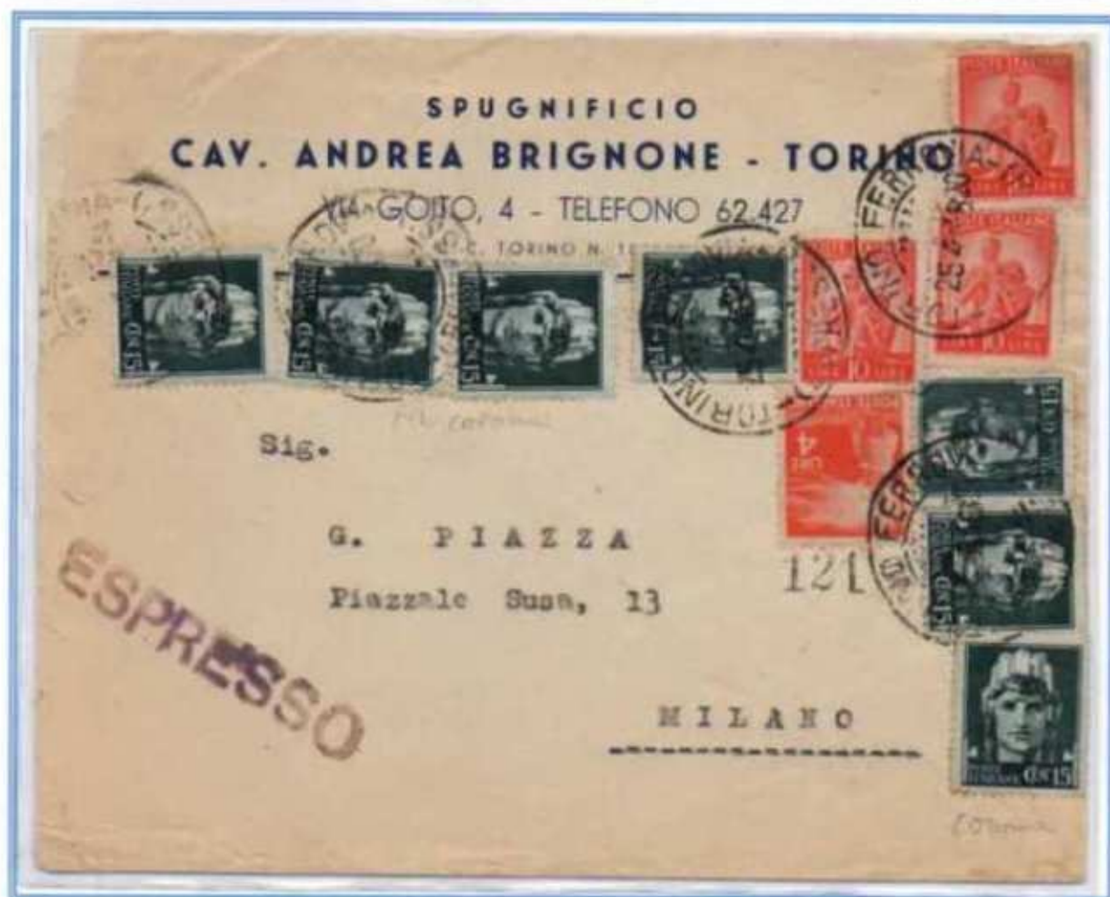
25/04/1948 - Lettera Espresso tariffa 35 l. da Torino a Milano assolta con sette valori del 15 c. imperiale, un 4 l. e tre valori del 10 l. arancio democratica. I valori imperiale erano fuori corso da quasi due anni ma tollerati e resero possibile una combinazione mista con il 10 l. arancio teoricamente impossibile.