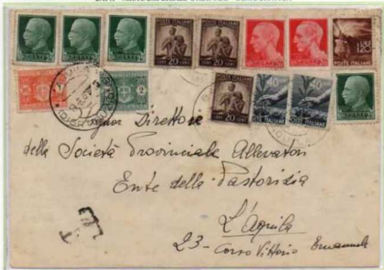
19/08/1946 - Lettera semplice tariffa 4 l. da Barisciano a L'Aquila. I valori imperiale e di luogotenenza non furono annullati in partenza ed in arrivo a L'Aquila la lettera fu tassata per 3 l. (il doppio dell'importo mancante). Affrancatura con tre valori del 20 c. diversi democratica, luogotenenza emissione di Roma e luogotenenza emissione di Novara.