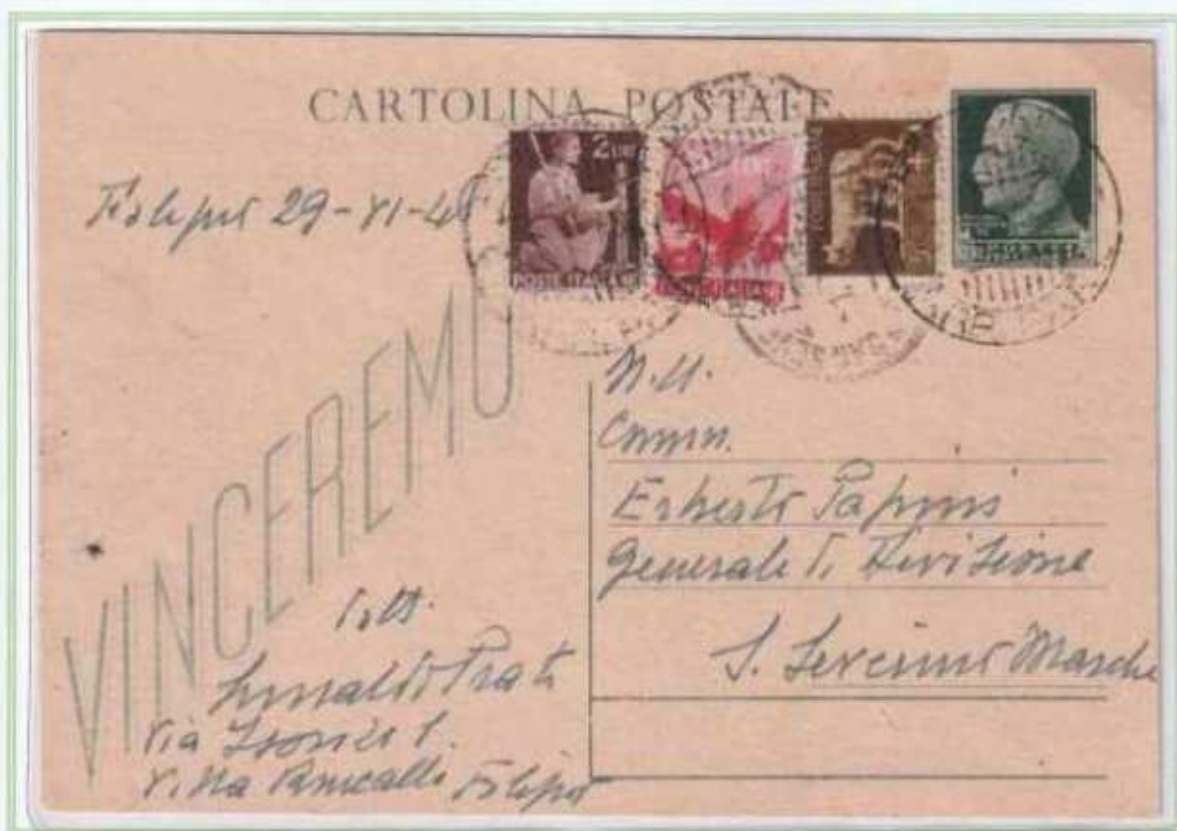
30/06/1946 - Cartolina postale tariffa 3 L. da Foligno a S. Severino Marche assolta integrando una cartolina postale del regno da 15 centesimi nell'ultimo giorno di validità postale.