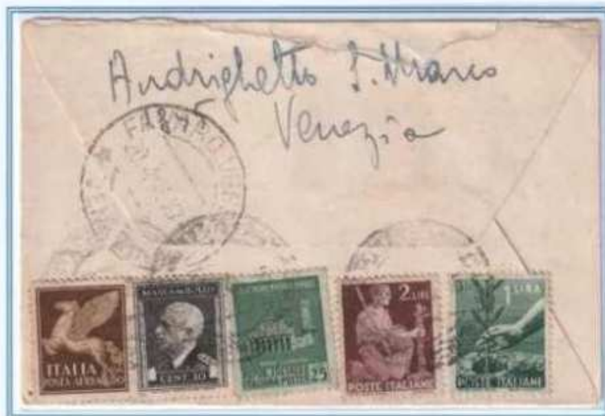
19/04/1946 - Lettera semplice tariffa 4 L. da Venezia a Favaro Veneto. Oltre ai valori imperiale e democratica concorrono ad assolvere la tariffa un valore R.S.I. ed una marca da bollo usata impropriamente. Il tutto tollerato e la lettera non venne tassata.