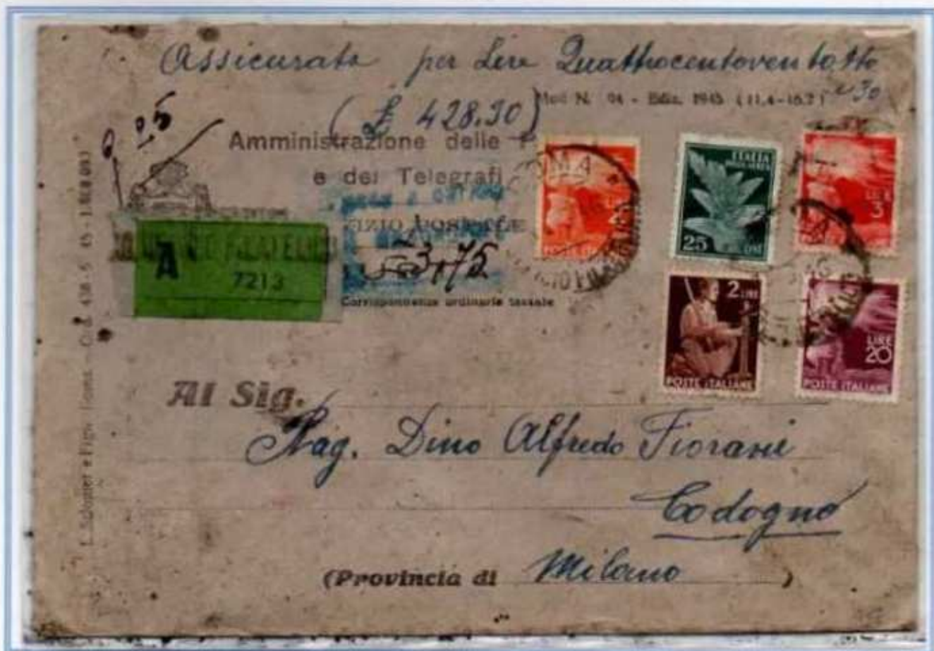
18/08/1946 - Lettera 2 porti assicurata 4 porti tariffa 33 l. (8 l. di 2 porti di lettera, 10 l. di raccomandazione, 6 l. per le prime 200 l. di assicurazione, 9 l. per le restanti 300 l. di assicurazione - 3 l. ogni 100 l. oltre le prime 200 l.) da Roma a Codogno. La lettera venne affrancata per 29,25 l. le restanti 3,75 l. furono assolte come tassa a carico del destinatario-