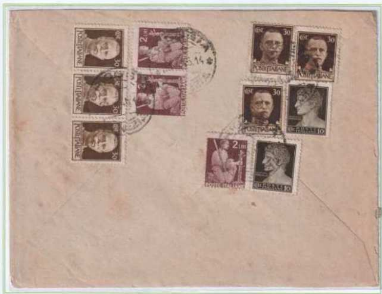
23/03/1946 - Lettera 2 porti tariffa 8 L. da Chioggia a Venezia assolta con valori imperiale e democratica unitamente ai valori luogotenenziali emessi a Roma e Novara. L'uso del 30 c. emissione di Roma nel Veneto è inusuale e sporadico.