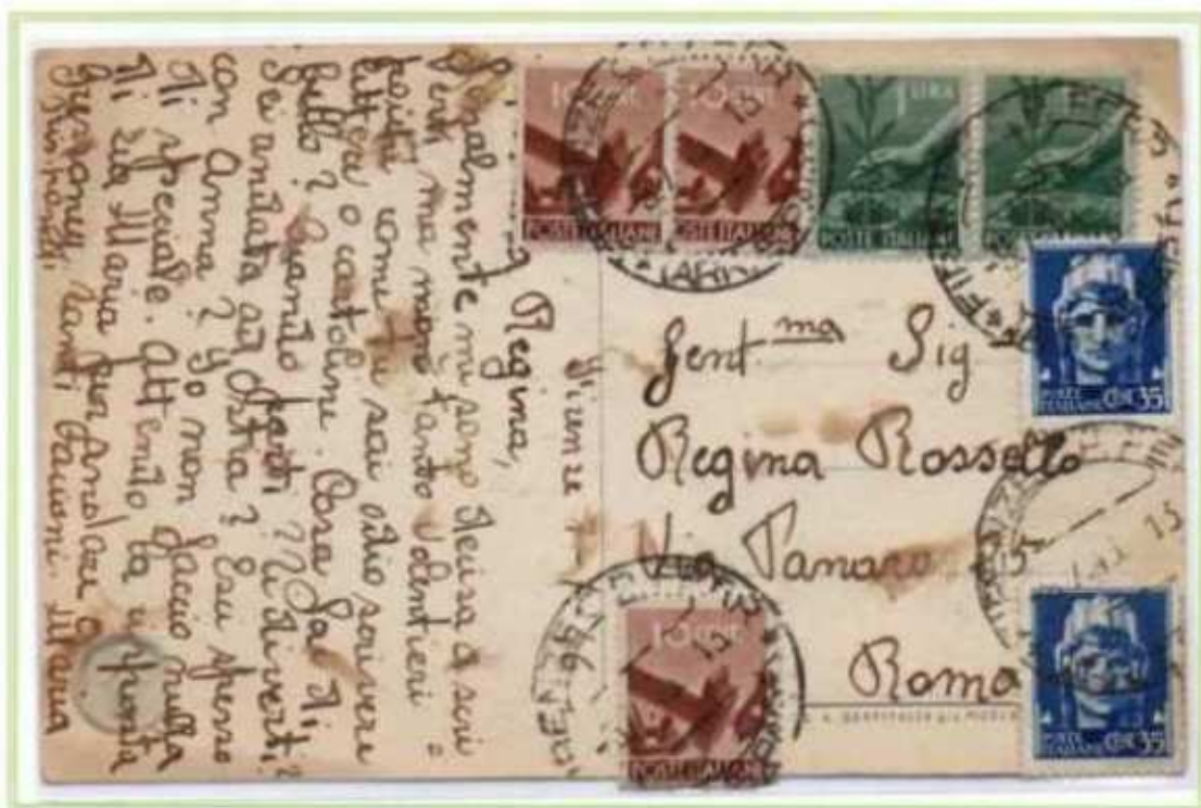
08/07/1946 - Cartolina postale tariffa 3 l. da Firenze a Roma