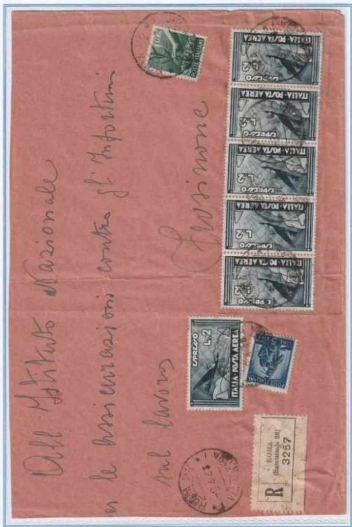
08/04/1946 - Lettera 2 porti raccomandata tariffa 18 L. (8 L. di 2 porti di lettera e 10 L. di raccomandazione) da Roma a Frosinone. Non comune l'uso multiplo del valore espresso aereo.