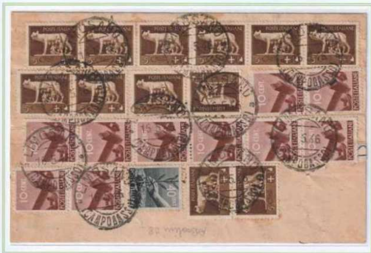
16/05/1946 - Lettera sindacati tariffa 2 L. da Limosano a Taranto.