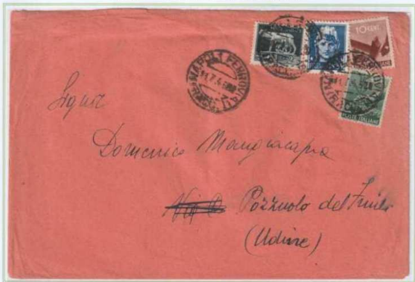
11/07/1946 - Lettera semplice tariffa 4 l. da Napoli a Pozzuolo del Friuli, i francobolli imperiale fuori uso dal 1° luglio 1946 affrancano questa lettera nel periodo di tolleranza che durerà per tutto il mese di luglio.