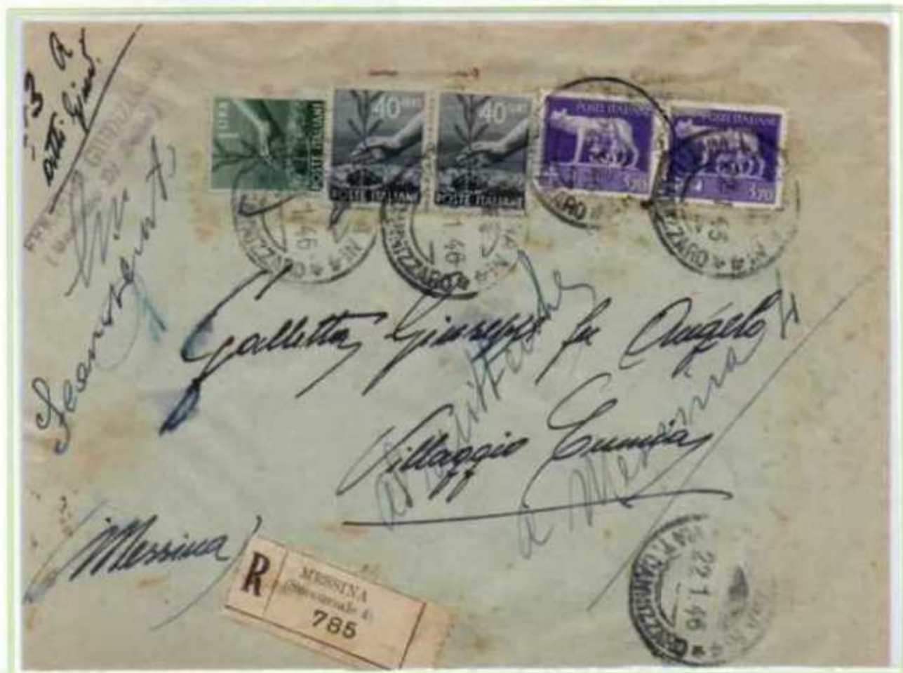
22/01/1946 - Manoscritto raccomandato atti giudiziari tariffa 9,20 l. (2,40 l. di manoscritto, 2,40 l. raccomandazione aperta, 2 l. avviso di ricevimento e 2,40 l. di raccomandazione dell'avviso di ricevimento) da Messina a Villaggio Cumia.