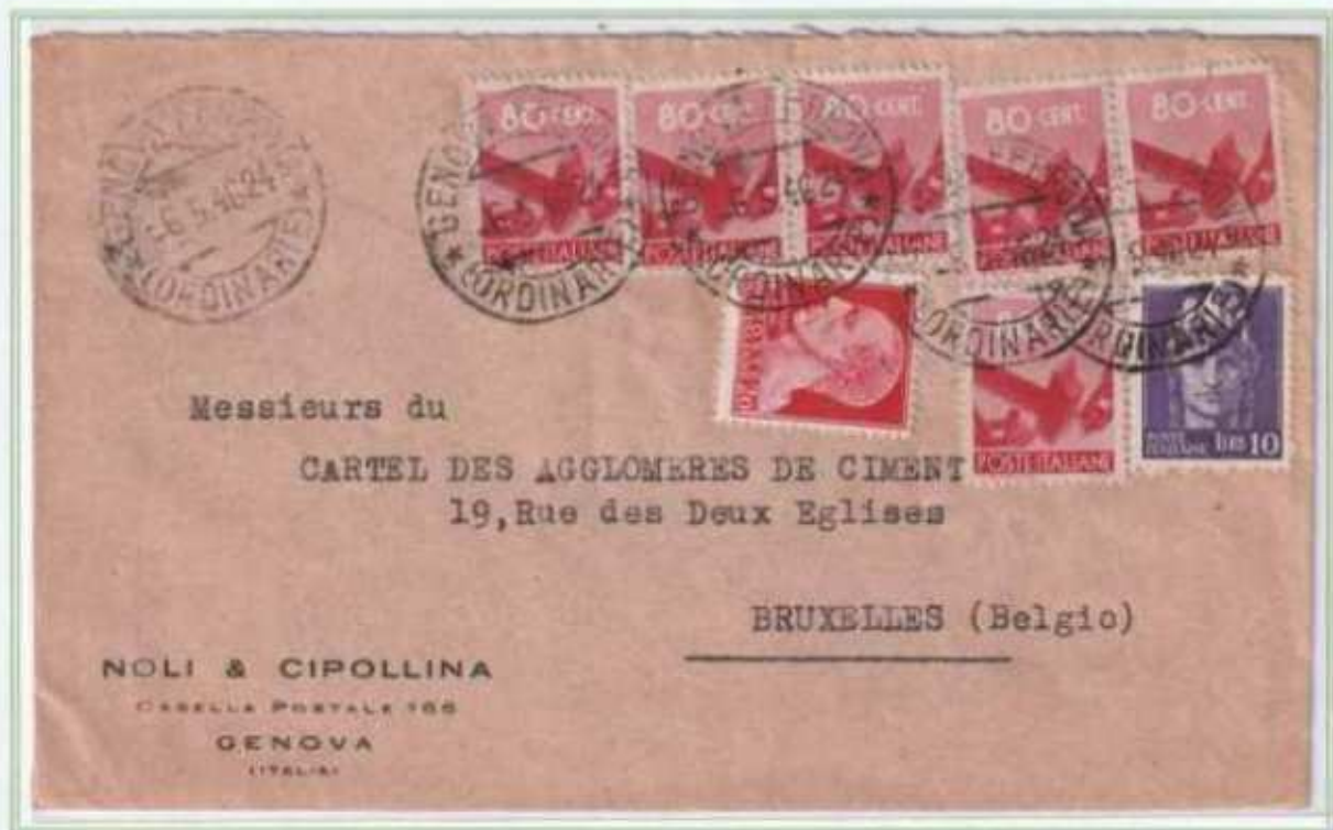
06/05/1946 - Lettera estero tariffa 15 l. da Genova a Bruxelles (Belgio), il 10 l. luogotenenza emissione di Novara concorre a completare l'affrancatura insieme ai valori imperiale e democratica.