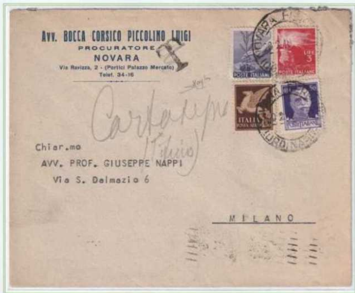
20/02/1948 - Lettera semplice tariffa 10 L. da Novara a Milano. La lettera affrancata anche da un 50 c. imperiale fuori corso da 20 mesi fu inizialmente tassata e successivamente detassata. (e)