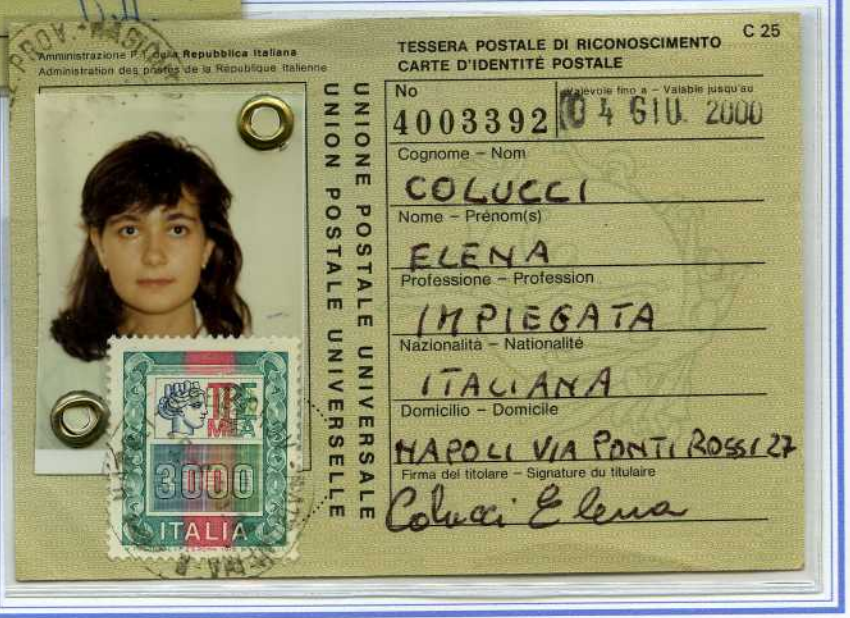
Tassa £.3.000 - Tessera tipo VIII° - da Napoli (Vaglia-Risparmi) del 5.6.1995 affrancata con £.3.000 isolato Alti Valori