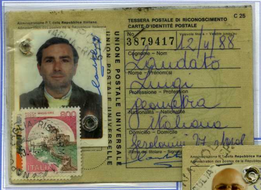
Tassa £.1500 - 1.6.1984 - 15.11.1985 in uso per 1 anno e 5 mesi