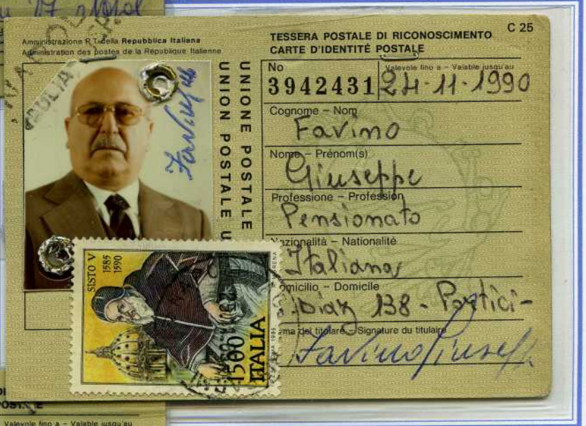
Tassa £.2.000 - 16.11.1985 - 31.5.1995 in uso per 8 anni e 6 mesi