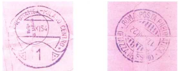
Sopra - Bolli di movimentazione esterni ai telegrammi di Milano e Roma