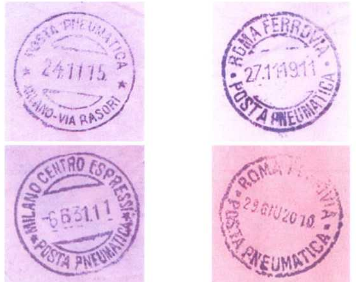
Sopra - Bolli di movimentazione espressi di Milano e Roma