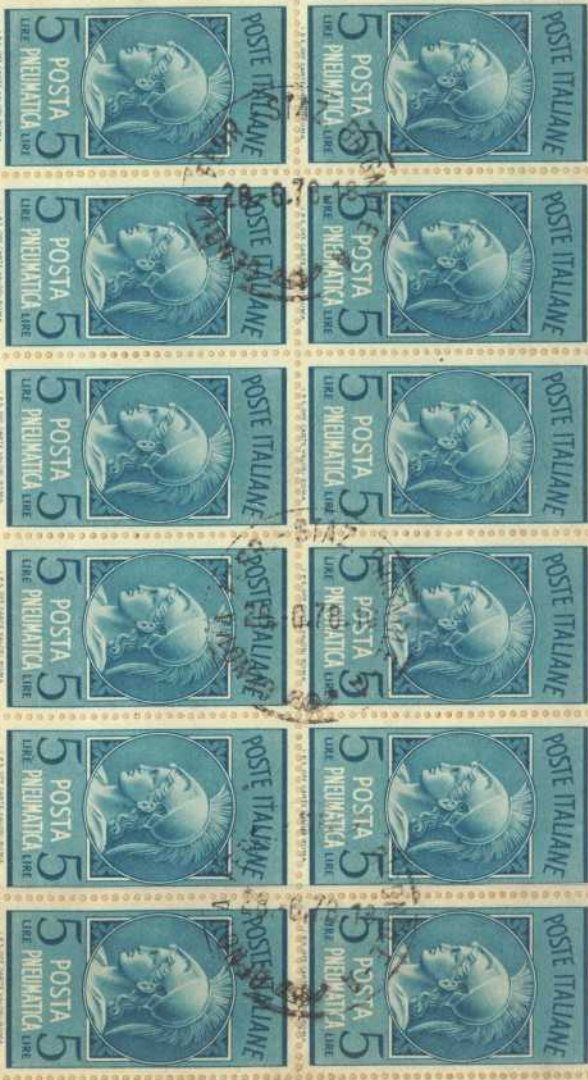
Busta spedita il 28 Giugno 1978 da Genova Ferr. Staz. Brignole e diretta ad Agliano d'Asti affrancata con 34 valori del L.5 Posta Pneumatica per un totale di L.170 in perfetta tariffa. Nessun timbro di arrivo sul retro della busta.