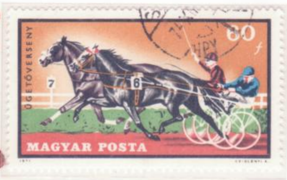
GARA DI TROTTO