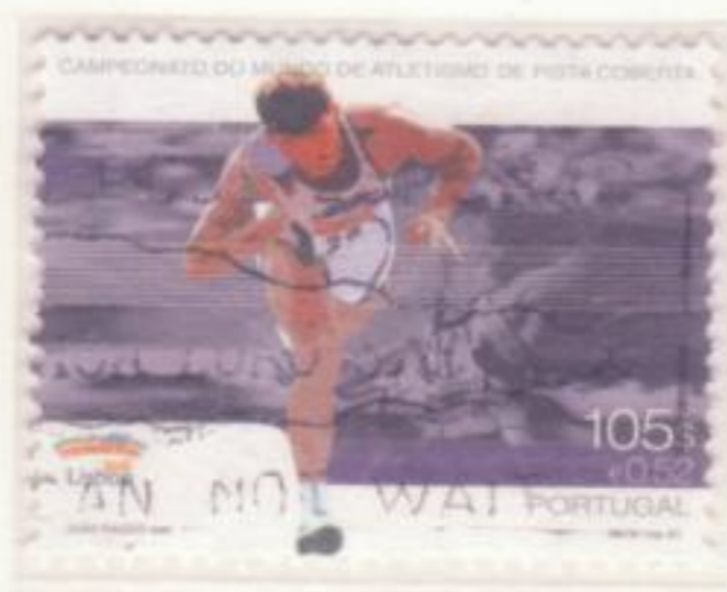
GETTO DEL PESO