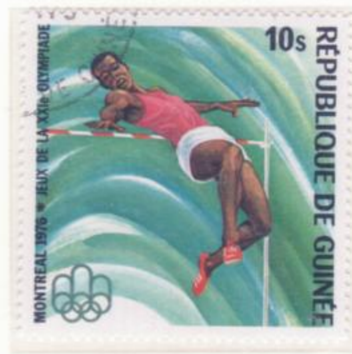
SALTO IN ALTO