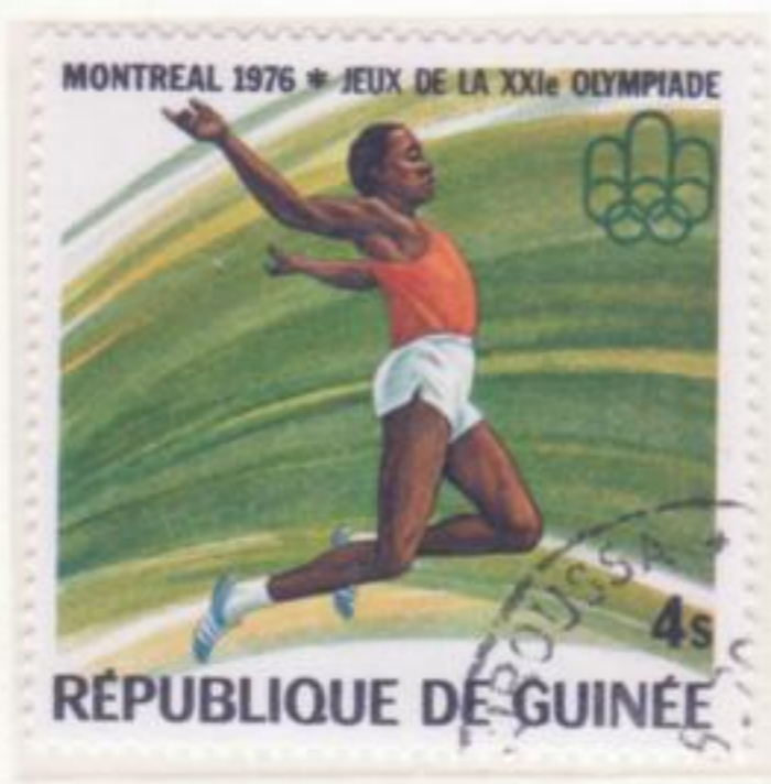
SALTO IN LUNGO