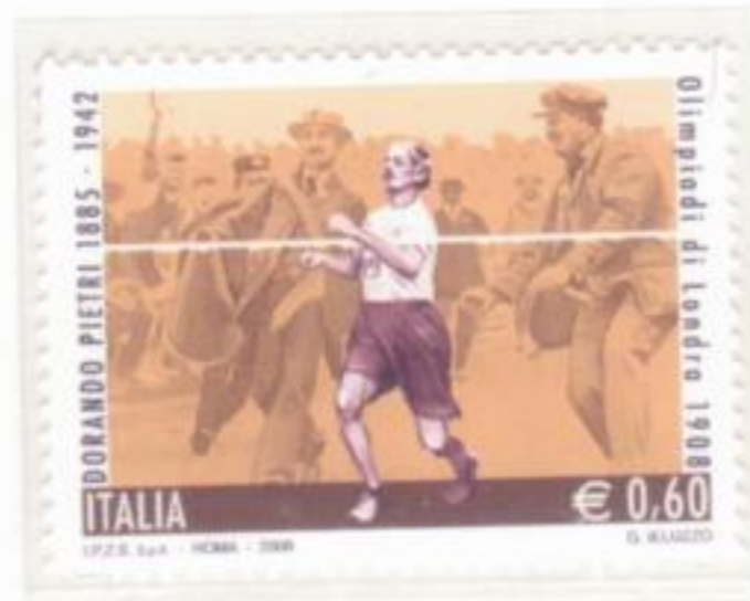
LA VITTORIA SFORTUNATA DI DORANDO PETRI