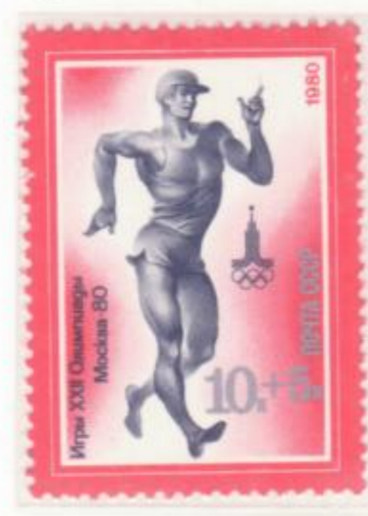
GARA DI MARCIA