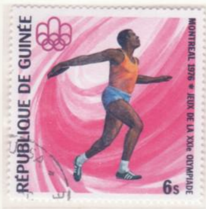
LANCIO DEL DISCO