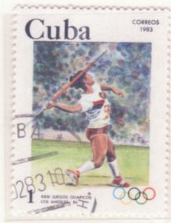
TIRO DEL GIAVELLOTTO