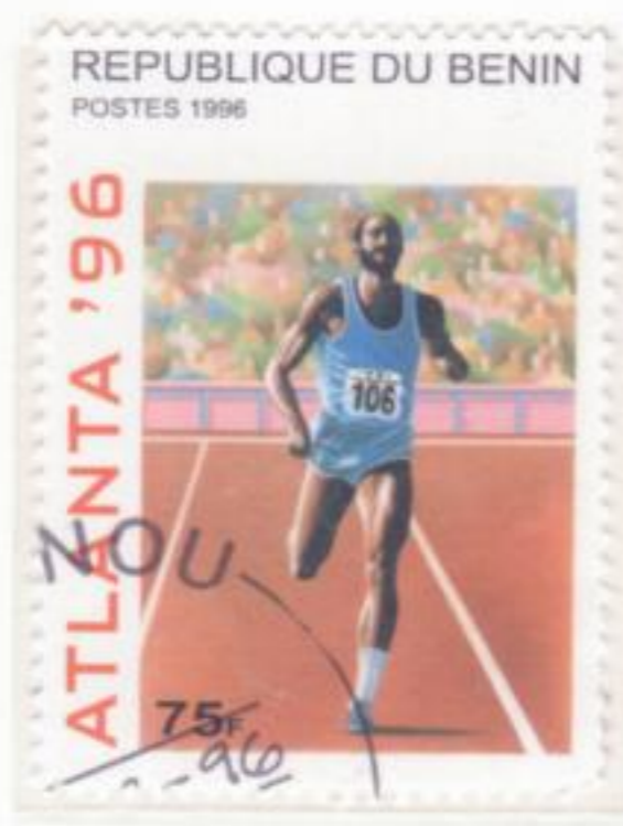
GARA DI MEZZOFONDO