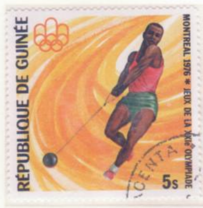
LANCIO DEL MARTELLO