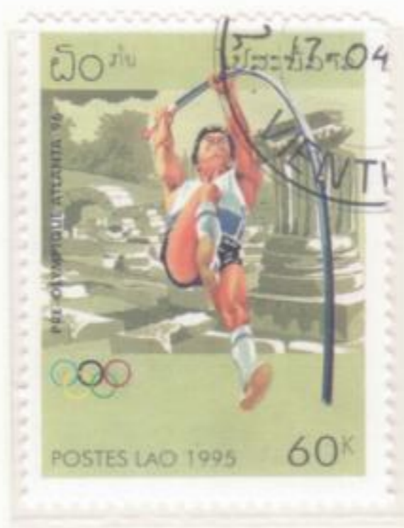
SALTO CON L' ASTA