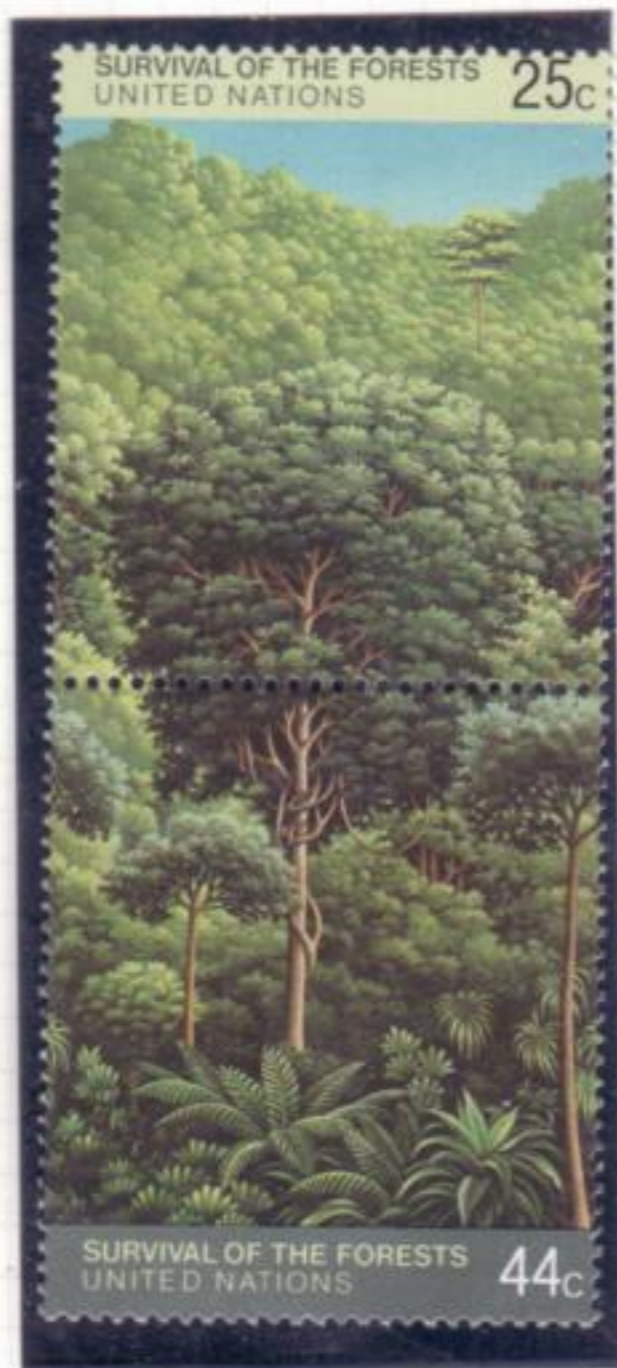
1. Foresta tropicale