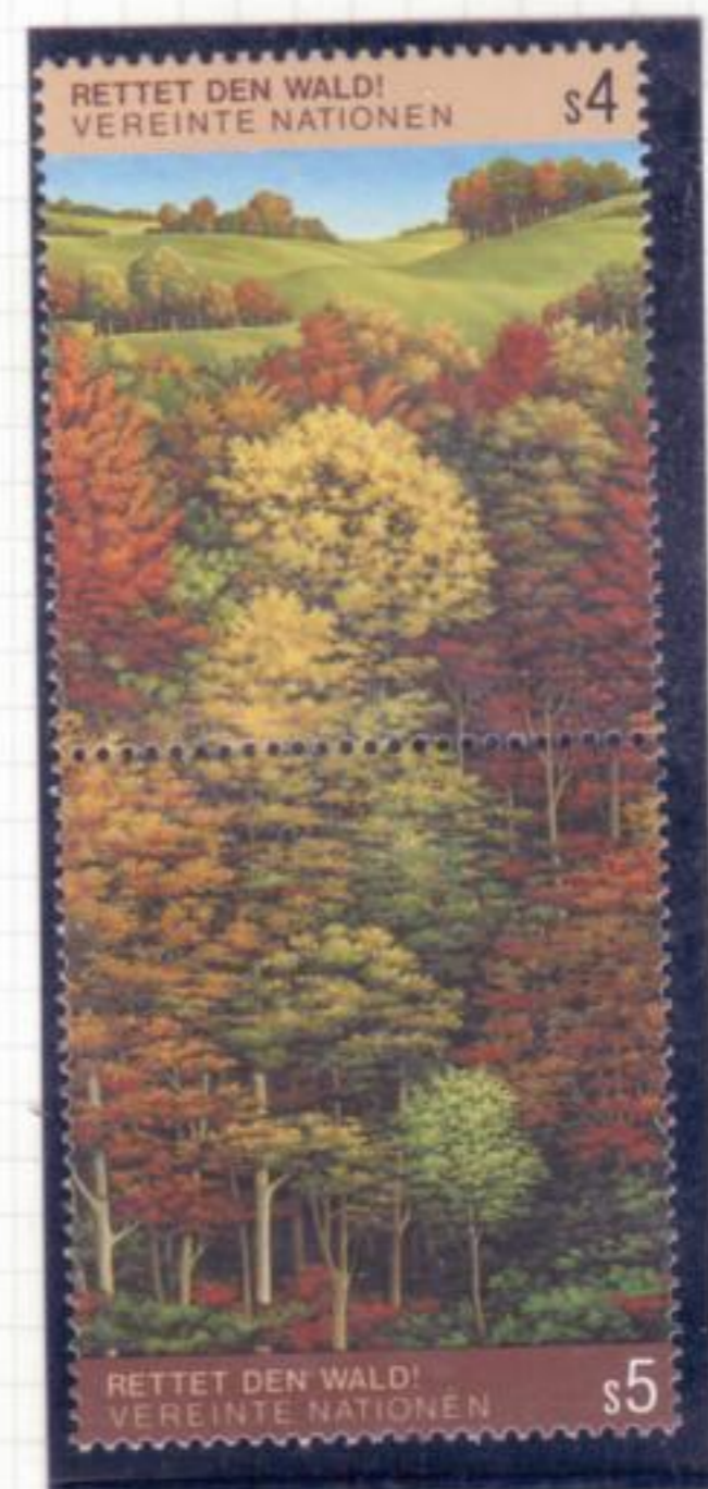
3. Bosco di latifoglie in abito autunnale.