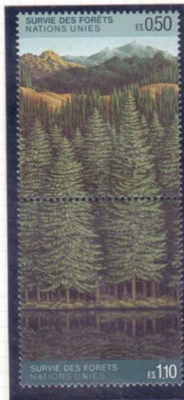
2. Bosco di conifere con lago alpino.