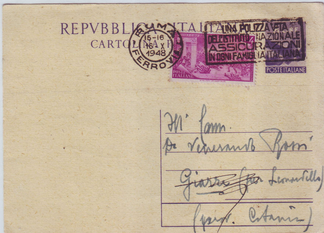
Cartolina postale da £. 8 del 16/10/'48 con francobollo aggiunto £. 4.

Il francobollo da £. 4 ricorda la giornata dell'8 Febbraio 1848 a Padova, quando popolo e studenti, con spontanea ribellione, mostrarono quanto nel silenzio avessero coltivato l'ideale supremo della patria comune.