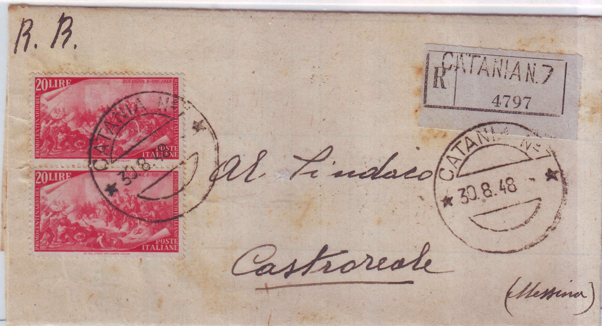
Stampa raccomandata del 30/8/'48 da Catania a Castoreale, affrancata con coppia da £. 20.

Il francobollo da £. 20 ricorda il fatto d'armi dell'8 Agosto 1848 della montagnola (oggi giardini pubblici) di Bologna in seguito a cui gli Austriaci furono sanguinosamente e furiosamente cacciati da questa città.