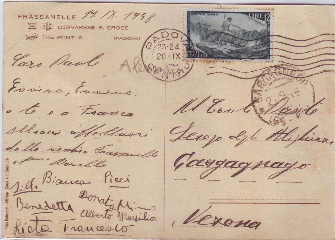
Cartolina da Padova a Gargagnago del 20/9/'49 affrancata con £. 12.

Il francobollo da £. 12 ricorda l'eroismo dell'Artigliere Gaspari nella Battaglia di Curtatone (29 maggio 1848), durante la Prima Guerra d'Indipendenza.