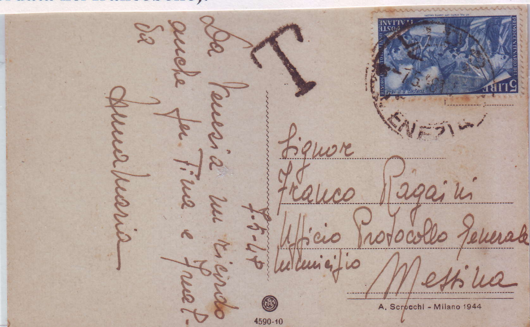
Cartolina illustrata da Venezia a Messina del 7/5/'48 affrancata con £. 5.

Il francobollo da £. 5 mostra l'esultanza dei Torinesi per la concessione dello Statuto emanato da Carlo Alberto il 4 marzo 1848, ma che aveva già promesso l'8 Febbraio (la data ricordata nel francobollo).