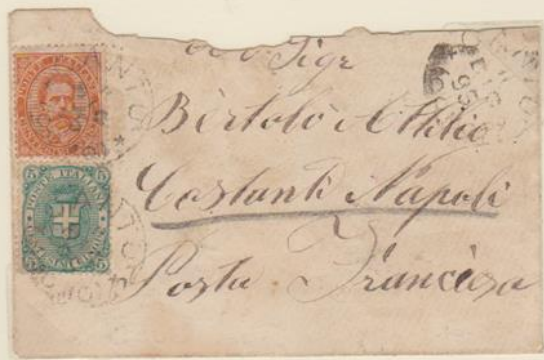
Lettera affrancata per 25c., spedita da Cantù per Costantinopoli l'11 dicembre 1895.