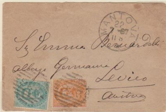
Lettera affrancata per 25c., spedita il 22 luglio 1887 da Mantova per Levice