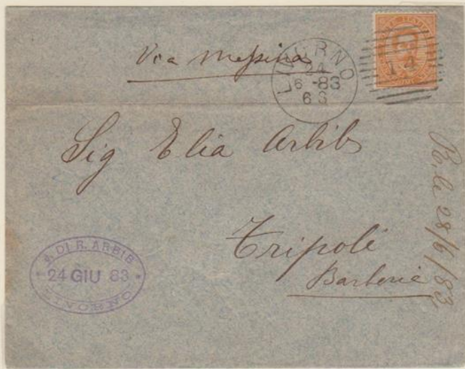
Lettera affrancata per 20c., spedita il 24 giugno 1883 da Livorno, via Messina per Tripoli di Barberia (Libia)