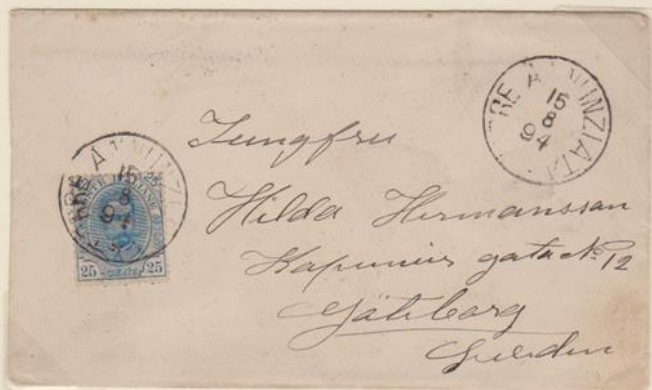
Lettera affrancata per 25c., spedita da Torre Annunziata per Goteborg il 15 agosto 1894.