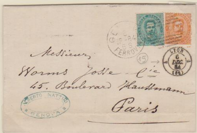
Lettera affrancata per 25c., spedita il 5 dicembre 1884 da Genova, via Lione per Parigi