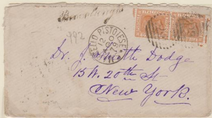
Lettera affrancata per 40c., spedita da S. Marcello Pistoiese per New York.