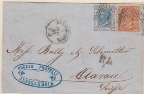
Lettera affrancata per 30c., spedita il 7 novembre 1867 da Alessandria per Aarau