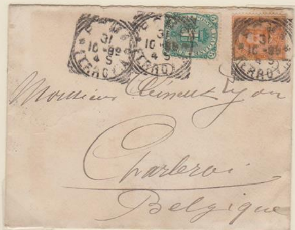
Lettera affrancata per 25c., spedita il 31 ottobre 1888 da Roma per Charleroi (Belgio)