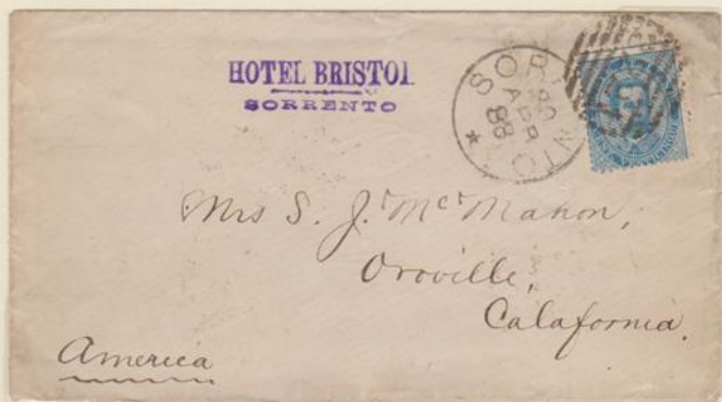
Lettera affrancata per 25c., spedita da Sorrento per Oroville (California) il 30 aprile 1888.