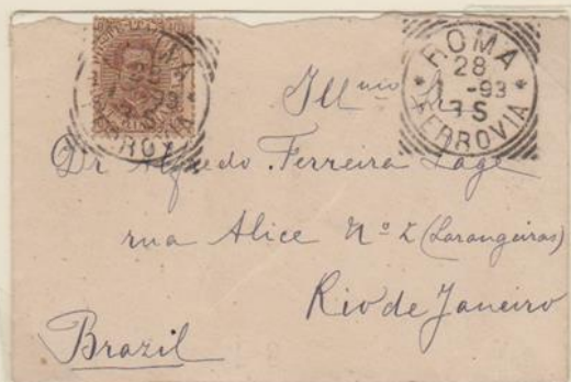
Lettera affrancata per 40c., spedita il 28 gennaio 1893 da Roma per Rio de Janeiro (Brasile)