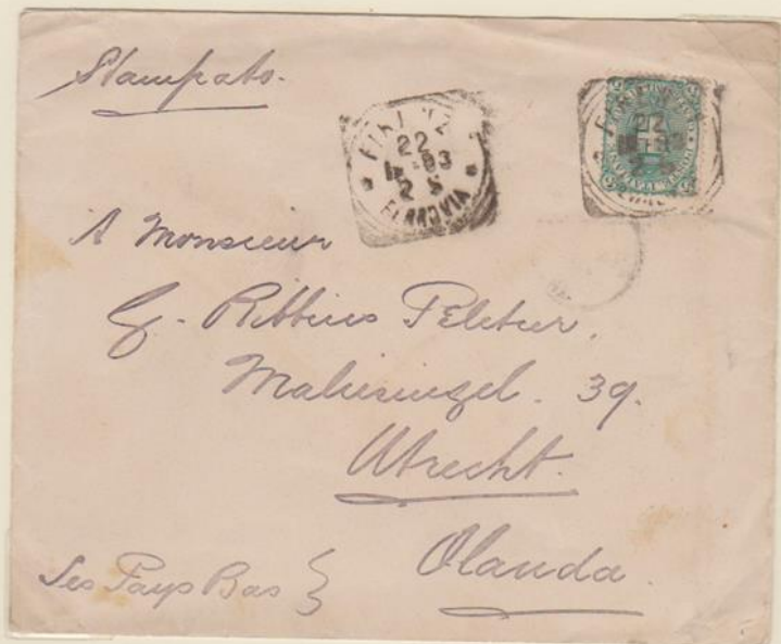
Lettera affrancata per 5c. in tariffa per stampati, spedita nel 1893 da Firenze per Utrecht.