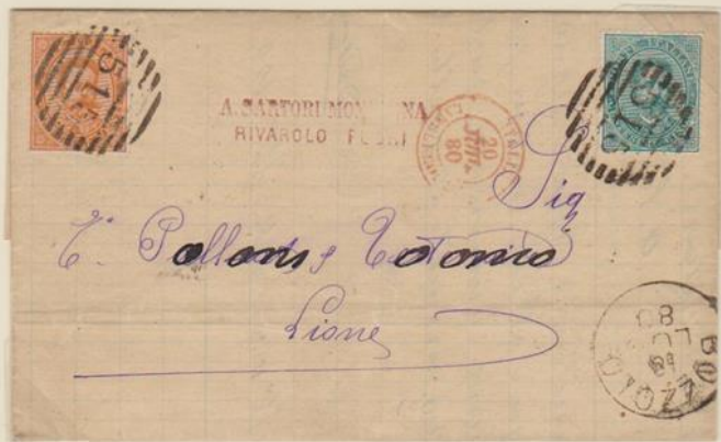
Lettera affrancata per 25c., spedita il 18 luglio 1880 da Bozzolo, via Lanslebourg per Lione.