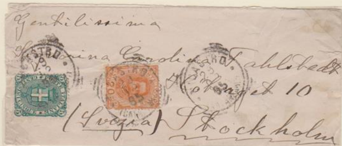
Lettera affrancata per 25c., spedita da Nicastro per Stoccolma il 29 dicembre 1895