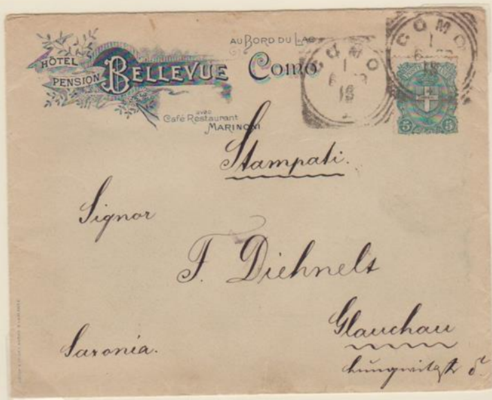
Lettera affrancata per 5c. in tariffa per stampati, spedita nel 1899 da Como per Glauchau (Sassonia-Germania)