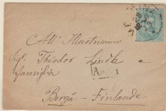
Lettera affrancata per 20c. diretta a Borgå (città della Finlandia conosciuta con il nome Porvoo)