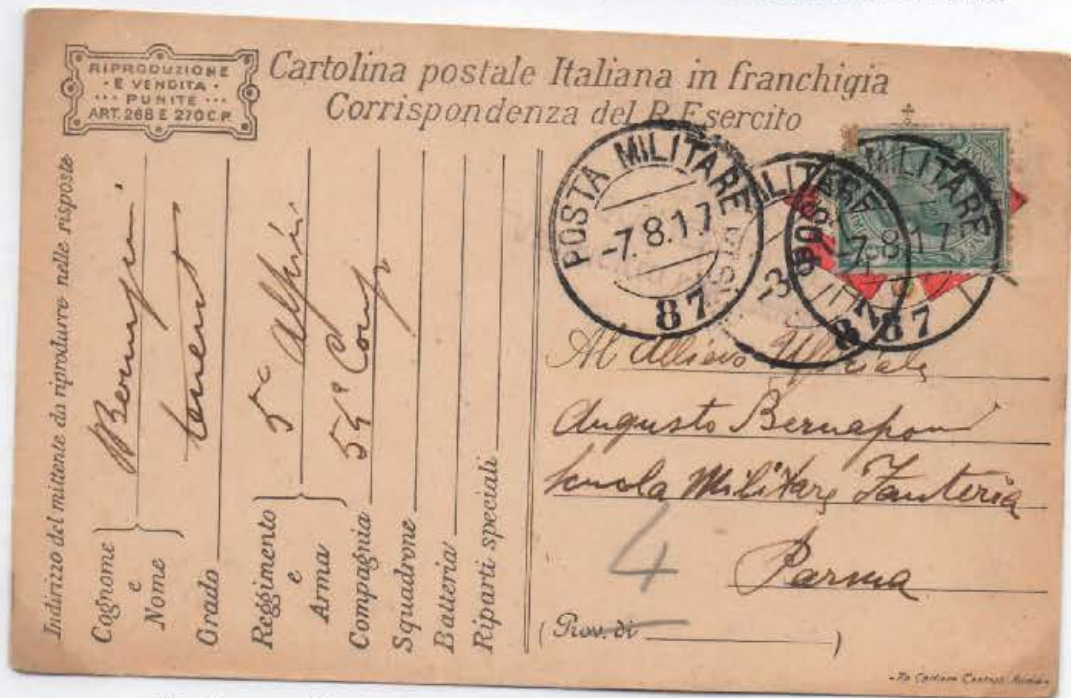
“Io ottimamente”, scrive in una di queste un tenente del 5° reggimento alpini