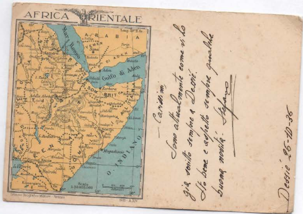
L'Africa Orientale italiana - Cartolina postale in franchigia per le Forze Armate