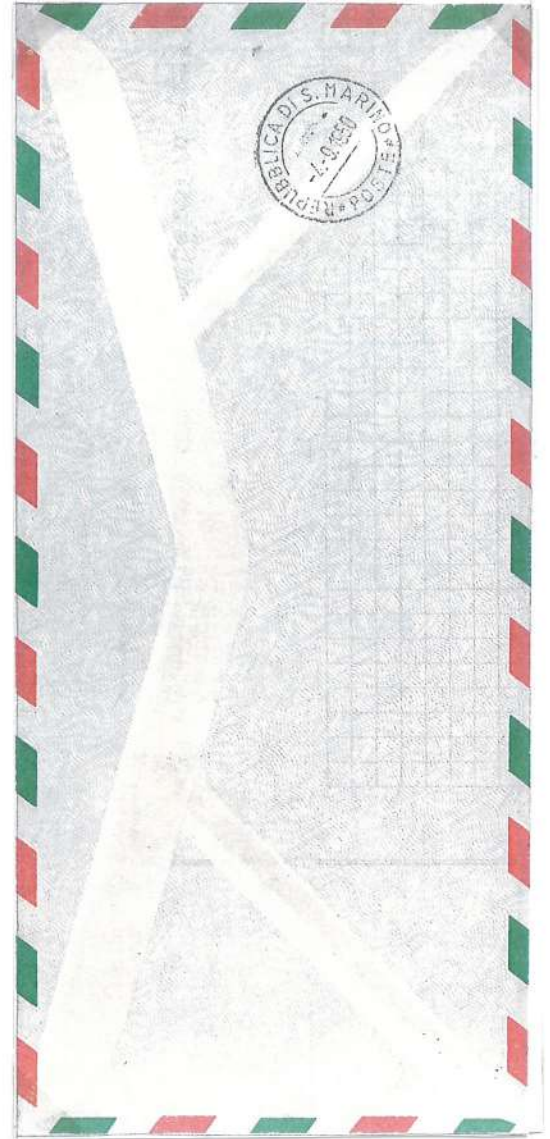
TRIESTE - SAN MARINO (Scalo Riccione) 04 Settembre 1950

Per ricordare degnamente il Trentesimo Anniversario della fondazione del Circolo Filatelico Triestino, venne indetta la "XIX Adunata Filatelica Triveneta" che si svolse in concomitanza della "Fiera di Trieste 1950".