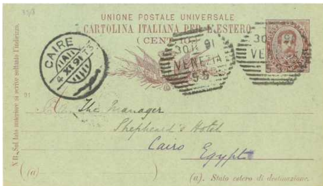
Mill. 91: 10.04.1891 – 31.12.1903

Bollo di transito di Paris etranger in data 6 febbraio. Al verso bollo di transito di Panama in data 20 febbraio.