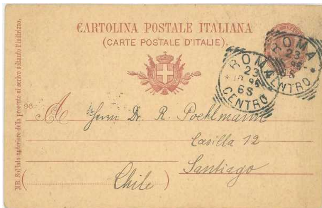
Mill. 96: 24.10.1896 – fine ad esaurimento

23 ottobre 1896 Da Roma per Santiago in Cile.