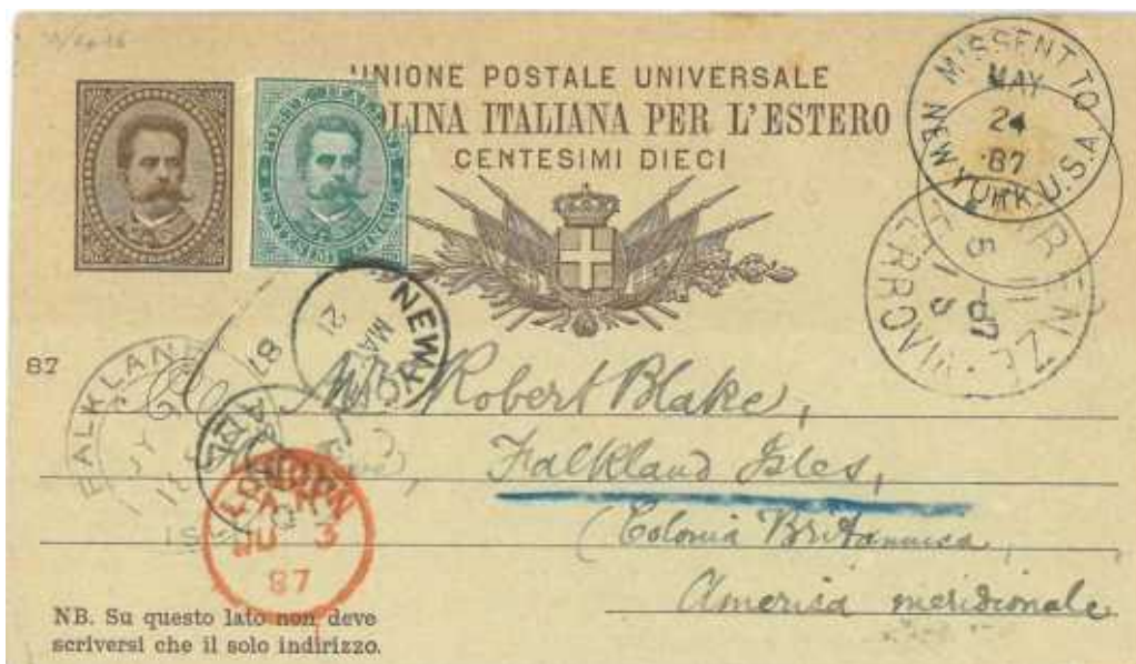
Mill. 87 25.05.1887 – 31.12.1903

Da Hong Kong, per la variazione di indirizzo del destinatario, viene reindirizzata a Kobe in Giappone dove arriva il 16 gennaio. Tassata per insufficiente francatura.