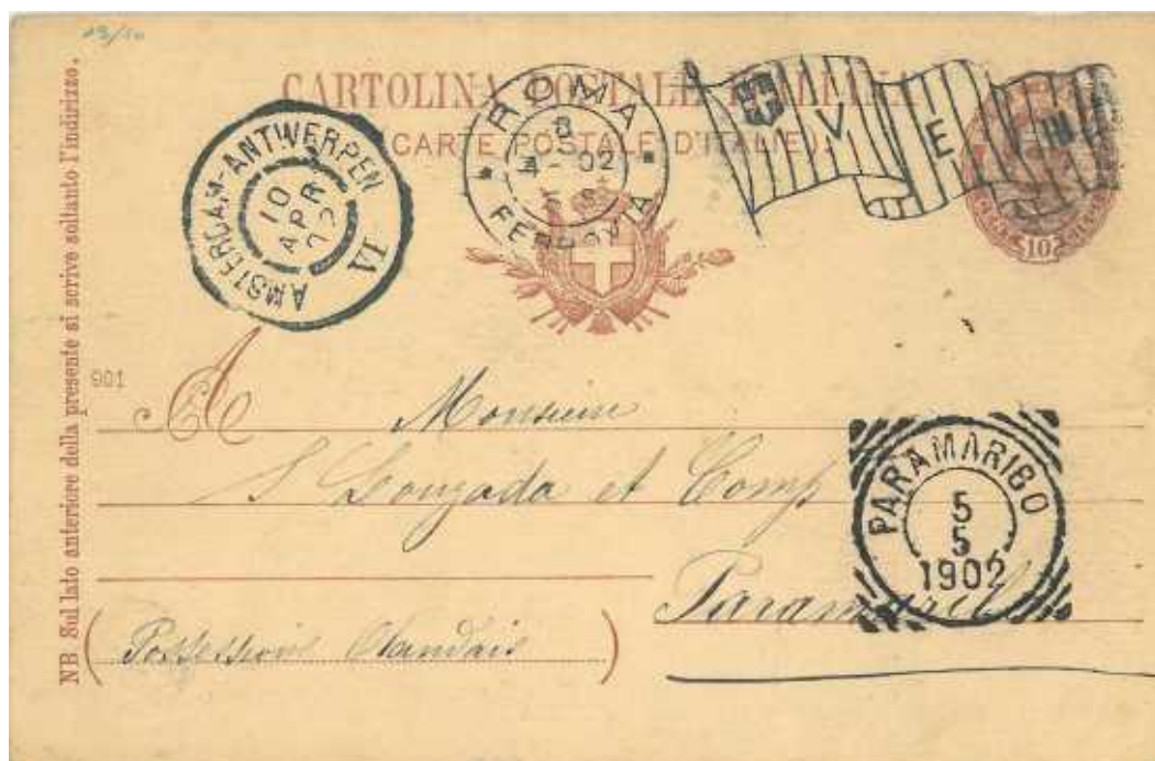
Mill. 901: 22.08.1901 – 31.12.1903

Lourenço Marques cambiò il suo nome in Maputo. E' l'attuale capitale del Mozambico. Fondata all'inizio del XVIII secolo, la città ricevette il nome di Lourenço Marques, il commerciante portoghese che esplorò la baia nel 1544. Bollo di transito di Lisbona.