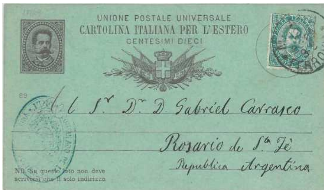
Mill. 88: 26.10.1888 – 31.12.1903 Colore turchese.

12 marzo 1889 Da Forlì a Rosario in Argentina.