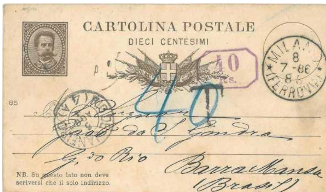
Mill. 85 20.02.1885 – 31.12.1903

Arrivo a Brest in Francia il 16 settembre. Il giorno dopo, la cartolina postale, per la variazione dell'indirizzo del destinatario, viene reindirizzata per Saigon in Cochinchine (attuale Vietnam) dove arriva il 23 ottobre. Il 24 ottobre risultano due nuovi bolli di "Saigon-Port" "Cochinchine". Al momento del rinvio dalla Francia la cartolina doveva essere integrata con 5 cent. in quanto inviata in un Paese rientrante nella tariffa "B".