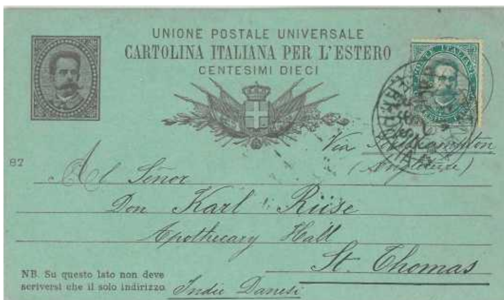
Mill. 87 25.05.1887 – 31.12.1903 Colore turchese.

1 ottobre 1888 Da Roma a St. Thomas nelle Antille Danesi, possedimento della Compagnia danese delle indie occidentali, odierne Isole Vergini americane, Stati Uniti di America.