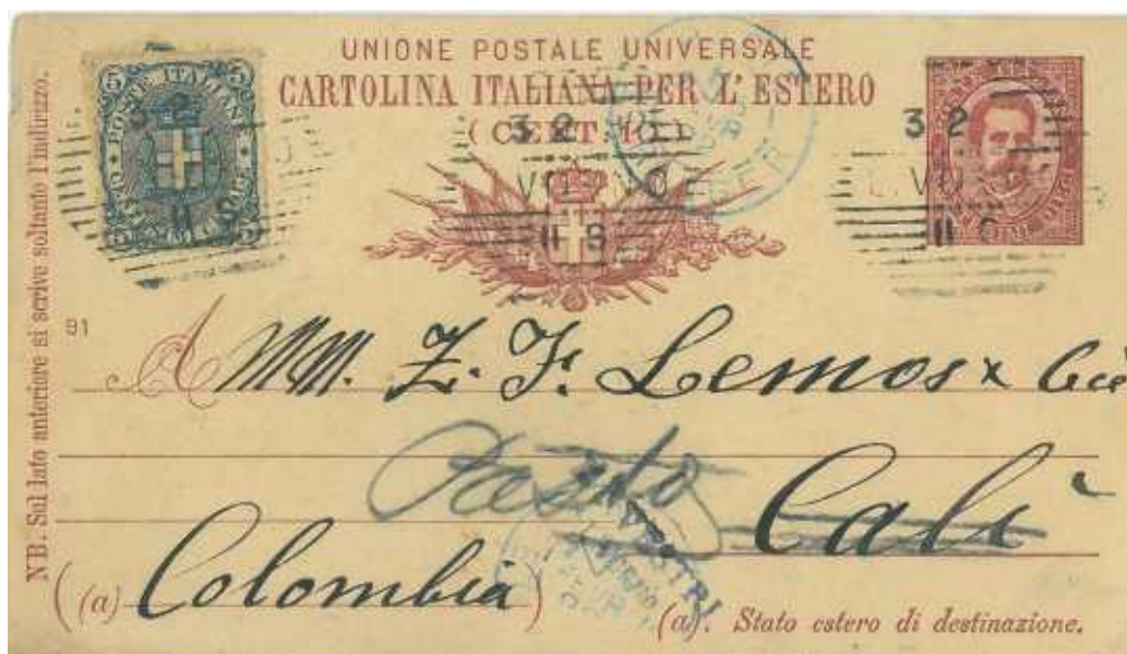
Mill. 91: 10.04.1891 – 31.12.1903

3 febbraio 1892 Da Livorno a Cali in Colombia.