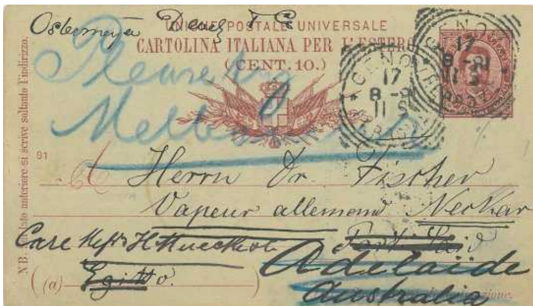
Mill. 91: 10.04.1891 – 31.12.1903

17 agosto 1891 Da Genova a Porto Said in Egitto e poi a Melbourne in Australia. Tariffa: 10 cent. /15 cent.