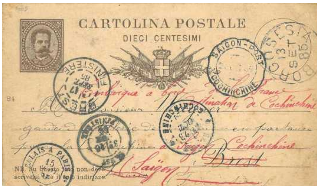
Mill. 86: 15.08.1884 – 31.12.1903

13 settembre 1885 Da Borgosesia a Brest in Francia e Saigon odierno Vietnam. Tariffa: 10 cent. /15 cent.