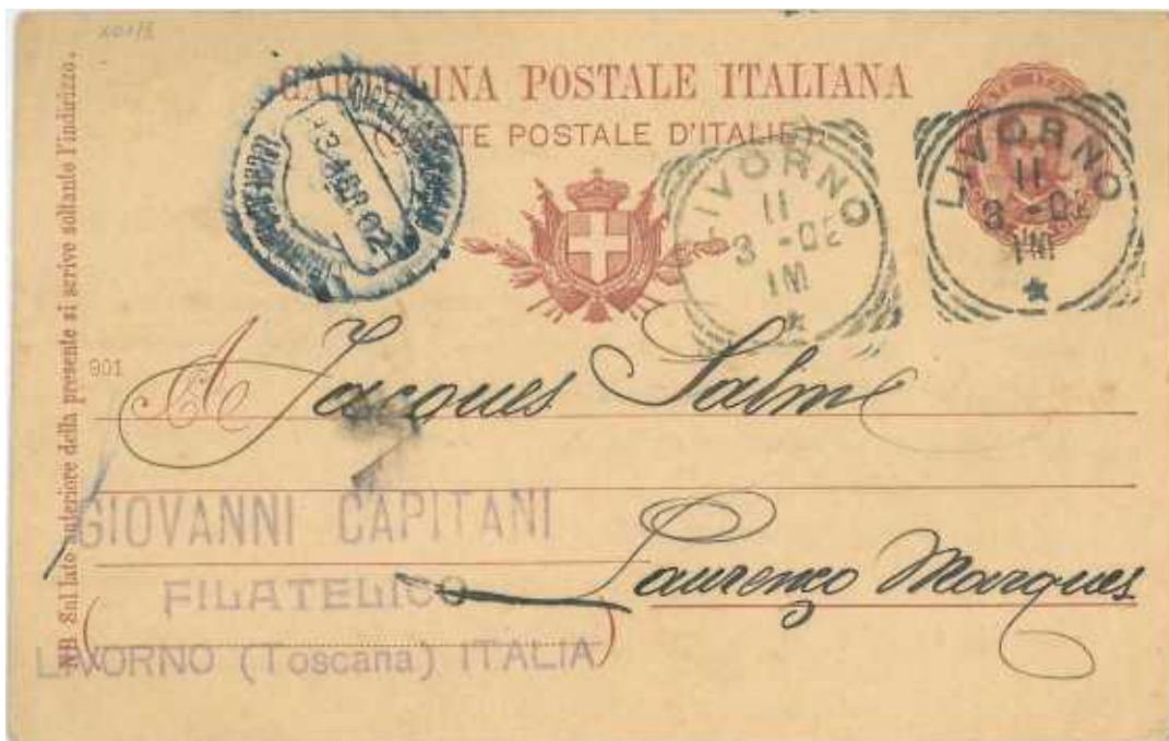
Mill. 901: 22.08.1901 – 31.12.1903

11 marzo 1902 Da Livorno a Lourenço Marques odierno Mozambico Tariffa: 10 cent.