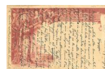
Mill. 96: 24.10.1896 – fine ad esaurimento

9 marzo 1897 Da Misimeri per Alessandria in Egitto.