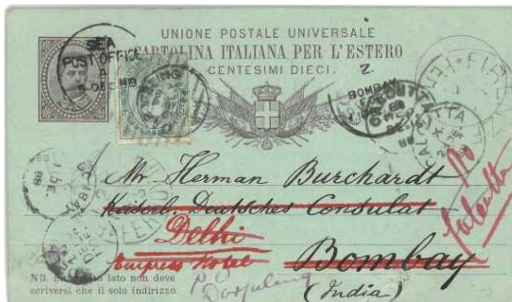
Mill. 88: 26.10.1888 – 31.12.1903 Colore turchese.

21 novembre 1888 Da Firenze a Bombay in India.