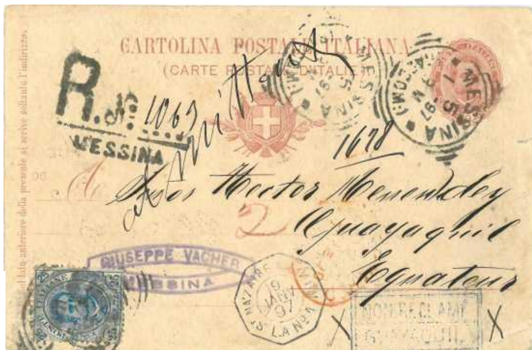
Mill. 96: 24.10.1896 – fine ad esaurimento

5 gennaio 1897 Da Messina per Guayaquil in Ecuador.