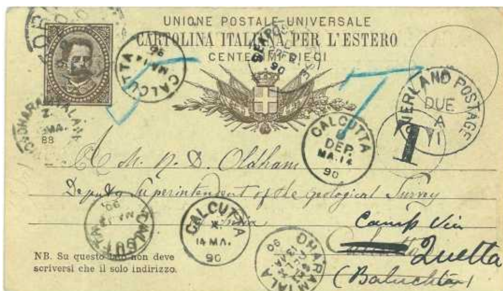
Mill. 88: 26.10.1888 – 31.12.1903

20 febbraio 1890 Da Torino a Calcutta in India e Quetta in Pakistan.