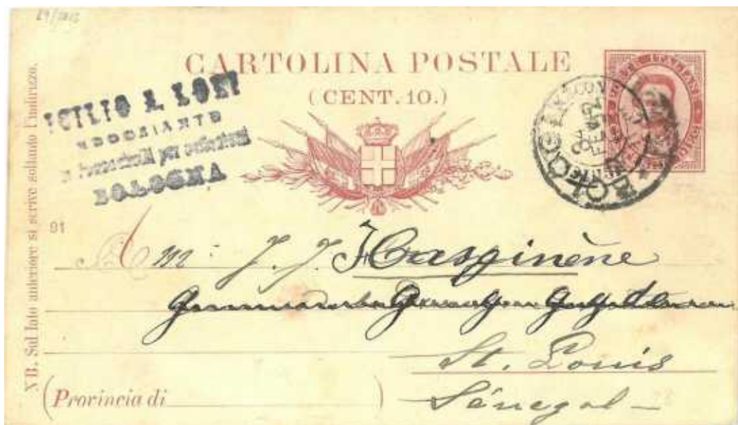
Mill. 91: 11.03.1891 – 31.12.1903

3 febbraio 1892 Da Bologna a St. Louis in Senegal.