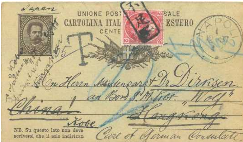
Mill. 86 29.06.1886 – 31.12.1903

1 dicembre 1887 Da Napoli a Hong Kong e Giappone.