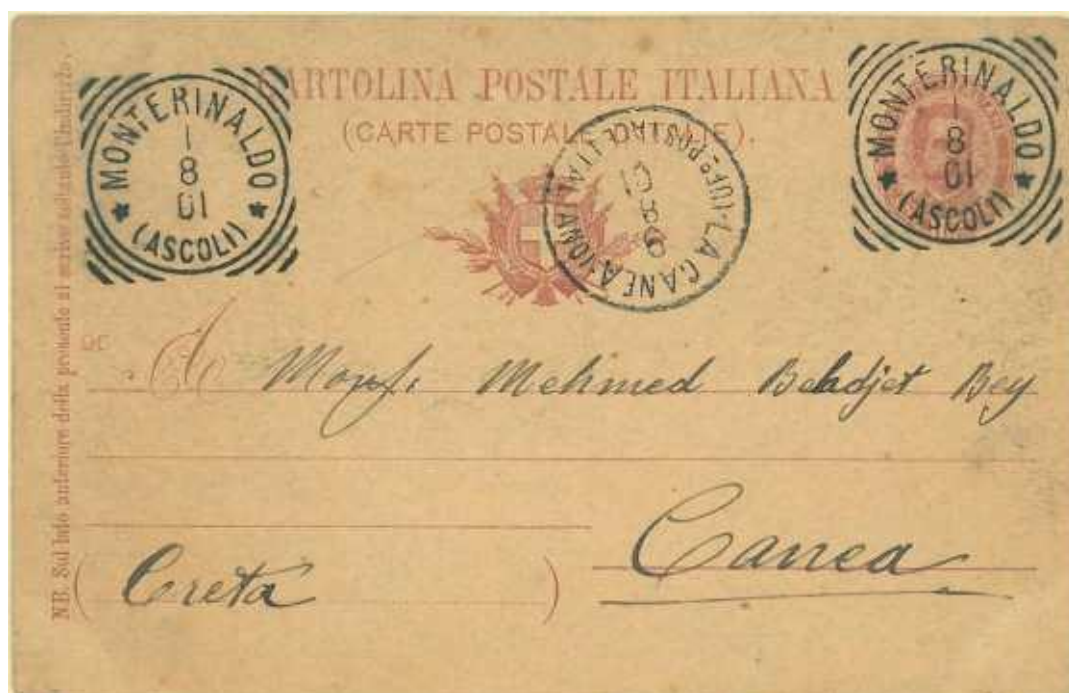
Mill. 96: 24.10.1896 – fine ad esaurimento

6 aprile 1893 Da Monterinaldo per La Canea in Grecia.