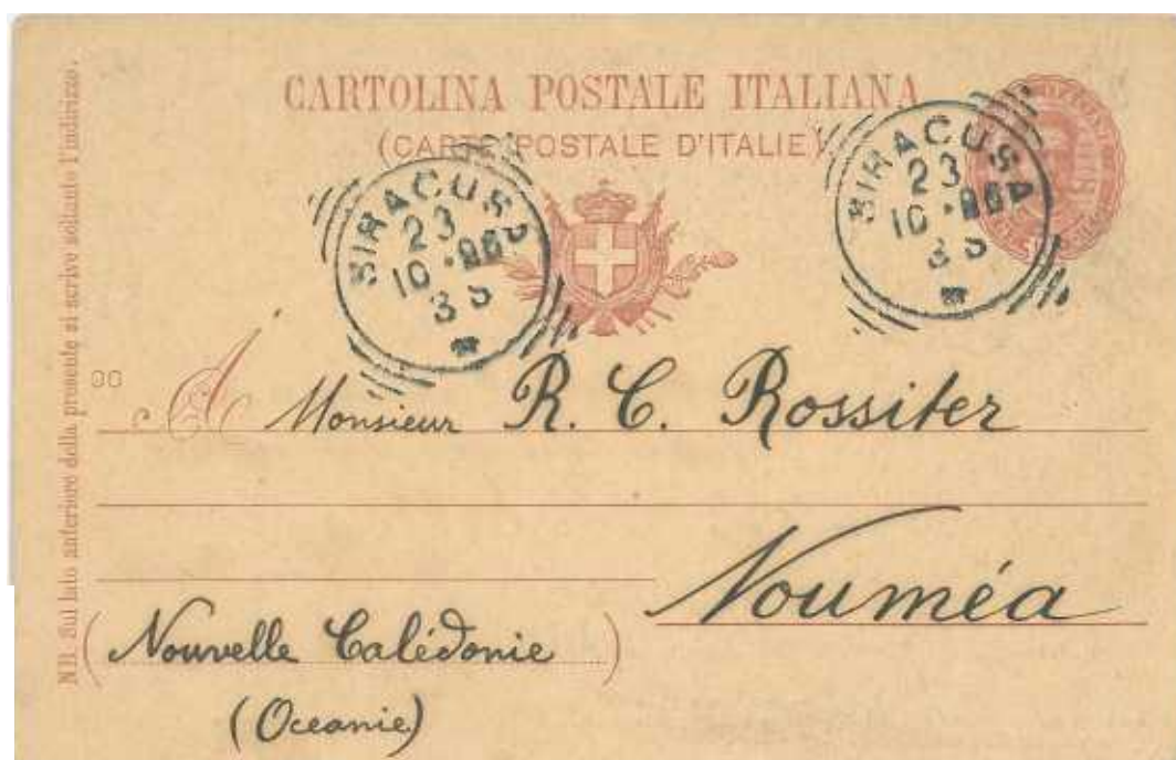
Mill. 96: 24.10.1896 – fine ad esaurimento

Usata il giorno antecedente l'emissione ufficiale.