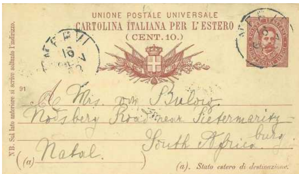
Mill. 91: 10.04.1891 – 31.12.1903

Da evidenziare che la cartolina ha viaggiato con tariffa da 10 cent., ma visto l'inoltro per Australia, doveva essere affrancata con ulteriori 5 cent.