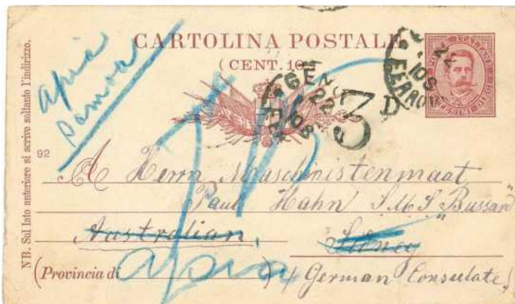
Mill. 92: 17.03.1892 – 31.12.1903

Bollo di transito di Montcenis a Macon e, al verso, bollo di arrivo in data 14 febbraio. In difetto di tariffa.